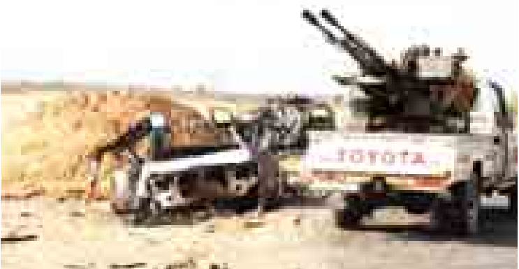
အစိုးရနှင့် စစ်သွေးကြွများအကြား တိုက်ခိုက်မှုများဖြစ်ပွားနေသည့် လစ်ဗျားနိုင်ငံ ဘင်ဂါဇီမြို့၌ စစ်သွေးကြွများအား တွေ့ရစဉ်။

ဝါရှင်တန် အောက်တိုဘာ ၁၉ လစ်ဗျားနိုင်ငံ၌ ဖြစ်ပွားနေသည့် လက်နက်ကိုင်တိုက်ခိုက်မှုများအား ချက်ချင်း ရပ်ဆိုင်းရန် အမေရိကန်နှင့် ၎င်း၏ မဟာမိတ်ဥရောပလေးနိုင်ငံဖြစ်သည့် ဗြိတိန်၊ ပြင်သစ်၊ ဂျာမနီနှင့် အီတလီနိုင်ငံတို့က တိုက် တွန်းကြောင်း ယနေ့ဘီဘီစီ သတင်းတွင် ဖော်ပြသည်။ လစ်ဗျားနိုင်ငံ၌ လက်ရှိကြုံတွေ့နေရသော အကျပ်အတည်းကို စစ်ရေးနည်းလမ်းဖြင့် ဖြေရှင်း၍မရကြောင်း အဆိုပါနိုင်ငံများ၏ ထုတ်ပြန်ချက်တွင် ဖော်ပြသည်။ လစ်ဗျားနိုင်ငံအရှေ့ပိုင်း ဘင်ဂါဇီမြို့တွင် လစ်ဗျားအစိုးရတပ်ဖွဲ့များနှင့် စစ်သွေးကြွ သူပုန်အဖွဲ့များ တိုက်ခိုက်မှုကြောင့် မကြာ သေးမီကပင် ပြည်သူဒါဇင်များစွာ သေဆုံး ခဲ့ရသည်။ ၂၀၁၁ ခုနှစ်တွင် လစ်ဗျားခေါင်းဆောင် ဗိုလ်မှူးကြီး မွမ်မာကဒါဖီအား ရာထူးမှ ဖယ်ရှားခဲ့ပြီးကတည်းကပင် လစ်ဗျားနိုင်ငံမှာ တည်ငြိမ်မှုကင်းမဲ့နေသည်။ လစ်ဗျားနိုင်ငံ၌ အကြိမ်အနယ်တိုက်ခိုက် မှုများ မြင့်တက်လာပါက ၎င်းနိုင်ငံသည် လစ်ဗျားနှင့် နိုင်ငံတကာ အကြမ်းဖက် အုပ်စုများအတွက် လုံခြုံစိတ်ချရသော ကွန်းခို ရာအဖြစ် ဆက်လက်တည်ရှိနေမည်ဟု ၎င်း ကြေညာချက် တွင်ဖော်ပြသည်။ အငြိမ်းစားလစ်ဗျားဗိုလ်ချုပ်ကြီး ခါလီဖာ တက်မီတာက အောက်တိုဘာ ၁၅ ရက်တွင် အစ္စလာမစ်သူပုန် တပ်ဖွဲ့များအား တိုက်ခိုက် မှု စတင်ပြုလုပ်ခဲ့ပြီးနောက်တွင် အနောက် အုပ်စုက ၎င်းတို့၏ စိုးရိမ်ပူပန်မှုကို ဖော်ပြခဲ့ ခြင်းဖြစ်သည်။ ဘီဘီစီ။