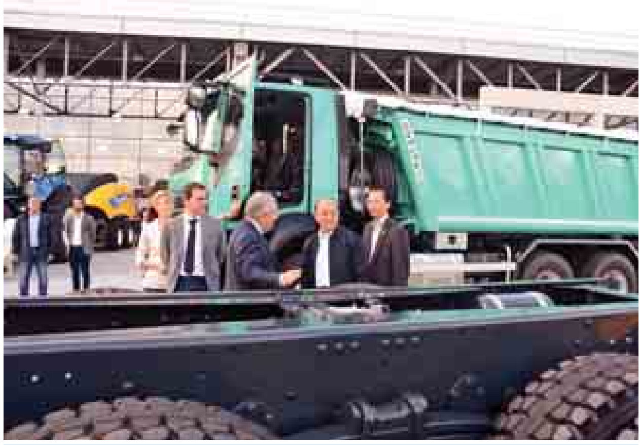
နိုင်ငံတော်သမ္မတ ဦးသိန်းစိန် CNH စက်မှုလုပ်ငန်းစုတွင် ကြည့်ရှုလေ့လာစဉ်။ (သတင်းစဉ်)

◆ နယ်စပ်ဒေသမှ ငွေစုငွေချေးလုပ်ငန်း၊ (ဂ)လူထု အခြေပြုအခြေခံအဆောက်အအုံ ဖွံ့ဖြိုးရေးလုပ်ငန်းများ၊ (ဃ)အိမ်ထောင်စု ဝင်ငွေတိုးလုပ်ငန်းများ၊ (င) သဘာဝ အရင်းအမြစ်ထိန်းသိမ်းရေးနှင့် စီမံ ခန့်ခွဲခြင်းကဏ္ဍ၊ (စ)စွမ်းဆောင်ရည် မြှင့်တင်ခြင်းနှင့် လူသားအရင်းအမြစ် ဖွံ့ဖြိုးရေးကဏ္ဍနှင့် (ဆ)ဂျင်ဒါနှင့် အမျိုးသမီးဖွံ့ဖြိုးမှုကဏ္ဍတို့ဖြစ်သည်။ အထက်ပါ အဓိကလုပ်ငန်းကြီး (၄)ရပ်ကို စီမံကိန်းဒေသများတွင် စီမံကိန်းနှစ်အလိုက် အကောင် အထည်ဖော်လျက်ရှိရာ ကျေးရွာလူထု အား စွမ်းဆောင်ရည်မြှင့်သင်တန်း ပေးခြင်း၊ ကိုယ့်အားကိုးကိုးအဖွဲ့များ ဖွဲ့စည်းထူထောင်ပေးခြင်းနှင့် ယင်း အဖွဲ့များမှ လည်ပတ်ဆောင်ရွက် လျက်ရှိသည့် ဝင်ငွေတိုးပွားရရှိရေး လုပ်ငန်းများအတွက် လိုအပ်သည့် မတည်ငွေအား ထည့်ဝင်ပေးခြင်းဖြင့် လူထုအခြေပြု ဒေသဖွံ့ဖြိုးရေး လုပ်ငန်းများအား ဒေသခံလူထု တက်ကြွစွာ ပါဝင်ဆောင်ရွက်လျက်ရှိ ကြောင်း သတင်းရရှိသည်။ (သတင်းစဉ်)