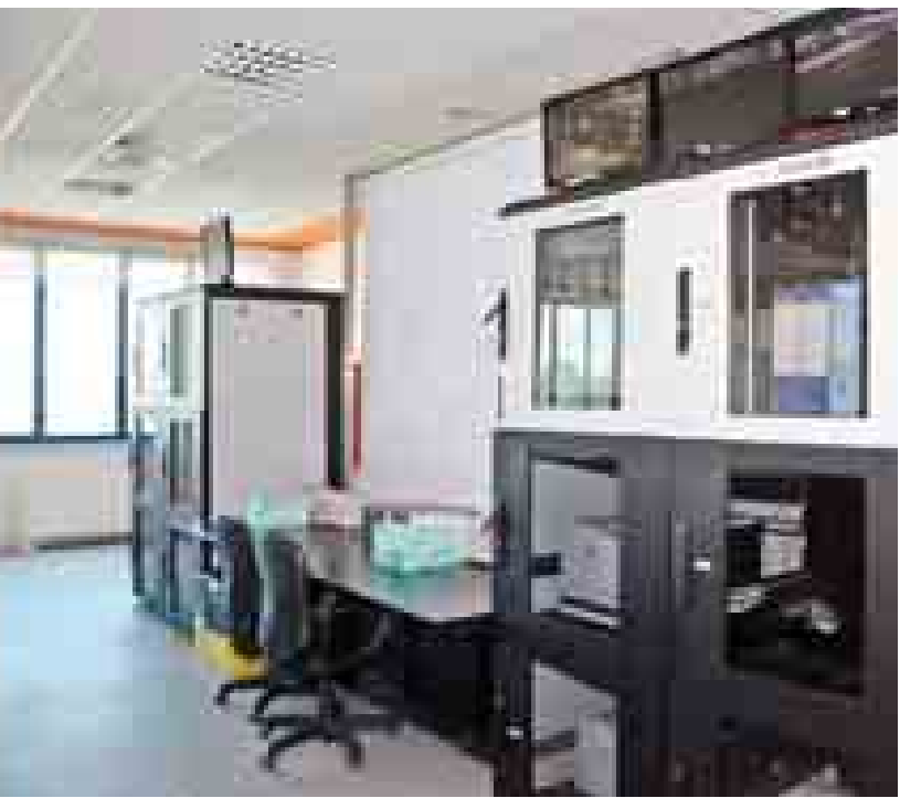
နိုင်ငံတော်သမ္မတ ဦးသိန်းစိန် လျှပ်စစ်ဓာတ်အားဖြန့်ဖြူးထုတ်လုပ် သည့် IREN ကုမ္ပဏီတွင် ကြည့်ရှုလေ့လာစဉ်။ (သတင်းစဉ်)