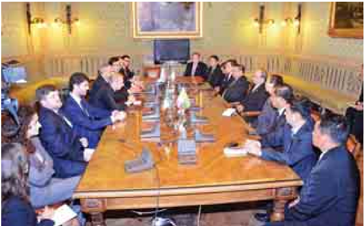
နိုင်ငံတော်သမ္မတ ဦးသိန်းစိန်နှင့် တူရင်မြို့ မြို့တော်ဝန် မစ္စတာ ပရိုဖီဖက်ဆီနိုတို့ တွေ့ဆုံဆွေးနွေးစဉ်။ (သတင်းစဉ်)

နိုင်ငံတော်သမ္မတသည် စက်ရုံများသို့လှည့်လည်ကြည့်ရှုစဉ်နှင့် တူရင် မြို့တော်ဝန်နှင့် တွေ့ဆုံစဉ်တွင် မြန်မာနိုင်ငံ ရန်ကုန်မြို့နှင့် အီတလီနိုင်ငံ တူရင်မြို့တို့အကြား ညီအစ်မမြို့များ တည်ထောင်ရေး၊ တူရင်တက္ကသိုလ်နှင့် မြန်မာနိုင်ငံစက်မှုတက္ကသိုလ်၊ နည်းပညာတက္ကသိုလ်များအကြား ပူးပေါင်း ဆောင်ရွက်ရေး၊ ထူးချွန်ကျောင်းသားများကို ပညာတော်သင်အဖြစ်လက်ခံရေး၊ တူရင်အခြေစိုက်နည်းပညာကောလိပ်များ၊ သက်မွေးပညာကျောင်းများသို့ မြန်မာပညာတော်သင်များစေလွှတ်ရေး၊ တူရင်အခြေစိုက် CNH စက်မှု လုပ်ငန်းစုအနေဖြင့် မြန်မာနိုင်ငံတွင် လက်ရှိအသုံးပြုနေသည့် New Holland အမျိုးအစား လယ်ယာသုံးစက်ရိယာများ၊ IVECO အမျိုးအစား ဆောက်လုပ် ရေးနှင့် သတ္တုလုပ်ငန်းသုံးစက်ယန္တရားများ ကိုင်တွယ်အသုံးပြုခြင်း၊ ပြုပြင် ထိန်းသိမ်းခြင်းလုပ်ငန်းများနှင့်ပတ်သက်၍ သင်တန်းများ ဖွင့်လှစ်ပို့ချရေး၊ တူရင်အခြေစိုက် စီးပွားရေးလုပ်ငန်းရှင်များ ပါဝင်သည့် ကိုယ်စားလှယ်အဖွဲ့ မြန်မာနိုင်ငံသို့လာရောက်ပြီး ရင်းနှီးမြှုပ်နှံမှုအလားအလာများ လေ့လာဆွေးနွေး ရေး၊ သဘာဝပတ်ဝန်းကျင်ထိခိုက်မှုအန္တရာယ်ဆုံးဖြင့် သဘာဝဓာတ်ငွေ့သုံး ဓာတ်အားပေးစက်ရုံများနှင့် ရေအားလျှပ်စစ်စက်ရုံများ တည်ဆောက်နိုင်မည့် နည်းပညာများဖလှယ်ရေး၊ ရှေးဟောင်းအမွေအနှစ်နှင့် ယဉ်ကျေးမှုအနုပညာ များ ထိန်းသိမ်းရေးကဏ္ဍများတွင် ပူးပေါင်းဆောင်ရွက်ရေး၊ ခရီးသွားလုပ်ငန်း မြှင့်တင်ရေးတို့ကို ပြောကြားခဲ့သည်။ (သတင်းစဉ်)