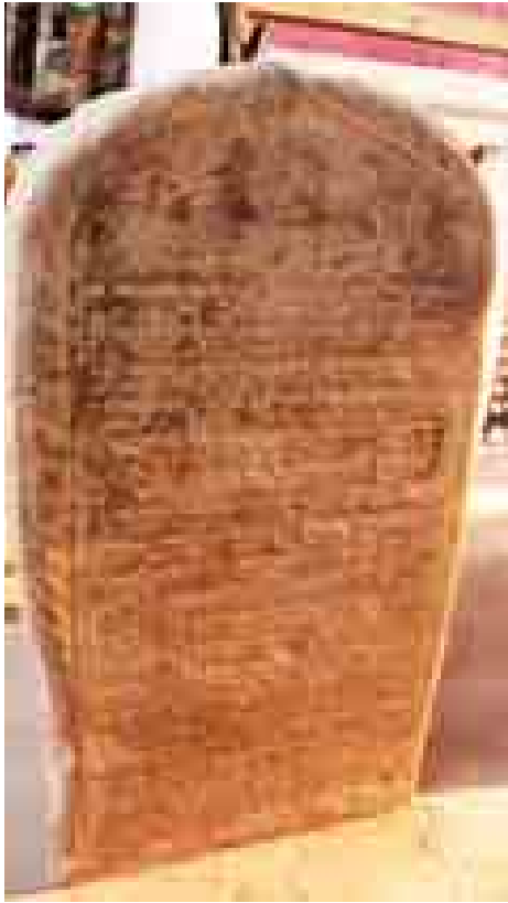
ဟန်လင်းကျောက်စာ

မြန်မာနိုင်ငံမှ ပျူမြို့ဟောင်းများဖြစ်သည့် ဟန်လင်း၊ သရေခေတ္တရာနှင့် ဝိဿနိုးမြို့တို့အား ယူနက်စကိုအဖွဲ့က ကမ္ဘာ့ယဉ်ကျေးမှုအမွေအနှစ်ဒေသများအဖြစ် ၂၀၁၄ခုနှစ် ဇူလိုင် ၁၈ ရက်က သတ်မှတ်ကြေညာပြီးသည့် နောက်ဝယ်ပြည်တွင်း ပြည်ပမှ ခရီးသွားများ ဟန်လင်းသို့ ယခင်ကထက် များစွာသွားရောက်လည်ပတ်လျက်ရှိနေပါသည်။