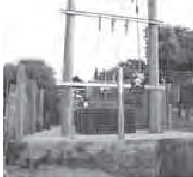
မြင်းမူမြို့နယ်၊ ပုလဲတန်ကျေးရွာတွင် အိမ်ခြေ ၁၈၀ ခန့်ရှိရာ အိမ်ခြေ ၁၆၀ ကို လျှပ်စစ်မီးရရှိရေး ဆောင်ရွက်ထားရှိပြီး ၅၂ အိမ်တွင် အိမ်သုံးဗီတာများ တပ်ဆင်ပြီးဖြစ်ကြောင်း သိရသည်။

“လျှပ်စစ်မီးရရှိအောင် ရွာသူရွာသားများအားလုံး ညီညီညွတ်ညွတ် ဆောင်ရွက်ခဲ့ကြပါတယ်။ လျှပ်စစ်မီးလင်းမြဲဖြစ်လို့ တစ်ရွာလုံးလည်း ဝမ်းသာနေကြတယ်။ လျှပ်စစ်မီးနဲ့ ရွာမှာ အသေးစား စက်မှုလုပ်ငန်းတွေလည်း လုပ်ကိုင်နိုင်ကြတော့မှာပါ။ မီးမရခင်ကဆိုရင် ရွာရဲ့ ထုတ်ကုန်တစ်မျိုးဖြစ်တဲ့ မုန့်တီမုန့်ဖတ်လုပ်ငန်းမှာ မုန့်ဖတ်လုပ်ဖို့ အလုပ်သမားနှစ်ယောက်က တစ်နေကုန် လုပ်ကြရတယ်။ အခု လျှပ်စစ်မီးနဲ့ လုပ်တာ အချိန် ၁၅ မိနစ်ပဲ ကြာတယ်။ အချိန်