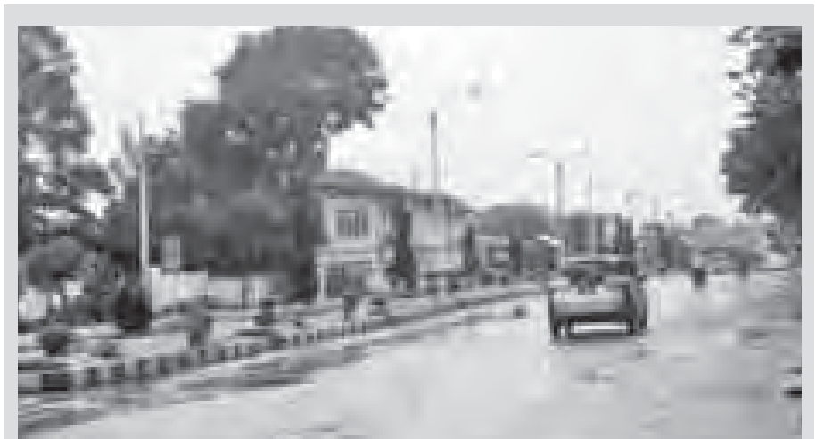
နေ့ခင်းအချိန်မှာလဲ မီးလင်းနေသည့် တောင်ကြီးမြို့၊ ဗိုလ်တထောင်လမ်းမပေါ်က လမ်းမီးတိုင် တောင်ကြီး မြို့ ဗိုလ်ချုပ်လမ်းမပေါ်ရှိ လမ်းမီးတိုင် အချို့တွင် နေ့လယ်ပိုင်းအချိန်များမှာပင် လမ်းမီးများ လင်းနေလျက်ရှိနေ သည်ကို အောက်တိုဘာ ၁၅ ရက် နေ့လယ် ၂ နာရီခွဲဝန်းကျင်အချိန်ခန့်က မြင်တွေ့နေရစဉ်။