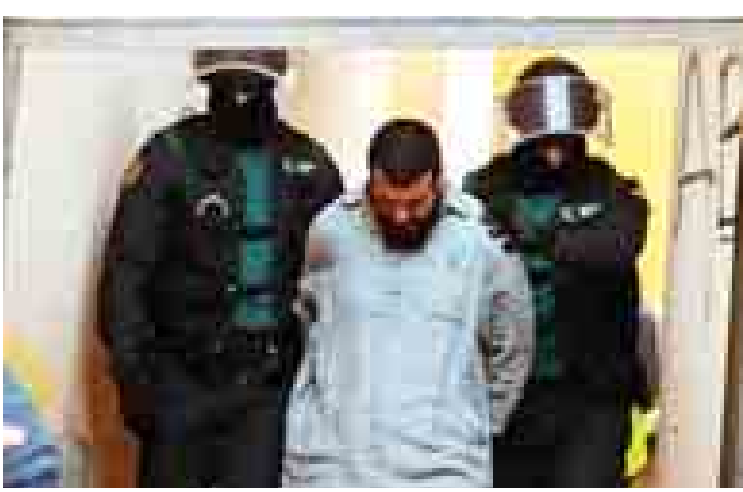
အစ္စလာမစ်နိုင်ငံ(အိုင်အက်စ်)အား ထောက်ပံ့ပေးနေသူတစ်ဦးကို ဂျာမန်ရဲတပ်ဖွဲ့ဝင်များက ဖမ်းဆီးခေါ်ဆောင်လာစဉ်။