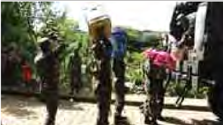
ရေဘေးသင့်ပြည်သူများအား ဖြန့်ဝေပေးရန် နီကာရာဂွါတပ်ဖွဲ့ဝင်များက ထောက်ပံ့ပေးပစ္စည်းများ ကားပေါ် တင်ဆောင်ကြစဉ်။

ကန်ဒုန် အောက်တိုဘာ ၁၉ အာဖဂန်နစ္စတန်နိုင်ငံ မြို့တော်ကဘူးမြောက်ဘက် ကီလိုမီတာ ၂၅၀ ခန့် ကွာဝေးသော ကန်နက် ပြည်နယ်၊ ကန်ဒုန်မြို့၊ ဒါရုတ်-အီး-အချီဒေသ၌ အောက်တိုဘာ ၁၉ ရက် ဒေသစံ တော်ချိန် နံနက် ၃ နာရီခန့်တွင် ရဲတပ်ဖွဲ့က ချုံခိုတိုက်ခိုက်ရာ စစ်သွေးကြွ ၁၂ ဦးသေဆုံး၍ ခြောက်ဦးဒဏ်ရာရရှိသွားကြောင်း ခရိုင်အုပ်ချုပ်ရေးမှူး နာဆာရှူဒင်ဆာဒီက ဆင်ယူာ သတင်းဌာနသို့ ပြောကြားသည်။ စစ်သွေးကြွများက တံတားတစ်စင်းကို ဖြတ်သန်းသွားလာနေစဉ် ရဲတပ်ဖွဲ့က ချုံခို တိုက်ခိုက်ခြင်းဖြစ်သည်။ ရဲတပ်ဖွဲ့ဝင်များဘက်မှ သေကြေဒဏ်ရာရမှုမရှိချေ။ ယင်းတိုက်ခိုက်မှုနှင့် ပတ်သက်၍ စစ်သွေးကြွများဘက်မှ ထင်မြင်ချက်တစ်စုံတစ်ရာ မပေးဟုဆိုသည်။ ဆင်ယူာ။