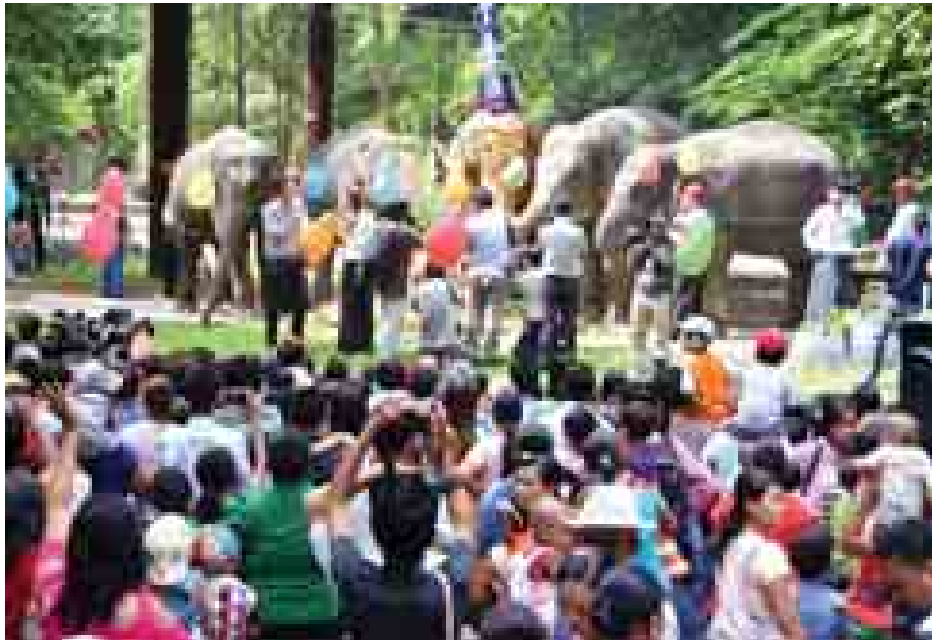
ဆင်မလေးမိမိ (၆၁)နှစ်ပြည့် မွေးနေ့ပွဲကို ရန်ကုန်တိရစ္ဆာန်ဥယျာဉ်၌ ကျင်းပစဉ်။

ကယားပြည်နယ် လွိုင်ကော်မြို့ကနေ ၁၉၆၁ ခုနှစ် မှာ ရန်ကုန်တိရစ္ဆာန်ဥယျာဉ်ကို ရောက်ရှိလာတဲ့ အသက် ခုနှစ် နှစ်အရွယ် ဆင်မလေးမိမိဟာ အခုဆိုရင် ဆင်မကြီး မိမိအဖြစ် (၆၁) နှစ်ပြည့် မွေးနေ့ကို ရောက်ရှိခဲ့ပြီဖြစ်ပါတယ်။