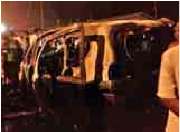
စဉ့်အိုးတန်းဆိပ်ကမ်း ဝင်/ထွက်ပေါက်၌ မော်တော်ယာဉ်တစ်စီး မီးလောင်