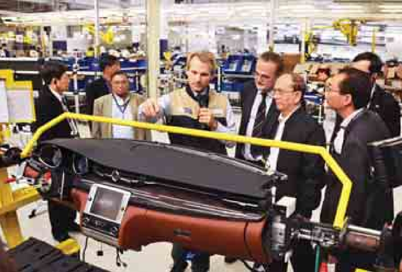
နိုင်ငံတော်သမ္မတ ဦးသိန်းစိန် တူရင်မြို့ရှိ ဖီးယက်ကုမ္ပဏီ၏ Maserati အဆင့်မြင့်မော်တော်ယာဉ်စက်ရုံ၌ မော်တော်ယာဉ်ထုတ်လုပ်မှုလုပ်ငန်းများအား ကြည့်ရှုလေ့လာစဉ်။ (သတင်းစဉ်)

တူရင် အောက်တိုဘာ ၁၉ အီတလီနိုင်ငံ မီလန်မြို့တွင် ရောက်ရှိနေသည့် နိုင်ငံတော်သမ္မတ ဦးသိန်းစိန်နှင့်အဖွဲ့သည် တူရင်မြို့တော်ဝန် မစ္စတာပရီရိုဖက်ဆီနို၏ ဖိတ်ကြားချက်အရ အောက်တိုဘာ ၁၈ ရက် နံနက်ပိုင်းတွင် မီလန်မြို့မှ တူရင်မြို့သို့ မော်တော်ယာဉ်ဖြင့် ရောက်ရှိကြပြီး တူရင်မြို့ရှိ လျှပ်စစ်ဓာတ်အားလုပ်ငန်းနှင့် အကြီးစားစက်မှုလုပ်ငန်းများကို ကြည့်ရှုလေ့လာခဲ့သည်။ တူရင်မြို့သည် အီတလီနိုင်ငံမြောက်ပိုင်းရှိ ပြေမောင်တေးပြည်နယ်၏ မြို့တော်ဖြစ်ပြီး အီတလီမြို့ကြီးများအနက် တတိယအကြီးဆုံးမြို့ဖြစ်သည်။ တူရင်မြို့သည် စက်မှုလုပ်ငန်းများ အဓိကထွန်းကားသည့်အပြင် ရှေးဟောင်းပြတိုက်များနှင့် နှစ်ပေါင်း ၆၀၀ ကျော် သက်တမ်းရှိသည့် University of Turin နှင့် Turin Polytechnic တို့သည် ထင်ရှားကျော်ကြားသည်။ နိုင်ငံတော်သမ္မတ ဦးသိန်းစိန်နှင့်အဖွဲ့သည် ဒေသစံတော်ချိန် နံနက် ၁၀ နာရီ ၄၅ မိနစ်တွင် တူရင်မြို့ရှိ လျှပ်စစ်ဓာတ်အားထုတ်လုပ်ဖြန့်ဖြူးသည့် IREN ကုမ္ပဏီသို့ သွားရောက်ကြည့်ရှုလေ့လာရာ တာဝန်ရှိသူများက လျှပ်စစ်ဓာတ်အားထုတ်လုပ်ဖြန့်ဖြူးနေမှုနှင့် လုပ်ငန်းများကို လိုက်လံရှင်းလင်းပြသကြသည်။ မွန်းလွဲပိုင်းတွင် နိုင်ငံတော်သမ္မတနှင့် အဖွဲ့သည် တူရင်မြို့ရှိ မြန်မာဂုဏ်ထူးဆောင် ကောင်စစ်ဝန်ချုပ် မစ္စတာအန်ဒရီရာ ဂါနီလိုက်က တည်ခင်းဆောင်ရွက်ခဲ့သည့် ဂုဏ်ပြုနေ့လယ်စာစားပွဲသို့ တက်ရောက်ခဲ့သည်။ ညနေပိုင်းတွင် တူရင်မြို့ရှိ ဖီးယက်ကုမ္ပဏီ၏ Maserati အဆင့်မြင့်မော်တော်ယာဉ် စက်ရုံသို့ရောက်ရှိရာ တာဝန်ရှိသူများက စက်ရုံ၏သမိုင်းကြောင်းနှင့် မော်တော်ယာဉ်ထုတ်လုပ်မှုလုပ်ငန်းတို့ကို လိုက်လံရှင်းလင်း ပြသကြသည်။ စာမျက်နှာ ၃ ကော်လံ ၁ သို့ ၂