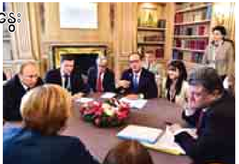
အောက်တိုဘာ ၁၇ရက်က အီတလီနိုင်ငံ မိလန်မြို့၌ ရုရှား၊ ယူကရိန်းနှင့် အီးယူခေါင်းဆောင်များ တွေ့ဆုံဆွေးနွေးကြစဉ်။

သဘောကွဲလွဲမှုများ ဆက်လက်ဖြစ်ပေါ်နေဆဲဖြစ်ကြောင်း သမ္မတ ပူတင်၏ ပြောရေးဆိုခွင့်ရှိသူ ဒီမစ်ထရီပက်စကော့ဝက် ပြောကြားသည်။ စက်တင်ဘာ ၅ ရက်က ဘီလာရုစ်နိုင်ငံ မင့်စ်မြို့၌ ရရှိခဲ့သော အပစ်အခတ်ရပ်စဲရေး သဘောတူညီချက်ကို နှစ်ဖက်စလုံးက ထပ်တလဲလဲ ချီးဖောက်ခဲ့ကြကြောင်း သတင်းတွင် ဖော်ပြသည်။