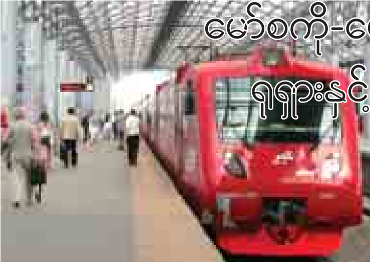
ရုရှားနိုင်ငံ မြို့တော် မော်စကိုရှိ ဘီလိုရပ်စကိုဘူတာရုံ၌ အမြန်ရထားတစ်စင်းကို တွေ့ရစဉ်။

အီဘီလာရောဂါအများဆုံးဖြစ်ပွားလျက်ရှိသည့် အနောက်အာဖရိက သုံးနိုင်ငံသို့ ခရီးသွားလာခြင်းသည်နိုင်ငံခြားသားများအား ၎င်းတို့၏နိုင်ငံအတွင်းသို့ ဝင်ရောက်ခြင်းကို ပိတ်ပင်ကြောင်း ကာရင်ဘီယံနိုင်ငံများ အုပ်စုတစ်စုက ကြေညာသည်ဟု ယနေ့ဘီဘီစီ သတင်းတွင် ဖော်ပြသည်။ ယခုအချိန်တွင် လိုင်ဘေးရီးယား၊ ဂီနီနှင့် ဆီရာလီယွန်နိုင်ငံတို့မှ ခရီးသည်များကို လက်ခံမည်မဟုတ်ကြောင်း ဂျမေကာနိုင်ငံက ပြောသည်။ ဂူယားနား၊ စိန့်လူစီယာကျွန်း၊ ဟေတီနှင့် ကိုလံဘီယာနိုင်ငံတို့သည်လည်း အလားတူ တားမြစ်ပိတ်ပင်ကြသည်။ အမေရိကန်သမ္မတ ဘာရက်အိုဘားမားက ယင်းကဲ့သို့ ပိတ်ပင်ရန် ၎င်းအား ဖိအားပေးခြင်းကို ခုခံကာကွယ်ခဲ့သည်။