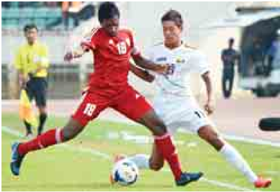
မြန်မာအသင်းနှင့် ယူအေအီးအသင်းတို့ ယှဉ်ပြိုင်နေစဉ်။ (ဓာတ်ပုံ-စိုးညွန့်)

မြန်မာ - တစ်ဂိုး (သန်းပိုင်) ယူအေအီး - ဂိုးမရှိ နှစ်ပေါင်းများစွာ ကမ္ဘာ့အဆင့်ပြိုင်ပွဲများ ဝင်ရောက်ယှဉ်ပြိုင်နိုင်ခြင်း မရှိခဲ့မှုကို မြန်မာယူ-၁၉ အသင်းက ယူ-၂၀ ကမ္ဘာ့ဖလားဝင်ခွင့် ရယူကာ အဆုံးသတ်နိုင်ခဲ့ပြီဖြစ်သည်။ ကမ္ဘာ့အဆင့်ပြိုင်ပွဲအဖြစ် ၁၉၇၂ မြူးနစ်အိုလံပစ်ပြိုင်ပွဲသာ အမြင့်ဆုံးယှဉ်ပြိုင်ဖူးသည့် မြန်မာဘောလုံးသမိုင်းတွင် မြန်မာယူ-၁၉ အသင်းက ယူ-၂၀ ကမ္ဘာ့ဖလားဝင်ခွင့်ရရှိအောင် ထပ်မံစွမ်းဆောင်ပေးခဲ့ခြင်းဖြစ်သည်။