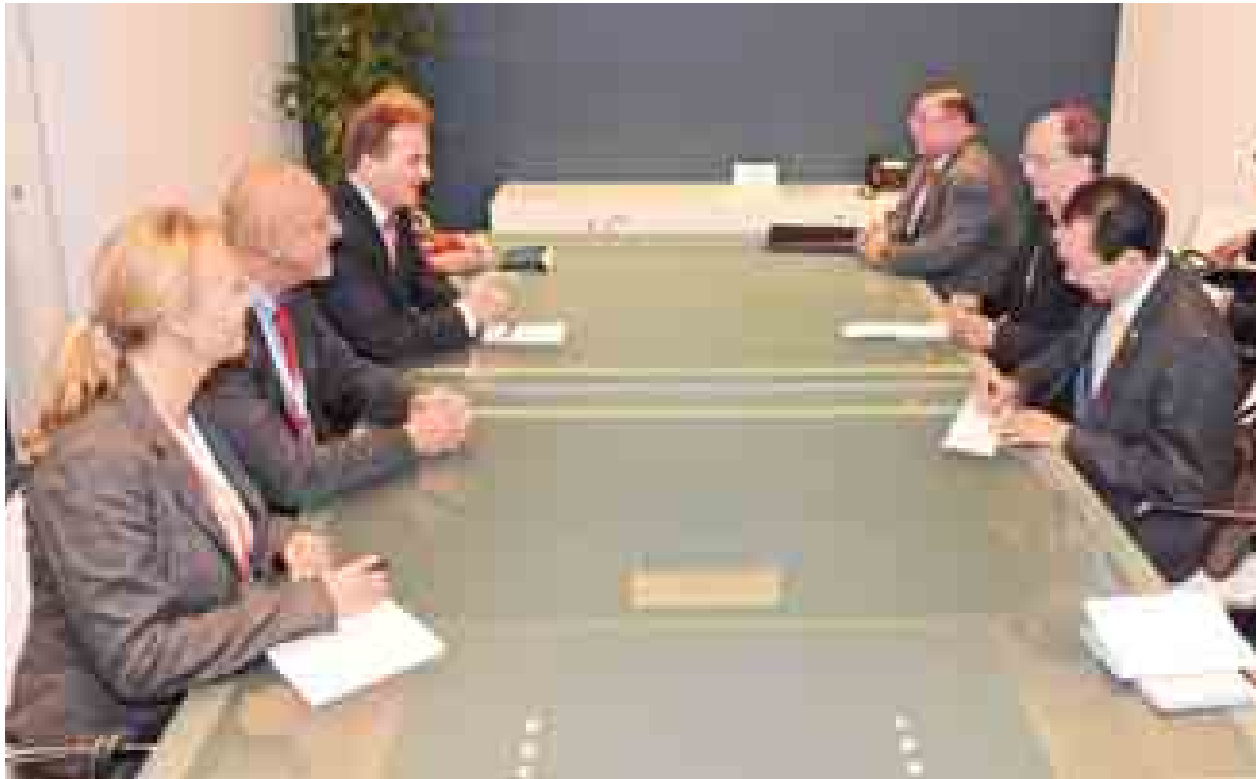
နိုင်ငံတော်သမ္မတ ဦးသိန်းစိန်နှင့် ဆွီဒင်နိုင်ငံဝန်ကြီးချုပ် မစ္စတာ စတေ ဖန်လော့ဖ်ဗန်တို့ တွေ့ဆုံဆွေးနွေးစဉ်။ (သတင်းစဉ်)

သမီးများနှင့် တိုင်းရင်းသားလူနည်းစုများ ဖွံ့ဖြိုးတိုးတက်ရေးအတွက် အကူ အညီပေးနိုင်မည့် အခြေအနေများနှင့်စပ်လျဉ်း၍ ဆွေးနွေးခဲ့ကြသည်။