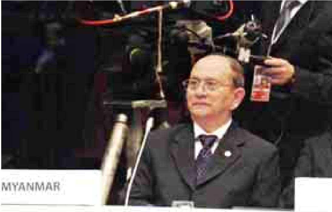
နိုင်ငံတော်သမ္မတ ဦးသိန်းစိန် အာရှ-ဥရောပ ထိပ်သီးအစည်းအဝေးတွင် ဆွေးနွေးပြောကြားစဉ်။ (သတင်းစဉ်)

မိလန် အောက်တိုဘာ ၁၇ အီတလီနိုင်ငံ မိလန်မြို့တွင်ရောက်ရှိနေသည့် နိုင်ငံတော်သမ္မတ ဦးသိန်းစိန်သည် အောက်တိုဘာ ၁၆ ရက် မွန်းလွဲပိုင်းတွင် မိကိုက္ကန်ဖရင့်စင်တာ၌ကျင်းပသည့် (၁၀)ကြိမ်မြောက် အာရှ-ဥရောပ ထိပ်သီးအစည်းအဝေးဖွင့်ပွဲအခမ်းအနားသို့ တက်ရောက်သည်။ (၁၀)ကြိမ်မြောက် အာရှ-ဥရောပထိပ်သီးအစည်းအဝေးမစတင်မီ နိုင်ငံတော်သမ္မတ ဦးသိန်းစိန်သည် ဥရောပသမဂ္ဂ-အာဆီယံခေါင်းဆောင်များ အလွတ်သဘောအစည်းအဝေးသို့ တက်ရောက်ဆွေးနွေးခဲ့သည်။ အဆိုပါ အလွတ်သဘောအစည်းအဝေးတွင် နိုင်ငံတော်သမ္မတက ၂၀၁၄ ခုနှစ် စက်တင်ဘာလအတွင်းက အာဆီယံနှင့် ဥရောပသမဂ္ဂအကြား အာဆီယံပေါင်းစပ်ဆက်သွယ်မှုမဟာစီမံကိန်း အကောင်အထည်ဖော်ရေးဆိုင်ရာ အမျိုးသားညှိနှိုင်းရေးမှူးများ၏ ပထမအကြိမ်အစည်းအဝေးနှင့် အာဆီယံပေါင်းစပ်ဆက်သွယ်မှုဆိုင်ရာ ပူးပေါင်းညှိနှိုင်းရေးကော်မတီ အစည်းအဝေးများကို နေပြည်တော်တွင် ကျင်းပနိုင်ခဲ့ပါကြောင်း၊ အာဆီယံဒေသ ပေါင်းစပ်ဆက်သွယ်မှုမြှင့်တင်ရေး စီမံကိန်းသည် အာဆီယံစီးပွားရေးအသိုက်အဝန်းတည်ဆောက်မှုရည်မှန်းချက်အတွက် အလွန်အရေးကြီးသော စီမံကိန်းဖြစ်ပါကြောင်း၊ ဥရောပသမဂ္ဂအနေဖြင့် အာဆီယံပေါင်းစပ်ဆက်သွယ်မှု မဟာစီမံကိန်း(Master Plan on ASEAN Connectivity-MPAC)ကို ပူးပေါင်းဆောင်ရွက်မှုအား ကြိုဆိုပါကြောင်း၊ အာဆီယံသည် ဥရောပသမဂ္ဂ၏ စာမျက်နှာ ၃ ကော်လံ ၁ သို့ ၂