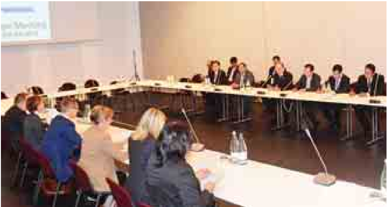
နိုင်ငံတော်သမ္မတ ဦးသိန်းစိန်နှင့် ဖင်လန်နိုင်ငံဝန်ကြီးချုပ် မစ္စတာ အလက်ဇန္ဒား စတင်တို့ တွေ့ဆုံဆွေးနွေးစဉ်။ (သတင်းစဉ်)

အလားတူ နိုင်ငံတော်သမ္မတသည် ဆွီဒင်နိုင်ငံဝန်ကြီးချုပ် မစ္စတာ စတေ ဖန်လော့ဖ်ဗန်နှင့်တွေ့ဆုံ၍ ဆွီဒင်နိုင်ငံက မြန်မာနိုင်ငံဖွံ့ဖြိုးတိုးတက်ရေးအတွက် ငါးနှစ်စီမံကိန်းဖြင့် အကူအညီပေးနေမှုအခြေအနေများ၊ စွမ်းအင်နှင့် ဆက်သွယ်ရေးကဏ္ဍများတွင် ပူးပေါင်းဆောင်ရွက်နိုင်မည့် အလားအလာများ၊ ဆွီဒင်နိုင်ငံမှ မြန်မာနိုင်ငံတွင် ရင်းနှီးမြှုပ်နှံနိုင်မည့် အလားအလာများ၊ အမျိုး