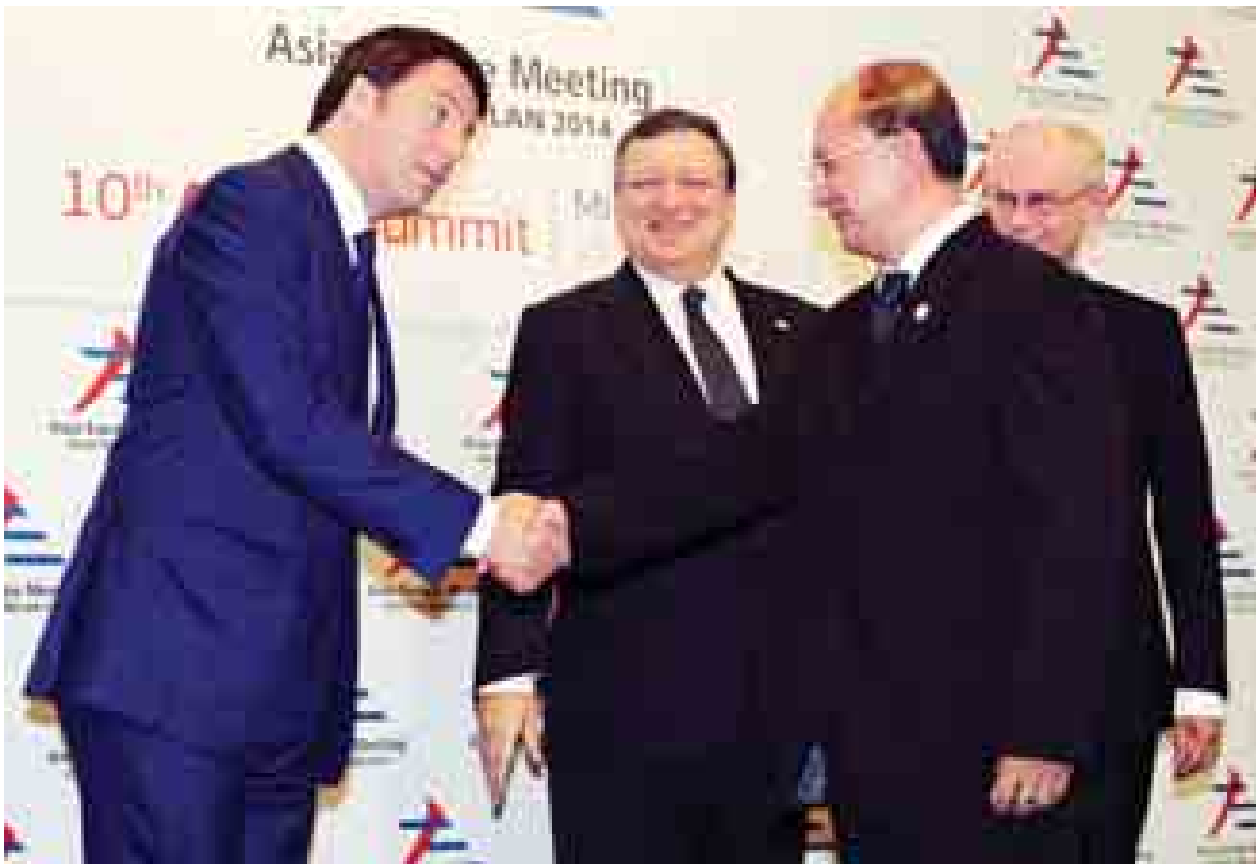
နိုင်ငံတော်သမ္မတ ဦးသိန်းစိန်အား အီတလီနိုင်ငံဝန်ကြီးချုပ် မစ္စတာ မက်တေယို ရမ်ဇီ ကြိုဆိုနှုတ်ဆက်စဉ်။ (သတင်းစဉ်)

ညပိုင်းတွင် နိုင်ငံတော်သမ္မတသည် အီတလီနိုင်ငံ သမ္မတ ဂျော်ဂျီယိုနာ