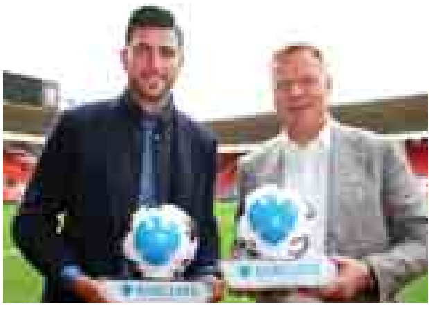
အောင် ဖန်တီးပေးနိုင်ခဲ့ပြီး အီတလီအသင်းက မယ်လ်တာအသင်းအား နိုင်ပွဲရရှိခဲ့သည့် ယူရို ၂၀၁၆ ဝင်ခွင့်ပြိုင်ပွဲတွင်လည်း အီတလီအသင်းအတွက် အနိုင်ဂိုးသွင်းယူပေးနိုင်ခဲ့သူဖြစ်သည်။ (ဇွဲကြယ်)

တောင်ကြီးတန်ဆောင်တိုင်ပွဲတော်သည် ၁၉၄၁ခုနှစ်ခန့်ကပင် စတင်လွတ်တင်ခဲ့ပြီး ၁၉၅၃-၅၄ခုလောက်တွင် ပြိုင်ပွဲအသွင် တစ်ဖြည်းဖြည်းစည်းကားလာခဲ့သည်မှာ ယနေ့ဆိုပါလျှင် နှစ်ပေါင်း(၇၃)နှစ်တိုင်ခဲ့ပြီး ကမ္ဘာသိ၊ မြန်မာသိပွဲတော်ကြီးတစ်ခုပင်ဖြစ်နေပါသည်။ မြို့လုံးကျွတ်ဘုံကထိန်ပွဲတော်မှာလည်း လွတ်လပ်ရေးမရမီကပင် စတင်ကျင်းပလာခဲ့ပြီး ၂၀၀၁ခုနှစ်မှစတင်ပြီး ပြည်နယ်အစိုးရအဖွဲ့မှ ဦးစီးကျင်းပလာခဲ့သည်မှာ ယနေ့ထိတိုင်ကြာမြင့်ခဲ့ပြီး အလွန်ပင်စည်ကားသိုက်မြိုက်လှသည့် ပွဲတော်ကြီးအား ရပ်ဝေးရပ်နီးမှမိတ်ဆွေသင်္ဂဟများ လာရောက်လည်ပတ်ရင်း အတူတကွပါဝင်ခွင့်ပျော်ကြပါရန် သတင်းကောင်းပါးအပ်ပါသည်။ တောင်ကြီးမြို့၊ တန်ဆောင်တိုင်ပွဲတော်ကျင်းပရေးဦးစီးကော်မတီ