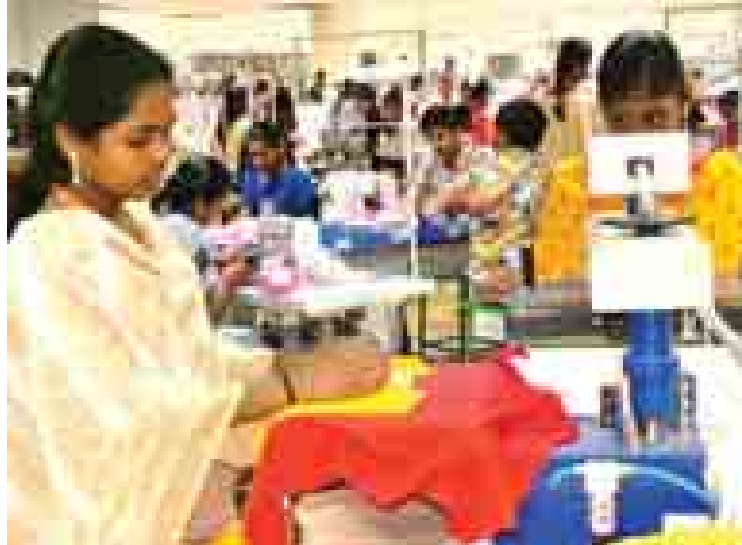
အိန္ဒိယနိုင်ငံ တမိလ်နာဒူပြည်နယ် တီရူပူးရီမြို့ရှိ အထည်ချုပ်စက်ရုံတစ်ရုံ၏ လုပ်ငန်းခွင်ကို တွေ့ရစဉ်။

အိန္ဒိယဝန်ကြီးချုပ် နရိန္ဒြာမိုဒီသည် အာရှ၏တတိယစီးပွားရေးအင်အားကြီးဆုံးနိုင်ငံကို နိုင်ငံတကာထုတ်လုပ်ရေး ဗဟိုချက်တစ်ခုအဖြစ် ပြောင်းလဲရေးအတွက် ရည်ရွယ်လျက် အလုပ်သမားရေးရာ ပြုပြင်ပြောင်းလဲမှုများပြုလုပ်ရန် ကြာသပတေးနေ့က ထုတ်ပြန်ကြေညာခဲ့သည်။