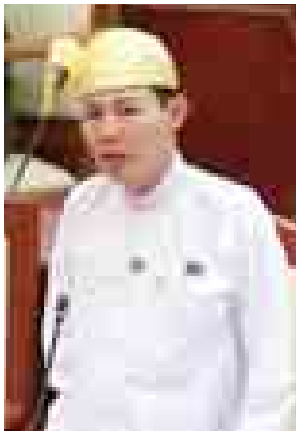
အုတ်တွင်း မဲဆန္ဒနယ်မှ ဦးညီညီမြင့်။

မွေးကင်းစကလေးများအား မည်သည့်ကာကွယ်ဆေးများ အခမဲ့ထိုးပေးမည်ကို သိလိုခြင်း မေးခွန်းနှင့်စပ်လျဉ်း၍ ကျန်းမာရေးဝန်ကြီးဌာန ဒုတိယဝန်ကြီး ဒေါက်တာဒေါ်သိန်းသိန်းဌေးက ပုဂ္ဂလိကဈေးကွက်မှ ကာကွယ်ဆေးများသည် ဆေးခန်းတစ်ခုနှင့်တစ်ခု အမြတ်အစွန်းရယူခြင်းအပေါ်တွင်မူတည်၍ ဈေးနှုန်းများ ကွာခြားနိုင်ပါကြောင်း၊ ထိုကာကွယ်ဆေးများအား ဆရာဝန်များနှင့် ပြည်သူများက သုံးစွဲနေခြင်းသည် သုံးစွဲသူ၏ ရွေးချယ်မှုဖြစ်၍ ကျန်မာရေး