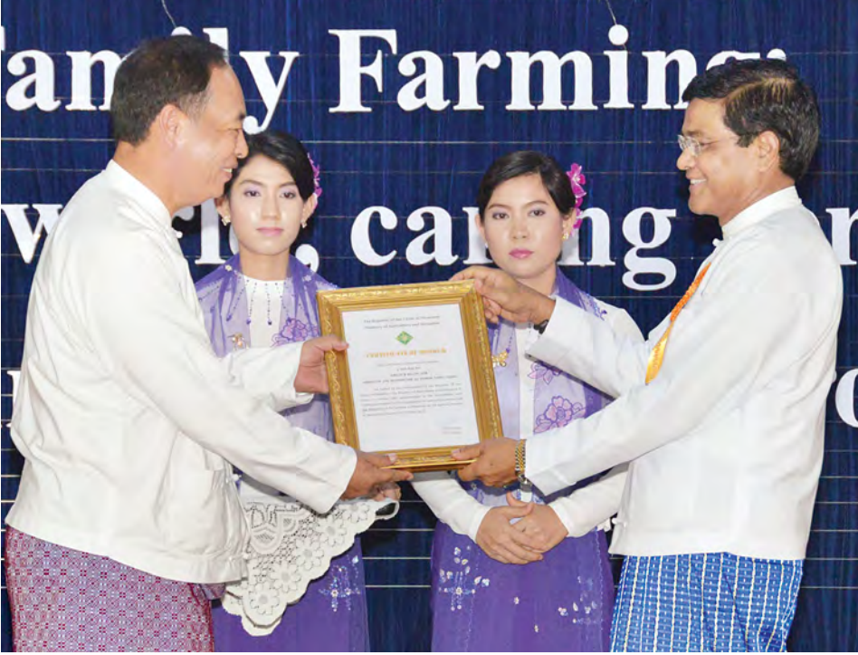
ဒုတိယသမ္မတ ဦးညွှန်ထွန်း ဂုဏ်ပြုမှတ်တမ်းလွှာ ပေးအပ်ချီးမြှင့်စဉ်။ (သတင်းစဉ်)

ကုလသမဂ္ဂထောင်စုနှစ် ရည်မှန်းချက်အရ မိမိတို့နိုင်ငံအနေဖြင့် လက်ရှိဆင်းရဲနွမ်းပါးမှုညွှန်းကိန်း ၂၆ ရာခိုင်နှုန်းမှ ၂၀၁၅ ခုနှစ်တွင် ၁၆ ရာခိုင်နှုန်းသို့ လျော့ချနိုင်ရေးအတွက် ကျေးလက်ဒေသဖွံ့ဖြိုးရေးနှင့် ဆင်းရဲမှုလျော့ချရေးလုပ်ငန်းစဉ်(၈)ရပ် ချမှတ်ဆောင်ရွက်နေလျက်ရှိရာတွင် အဓိကျသည့် ကျေးလက်နေ လုပ်ကွက်ငယ်တောင်သူ လယ်သမားမိသားစုများ၏ ဝင်ငွေတိုးတက်မြင့်မားလာစေရန် မြေယာလုပ်ကိုင်ခွင့်နှင့်ပိုင်ဆိုင်မှုပေးခြင်း၊ သီးနှံရာသီ