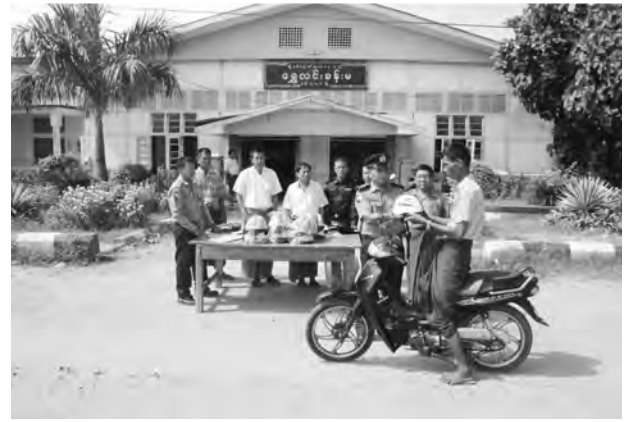
နတ်တလင်း၊ အောက်တိုဘာ ၁၆

ပဲခူးတိုင်းဒေသကြီး သာယာဝတီခရိုင် နတ်တလင်းမြို့တွင် အောက်တိုဘာ ၁၃ ရက် နံနက် ၉ နာရီမှ မွန်းလွဲ ၁ နာရီအထိ မြို့နယ် ယာဉ်စည်းကမ်း လမ်းစည်းကမ်း ကြီးကြပ်ထိန်းသိမ်းရေးကော်မတီမှ ဆိုင်ကယ်စီးထုပ်မဆောင်းသူ ၂၀ ဦးအား ဦးထုပ်များပြန့်ဝေပေးခဲ့ကြောင်း သိရသည်။