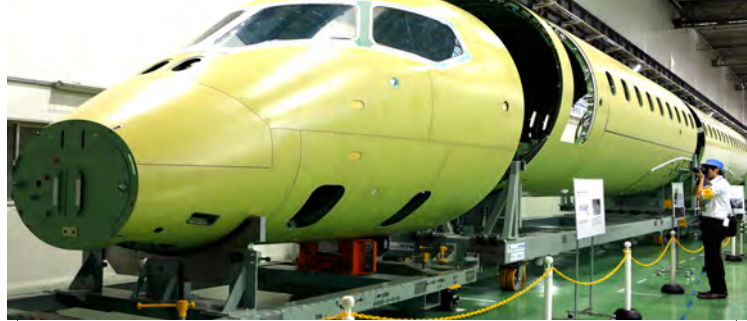
ဂျပန်အလယ်ပိုင်း ကိုဟာကီမြို့ရှိ မစ်ဆူဘီရီ လေယာဉ်ထုတ်လုပ်ရေးစက်ရုံကိုတွေ့ရစဉ်။

ဂျပန်နိုင်ငံ၌ ပထမဆုံးအကြိမ် ဒီဇိုင်းပုံစံထုတ် တည်ဆောက်သည့် အမ်အာရ်ဂျေအမျိုးအစား ခရီးသည်တင် ဂျက်လေယာဉ် စတင်ထုတ်လုပ်မှု အခမ်းအနားကို နိုင်ငံအလယ်ပိုင်း နာဂိုယာမြို့ရှိ မစ်ဆူဘီရီ အကြီးစားစက်မှုလုပ်ငန်းစက်ရုံ၌ အောက်တိုဘာ ၁၈ ရက်တွင် ကျင်းပမည် ဖြစ်ကြောင်း ကျိုဒိုသတင်းဌာနက သတင်းထုတ်ပြန်သည်။