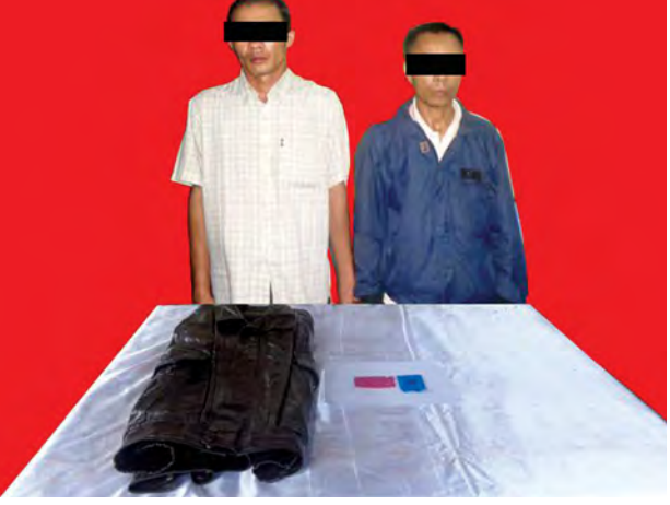
နိုင်ငံအားနှင့် အောင်နိုင်ဦးတို့ နှစ်ဦးအား သိမ်းဆည်းရမိ မူးယစ်ဆေးဝါးများနှင့်အတူ တွေ့ရစဉ်။