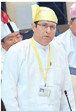
လျှပ်စစ်စွမ်းအားဝန်ကြီးဌာန ဒုတိယဝန်ကြီး ဦးမော်သာထွေး။

မန္တလေးတိုင်းဒေသကြီး မဲဆန္ဒနယ်အမှတ်(၆)မှ ဦးမျိုးမြင့်က လျှပ်စစ်စွမ်းအားဝန်ကြီးဌာနအနေဖြင့် ဝေးလံခေါင်ဖျားဒေသများတွင် ဗို့အားမြင့်ဓာတ်အားလိုင်းများ(သို့မဟုတ်) မဟာဓာတ်အားလိုင်းများကို ခက်ခက်ခဲခဲ သွယ်တန်းပြီး ဓာတ်အားဖြန့်ဖြူးမှုရက်စနစ် တည်ဆောက်လျက်ရှိကြောင်းနှင့် လျှပ်စစ်ဓာတ်အားထုတ်လုပ်မှုအပိုင်းတွင် ရေအား၊ လေစွမ်းအား၊ နေရောင်ခြည်စွမ်းအားနှင့် အပူရှိန်သုံးဓာတ်အားကဏ္ဍများကို ဖြန့်ဖြူးဆောင်ရွက်လျက်