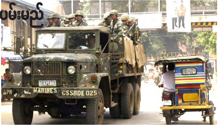
ဂျာမန်စားစာခံနှစ်ဦး အဖမ်းခံထားရသော ဂျိုလိုကျွန်း၌ အစိုးရတပ်ဖွဲ့က လုံခြုံရေးဆောင်ရွက်စဉ်။

စားစာခံအဖြစ် အဖမ်းခံရသူ ဂျာမန်နှစ်ဦးမှာ အမျိုးသားတစ်ဦးနှင့် အမျိုးသမီးတစ်ဦးတို့ ဖြစ်ကြသည်။ စားစာခံနှစ်ဦး၏ အသက်ကို ကယ်တင်နိုင်ရေးအတွက် လိုအပ်သည့် စစ်ဆင်ရေးလုပ်ငန်းအရပ်ရပ်ကို လုပ်ကိုင်သွားမည်ဖြစ်ကြောင်း ဖိလစ်ပိုင်တပ်မတော် ဗိုလ်မှူးကြီးအယ်လ်အာရီဂျာဒိုက ပြောကြားသည်။ ဖမ်းဆီးခံ စားစာခံနှစ်ဦးအား ရိုက်ကူးထားသည့် ဗီဒီယိုဖိုင်ကို စစ်သွေးကြွအဖွဲ့က ဒေသဆိုင်ရာ ရေဒီယိုအသံလွှင့်ဌာနတစ်ခုသို့ ပေးပို့ခဲ့သည်။