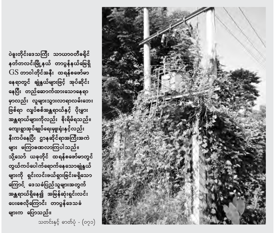
ပဲခူးတိုင်းဒေသကြီး သာယာဝတီခရိုင် နတ်တလင်းမြို့နယ် တာပွန်နယ်မြေရှိ GS တာဝါတိုင်အနီး ထရန်စဖော်မာနေရာတွင် ရှိနေသည့်အားဖြင့် အုပ်ဆိုင်းနေပြီး တည်ဆောက်ထားသောနေရာမှာလည်း လူများသွားလာရာလမ်းဘေးဖြစ်ရာ လျှပ်စစ်အန္တရာယ်နှင့် ပိုးမွှားအန္တရာယ်များကိုလည်း စိုးရိမ်ရသည်။ ကျေးရွာအုပ်ချုပ်ရေးမှူးရုံးနှင့်လည်း နီးကပ်နေပြီး ဌာနဆိုင်ရာအကြီးအကဲများ မကြာခဏလာကြပါသည်။ သို့သော် ယခုတိုင် ထရန်စဖော်မာတွင် တွယ်ကပ်ပေါက်ရောက်နေသောရရှိမှုများကို ရှင်းလင်းဖယ်ရှားခြင်းမရှိသောကြောင့် ဒေသခံပြည်သူများအတွက် အန္တရာယ်ရှိနေ၍ အမြန်ဆုံးရှင်းလင်းပေးစေလိုကြောင်း တာပွန်ဒေသခံများက ပြောသည်။

ကျန်တော်တို့ သရက်သာကျေးရွာသာမက မြို့နယ်အတွင်းက ကျေးရွာတော်တော်များများ အသုံးပြုနေတာပါ။ ယခင်တံတားက သစ်သားတံတားဖြစ်ပြီး ကျဉ်းမြောင်းတာကြောင့် ယာဉ်နှင့်ကုန်တွေ ပြတ်ကူးလို့မရပါဘူး။ ဒီနေရာမှာ တစ်ဆင့်ကျပြီးမှ သယ်ရတာပါ။ ဒါကြောင့် တံတားအသစ်ဆောက်လုပ်ခြင်းအားဖြင့် ကျွန်းထဲကျေးရွာတွေက ထွက်ရှိတဲ့ သီးနှံတွေကို ကားနဲ့တင်ပြီး ပို့ရတဲ့အထိ သီးနှံတွေ ရောင်းချနိုင်တော့မှာဖြစ်လို့ အမြန်ပြီးစီးအောင် ဆောင်ရွက်သွားမှာဖြစ်ပါတယ်” ဟု တံတားဆောက်လုပ်ရေးကော်မတီ အဖွဲ့ဝင်တစ်ဦးကပြောသည်။