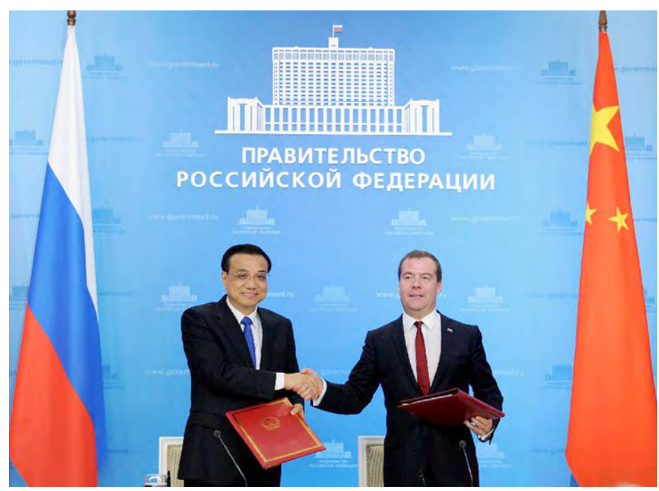
အောက်တိုဘာ ၁၃ ရက်က မြို့တော်မော်စကို၌ တရုတ်ဝန်ကြီးချုပ်နှင့် ရုရှားဝန်ကြီးချုပ်အား ပူးတွဲကြေညာချက် လက်မှတ်ရေးထိုးပြီးနောက် တွေ့ရစဉ်။