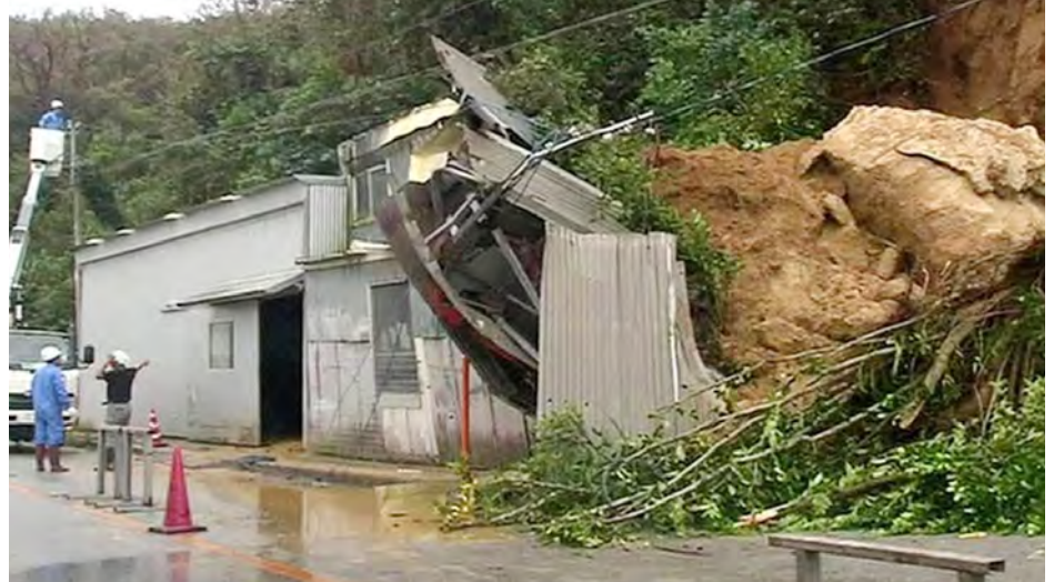
ဂျပန်နိုင်ငံ အရှေ့ပိုင်း၌ တိုင်းဖွန်းမုန်တိုင်း တိုက်ခတ်မှုကြောင့် အဆောက်အအုံများ ပျက်စီးနေသည်ကို တွေ့ရစဉ်။

ဖိလစ်ပိုင်လူမျိုးတစ်ဦးကို သတ်ဖြတ်ခဲ့မှုဖြင့် စွဲချက် တင်ခံထားရသူ အမေရိကန် မရိန်းတပ်ဖွဲ့ဝင်တစ်ဦးကို တရားစီရင် စစ်ဆေးနိုင်ရေးအတွက် ဖိလစ်ပိုင်နိုင်ငံသို့ လွှဲပြောင်းပေး အပ်ရန် မြို့တော်မနီလာရှိ အမေရိကန်သံရုံး ရှေ့တွင် ဆန္ဒပြတောင်းဆိုခဲ့ကြကြောင်း ဒေသဆိုင်ရာ သတင်းဌာနများက အောက်တိုဘာ ၁၄ ရက်တွင် သတင်း ထုတ်ပြန်သည်။ အဆိုပါ မရိန်းတပ်ဖွဲ့ဝင်ကို ဆူးဘစ်ပင်လယ်အော်ရှိ ဆိပ်ကမ်းတစ်ခု၌ ရပ်နားထားသော ယူအက်စ်အက်စ် ပယ်လီယူအမည်ရှိ စစ်သင်္ဘောပေါ်တွင် ထိန်းသိမ်းထား ကြောင်း အမေရိကန် မရိန်းတပ်ဖွဲ့ ပြောရေးဆိုခွင့်ရှိသူ ဗိုလ်မှူးကြီးဘရက်ဘာတီးက ပြောကြားသည်။ ယင်း ပင်လယ်ဆိပ်ကမ်းသည် မြို့တော်မနီလာ အနောက်မြောက် ဘက် ကီလိုမီတာ ၈၀(မိုင် ၅၀)ခန့်အကွာတွင် တည်ရှိသည်။ အဆိုပါ မရိန်းတပ်ဖွဲ့ဝင်ကို အမေရိကန်ရေတပ်နှင့် ဖိလစ်ပိုင်ရေတပ်တို့က ပူးတွဲစုံစမ်းစစ်ဆေးလျက်ရှိသည်။ အမေရိကန်မရိန်းတပ်ဖွဲ့နှင့် ရေတပ်တို့မှ တပ်ဖွဲ့ဝင် ၃၀၀၀ ခန့်သည် စစ်ရေးလေ့ကျင့်မှုပြုလုပ်ရန် ဖိလစ်ပိုင်သို့ ရောက်ရှိနေခဲ့ပြီး ရက်သတ္တနှစ်ပတ်ကြာ စစ်ရေးလေ့ကျင့် မှုမှာ အောက်တိုဘာ ၁၀ရက်တွင် ပြီးဆုံးခဲ့သည်။ ပီတီအိုင်။