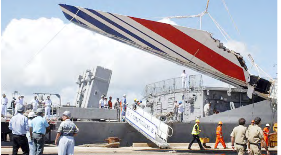
အတ္တလန္တိတ်သမုဒ္ဒရာအတွင်းမှ ပြန်လည်ဆယ်ယူရရှိသော လေယာဉ်ပျက် အပိုင်းအစများကို မှတ်တမ်းပုံတွင် တွေ့ရစဉ်။

တမ်းများအရ သိရှိရကြောင်း သတင်းစာတွင် ဖော်ပြသည်။ ၂၀၀၉ခုနှစ် ဇွန် ၁ ရက်က အဆိုပါလေယာဉ်ပျက် ကျမှု ဖြစ်ပွားခဲ့သည်။ ဘရာဇီးနိုင်ငံ ရီယိုဒီဂျနေရီးမြို့မှ ပြင်သစ်နိုင်ငံ ပါရီမြို့သို့ ယုံသန်းလာသောလေယာဉ်သည် အတ္တလန္တိတ်သမုဒ္ဒရာအတွင်းသို့ ပျက်ကျခဲ့သည်။ အဲဖရိကန် လေကြောင်းဌာန သမိုင်းကြောင်းတွင် လူသေဆုံးမှုအများဆုံး မတော်တဆမှုဖြစ်ရပ်ဖြစ်ကြောင်း သတင်းတွင် ဖော်ပြသည်။ ပီတီအိုင်။