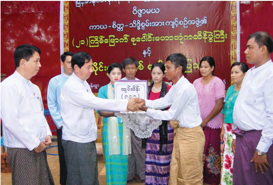
သတင်းမီဒီယာမျိုးစုံ၏ အတုခိုးမှားမှုကိုမဖြစ်စေဘဲ မြန်မာ့ ရိုးရာသိုင်းပညာ မပျောက်ပျက်အောင်ဆောင်ရွက်ပေးမှု နှင့် အကျင့်သီလပိုင်းဆိုင်ရာစာရိတ္တကို ထိန်းသိမ်းလေ့ကျင့် ပေးမှုတို့ကြောင့် သင်တန်းသား တစ်သိန်းနီးပါး လေ့ကျင့် ပေးနိုင်ခဲ့ကြောင်းနှင့် အသင်းဝင် ၃၀၀၀ နီးပါးရှိပြီဖြစ် ကြောင်း သိရသည်။

မြန်မာလူမျိုးတို့၏ ရှေးခေတ်သိုင်းပညာများကို ရိုးရာ မပျက်ထိန်းသိမ်းစောင့်ရှောက်၍ စနစ်တကျပြန့်ပွား အောင် လေ့ကျင့်ဆောင်ရွက်ပေးလျက်ရှိသော ပဲခူးတိုင်း ဒေသကြီး မိုးညိုမြို့နယ် အိုးဘိုကျေးရွာရှိ မြန်မာနိုင်ငံလုံး ဆိုင်ရာ စက္ကဗျူဟာပင်မသိုင်းအဖွဲ့ချုပ်၏ သိုင်းပညာစိစစ် ဖော်ထုတ်ပြသမှုကို အဆိုပါကျေးရွာ၌ အောက်တိုဘာ ၁၃ ရက်က ကျင်းပခဲ့သည်။ အဆိုပါအခမ်းအနားသို့ စိတ်ဝင်စားသောဒေသခံပြည်သူများစွာနှင့်အတူ ရထား ပို့ဆောင်ရေးဝန်ကြီးဌာန ပြည်ထောင်စုဝန်ကြီး ဦးသန်းဌေး တက်ရောက်ခဲ့သည်။