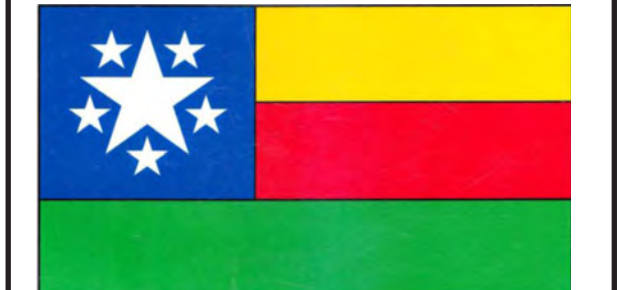
မြန်မာနိုင်ငံ တောင်သူလယ်သမား အလုပ်သမား ပြည်သူ့ပါတီ၏အလံပုံစံ