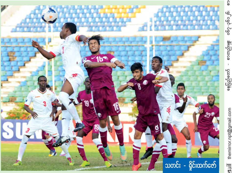
ဆိုမန်အသင်းက ကာတာအသင်းဘက်သို့ တိုက်စစ်ဆင်နေစဉ်။ သတင်း - ရိုင်းထက်ဇော်