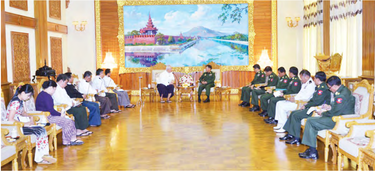
တပ်မတော်ကာကွယ်ရေးဦးစီးချုပ် ဗိုလ်ချုပ်မှူးကြီးမင်းအောင်လှိုင် မြန်မာနိုင်ငံ စာနယ်ဇင်းကောင်စီ(ယာယီ)မှ ဒုတိယဥက္ကဋ္ဌ ဦးခင်မောင်လေးနှင့် အဖွဲ့ဝင်များအား လက်ခံတွေ့ဆုံစဉ်။

နေပြည်တော် အောက်တိုဘာ ၁၄ - တပ်မတော်ကာကွယ်ရေးဦးစီးချုပ် ဗိုလ်ချုပ်မှူးကြီး မင်းအောင်လှိုင်သည် ယနေ့မနက် ၉ နာရီတွင် နေပြည်တော်ရှိ ဘုရင့်နောင်ရိပ်သာ ဧည့်ခန်းမဆောင်၌ မြန်မာနိုင်ငံ စာနယ်ဇင်းကောင်စီ (ယာယီ)မှ ဒုတိယဥက္ကဋ္ဌ ဦးခင်မောင်လေးနှင့် အဖွဲ့ဝင်များအား လက်ခံတွေ့ဆုံရာ တွင် တပ်မတော်နှင့် သတင်းမီဒီယာများအကြား သတင်းအချက်အလက်များ မှန်ကန်မြန်ဆန်စွာ စီးဆင်းမှုရှိ ရေးပေးပေးနိုင်ရေးအတွက် နှစ်ဖက်ထိတွေ့ ဆက်ဆံမှုများမှတစ်ဆင့် နားလည်မှု၊ ယုံကြည်မှုတို့အား တည်ဆောက်ရန်၊ တပ်မတော်နှင့် မီဒီယာအကြား အပြန်အလှန်အားကိုးအားထားပြုနိုင်သည့်အထိ အားနည်းချက်၊ ချို့ယွင်းချက်များအား ပြုပြင်စာမျက်နှာ ၃ ကော်လံ ၄ သို့ ☆