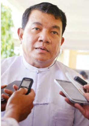
သိပ္ပံနှင့် နည်းပညာဝန်ကြီးဌာန ညွှန်ကြားရေးမှူးချုပ် ဦးကျော်စွာစိုး။

မြန်မာနိုင်ငံတစ်ဝန်းလုံးတွင်ရှိသော ကွန်ပျူတာ နည်းပညာဆိုင်ရာ ကျောင်းသား ကျောင်းသူများအတွက် Android Mobile Application နှင့် ပတ်သက်သော နည်းပညာရပ်များကို ပိုမိုကျွမ်းကျင်စွာ ဆောင်ရွက်နိုင်ပြီး ပညာရှင်များအဖြစ် ရပ်တည်လုပ်ကိုင်နိုင်ရန် Samsung Tech Institute Mobile Apps Training အစီအစဉ်တစ်ရပ်ကို စတင်လိုက်ကြောင်းသိရသည်။ အဆိုပါ အစီအစဉ်နှင့် ပတ်သက် သော ဖွင့်ပွဲအခမ်းအနားတစ်ရပ်ကို အောက်တိုဘာ ၁၀ ရက် ညနေ ၃ နာရီ ခန့်က ရန်ကုန်ကွန်ပျူတာတက္ကသိုလ် တွင် ကျင်းပခဲ့ခြင်းဖြစ်သည်။ ထိုအစီအစဉ်မှာ ဒုတိယအကြိမ်မြောက် ပြုလုပ်ခြင်းလည်းဖြစ်သလို သိပ္ပံနှင့် နည်းပညာဝန်ကြီးဌာန လက်အောက် တွင်ရှိသော မြန်မာနိုင်ငံတစ်ဝန်းလုံးမှ ကွန်ပျူတာ တက္ကသိုလ်အသီးသီးတို့ရှိ ကျောင်းသား ကျောင်းသူများအနက်မှ ၁၀၀ ကို ရွေးချယ်၍ ရန်ကုန် ကွန်ပျူတာတက္ကသိုလ်နှင့် မန္တလေး ကွန်ပျူတာတက္ကသိုလ်တို့တွင် တစ်လ ကြာ Mobile Application ရေးဆွဲနည်းသင်တန်းပို့ချပြီး ယင်း အနက် ကျောင်းသား ကျောင်းသူ ၂၀ ကို စိစစ်ရွေးချယ်ကာ တစ်ဦးလျှင် အမေရိကန်ဒေါ်လာ ၂၅၀ စီ ချီးမြှင့် သွားမည်ဖြစ်သည်။ ယင်းနောက် တွင် မွမ်းမံသင်တန်းများပေးကာ Grand Final အဖြစ် အုပ်စုလိုက် ပွဲစဉ်များကို ဆက်လက်ပြုလုပ် ယှဉ်ပြိုင်စေပြီး ပထမဆုအဖြစ် အမေရိကန်ဒေါ်လာ ၃၀၀၀၊ ဒုတိယ ဆုအဖြစ် အမေရိကန်ဒေါ်လာ ၂၀၀၀၊ တတိယဆုအဖြစ် အမေရိကန် ဒေါ်လာ ၁၀၀၀ တို့ကို ချီးမြှင့်ကာ Mobile Application Training