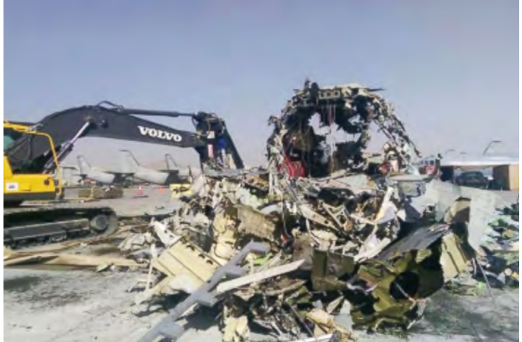
ဩဂုတ်လအတွင်းက သံတိုသံစအဖြစ် လေယာဉ်များကို ဖျက်ဆီးခဲ့သည့် မှတ်တမ်းပုံ။

အဆိုပါလေယာဉ်များမှာ အီတလီနိုင်ငံလုပ် လေယာဉ်များဖြစ်ကြပြီး ၂၀၀၈ခုနှစ်တွင် ဝယ်ယူခဲ့သည်။ အမေရိကန် စစ်လက်နက်ထောက်ပံ့ရေး အေဂျင်စီက သယ်ယူပို့ဆောင်ရေးလေယာဉ်အမျိုးကို ဖျက်သိမ်းခြင်းမှာ ဖန်ထုသော အာဖဂန်နစ္စတန်နိုင်ငံ၌ မကြာခဏပြုပြင်ထိန်းသိမ်းရေး လုပ်ဆောင်နေရခြင်းကြောင့် အသုံးမတည့်တော့သည့် ယင်းလေယာဉ်များကို အာဖဂန်နစ္စတန်နိုင်ငံတွင် နှစ်ရှည်လများ အသုံးမပြုဘဲ ရပ်ထားခဲ့ရသည်ဟု သတင်းတွင် ဖော်ပြသည်။ ပီတီအိုင်း။