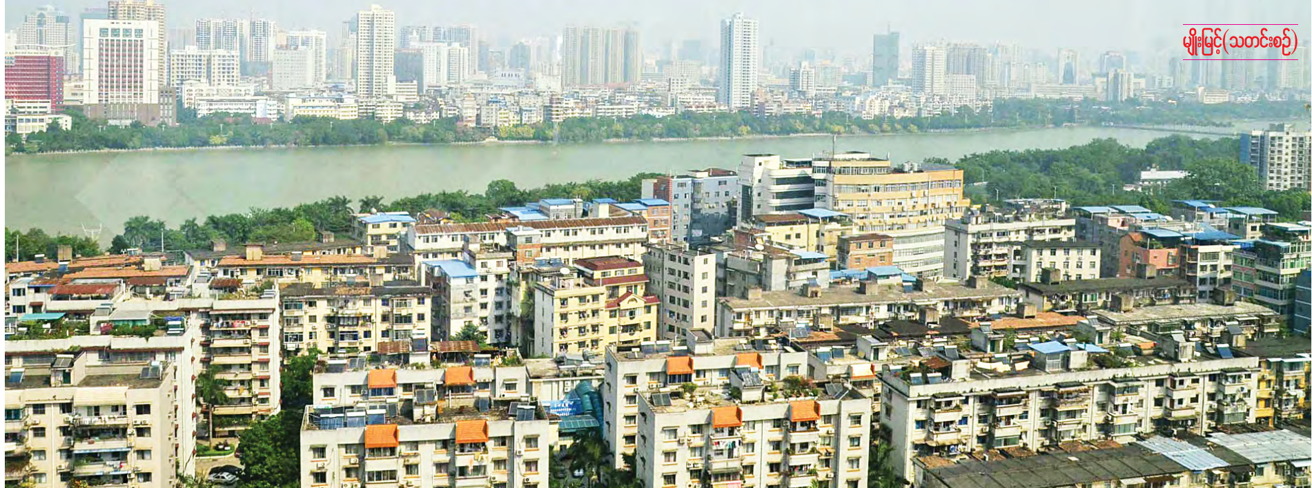
မျိုးမြင့်(သတင်းစဉ်)

တရုတ်ပြည်သူ့သမ္မတနိုင်ငံ နန်နင်းမြို့၌ကျင်းပသည့် (၄၅)ကြိမ်မြောက် ကမ္ဘာ့ကျွမ်းသားတံခွန်စိုက် အားကစားပြိုင်ပွဲဖွင့်ပွဲတက်ရောက်ခဲ့သည့် ပြည်ထောင်စုသမ္မတမြန်မာနိုင်ငံတော် ဒုတိယသမ္မတ ဒေါက်တာစိုင်းမောက်ခမ်း၏ ခရီးစဉ်တွင် စာရေးသူလည်း တာဝန်တစ်ခုဖြင့် လိုက်ပါခွင့်ရရှိခဲ့သည်။ နန်နင်းလေဆိပ်သို့ ခြေချလိုက်သည်နှင့် ပတ်ဝန်းကျင်တစ်ခုလုံးတွင် ရာဇဝင်ထဲသို့ဆွဲခေါ်သွားနိုင်သည့် ဂန္ဓလရာဇ်ဗိသုကာလက်ရာတို့က မရှိတော့၊ အစားထိုးဝင်ရောက်လာသည့် ၂၁ ရာစုအဆောက်အအုံများကို အစီအရီတွေ့ရသည်။ စာမျက်နှာ ၈ ကော်လံ ၁ သို့ *