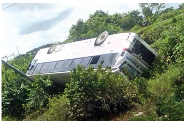
သက်ဦး(သထုံ)

ထိုးကျတိမ်းမှောက်ခဲ့ခြင်းဖြစ်သည် ထိုသို့ တိမ်းမှောက်မှုကြောင့် ယာဉ်ပေါ်ပါ ခရီးသည် ၃၅ ဦးအနက် ၁၃ ဦး ထိခိုက်ဒဏ်ရာများ (မစိုးရိမ် ရ) ရခဲ့သည်။ အဆိုပါဒဏ်ရာရရှိသူများ ကို တာဝန်ရှိသူများက ဘီးလင်းဆေးရုံ သို့ အရေးပေါ် ပို့ဆောင်ပေးခဲ့ပြီး ယာဉ်မဆင်မခြင် မောင်းနှင်သူ အောင်အောင်အား ဘီးလင်းရဲစခန်းမှ အမှုဖွင့်အရေးယူထားကြောင်း သိရသည်။