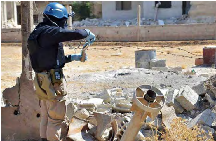
ဆီးရီးယားနိုင်ငံ၌ ဓာတုလက်နက်အသုံးပြုကာ တိုက်ခိုက်ခြင်း ရှိမရှိ နိုင်ငံတကာ စစ်ဆေးရေးဖွဲ့တစ်ဖွဲ့က စစ်ဆေးသည့် မှတ်တမ်းပုံ။