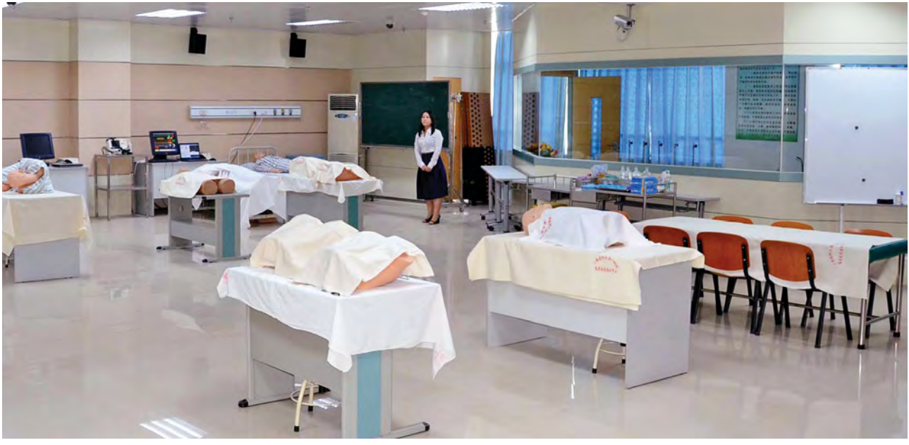
ကွမ်ရှီးဆေးတက္ကသိုလ်မှ လက်တွေ့သင်ကြားရေးပစ္စည်းများကို တွေ့ရစဉ်။

အလားတူ ခရီးစဉ်အတွင်း ကွမ်ရှီးဆေးတက္ကသိုလ်နှင့် ကွမ်ရှီးဆေးရုံတို့သို့လည်း သွားရောက်လေ့လာခဲ့သည်။ ယင်းဆေးရုံအနေဖြင့် ကွမ်ရှီးပြည်နယ်ရှိ ဒေသခံများသာမက မြန်မာနိုင်ငံအပါအဝင် အခြားနိုင်ငံများမှ ကျောင်းသားကျောင်းသူများလည်း ဆေးပညာလာရောက်သင်ကြားလျက်ရှိကြောင်း သိရသည်။ တက္ကသိုလ်၏ ကြီးမားလှသည့်အဆောက်အအုံ၊ သပ်ရပ်လှပသည့် အပြင်အဆင်တို့မှာ အားကျဖွယ်ရာပင်။ သင်ကြားရေးဆောင်တွင်လည်း လက်တွေ့