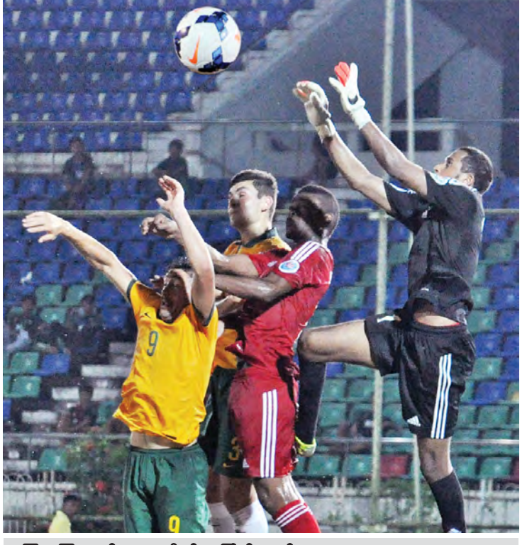
ဩစတြေးလျနှင့် ယူအေအီးတို့ အကြိတ်အနယ်။

သတင်း - ညိုမြတ်သော်တာ၊ စာတပ် - စိုးညွန့်