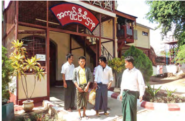
မိတ္ထီလာအကျဉ်းထောင်မှ လွတ်ငြိမ်းသက်သာခွင့်ရ အကျဉ်းသားအချို့ကို တွေ့ရစဉ်။

သည့်နှစ်မှာ (၁၉)နှစ်ဖြစ်ကြောင်း၊ ယခု (၁၆)နှစ်ပြည့်ပြီး လွတ်ငြိမ်းသက်သာ ခွင့်ဖြင့် ထွက်လာရသဖြင့် နိုင်ငံတော် အစိုးရကို ကျေးဇူးတင်ကြောင်း၊ ၎င်းမှာ ကျောက်မဲမြို့မှဖြစ်၍ ကျောက်မဲသို့ ဘယ်လိုပြန်ရမည်ကို စဉ်းစားနေ ကြောင်း၊ မိသားစုနှင့် အမြန်ဆုံး ပြန်တွေ့လို၍ မြန်မြန်ပြန်မည်ဖြစ် ကြောင်း လှိုက်လှိုက်လှဲလှဲ ပြောကြား သွားသည်။