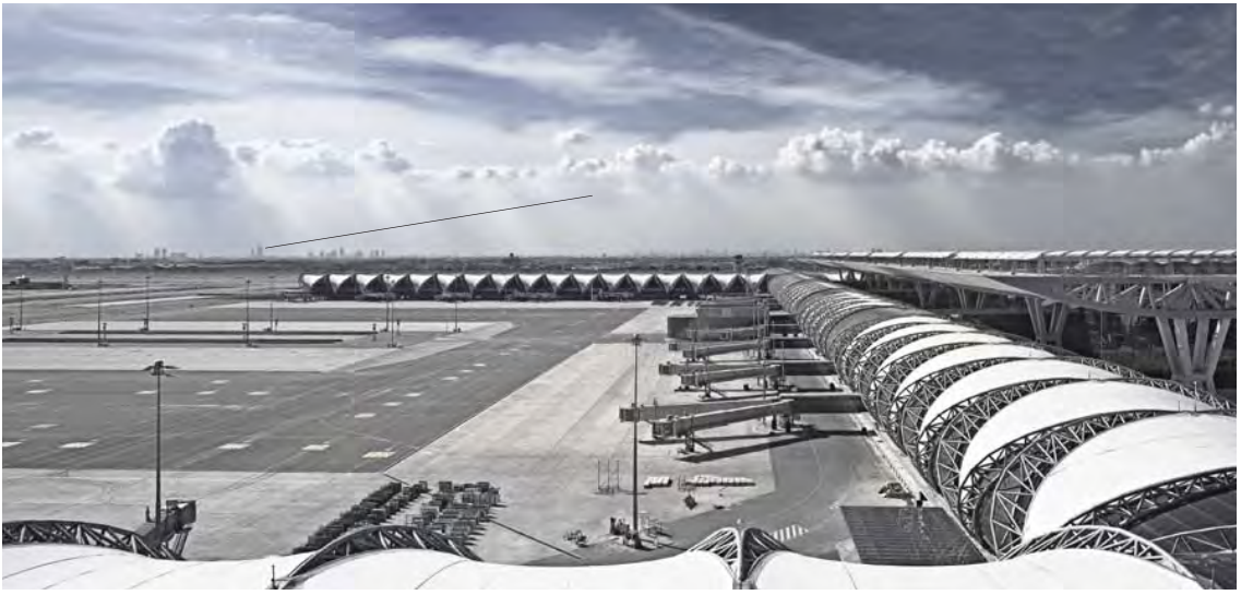
သုဝဏ္ဏဘူမိလေဆိပ်၏ လေယာဉ်ဆိုက်ရောက်ရာ အဆောက်အအုံကို တွေ့ရစဉ်။

သုဝဏ္ဏဘူမိလေဆိပ်ကို ၂၀၀၆ ခုနှစ်တွင် ဖွင့်လှစ်ခဲ့သည်။ ယင်းလေဆိပ်သည် တစ်နှစ်လျှင် ခရီးသည် ၄၅ သန်းခန့်အတွက် ဝန်ဆောင်ပေးရန် ရည်မှန်းခဲ့သော်လည်း လွန်ခဲ့သည့် နှစ်က ခရီးသည် သန်း ၅၀ ခန့်အထိ ဝန်ဆောင်ပေးခဲ့သည်။ ပီတီအိုင်။