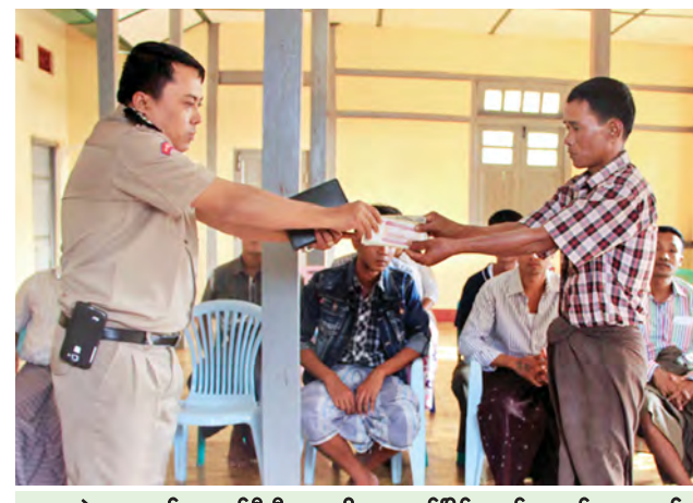
ပဲခူးအကျဉ်းထောင်ဦးစီးအရာရှိက လွတ်ငြိမ်းသက်သာခွင့်ရ အကျဉ်းသားများအား ထောက်ပံ့ပေးရိတ် ပေးအပ်စဉ်။

ဆောင်ရွက်နိုင်စေရန်အတွက် ပြစ်ဒဏ် မှ လျော့ပေါ့၍ လွတ်ပေးခဲ့ကြောင်း သိရသည်။ (နိုင်ထူး) အလားတူ တနင်္သာရီတိုင်းဒေသကြီး ထားဝယ်မြို့၊ ထားဝယ်အကျဉ်းထောင် တွင် ပြစ်မှုဆိုင်ရာ ကျင့်ထုံးဥပဒေ ပုဒ်မ (၄၀၁) ပုဒ်မခွဲ (၁) အရ အကျဉ်းသား အကျဉ်းသူ ၁၃ ဦးအား စက်တင်ဘာ ၇ ရက်တွင် လွတ်ငြိမ်းသက်သာခွင့် ပေးပြီး ထောက်ပံ့ကြေးငွေ တစ်ဦးလျှင် ကျပ် ၁၀၀၀ နှုန်းနှင့် လုပ်အားရှင် ကိုးဦးခံစားခွင့်ငွေများကို ပေးအပ်၍ လျှော့ရက်စနစ်ဖြင့် ကြိုတင်လွတ်သူ ဦးရေ သုံးဦး စုစုပေါင်း ၁၆ ဦးဖြစ်