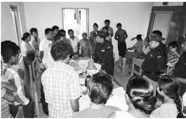
ဆားလင်းကြီး၊ အောက်တိုဘာ ၇

ယင်းမှာပင်ခရိုင်၊ ဆားလင်းကြီးမြို့နယ်၊ ဝက်မေး-ကံတောကျေးရွာသစ်နှင့် ဆည်တည်း-ဇီးတော ကျေးရွာသစ်များတွင် နိုင်ငံသားစိစစ်ရေးကတ်ပြားများ ပြုလုပ်ခြင်း၊ အိမ်ထောင်စုစာရင်းနှင့် မွေးစာရင်းတို့ခြင်း လုပ်ငန်းများ ကွင်းဆင်း ဆောင်ရွက်ခဲ့သည်။