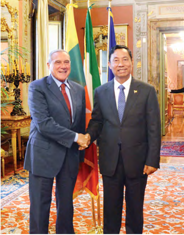
ပြည်ထောင်စုလွှတ်တော်နာယက ပြည်သူ့လွှတ်တော်ဥက္ကဋ္ဌ သူရဦးရွှေမန်း အီတလီနိုင်ငံ အထက်လွှတ်တော်ဥက္ကဋ္ဌ H.E.Mr.Pietro GRASSO နှင့် အမှတ်တရမှတ်တမ်းတင်စာတံပုံရိုက်စဉ်။ (သတင်းစဉ်)