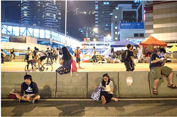
ပြန်လည်တည်ငြိမ်အေးချမ်းမှု ရရှိလာသော ဟောင်ကောင်ဒေသတစ်နေရာကို တွေ့ရစဉ်။

ထို့အတူပင် ရာ နှင့်ချီသော ဆန္ဒပြသမား များသည် မွန်ကောက် ပင်လယ်ဆိပ်ကမ်း အနီးတွင် စုဝေးနေခဲ့ကြသည်။ ဘီဘီစီ။