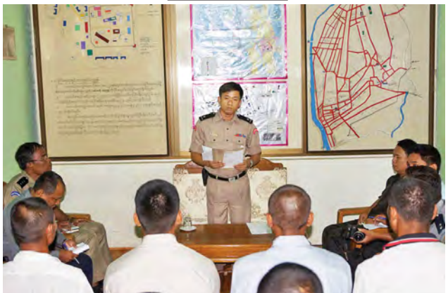
ထားဝယ်ထောင်မှူးက လွတ်ငြိမ်းသက်သာခွင့်ရ အကျဉ်းသားများအား ဆုံးမကြားပေးစကား ပြောကြားစဉ်။