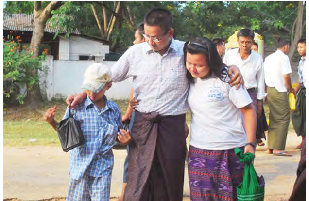
ရမည်းသင်းအကျဉ်းထောင်မှ လွတ်ငြိမ်းသက်သာခွင့်ရ အကျဉ်းသား များကို ကြိုဆိုသူများနှင့်အတူ တွေ့ရစဉ်။

နာရီခွဲတွင် လွှတ်မြောက်ရေးနှင့် အမျိုးသားမှတ်ပုံတင်ဦးစီးဌာနသို့ လွှဲပြောင်းပေးအပ်ခဲ့ကြောင်း သိရ သည်။ တစ်နိုင်ငံလုံးမှ ပြစ်ဒဏ်ကျသူ များ၌ နိုင်ငံခြားသားပြစ်ဒဏ်ကျခံရသူ ၅၈ ဦးရှိပြီး လားရှိုးအကျဉ်းထောင်မှ ပြစ်ဒဏ်ကျခံနေရသူ ၄၅ ဦး လွတ် မြောက်ကြောင်းသိရသည်။ ပြစ်ဒဏ်မှ ပြန်လည်လွတ်မြောက် လာသူ မြန်မာနိုင်ငံသားများအား လားရှိုးအမှတ်(၂) ရဲစခန်းတွင် ဒေသ ဖွံ့ဖြိုးရေးလုပ်ငန်းများနှင့် ပြည်သူ လူထု အကျိုးပြုလုပ်ငန်းများတွင် တက်ကြွစွာ ပါဝင်ကူညီဆောင်ရွက်နိုင် ရေး တိုက်တွန်း မှာကြားခဲ့ကြောင်း သိရသည်။ တန့်ဌေး(iprd)