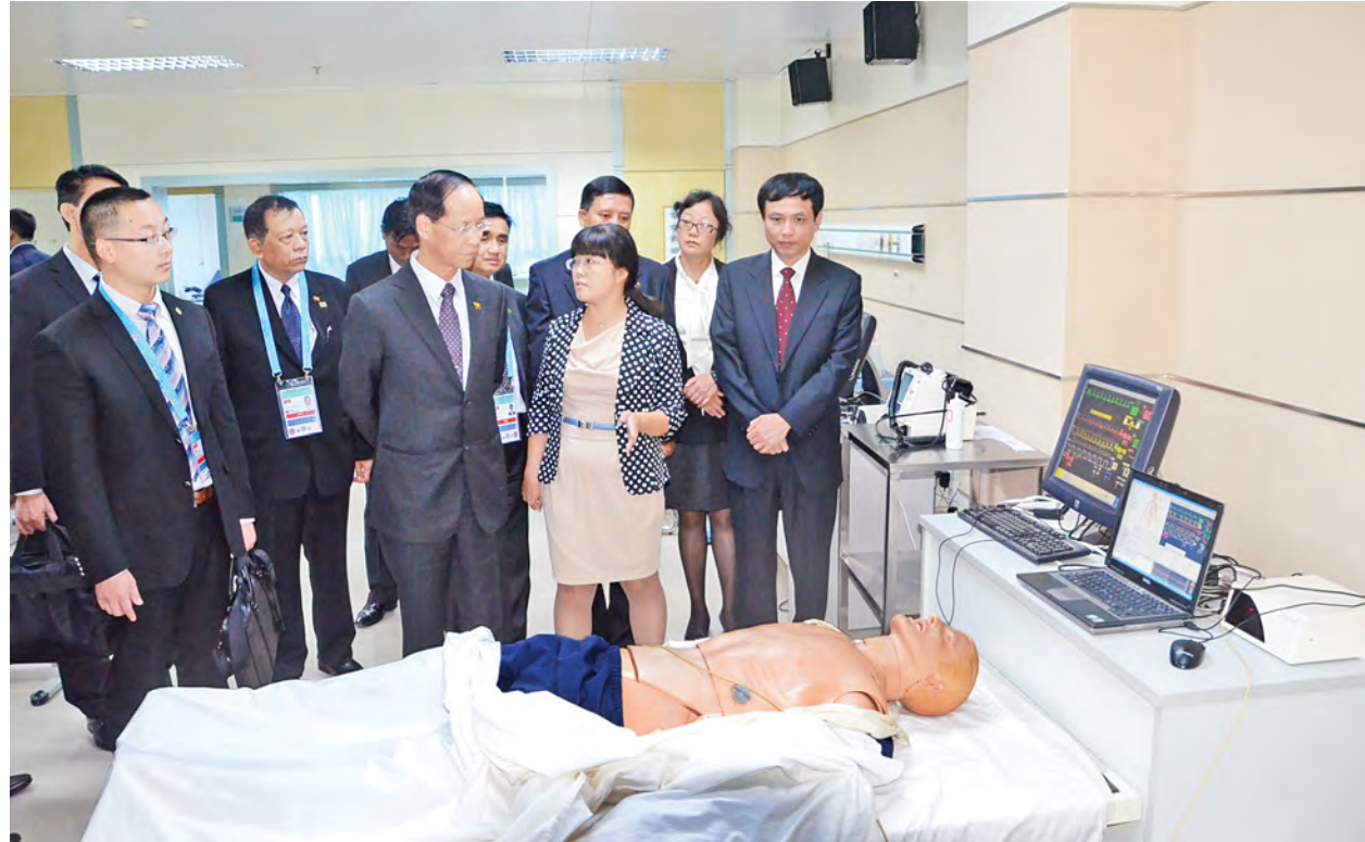
ဒုတိယသမ္ပတ ဒေါက်တာစိုင်းမောက်ခမ်း ကွမ်ရှီးဆေးတက္ကသိုလ်သို့ သွားရောက်ကြည့်ရှုလေ့လာစဉ်။