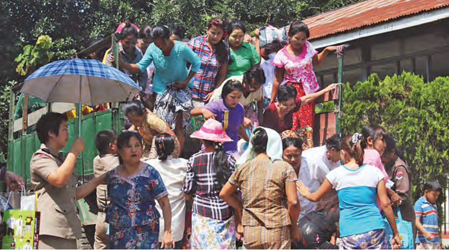
ရန်ကုန်မြို့ အင်းစိန်အကျဉ်းထောင်မှ လွတ်မြောက်လာသူများအား တွေ့ရစဉ်။ (ငွေ့အောင်)

အောက်တိုဘာ ၇ ရက်တွင် ပြစ်ဒဏ် လွတ်ငြိမ်းချမ်းသာခွင့်များ ပေးခဲ့ရာ ရန်ကုန်မြို့ အင်းစိန်အကျဉ်းထောင်မှ အမျိုးသား ၁၃၈ ဦး၊ အမျိုးသမီး ၃၉ ဦးတို့အား ယနေ့နံနက် ၈ နာရီမှ စတင်၍ လွတ်ပေးခဲ့ရာ အင်းစိန်အကျဉ်းဦးစီး မှုခိုင်းတွင် လာရောက်ကြိုဆိုကြသည့် မိသားစုဝင်များနှင့် သတင်းရယူကြမည့် မီဒီယာများမှ သတင်းထောက်များ စုည်းလျက်ရှိသည်။ အင်းစိန်အကျဉ်းထောင်မှ လွတ်ငြိမ်း သက်သာခွင့်ရသူများတွင် အမျိုးသား များကို သုံးသုတ်ခွဲ၍ လွတ်ပေးသလို အမျိုးသမီးများကို တစ်သုတ်တည်းဖြင့် လွတ်ပေးခဲ့ကြောင်းသိရပြီး အကျဉ်း ထောင်မှ လွတ်မြောက်လာသူများကို စာမျက်နှာ ၈ ကော်လံ ၁ သို့