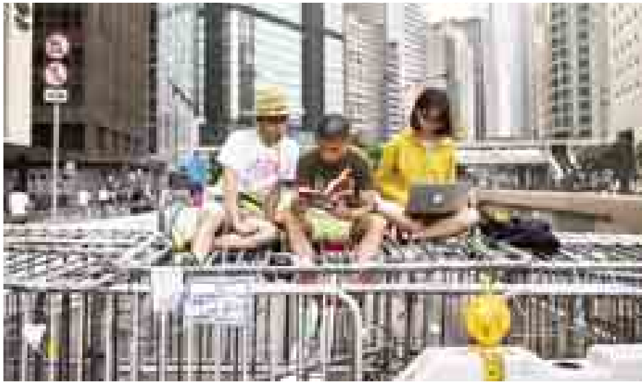
လွန်ခဲ့သည့်သီတင်းပတ်က ဆန္ဒပြမှု လူစုလူဝေး ဖြစ်ပေါ်ခဲ့သည့်နေရာ၌ ယခုအခါ ဆန္ဒပြသူများ လျော့နည်းသွားသည်ကို တွေ့ရစဉ်။