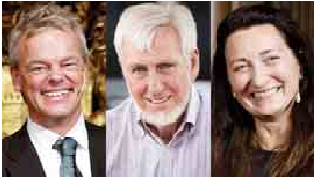
အဲလ်ဗတ်မိုဆာ၊ ဂျွန်အိုကီဖ်နှင့် မောရတ်မိုဆာ။