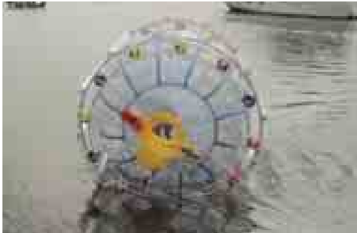
မီယာမီကမ်းခြေမှ ဘာမြူဒါသို့ လေဖြည့်ပလတ်စတစ်ပူဖောင်းဖြင့် ဖြတ်ကူးရန် ကြိုးပမ်းမှုကို တွေ့ရစဉ်။