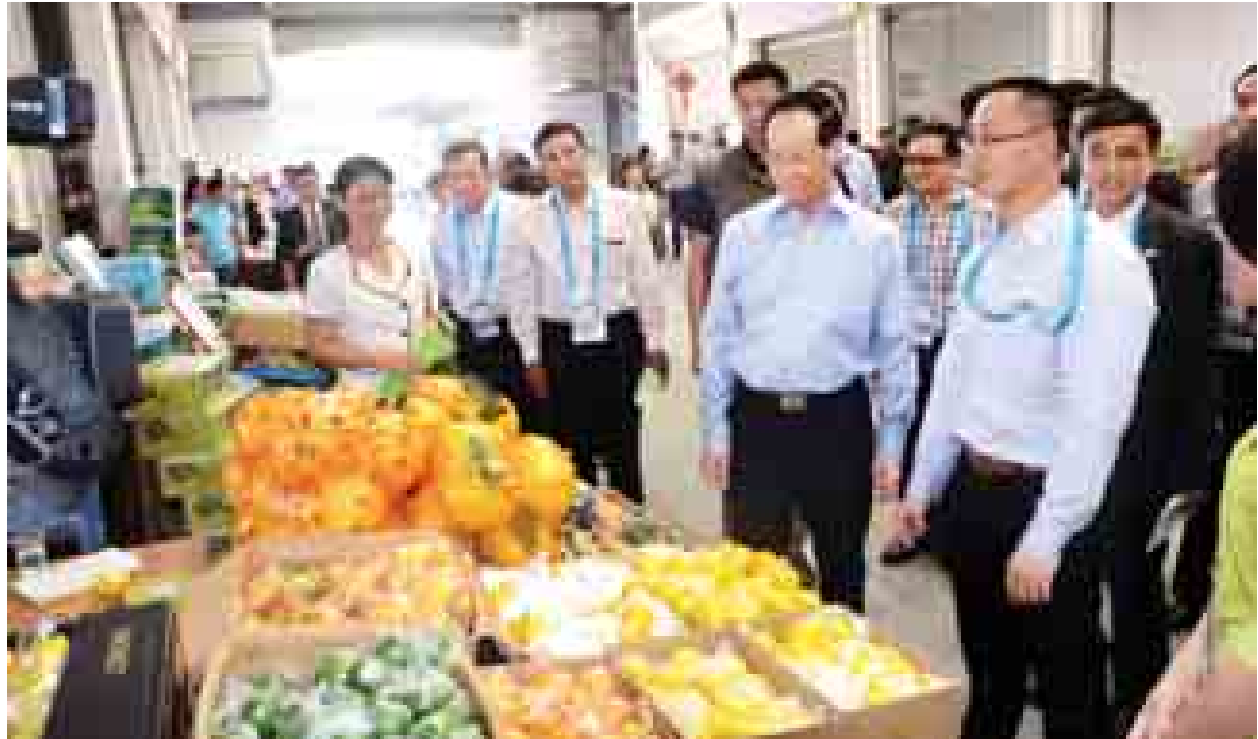
ဒုတိယသမ္မတ ဒေါက်တာစိုင်းမောက်ခမ်း သစ်သီးဝလံလက်ကားဈေးအတွင်း ရောင်းဝယ်နေမှုကို လိုက်လံကြည့်ရှုစဉ်။ (သတင်းစဉ်)

အခမ်းအနားတွင် အခြေခံပညာကျောင်းမှ ဆရာ ဆရာမများက တေးသီချင်းများဖြင့် သီဆိုဖျော်ဖြေ၍ အခမ်းအနားကို ဖွင့်လှစ်ပြီး တိုင်းဒေသကြီး လူမှုရေးဝန်ကြီး ဒေါ်ခင်စောမူက အမှာစကားပြောကြားသည်။ ထို့နောက် ကမ္ဘာ့ကုလသမဂ္ဂလက်အောက်ခံ အဖွဲ့ခေါင်းဆောင်များကပေးပို့သော ကမ္ဘာ့ဆရာများနေ့ သဝဏ်လွှာကို တိုင်းဒေသကြီး ပညာရေး ညွှန်ကြားရေးမှူးက ဖတ်ကြား၍ အခြေခံပညာကျောင်းမှ ဆရာ ဆရာမများက ဆရာကံတော့ ပွဲတေးသီချင်းများဖြင့် ဂုဏ်ပြုသီဆိုပြီး လူမှုရေးဝန်ကြီးနှင့် အဖွဲ့သည် ကမ္ဘာ့ဆရာများနေ့ အထိမ်းအမှတ် စာစီစာကုံး၊ ကဗျာပြိုင်ပွဲဆုရရှိသူများအား ဂုဏ်ပြုဆုများပေးအပ်ချီးမြှင့်ကြပြီး အထိမ်းအမှတ်ပြခန်းအတွင်း ကြည့်ရှုခဲ့ကြသည်။