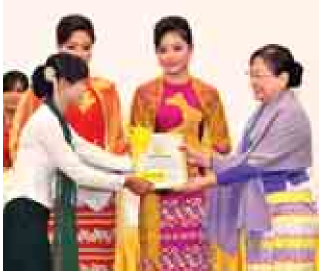
ပညာရေးဝန်ကြီးဌာန ပြည်ထောင်စုဝန်ကြီး ဒေါက်တာဒေါ်ခင်စန်းရီ ဂုဏ်ပြုဆုချီးမြှင့်စဉ်။ (သတင်းစဉ်)

အယောက် ၅၀ ကို ၂၀၁၄ ခုနှစ် စက်တင်ဘာလမှစတင်ပြီး ၂၀၁၆ ခုနှစ် မတ်လအထိ အင်္ဂလိပ်ဘာသာရပ် တိုးတက်စေရန် သွားရောက်ပို့ချစေ လျက်ရှိပါကြောင်း။ ဆရာ ဆရာမများအနေဖြင့် သင်ကြားပို့ချရသူဖြစ်သကဲ့သို့ အချိန် နှင့်အမျှ တိုးတက်ပြောင်းလဲနေသည့် ယနေ့ ခေတ်ကာလတွင် ဘာသာရပ်နှင့် နည်းပညာများကို မျက်ခြည်မပြတ် ကြစေဘဲ ဘဝတစ်သက်တာ သင်ယူ စရာအဖြစ် အစဉ်မပြတ် လေ့လာသင် ယူနေကြသူများလည်း ဖြစ်ကြရန် လိုအပ်ပါကြောင်း၊ စီးပွားရေးဖွံ့ဖြိုး တိုးတက်မှုကို ဦးတည်ပြီး ပညာရေးနှင့် စီးပွားရေးယှဉ်တွဲ အာရုံစိုက်သင်ကြား ပေးရန် လိုအပ်လာပါကြောင်း။ နိုင်ငံ၏ သဘာဝအရင်းအမြစ်များကို အခြေခံသည့် စီးပွားရေးစနစ်အစား အသိပညာနှင့် အတတ်ပညာ ကျွမ်းကျင် မှုကိုအခြေခံသည့် စီးပွားရေးစနစ်ကို ပြောင်းလဲလုပ်ကိုင်နိုင်စေရန် သင်ကြား ပေးရမည်ဖြစ်ပါကြောင်း၊ သို့မှသာ ရေရှည်တည်တံ့ပြီး ကမ္ဘာကိုဝင်ဆံ့နိုင် မည်ဖြစ်ပါကြောင်း၊ ၂၀၁၅ ခုနှစ်