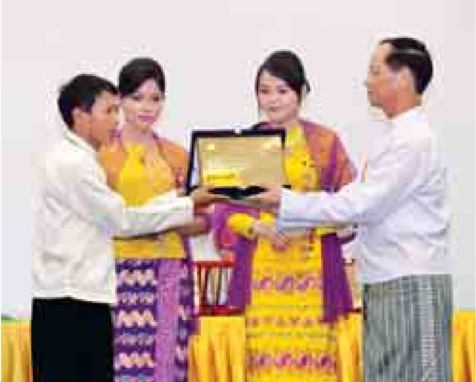
ဒုတိယသမ္မတ ဒေါက်တာစိုင်းမောက်ခမ်း လူမှုထူးချွန်ဆုရ ကျောင်းဆရာတစ်ဦးအား ဂုဏ်ပြုဆုပေးအပ် ချီးမြှင့်စဉ်။ (သတင်းစဉ်)

သန်းအောင်နှင့် ဒုတိယဝန်ကြီး ဒေါက်တာ ဇော်မင်းအောင်တို့က ၂၀၁၄ ခုနှစ် ကမ္ဘာ့ဆရာများနေ့ အထိမ်းအမှတ် ဆောင်းပါးပြိုင်ပွဲ၊ စာစီစာကုံးပြိုင်ပွဲနှင့် ကဗျာပြိုင်ပွဲများ တွင် ဆုရရှိကြသည့် ဆရာ ဆရာမ များနှင့် ကျောင်းသား ကျောင်းသူ