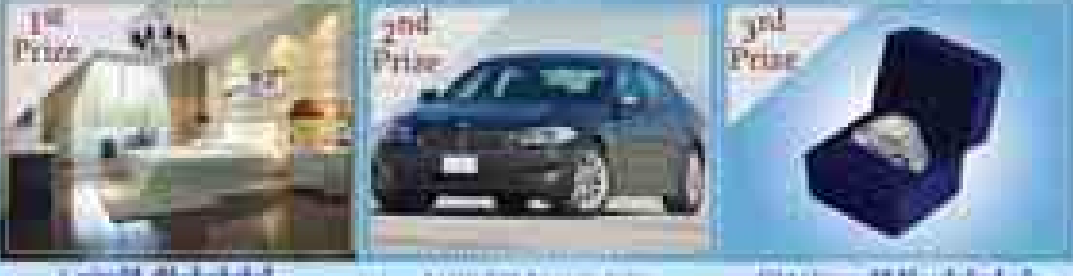
1st Prize: Kitchen, 2nd Prize: BMW 328i, 3rd Prize: GIA Gemstone

ကမ်းမဲ ပွင့်လှစ်ပေးမည့်နေ့ ၂၀၁၅ခုနှစ် ဝေပမိခါရီလ (၁၂)ရက်နေ့