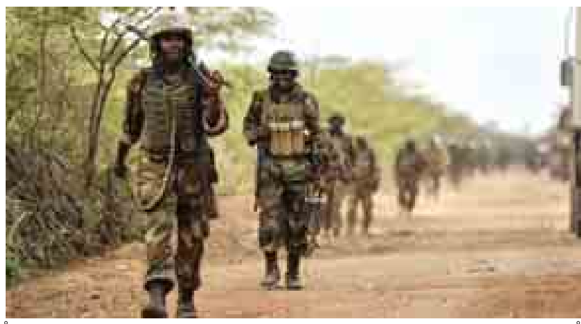
ဆိုမာလီနိုင်ငံ၌ လုံခြုံရေးတာဝန်ထမ်းဆောင်နေသည့် အာဖရိကသမဂ္ဂတပ်ဖွဲ့ဝင်များအား တွေ့ရစဉ်။