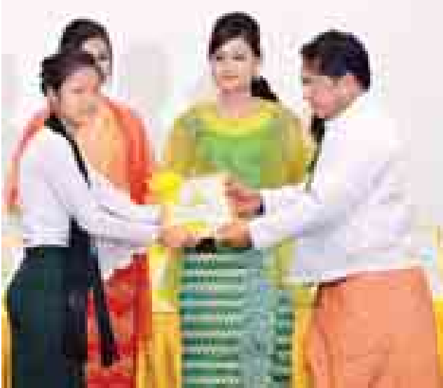
ကျန်းမာရေးဝန်ကြီးဌာန ပြည်ထောင်စုဝန်ကြီး ဒေါက်တာသန်းအောင် ဂုဏ်ပြုဆုချီးမြှင့်စဉ်။ (သတင်းစဉ်)

များအား ဂုဏ်ပြုဆုများ ပေးအပ်ချီးမြှင့် သည်။ ဆက်လက်၍ ဒုတိယသမ္မတ ဒေါက်တာစိုင်းမောက်ခမ်းသည် ၂၀၁၄ ခုနှစ် ကမ္ဘာ့ဆရာများနေ့အထိမ်းအမှတ် ဂုဏ်ထူးဆောင်ပုဂ္ဂိုလ်များဖြစ်ကြသည့် ဒေါက်တာခင်ဇော်၊ ဒေါက်တာ ဒေါ်သန်းနွဲ့၊ ဦးဝင်းမောင်၊ ဦးတင်ညို၊ ဦးပန်ကြီး၊ ဒေါ်ခင်ခင်နှင့် ဦးဟရန်းလင် တို့အားလည်းကောင်း၊ လူမှုထူးချွန်ဆုရ ရှိကြသည့်ဦးရွှေဘ၊ ဦးလှနူးနှင့် ဦးသန်း လှိုင်တို့အား လည်းကောင်း ဂုဏ်ပြုဆု များ ပေးအပ်ချီးမြှင့်ပြီး အခမ်းအနား သို့တက်ရောက်လာကြသည့် ဧည့်သည် တော်များနှင့်အတူ စုပေါင်း၍ မှတ်တမ်း တင်ဓာတ်ပုံရိုက်ကြသည်။ အခမ်းအနားအပြီးတွင် ဒုတိယ သမ္မတနှင့် ဧည့်သည်တော်များသည် ကမ္ဘာ့ဆရာများနေ့အထိမ်းအမှတ် ပြ ခန်းအား လှည့်လည်ကြည့်ရှုခဲ့ကြသည်။ (သတင်းစဉ်)