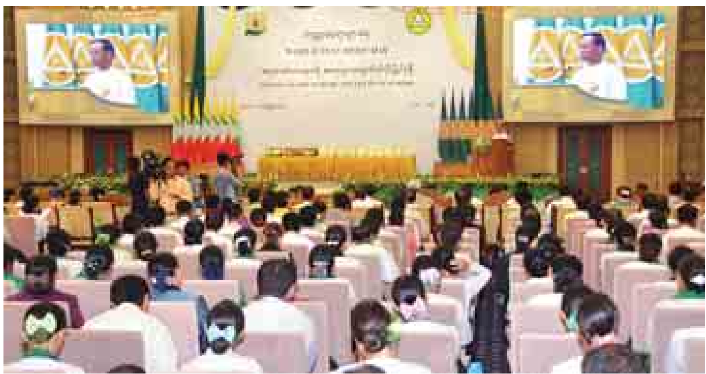
ဒုတိယသမ္မတ ဒေါက်တာစိုင်းမောက်ခမ်း ကမ္ဘာ့ဆရာများနေ့ အထိမ်းအမှတ်အခမ်းအနားတွင် အမှာစကားပြောကြားစဉ်။ (သတင်းစဉ်)

နေပြည်တော် အောက်တိုဘာ ၅ မျိုးဆက်သစ် လူငယ်များကို အသိအတတ်ပညာရှင် များဖြစ်စေရန် ပြုစုပေးပို့ထားသည့် ဆရာ ဆရာမ များ၏ ကြိုးပမ်းဆောင်ရွက်မှုကို လည်းကောင်း၊ လူ့အဖွဲ့ အစည်းတွင် ဆရာ ဆရာမများ၏ အခန်းကဏ္ဍသည် မရှိမဖြစ်အရေးပါမှုကို အသိအမှတ်ပြုသည့်အနေဖြင့် လည်းကောင်း၊ ပညာရေးလုပ်ငန်းများကို အဓိက အကောင် အထည်ဖော်ဆောင်ပေးနေသည့် ဆရာ ဆရာမများ၏ ကြိုးပမ်းသည့် တာဝန်နှင့် မွန်မြတ်သည့် ဂုဏ်အင်တို့ကို လည်းကောင်း အလေးထား ဂုဏ်ဖော်သည့်အနေဖြင့် ကမ္ဘာ့ ဆရာများနေ့ အထိမ်းအမှတ် အခမ်းအနားကို ယနေ့နံနက် ၁၀ နာရီတွင် နေပြည်တော်ရှိ မြန်မာအပြည်ပြည်ဆိုင်ရာ ကွန်ဗင်းရှင်းဗဟိုဌာန (MICC-II) ၌ ကျင်းပရာ ဒုတိယ သမ္မတ ဒေါက်တာစိုင်းမောက်ခမ်း တက်ရောက်ပြီး ဂုဏ်ထူး ဆောင် ပုဂ္ဂိုလ်များနှင့် လူမှုရေးထူးချွန်ဆုရ ဆရာများအား ဂုဏ်ပြုဆုများ ပေးအပ်ချီးမြှင့်သည်။ အဆိုပါ အခမ်းအနားသို့ ပြည်ထောင်စုဝန်ကြီး ဦးတင်နိုင်သိန်း၊ ဦးကျော်ဆန်း၊ ဒေါက်တာ ဒေါ်ခင်စန်းရီ၊ ဒေါက်တာသန်းအောင်၊ ဒုတိယဝန်ကြီးများ၊ ဌာနဆိုင်ရာ အကြီးအကဲများ၊ UNESCO မှ တာဝန်ရှိသူများ၊ ဂုဏ်ထူး ဆောင် ပုဂ္ဂိုလ်ကြီးများ၊ ဆုရရှိသော ဆရာ ဆရာမများ၊ ကျောင်းသား ကျောင်းသူများ၊ ဖိတ်ကြားထားသည့် ဧည့်သည်တော်များနှင့် တာဝန်ရှိသူများ တက်ရောက်ကြ သည်။ စာမျက်နှာ ၈ ကော်လံ ၁ သို့ □