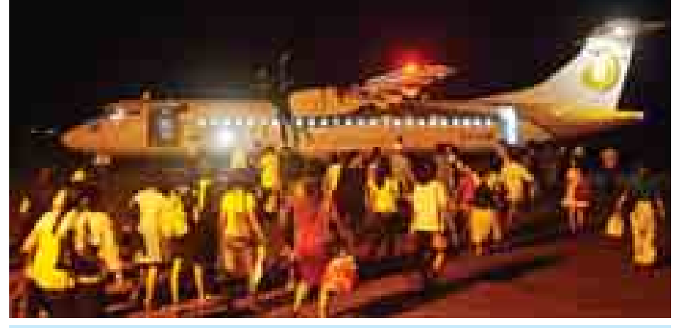
သံတွဲလေဆိပ်မှ ရန်ကုန်သို့ လိုက်ပါမည့် ခရီးသည်များအား တွေ့ရစဉ်။

စရိတ်သုံးဆမြင့်မားနေခြင်းကြောင့် LED မီးများကိုသာ အသုံးပြု ရန် ရွေးချယ်ခဲ့ခြင်းဖြစ်ကြောင်းသိရသည်။ အဆိုပါ LED မီး တပ်ဆင် မှုကြောင့် မန္တလေးမြို့ ဂုဏ်သိက္ခာကျဆင်းစေသော အပြုအမူ လုပ်ဆောင်နေသောစုံတွဲများနှင့် ကျုံးဘေးတွင် ညပိုင်းခိုးမှု၊ လူယက်မှုများ စသည့်မူဝါဒများကျဆင်းသွားမည်ဟု ဒေသခံများက ယုံကြည်ကြကြောင်းသိရသည်။ မန္တလေးမြို့ ကျုံးမြို့ရိုးပတ်လည်တွင် LED မီးတပ်ဆင်မှုကို ခန့်မှန်းခြေ ငွေကျပ်သိန်း ၃၈၈၀ ကျော် အကုန်အကျခံလုပ်ဆောင်သွားမည်ဖြစ်ကြောင်း သိရသည်။