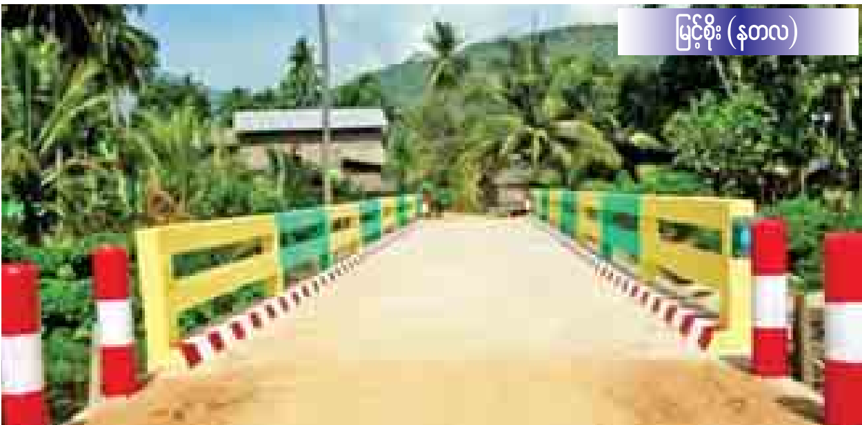
မြင့်စိုး (နတလ)

မြင်းလှည်းလေးနဲ့ ယဉ်ယဉ်ကျေးကျေးထိုင် xx မမတို့ မော်ရွှေမြိုင် xx မမတို့ မော်ရွှေမြိုင် xx သင်္ဘောသီးခွဲခြမ်းသဏ္ဍာန်လေး xx အမှန်ပြေးပါတဲ့ ဘတ်စ်ကားပေါ်က လှိုင် ဆိုသည့် အပိုဒ်တွင် ဘုံပြတ်ခေါ် မြင်းလှည်းကတော့ အညာဒေသမှာ နေထိုင်စဉ်ကောင်းစွာ မြင်ဖူး၊ စီးဖူးခဲ့သည်။ သင်္ဘောသီး ခွဲခြမ်းသဏ္ဍာန်လေး xx အမှန်ပြေးပါတဲ့ ဘတ်စ်ကားကတော့ ဘယ်လိုပုံမျိုးဖြစ် မည်လည်း မပြောတတ်တော့ပေ။ ယခုလည်းရှိမည် မဟုတ်တော့ပါ။