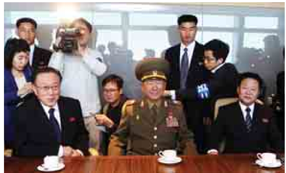
တောင်ကိုရီးယားနိုင်ငံ အင်ချွန်မြို့သို့ ရောက်ရှိနေသော မြောက်ကိုရီးယား အဆင့်မြင့်တာဝန်ရှိပုဂ္ဂိုလ်များကို တွေ့ရစဉ်။