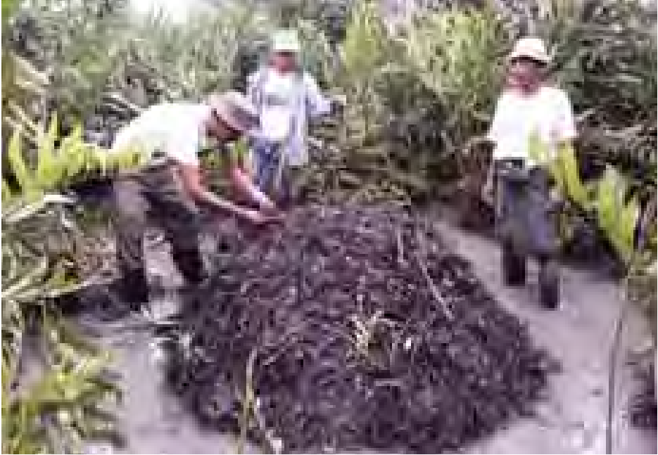
မိန်းမလှကျွန်းဘေးမဲ့တော၌ တွေ့ရှိရသည့် သဘာဝမိကျောင်းအသိုက်။

ဧရာဝတီတိုင်းဒေသကြီး ဘိုကလေး၊ မော်လမြိုင်ကျွန်း နှင့် လပွတ္တာနယ်များတစ်ဝိုက်၌ ရေငန်မိကျောင်း (Saltwater Crocodile) Crocodylus porosus မျိုးကို အတွေ့များသည်။ စင်စစ် အသားစားသောအလေ့အထ ရှိသည့် မိကျောင်းများသည် လူသူကင်းဝေးပြီး အစာ ရေစာဖြစ်သည့် သားငါး၊ ပုစွန်များရှိသော ရေချို၊ ရေငန်စပ် သစ်တောများ၊ ဒီရေတောများ၊ ချောင်းများအတွင်းသာ နေထိုင်လေ့ရှိပါသည်။ မိကျောင်းမျိုးများသည် သဘာဝ အလျောက် အစာကိုရှာဖွေစားသောက်ရာတွင် နေ့ အချိန်ထက် ညအချိန်၌ ပိုမိုလှုပ်ရှားရှာဖွေစားသောက် တတ်ကြသည်။ မိကျောင်းထီးများတွင် ပိုင်နက်နယ်မြေ အတွက် အချင်းချင်းရင်ဆိုင်တိုက်ခိုက်ပြီး ပိုင်နက်ပိုင်းခြား ကာ ကျက်စားသွားလာလှုပ်ရှားသည့် အလေ့အထရှိသည်။ မိကျောင်းမျိုးစိတ်များ၌ Crocodile နှင့် Alligator ကို အသိများကြပြီး ဦးခေါင်းပိုင်း၏ တည်ဆောက်ထားပုံအရ ခေါင်းရှည်နှင့် ခေါင်းတိုမျိုးဟူ၍ အရပ်ဘက်ကခေါ်ဝေါ် သုံးစွဲကြသည်။ Crocodile နှင့် Alligator မျိုးစိတ်တို့၏ ကွာခြားချက်မှာ ပါးစပ်ပိတ်ထားစဉ် Crocodile မျိုးစိတ် တွင် အောက်မေးရိုးရှိသွားနှင့် သွားစွယ်ကြီးကို ထင်ရှား စွာ တွေ့မြင်ရပြီး Alligator မျိုးစိတ်မူ မမြင်နိုင်ပါ။