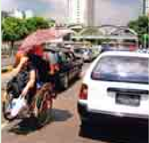
သော ဆူးလေဘုရားလမ်းနှင့် အနော်ရထာလမ်းဆုံတွင် နိုင်ငံ ခြားသားခရီးသည်နှစ်ဦးကို တင်ဆောင်စီးနင်းလာသော အနွေး ယာဉ်ဆိုက်ကားတစ်စီးကို တွေ့ခဲ့သည်။ (မောင်ကျောက်တံတား)

ရန်ကုန် အောက်တိုဘာ ၄ ယာဉ်အန္တရာယ်ကင်းရှင်းရေးအတွက် ရန်ကုန်မြို့တွင်း အနွေးယာဉ်(ဆိုက်ကားနှင့်စက်ဘီး)မဝင်ရ နယ်မြေအဖြစ် အရှေ့ဘက်တွင် သိမ်းဖြူလမ်း၊ အနောက်ဘက်တွင် လမ်းမတော် လမ်း၊ တောင်ဘက်တွင် ကမ်းနားလမ်းနှင့် မြောက်ဘက်တွင် ဝိုလ်ချုပ်အောင်ဆန်းလမ်းအထိ ယာဉ်စည်းကမ်းထိန်းသိမ်းရေး ကော်မတီမှ သတ်မှတ်ပေးထားကာ ကျူးလွန်ဖောက်ဖျက်သူ များကို စစ်ဆေးအရေးယူလျက်ရှိသည်။ ယခုအခါ ယာဉ် အသွားအလာထူထပ်များပြားပြီး ယာဉ်ကျောကျပ်တည်းနေချိန် တွင်ပင် အနွေးယာဉ်ဆိုက်ကားများသည် အန္တရာယ်ကိုမမူဘဲ သတ်မှတ် စည်းကမ်းဖောက်ဖျက်ကာ ခရီးသည်များတင်ဆောင် သွားလာနေသည်ကို နေ့စဉ် တွေ့နေရသည်။ ကျောက်တံတား မြို့နယ်၊ ပန်းဘဲတန်းမြို့နယ်၊ လသာမြို့နယ်တို့၏ အဓိက လမ်းမကြီးများတွင် နေရာယူဂိတ်ထိုးကာ ခရီးသည်များအား ပို့ဆောင်ပေးလျက်ရှိနေသည်ကိုလည်း တွေ့နေရသည်။ အောက်တိုဘာ ၂ ရက် နံနက် ၁၁ နာရီ ၅၇ မိနစ်က ရန်ကုန်မြို့လယ်ကောင် ယာဉ်အသွားအလာ ထူထပ်များပြား