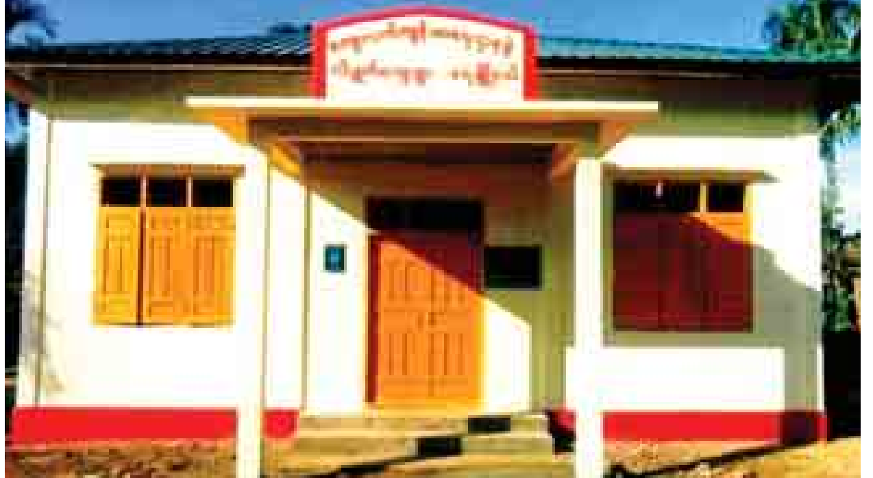
ရေးမြို့နယ် လိပျတ်ကျေးရွာ ကျေးလက်ကျန်းမာရေးဌာနခွဲ။

ဆိုခဲ့သည့်အတိုင်း မွန်ပြည်နယ် မွန်ဒေသသည် ကျွန်တော် အရောက် အပေါက်နည်းသော ပြည်နယ်ဒေသတစ်ခုဖြစ်ပါသည်။ သို့သော် ယင်းဒေသ သည်ပင်လျှင် ကျွန်တော်၏ယောက္ခမဖြစ်သူ ဒုတိယဗိုလ်မှူးကြီး ကျော်လွင် (ကျဆုံး)မိသားစု နှစ်ပေါင်းများစွာနေထိုင်လာခဲ့သော ဒေသဖြစ်၍ နေရာဒေသ တော်တော်များများ၏အကြောင်းကို ကြားဖူးနားဝရှိပြီးဖြစ်သည်။ နတလ လုပ်ငန်းများ တစ်နှစ်ပြီးတစ်နှစ် အရှိန်အဟုန်ဖြင့် ဆောင်ရွက်ပေးလျက်ရှိရာ အကြောင်းညီညွတ်ချိန်တွင် တစ်ကြိမ်မဟုတ်တစ်ကြိမ် ထပ်မံရောက်လိမ့်ဦး မည်ဟု ယုံကြည်မိပါသည်။ ရောက်လည်း ရောက်ဖူးချင်ပါသေးသည်။ ။