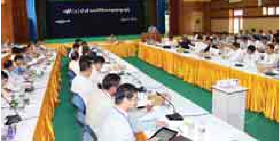
သတင်းမီဒီယာကဏ္ဍအား မြန်မာနိုင်ငံစာနယ်ဇင်းကောင်စီ(ယာယီ)နှင့် သတင်းမီဒီယာများမှ ဆွေးနွေးခြင်း၊ ထိုဆွေးနွေးရရှိမှုများအပေါ်မူတည်၍ ရှေ့လုပ်ငန်းစဉ်များ ပြုစုခြင်းနှင့်အပြန်အလှန်ဆွေးနွေးခြင်းတို့ကို ဆောင်ရွက်ကြမည်ဖြစ်ကြောင်း သိရသည်။ ယခုဆွေးနွေးပွဲကို ပြန်ကြားရေးဝန်ကြီးဌာန၊ Deutsche Welle နှင့် International Media Support တို့နှင့် ပူးပေါင်းကျင်းပခြင်းဖြစ်ကြောင်း သိရသည်။ (သတင်းစဉ်)

ဆွေးနွေးကြရာ တက်ရောက်လာကြသူများက မေးမြန်းဆွေးနွေးကြသည်။ အဆိုပါ ဆွေးနွေးပွဲကို မဏ္ဍိုင်သုံးရပ်မှ သက်ဆိုင်ရာတာဝန်ရှိသူများ ပြည်ထောင်စု ဝန်ကြီးဌာနများနှင့် တိုင်းဒေသကြီးပြည်နယ်တို့မှ သတင်းမီဒီယာဆိုင်ရာ တာဝန်ရှိသူများမြန်မာနိုင်ငံစာနယ်ဇင်းကောင်စီ (ယာယီ) နှင့် သတင်းမီဒီယာတို့မှ စုစုပေါင်း ကိုယ်စားလှယ် ၁၅၀ တက်ရောက်၍ ရင်းနှီးပွင့်လင်းစွာ ဆွေးနွေးကြသည်။ ဆွေးနွေးပွဲ ဒုတိယနေ့ကို အောက်တိုဘာ ၅ ရက်တွင် ဆက်လက်ကျင်းပမည်ဖြစ်ပြီး ဆွေးနွေးပွဲတွင်