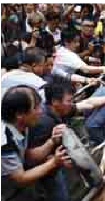
ဟောင်ကောင်၌ တာဝန်ထမ်းဆောင်နေကြသော ကုလသမဂ္ဂငြိမ်းချမ်းရေးထိန်းသိမ်းမှုတပ်ဖွဲ့ဝင်များကို တွေ့ရစဉ်။

Central အမည်ရှိ ဆန္ဒပြသူများအား ဟန့်တားရန် အစိုးရထောက်ခံသူအဖွဲ့ကို စေလွှတ်ကာ လမ်းမပေါ်ရှိ ဆန္ဒပြသူများကို လိုက်လံတိုက်ခိုက်ခဲ့ကြောင်း သိရသည်။ ထိုအစိုးရထောက်ခံသူအဖွဲ့သည် ဆန္ဒပြသူများ၏ နေရာများကိုလည်း ဖျက်ဆီးပစ်ခဲ့သည်။ ဆန္ဒပြကျောင်းသားခေါင်းဆောင်များသည် အစိုးရနှင့် တွေ့ဆုံဆွေးနွေးရန် ငြင်းပယ်ခဲ့ပြီးနောက် ၎င်းတို့အား တိုက်ခိုက်ရန် အစိုးရထောက်ခံသူအဖွဲ့ စေလွှတ်ခြင်းအပေါ် ရဲတပ်ဖွဲ့ဝင်များအား ပြစ်တင်ရှုတ်ချခဲ့ကြသည်။ ဆန္ဒပြသူများနှင့် ရဲတပ်ဖွဲ့ဝင်များ ရုန်းရင်းဆန်ခတ်ဖြစ်ပွားရာမှ ဆန္ဒပြသူ ၁၉ ဦး ဖမ်းဆီးခြင်းခံခဲ့ရသည်။ ဆန္ဒပြသူ ၁၂ ဦးနှင့် ရဲအရာရှိ ခြောက်ဦး ထိခိုက်ဒဏ်ရာရရှိခဲ့ကြောင်း သိရသည်။ ထို့ပြင် ဆန္ဒပြသူများနှင့် ဒေသခံပြည်သူများအကြား ပဋိပက္ခဖြစ်ပွားခဲ့သည်။ ဒေသခံပြည်သူများသည် ဆန္ဒပြသူများကြောင့် ၎င်းတို့၏ အလုပ်အကိုင်ပျက်စေသည်ဟု ထင်မြင်ယူဆကြသည်။ အလုပ်အကိုင်ပျက်၍ မကျေမနပ်ဖြစ်နေကြသည့် မြို့ခံများနှင့် ဆန္ဒပြသူများအကြား ထိပ်တိုက်ရင်ဆိုင်မှုများ ဆက်လက်ဖြစ်ပွားနေသည်။ ဆန္ဒပြလူစုလူဝေးကို ရှင်းလင်းရန် မြို့အာဏာပိုင်များသည် အစိုးရထောက်ခံသူများနှင့် ဒီမိုကရေစီဆန္ဒပြသူများကို ထိပ်တိုက်ရင်ဆိုင်တွေ့ဆုံခဲ့သည်ဆိုသည့် စွပ်စွဲချက်ကို ဟောင်ကောင် လုံခြုံရေးဆိုင်ရာ အကြီးအကဲ လိုင်တန်ကောက်က ပြင်းပြင်းထန်ထန် ငြင်းပယ်ခဲ့သည်။