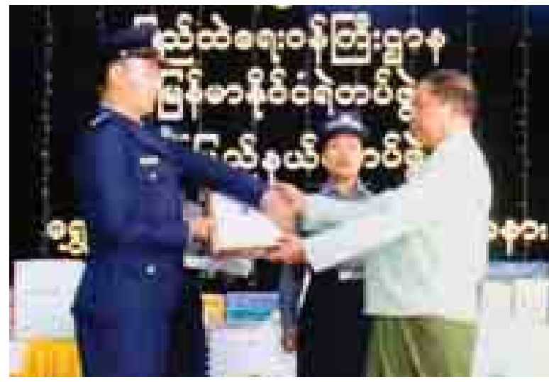
အောက်တိုဘာ ၁ ရက်က ကျင်းပသော မြန်မာနိုင်ငံရဲတပ်ဖွဲ့ နှစ်(၅၀)ပြည့် ရွှေရတနာပတ်လည်နေ့ အထိမ်းအမှတ်အခမ်းအနားတွင် မွန်ပြည်နယ်ရဲတပ်ဖွဲ့မှ မှုခင်းဖော်ထုတ်နိုင်မှုဆုရ ရဲတပ်ဖွဲ့ဝင်တစ်ဦးအား မွန်ပြည်နယ် ဝန်ကြီးချုပ် ဦးအုန်းမြင့် ဆုချီးမြှင့်စဉ်။ သိန်းလှိုင်(မော်လမြိုင်)