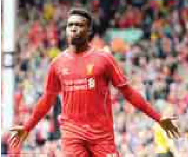
နေရာသီအပြောင်းအရွှေ့ကာလတွင် စပိန်လာလီဂါကလပ် ဘာစီလိုနာ အသင်းသို့ ပြောင်းရွှေ့သွားခဲ့ခြင်းကြောင့် လီဗာပူးအသင်းက အသစ်ခေါ်ယူ ထားခဲ့သည့် တိုက်စစ်မှူးဘာလော့တယ်လီနှင့်အတူ လီဗာပူးအသင်းအတွက် အကောင်းဆုံးကစားပေးရန် စိတ်ဆန္ဒပြင်းပြနေခဲ့သူဖြစ်သည်။

စတားရစ်ချ်သည် ၂၀၁၃-၂၀၁၄ ဘောလုံးရာသီအတွင်းက တိုက်စစ်မှူး ဆွာရတ်စ်နှင့်အတူ လီဗာပူးအသင်းအတွက် အကောင်းဆုံးကစားပေးနိုင်ခဲ့ သူဖြစ်ပြီး ဆွာရတ်စ်သည် ပြီးခဲ့သည့်ရာသီက လီဗာပူးအသင်းအတွက် သွင်း ဂိုး ၅၃ ဂိုးအထိ သွင်းယူပေးနိုင်ခဲ့သူဖြစ်သည်။ သို့ရာတွင် တိုက်စစ်မှူးဆွာရတ်စ်မှာ