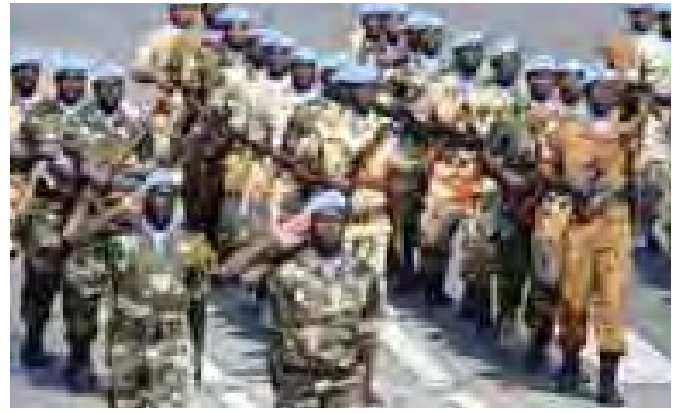
ဟောင်ကောင်၌ တာဝန်ထမ်းဆောင်နေကြသော ကုလသမဂ္ဂငြိမ်းချမ်းရေးထိန်းသိမ်းမှုတပ်ဖွဲ့ဝင်များကို တွေ့ရစဉ်။

လန်ဒန် အောက်တိုဘာ ၄ အိုင်အက်စ်စစ်သွေးကြွများက ဗြိတိသျှနိုင်ငံသား ဓားစာခံ အလန်ဟန်းနေးကို ခေါင်းဖြတ်သတ်ပြီး ရိုက်ကူးထားသော ဗီဒီယိုကို ထုတ်လွှင့်ခဲ့ကြောင်း ယနေ့ဘီဘီစီ သတင်းတွင် ဖော်ပြသည်။ ၎င်းသည် အငှားကားမောင်းသူတစ်ဦးဖြစ်သည်။ ဒီဇင်ဘာလတွင် ဆီးရီးယားနိုင်ငံ၌ အကူအညီပစ္စည်းများ ဝေငှနေစဉ် အိုင်အက်စ်စစ်သွေးကြွများ၏ ပြန်ပေးဆွဲပြီး ဓားစာခံအဖြစ် ဖမ်းဆီးမှုခံခဲ့ရခြင်းဖြစ်သည်။ လွန်ခဲ့သည့်လက ဗြိတိသျှနိုင်ငံသား ဒေးဗစ်ဟေးနက်(စ်)ကို သတ်ဖြတ်ခြင်းအား ပြသရာတွင် ၎င်းကို သတ်ပစ်မည်ဟု အိုင်အက်စ်တိုက ခြိမ်းခြောက်ခဲ့သည်။ ယခုဗီဒီယိုတွင် လည်း အမေရိကန်အကူအညီပေးရေး အလုပ်သမား ပီတာကက်ဆင်းကို သတ်ဖြတ်မည်ဟု ခြိမ်းခြောက်ထားသည်။ ဗြိတိသျှဝန်ကြီးချုပ် ဒေးဗစ်ကင်မရွန်းက လူသတ်သမားများကို ရှာဖွေဖမ်းဆီး၍ တရားခွင့်သို့ ပို့မည်ဟု ပြောကြားခဲ့သည်။