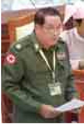
ပြည်ထဲရေးဝန်ကြီးဌာန ဒုတိယဝန်ကြီး ဗိုလ်မှူးချုပ်ကျော်ကျော်ထွန်း။

အောင်ကျော်မြတ်က လယ်ယာစိုက်ပျိုးရေးနှင့် ဆည်မြောင်းဝန်ကြီးဌာန အနေဖြင့် ဇီဝနည်းပညာထွန်းကားရေးအတွက် အာဆီယံဒေသအတွင်း နိုင်ငံများအပါအဝင် နိုင်ငံတကာနှင့် Biosafety ကဏ္ဍများအတွက် ချိတ်ဆက်ဆောင်ရွက်လျက်ရှိပါကြောင်း၊ ဇီဝနည်းပညာဆိုင်ရာ သုတေသနနှင့် ပညာရေးလုပ်ငန်းများကိုလည်း ဆောင်ရွက်လျက်ရှိပါကြောင်း၊ လက်တွေ့အသုံးပြု ဇီဝနည်းပညာဖွံ့ဖြိုးတိုးတက်လာစေရန်အတွက် ရေဆင်းစိုက်ပျိုးရေးတက္ကသိုလ်နှင့် ဂျပန်အပြည်ပြည်ဆိုင်ရာ ပူးပေါင်းဆောင်ရွက်ရေးအေဂျင်စီ (JICA) တို့ ပူးပေါင်း၍ Strengthening Human Resources and Agriculture Sector Development Project ကို ဆောင်ရွက်လျက်ရှိပြီး ဇီဝနည်းပညာဓာတ်ခွဲခန်းကိုလည်း တည်ဆောက်လျက်ရှိပါကြောင်း၊ ထိုနည်းတူ အိန္ဒိယသမ္မတနိုင်ငံနှင့် ပူးပေါင်းဆောင်ရွက်လျက်ရှိသည့် Advanced Center for Agriculture Research and Education (ACARE) ၏ New Genetics အပိုင်းတွင် ဇီဝ