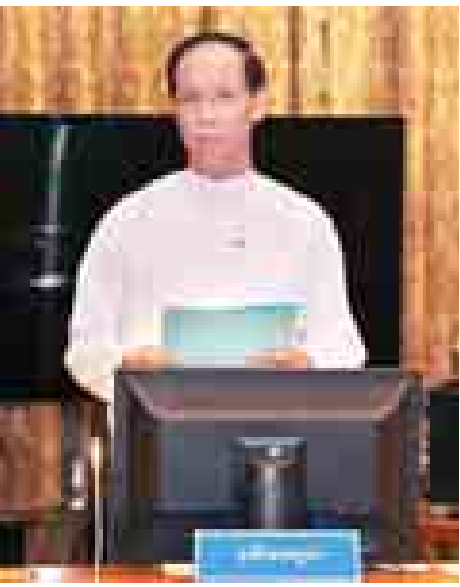
ဒုတိယသမ္မတ ဒေါက်တာစိုင်းမောက်ခမ်း အမှာစကားပြောကြားစဉ်။

အစိုးရ၏ကျန်ရှိသည့် သက်တမ်းကာလအတွင်း နိုင်ငံတော်နှင့်ပြည်သူလူထုအတွက် မြန်ဆန်ထိရောက်သော အကျိုးရလဒ် (Quick Win) ရရှိစေနိုင်မည့် ဖွံ့ဖြိုးတိုးတက်