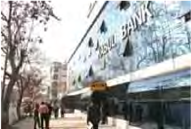
ဘဏ်လိမ်လည်မှု အရှုပ်တော်ပုံ ပေါ်ပေါက်ခဲ့သော ကဘူးဘဏ်ကိုတွေ့ရစဉ်။

ကာဇိုင်း၏ အစ်ကိုများမှာ အရေးယူမှုမှ ကင်းလွတ်ခွင့်ရရှိခဲ့ကြသည်။ ခိုးယူခြင်းခံရသည့် ဒေါ်လာ ၉၃၅ သန်း အနက်မှ ဒေါ်လာသန်း ၈၀၀ ယူခဲ့သည့် အမှုအတွက် ယမန်နှစ်က ပြစ်ဒဏ်စီရင်ချက်ချရာတွင် ဘဏ်တည်ထောင်သူ ရှာခန်ဖာဒတ်နှင့် အမှုဆောင်အရာရှိချုပ် (စီအီးအို)ဟောင်း ခါလီလူလာချ် ဖီရိုဇ်တို့မှာ ထောင်ဒဏ်ငါးနှစ်စီ အပြစ်ပေးခြင်းခံရသည်။ အဆိုပါ စီရင်ချက်သည် အမှုနှင့် နှိုင်းသော် ပြစ်ဒဏ်မှာ နည်းပါးသည်ဟု အဂတိလိုက်စားမှု စောင့်ကြည့်ရေးအဖွဲ့က ဝေဖန်သည်။ အခြား ၁၈ ဦးမှာ ထောင်ကျခံရသော်လည်း သမ္မတဟောင်း ကာဇိုင်း၏ အစ်ကိုများနှင့် ၎င်း၏ ဒုသမ္မတဟောင်း တစ်ဦးတို့သည် ခိုးယူထားသော ငွေများ ပြန်ပေးခဲ့ကြသဖြင့် တရားစွဲဆိုခံရခြင်းမှ ကင်းလွတ်ခွင့် ရရှိခဲ့ကြသည်။ ကမ္ဘာ့ဘဏ်မှ စီးပွားရေးပညာရှင်ဟောင်း ဖြစ်သည့် ဂါနီက ဘဏ်လိမ်လည်မှုကို စုံစမ်းစစ်ဆေးရန် အဖွဲ့သစ်ဖွဲ့စည်းမည်ဖြစ်ကြောင်း၊ မဲဆွယ်စဉ်က အဂတိလိုက်စားမှုများကို တိုက်ဖျက်မည်ဟု ပေးခဲ့သော ကတိကဝတ်ကိုဖြည့်ဆည်းပေးမှာဖြစ်ကြောင်းပြောကြားခဲ့သည်။