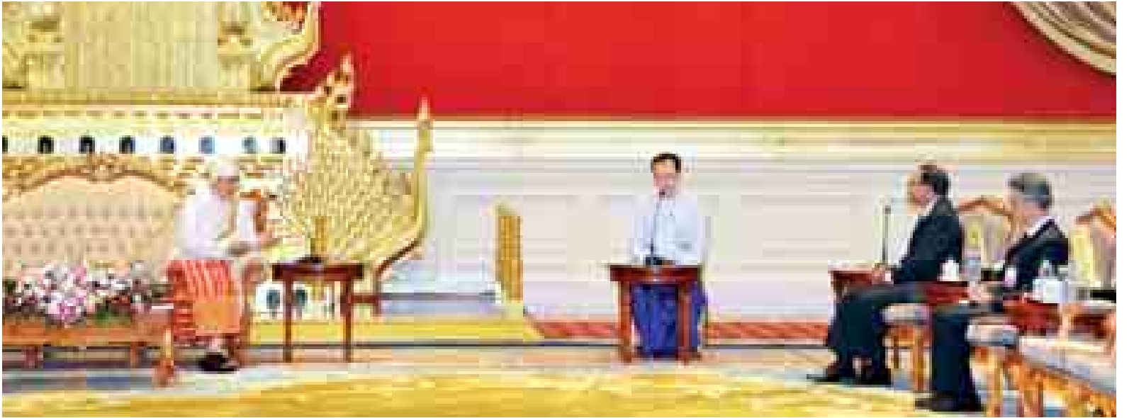
နိုင်ငံတော်သမ္မတ ဦးသိန်းစိန် မြန်မာနိုင်ငံဆိုင်ရာ ဘင်္ဂလားဒေ့ရှ်ပြည်သူ့သမ္မတနိုင်ငံ သံအမတ်ကြီး မစ္စတာ မိုဟာမက် ဆူဖီအူရ် ရာဟ်မာန်အား လက်ခံတွေ့ဆုံစဉ်။

နေပြည်တော် အောက်တိုဘာ ၂ ပြည်ထောင်စုသမ္မတ မြန်မာနိုင်ငံတော် နိုင်ငံတော်သမ္မတ ဦးသိန်းစိန်ထံ မြန်မာနိုင်ငံဆိုင်ရာ ဘင်္ဂလားဒေ့ရှ်ပြည်သူ့သမ္မတနိုင်ငံ သံအမတ်ကြီးအဖြစ် ခန့်အပ်ရန် သဘောတူညီပြီးဖြစ်သော သံအမတ်ကြီး မစ္စတာ မိုဟာမက် ဆူဖီအူရ် ရာဟ်မာန်သည် ယနေ့နံနက် ၁၁ နာရီတွင် နေပြည်တော်ရှိ နိုင်ငံတော်သမ္မတ အိမ်တော်၌ ၎င်း၏ သံအမတ်ခန့်အပ်လွှာကို ပေးအပ်သည်။ အဆိုပါ သံအမတ်ခန့်အပ်လွှာပေးအပ်ပွဲ အခမ်းအနားသို့ သမ္မတရုံး ဝန်ကြီးဌာန ပြည်ထောင်စုဝန်ကြီး ဦးသိန်းညွန့်၊ နိုင်ငံခြားရေးဝန်ကြီးဌာန ဒုတိယဝန်ကြီး ဦးသန့်ကျော်နှင့် သံတမန်ရေးရာဦးစီးဌာန ညွှန်ကြားရေးမှူးချုပ် ဦးသူရိန်သန့်ဇင်တို့ တက်ရောက်ကြသည်။ (သတင်းစဉ်)