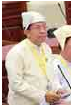
သိပ္ပံနှင့်နည်းပညာဝန်ကြီးဌာန ဒုတိယဝန်ကြီး ဒေါက်တာ အောင်ကျော်မြတ်။

နည်းပညာ၏ အခန်းကဏ္ဍများစွာပါဝင်မည်ဖြစ်ပါကြောင်း၊ မွေးမြူရေး၊ ရေလုပ်ငန်းနှင့် ကျေးလက်ဒေသဖွံ့ဖြိုးရေးဝန်ကြီးဌာနအနေဖြင့် ၁၉၉၃ ခုနှစ်တွင် တီရော့ကုန်ကျန်းမာရေးနှင့် ဖွံ့ဖြိုးရေးဥပဒေထုတ်ပြန်ခဲ့ပြီး မွေးမြူရေးလုပ်ငန်းများ ဖွံ့ဖြိုးတိုးတက်ရန် အသစ်ပေါ်ပေါက်လာသော နယ်စပ်မြတ်ကျော် တီရော့ကုန်ကျန်းမာရေးရောဂါများမှ ကြိုတင်ကာကွယ်ထိန်းချုပ်ရန် ပို့ကုန်၊ သွင်းကုန်ဆိုင်ရာ တီရော့ကုန်ထွက်ပစ္စည်းများ၏ Food Safety အတွက် လိုအပ်သောဥပဒေများဖြည့်စွက်သွားနိုင်ရန် ပြင်ဆင်ဆောင်ရွက်လျက်ရှိသည့် အပြင် မိတ်ဖက်ဝန်ကြီးဌာနများ၊ အစိုးရမဟုတ်သော အဖွဲ့အစည်းများနှင့် ပူးပေါင်း၍ ဖွဲ့စည်းနိုင်ရန် ဆောင်ရွက်လျက်ရှိပါကြောင်း၊ ကြက်ငှက်တုပ်ကွေးရောဂါ ကာကွယ်တားဆီးရေးနှင့် ထိန်းချုပ်ရေးအတွက် ၂၀၀၆ ခုနှစ်တွင် ပြင်းထန်သော ကြက်ငှက်တုပ်ကွေးရောဂါ H 5 N 1 အရေးပေါ် တုံ့ပြန်ရေးအစီအမံကို FAO နှင့် ပူးပေါင်းရေးဆွဲခဲ့ပြီး ၂၀၁၃ ခုနှစ်တွင် တရုတ်နိုင်ငံ၌ စတင်ဖြစ်ပွားပျံ့နှံ့လာသည့် H 7 N 9 ကြိုတင်ကာကွယ်ရေးအတွက် အရေးပေါ်တုံ့ပြန်