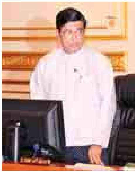
ဒုတိယသမ္မတ ဦးညက်ထွန်း အမှာစကားပြောကြားစဉ်။ (သတင်းစဉ်)

ရှင်းလင်းတင်ပြချက်များနှင့်ပတ်သက်၍ ဘဏ္ဍာရေး