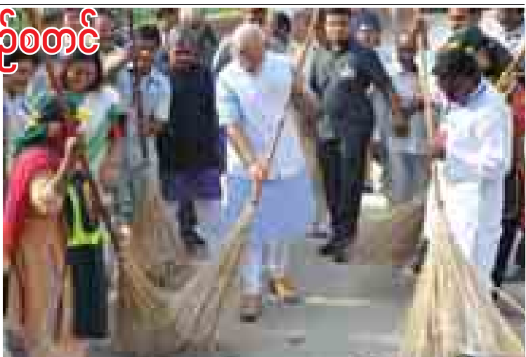
မြို့တော်နယူးဒေလီရှိ ဆင်းရဲသားရပ်ကွက်တစ်နေရာတွင် တံမြက်စည်းလှည်းနေသော အိန္ဒိယဝန်ကြီးချုပ် မိုဒီအား တွေ့ရစဉ်။

လူထုလှုပ်ရှားမှုအသွင်ဖြင့် သန့်ရှင်းရေး လုပ်ငန်းများကို လုပ်ဆောင်ခဲ့ကြသည်။ အောက်တိုဘာ ၂ရက်သည် လွတ်လပ်ရေး ခေါင်းဆောင်ကြီး မဟတ္တမဂန္ဒီ၏ ၁၄၅နှစ်မြောက် မွေးနေ့နှစ်ပတ်လည်နေ့ဖြစ်ပြီး အများပြည်သူအားလပ်ရက်ဖြစ်သည်။ သန့်ရှင်းသောနိုင်ငံ ထူထောင်ရေး လူထုလှုပ်ရှားမှု အစီအစဉ်ကို ငါးနှစ်ကြာ အကောင်အထည်ဖော်မည်ဖြစ်သည်။ ပီတီအိုင်။