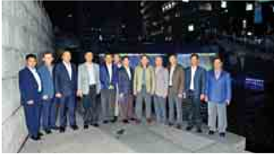
တပ်မတော်ကာကွယ်ရေးဦးစီးချုပ် ပိုလ်ချုပ်မှူးကြီးမင်းအောင်လှိုင်နှင့်အဖွဲ့ ဆိုးလ်မြို့ရှိ Namsan Tower ၌ အမှတ်တရ စုပေါင်းဓာတ်ပုံရိုက်စဉ်။ (မြဝတီ)

နေပြည်တော် စက်တင်ဘာ ၃၀ တပ်မတော်ကာကွယ်ရေးဦးစီးချုပ် ပိုလ်ချုပ်မှူးကြီးမင်းအောင်လှိုင်နှင့် အဖွဲ့သည် စက်တင်ဘာ ၃၀ ရက် ဒေသစံတော်ချိန် မွန်းလွဲ ၁ နာရီခွဲတွင် ကိုရီးယားသမ္မတနိုင်ငံ Demilitarized Zone (DMZ) သို့ ရဟတ်ယာဉ်ဖြင့် သွားရောက်လေ့လာ ကြည့်ရှုကြသည်။ ထို့နောက် တပ်မတော်ကာကွယ်ရေးဦးစီးချုပ်နှင့်အဖွဲ့သည် ကိုရီးယားစစ်သမိုင်းပြတိုက် War Memorial ကိုလည်းကောင်း၊ Defense Acquisition Program Administration (DAPA) ကို လည်းကောင်း သွားရောက်လေ့လာကြသည်။ ထို့ပြင် တပ်မတော်ကာကွယ်ရေးဦးစီးချုပ်နှင့်အဖွဲ့သည် စက်တင်ဘာ ၂၉ ရက် ညပိုင်းတွင် ဆိုးလ်မြို့ရှိ Namsan Tower ကို သွားရောက် ကြည့်ရှုလေ့လာခဲ့ကြသည်။