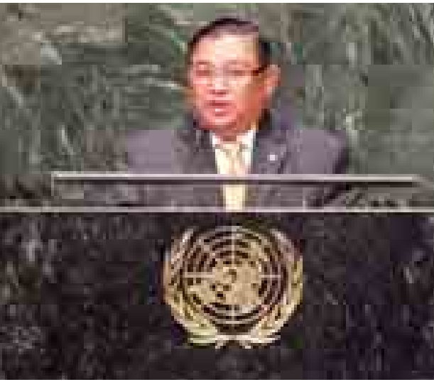
နိုင်ငံခြားရေးဝန်ကြီးဌာန ပြည်ထောင်စုဝန်ကြီး ဦးဝဏ္ဏမောင်လွင် (၆၉)ကြိမ်မြောက် ကုလသမဂ္ဂအထွေထွေညီလာခံ၌ မိန့်ခွန်းပြောကြားစဉ်။ (သတင်းစဉ်)

ဆောင်ရွက်ဖွယ်ရာ အများအပြားကို အကောင်အထည်ဖော်ဆောင်ရာမှ ကျွမ်းကျင်သူပိုင်းဆိုင်ရာ အကန့် အသတ်များလည်း ကြုံတွေ့နေရပါ ကြောင်း၊ ထိုအကန့်အသတ်များကို ကျော်လွှားသွားရန်လည်း သန္နိဋ္ဌာန် ချမှတ်ထားပါကြောင်း၊ မိမိတို့အနေ ဖြင့် ဒီမိုကရေစီအသိုက်အဝန်းတစ်ခု အတွက် ခိုင်မာသော အခြေခံများ ချမှတ်နိုင်ရန် စီးပွားရေးဖွံ့ဖြိုးတိုးတက် မှုနှင့် စွမ်းဆောင်ရည်တည်ဆောက် မှုတို့အတွက် ကြိုးပမ်းအားထုတ်မှု များကို နိုင်ငံတကာအသိုက်အဝန်း၏ သဘောပေါက်နားလည်မှုနှင့် ဆက် လက်ထောက်ခံမှုတို့ လိုအပ်ပါ ကြောင်း။ ပြည်တွင်းနှင့် နိုင်ငံတကာ၏ အာရုံ စူးစိုက်မှုရှိနေသည့် ကိစ္စတစ်ရပ်မှာ မြန်မာနိုင်ငံ၏ လက်ရှိဖွဲ့စည်းပုံ အခြေခံဥပဒေကို ပြင်ဆင်ရေးလုပ်ငန်း စဉ်ပင်ဖြစ်ပါကြောင်း၊ ထိုအတွက် ဖွဲ့ စည်းပုံအခြေခံဥပဒေပြင်ဆင်သုံးသပ် ရေး ပူးတွဲကော်မတီကို ပြည်ထောင်စု လွှတ်တော်က ဖြီးခဲ့သည့်နှစ် ဇူလိုင်လက ဖွဲ့စည်းပေးခဲ့ပါကြောင်း၊ ပြည်သူများ နှင့် နိုင်ငံရေးပါတီများ၏ အကြံပြုချက် များကို ရယူခဲ့ပါကြောင်း၊ အခြေခံပြီး ဖွဲ့စည်းပုံအခြေခံဥပဒေပြင်ဆင်ရေး ကို ဆောင်ရွက်နိုင်ရန် ဖွဲ့စည်းပုံ အခြေခံဥပဒေပြင်ဆင်မှု အကောင် အထည်ဖော်ရေးကော်မတီကို ဖွဲ့စည်း ခဲ့ပါကြောင်း။ ဒီမိုကရေစီ၏ အနှစ်သာရများကို လက်တွေ့ကျင့်သုံးသည့်အနေဖြင့် လွတ်လပ်ပြီး မျှတသော ရွေးကောက် ပွဲတစ်ရပ် အောင်မြင်စွာ ကျင်းပနိုင် ရေးအတွက် လိုအပ်သည့် အခြေခံများ ချမှတ်လျက်ရှိပါကြောင်း၊ ထိုကိစ္စနှင့် ပတ်သက်၍ ကုလသမဂ္ဂ၏ နိုင်ငံ ရေးရာဌာန၊ ရွေးကောက်ပွဲအကူအညီ ပေးရေးဌာနမှ လိုအပ်ချက်များ လေ့လာသုံးသပ်ရေး ကိုယ်စားလှယ် အဖွဲ့ မကြာသေးမီက မြန်မာနိုင်ငံသို့ လာရောက်ခဲ့ပါကြောင်း။ နိုင်ငံရေးပါတီများအနေဖြင့်လည်း ရွေးကောက်ပွဲသို့ ပါဝင်နိုင်မည်ဟု မျှော်လင့်ပါကြောင်း၊ နောက်ဆုံး အဆုံး