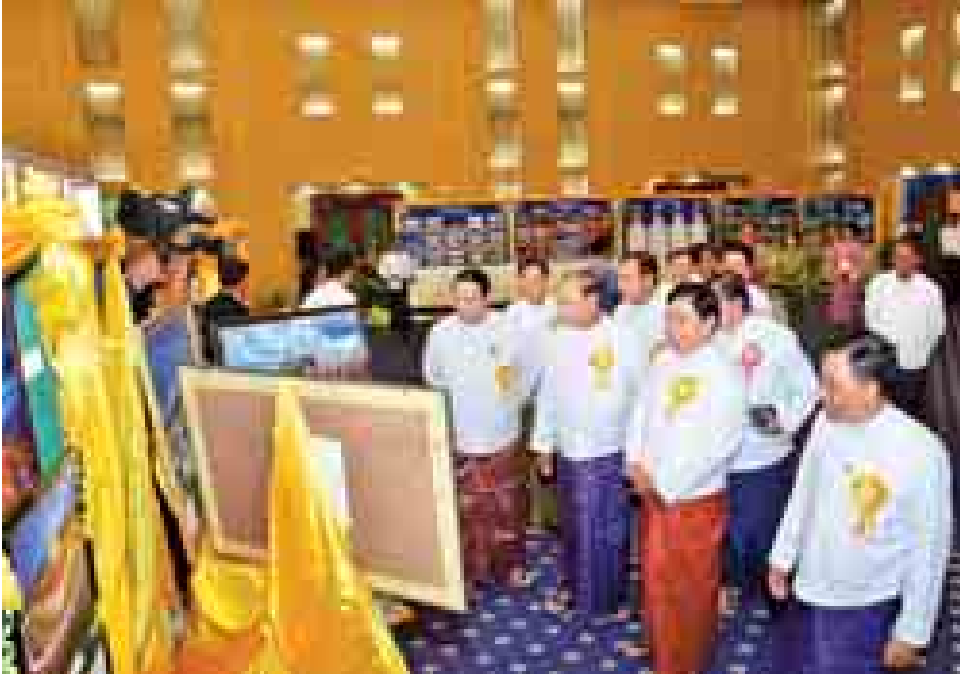
ကမ္ဘာ့ခရီးသွားလုပ်ငန်းနေ့အခမ်းအနားသို့ တက်ရောက်လာကြသော ပြည်ထောင်စုဝန်ကြီးများနှင့် ဧည့်သည်တော်များ ခင်းကျင်းပြသထားသည့် ဓာတ်ပုံမှတ်တမ်းများအား ကြည့်ရှုအားပေးစဉ်။ (သတင်းစဉ်)

ယင်းနောက် အခမ်းအနားတက်ရောက်လာသူများအား ယဉ်ကျေးမှုဝန်ကြီးဌာန အနုပညာဦးစီးဌာနက We are ASEAN တေးသီချင်းဖြင့် သီဆိုကပြဖျော်ဖြေကြသည်။ (သတင်းစဉ်)