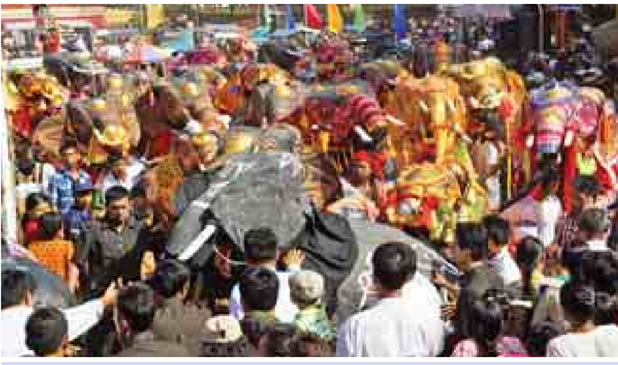
ကျောက်ဆည် ဆင်လှူပွဲတော်အား ကြက်ပျံမကျစည်ကားနေသည်ကို ယမန်နှစ်က ဤသို့ တွေ့ရစဉ်။

ကျောက်ဆည် စက်တင်ဘာ ၃၀ ကျောက်ဆည်မြို့တွင် နှစ်စဉ် သီတင်းကျွတ်လဆန်း ၁၄ ရက်နှင့် လပြည့်နေ့တို့တွင် ဆင်အကအလှနှင့် ဆင်ပြိုင်ပွဲများပါဝင်သော ဆင်လှူပွဲတော်ကို ကျင်းပလေ့ရှိသည်။ ကျောက်ဆည်မြို့ ဆင်လှူပွဲတော်သည် မြန်မာတစ်နိုင်ငံလုံးတွင် မည်သည့်အရပ်ဒေသတွင်မှ ကျင်းပခြင်းမရှိသော ထူးခြားသည့်ပွဲတော်တစ်ခုဖြစ်၍ ပွဲတော်ကာလတွင် အနယ်နယ်အရပ်ရပ်ရှိ ရပ်ဝေးရပ်နီးမှ ဧည့်ပရိသတ်များသာမက ကမ္ဘာလှည့်ခရီးသွားဧည့်သည်များပါ လာရောက်ကြသဖြင့် ကြက်ပျံမကျစည်ကားလှသော ပွဲတော်တစ်ခုဖြစ်သည်။ ရှေးယခင်က ဆင်လှူပွဲတော်ကို ဆွမ်းတော်ကြီးကပ်ပွဲတွင် မုန့်ရုပ်ဆင်များ ထည့်ဝင်လှူဒါန်းရာမှ အရုပ်ဆင်များ ပါဝင်လှူဒါန်းလာကြသည်။