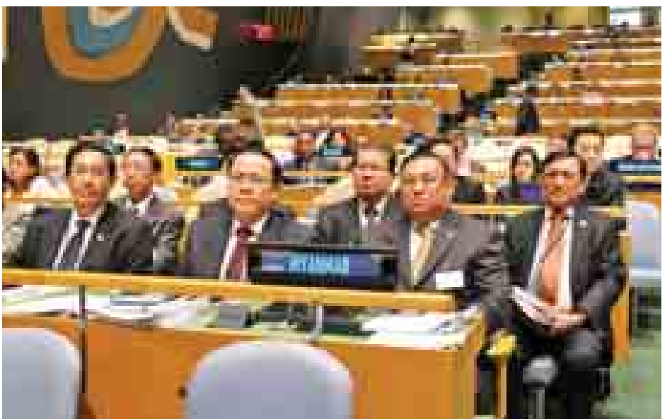
နိုင်ငံခြားရေးဝန်ကြီးဌာန ပြည်ထောင်စုဝန်ကြီး ဦးဝဏ္ဏမောင်လွင်နှင့် မြန်မာ့ကိုယ်စားလှယ်အဖွဲ့ (၆၉)ကြိမ်မြောက် ကုလသမဂ္ဂအထွေထွေ ညီလာခံသို့ တက်ရောက်စဉ်။