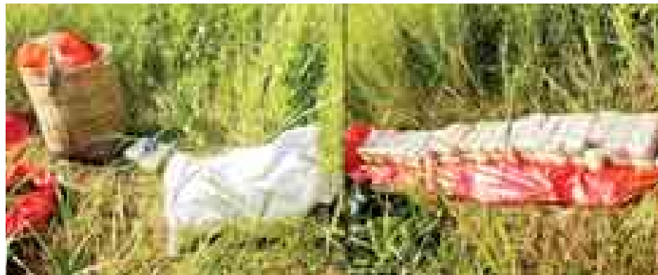
ပိုင်ရှင်မဲ့ သိမ်းဆည်းရမိသော စိတ်ကြွေးသွပ်ဆေးပြားများအား တွေ့ရစဉ်။

နှုန်းဖြင့် စုစုပေါင်းတန်ဖိုးငွေကျပ် ၁၂၃၆၀၀၀၀၀)အား ပိုင်ရှင်မဲ့သိမ်းဆည်းရမိသဖြင့် မြောက်ဦးမြို့မရဲစခန်းက မယ(ပ)/၂၀၁၄၊ မူးယစ်ဆေးဝါးနှင့် စိတ်ကိုပြောင်းလဲစေသော ဆေးဝါးများဆိုင်ရာ ဥပဒေပုဒ်မ ၁၉(က)အရ အမှုဖွင့်အရေးယူထားကြောင်း သတင်းရရှိသည်။ (သတင်းစဉ်)