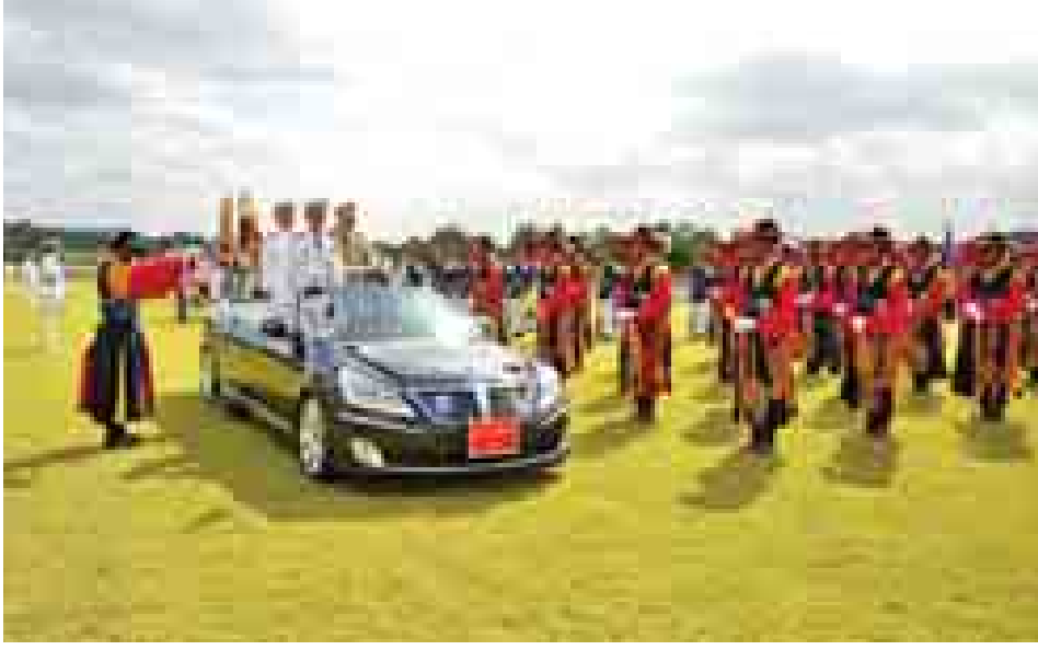
အပြန်အလှန် ချစ်ကြည်ရေးအလည်အပတ်ခရီးများ အပြန်အလှန်စေလွှတ်ခြင်း၊ လေ့ကျင့်ရေးနယ်ပယ်တွင် ပူးပေါင်းဆောင်ရွက်ခြင်းများ တိုးမြှင့်လုပ်ဆောင်လိုကြောင်း၊ ကိုရီးယားကျွန်းဆွယ်တည်ငြိမ်ရေးနှင့် ငြိမ်းချမ်းရေးဆိုင်ရာ ဆောင်ရွက်ချက်များကိုလည်း ထောက်ခံပါကြောင်း ပြောကြားသည်။ ကိုရီးယားတပ်မတော် ပူးတွဲစစ်ဦးစီးချုပ် ဥက္ကဋ္ဌ (Chairman of Joint Chiefs of Staff) Admiral Chol Yoon-hee က ပြောကြားရာတွင် နှစ်နိုင်ငံ သံတမန် ဆက်ဆံရေးတွင် စစ်ဘက်ဆက်ဆံရေးသည် အရေးကြီး သော ပဏာမခြေလှမ်းဖြစ်သည်ဟု ထင်မြင်ယူဆကြောင်း၊ စစ်ဘက်ဆက်ဆံရေးမြှင့်တင်နိုင်ရန် နည်းလမ်းရှာဖွေဆောင် ရွက်သွားမည်ဖြစ်ကြောင်း၊ လေ့ကျင့်ရေးနယ်ပယ်တွင်လည်း ပူးပေါင်းဆောင်ရွက်သွားမည်ဖြစ်ကြောင်း ပြောကြားသည်။

ယင်းနောက် တပ်မတော်ကာကွယ်ရေးဦးစီးချုပ် ဗိုလ်ချုပ်မှူးကြီးမင်းအောင်လှိုင်သည် ကိုရီးယားသမ္မတ နိုင်ငံ ကာကွယ်ရေးဝန်ကြီး Mr.Han Min-ko နှင့် ကာကွယ်ရေးဝန်ကြီးဌာန ဧည့်ခန်း၌ တွေ့ဆုံဆွေးနွေးခဲ့ သည်။