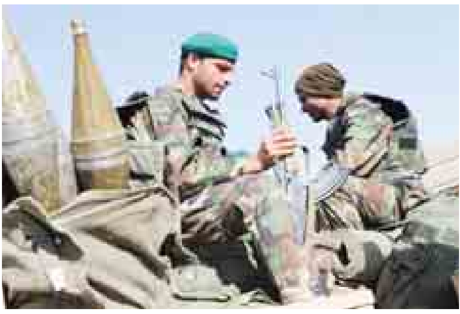
နယ်စပ်ဒေသလုံခြုံရေးအတွက် တာဝန်ထမ်းဆောင်နေကြသော အာဖဂန်တပ်ဖွဲ့ဝင်များအား တွေ့ရစဉ်။