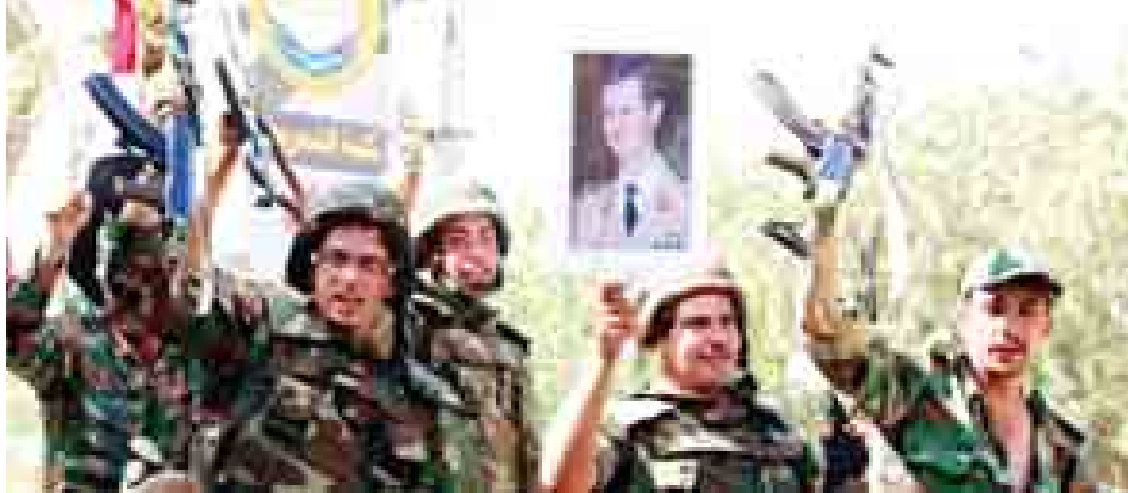
စစ်သွေးကြွများကို ချေမှုန်းနေသော ဆီးရီးယားအစိုးရတပ်ဖွဲ့ဝင်များကို တွေ့ရစဉ်။

ဆီးရီးယားနှင့် အီရတ်နိုင်ငံအတွင်း၌ ဆုံးရှုံးသွားသော နယ်မြေများ ပြန်လည် သိမ်းယူရန် လေကြောင်းအင်အားထက်ပို၍ လိုအပ်မှုများရှိနေသော်လည်း မြေပြင်တပ်ဖွဲ့ တွင် အမေရိကန်တို့ ပါဝင်မည်မဟုတ်ကြောင်း ဗိုလ်ချုပ်ကြီးက ပြောသည်။ ဘီဘီစီ။