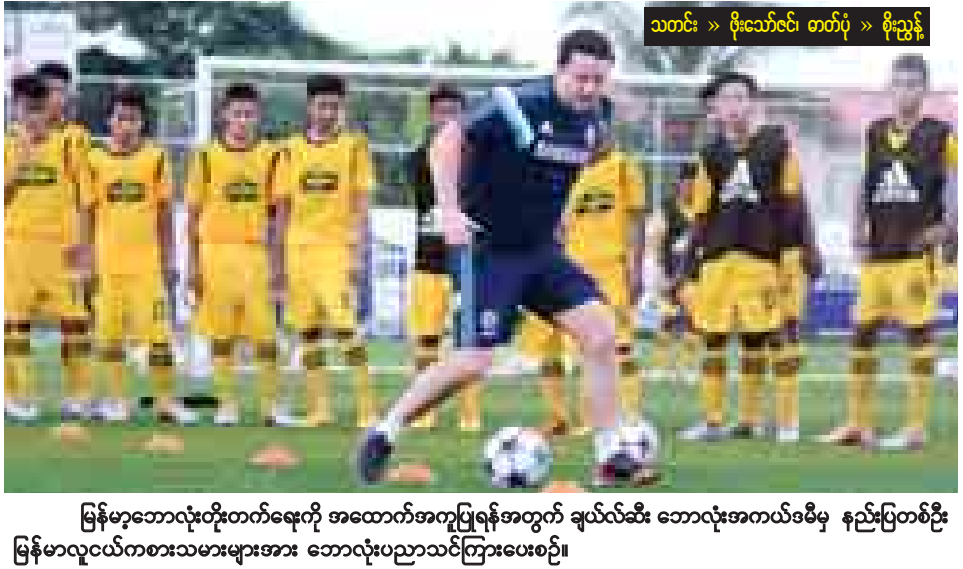
မြန်မာ့ဘောလုံးတိုးတက်ရေးကို အထောက်အကူပြုရန်အတွက် ချယ်လ်ဆီး ဘောလုံးအကယ်ဒမီမှ နည်းပြတစ်ဦး မြန်မာလူငယ်ကစားသမားများအား ဘောလုံးပညာသင်ကြားပေးစဉ်။

သတင်း >> ဝိုးသီလင်း စာတိုပုံ >> စိုးညွန့်