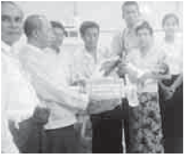
တင်နိုး(ပဲခူး)

ညနေပိုင်းက မိခင်ဆု ငွေကျပ် ငါးသိန်းကို ပေးအပ်ခဲ့ကြောင်း သိရသည်။ လူမှုဝန်ထမ်း ကယ်ဆယ်ရေးနှင့် ပြန်လည်နေရာချထားရေး ဝန်ကြီးဌာန၊ လူမှုဝန်ထမ်းဦးစီးဌာနသည် ကလေးသူငယ် စောင့်ရှောက်ရေး လုပ်ငန်းများဆောင်ရွက်ရာတွင် သုံးမြှားပွဲနှင့် ၎င်းအထက် မွေးဖွားသော မိခင်များအား မိခင်ဆုငွေ ထောက်ပံ့ပေးလျက်ရှိသည်။