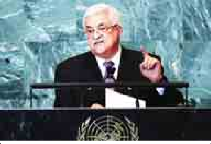
ကုလသမဂ္ဂအထွေထွေညီလာခံတွင် ပါလက်စတိုင်းအာဏာပိုင်အဖွဲ့ ဥက္ကဋ္ဌ မာမူတ်အဘတ်စ် မိန့်ခွန်းပြောကြားစဉ်။

ယင်းကဲ့သို့သော ဖြစ်ရပ်များ ၁၀၀ ကျော်ခန့်ရှိ ကြောင်း သတင်းတွင် ဖော်ပြသည်။ ဘီဘီစီ။