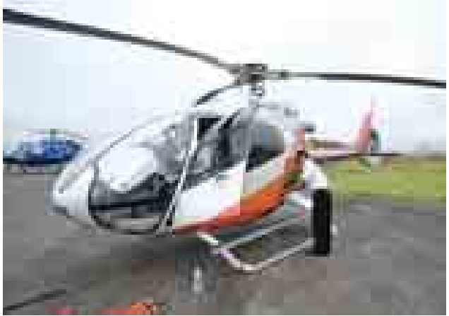
ပူတာအိုလေဆိပ်၌ တွေ့ရသော B4 ရဟတ်ယာဉ်တစ်စင်း။