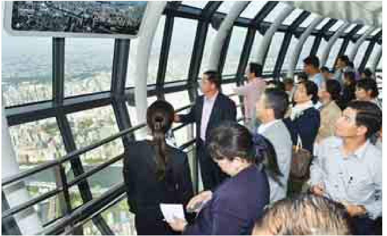
တပ်မတော်ကာကွယ်ရေးဦးစီးချုပ် ဗိုလ်ချုပ်မှူးကြီးမင်းအောင်လှိုင် Skytree မျှော်စင်ပေါ်မှ တိုကျိုမြို့၏ ရှမ်းခင်းကို ကြည့်ရှုလေ့လာစဉ်။