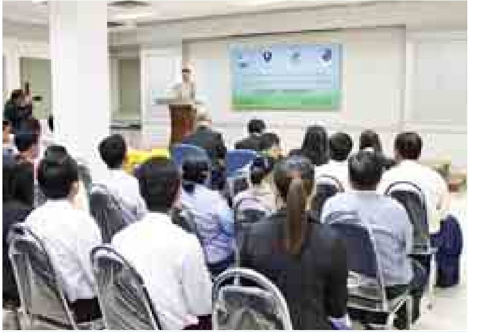
Foundations of Journalism and Radio Journalism Basics Workshop ပိတ်ပွဲအခမ်းအနားတွင် ပြန်ကြားရေးဝန်ကြီးဌာန ပြည်ထောင်စုဝန်ကြီး ဦးရဲထွဋ် အမှာစကားပြောကြားစဉ်။ (သတင်းစဉ်)

သင်တန်းသူများအား သင်တန်းဆင်းလက်မှတ်များ ပေးအပ်ကြသည်။ Foundations of Journalism and Radio Journalism Basics Workshop ကို စက်တင်ဘာ ၁၅ ရက်မှ ယနေ့အထိ နှစ်ပတ်ကြာ သင်တန်းပို့ချခဲ့ပြီး အသံလွှင့်ဌာနခွဲ၊ ရုပ်မြင်ဌာနခွဲ၊ တိုင်းရင်းသားလူမျိုးများ ရုပ်သံလိုင်းနှင့် တိုင်းရင်းသား (အသံလွှင့်)တို့မှ သင်တန်းသား သင်တန်းသူ စုစုပေါင်း ၂၀ တက်ရောက်ခဲ့သည်။ သင်တန်းတွင် သတင်းရေးသားပုံ ရေးသားနည်းများ၊ သတင်းထောက်များလိုက်နာသင့်သည့် အချက်များ၊ စာနယ်ဇင်းကျင့်ဝတ်များ၊ ရုပ်သံထုတ်လွှင့်မှုပိုင်းဆိုင်ရာ အခေါ်အဝေါ်များ၊ အသံဖမ်းခြင်း၊ အသံတည်းဖြတ်ခြင်းများ၊ တွေ့ဆုံမေးမြန်းခန်းများ၊ ပြင်ပသတင်းရယူထုတ်လွှင့်မှုများ စသည့် သင်ခန်းစာများကို စာတွေ့လက်တွေ့ သင်ကြားခဲ့ကြောင်း သတင်းရရှိသည်။ (သတင်းစဉ်)