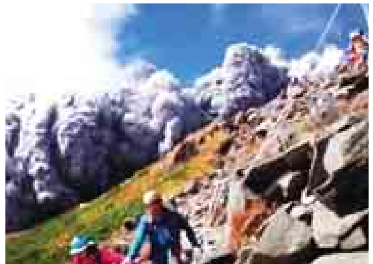
ဂျပန်နိုင်ငံအလယ်ပိုင်းရှိ အွန်တာကီမီးတောင် ပေါက်ကွဲရာ တောင်တက်သမားများ ဘေးလွတ်ရာသို့ ထွက်ပြေးကြရစဉ်။