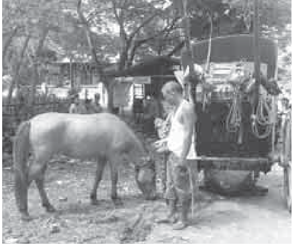
အလတ်နှင့် အောက်ခြေပြည်သူအချို့ကလည်း ဆိုင်ကယ်စီးလျက်ရှိကြရာ မြင်းလှည်းကို အဓိကထား၍ ကုန်သည်ယူခြင်းနှင့် လူစီးနေကြသည့် ပဲခူး၊ မန္တလေး၊ ပြင်ဦးလွင်၊ မိတ္ထီလာ၊ ပုဂံ၊ ညောင်ဦးနှင့် ပခုက္ကူ စသည်မြို့များတွင် မြင်းလှည်းများ လျော့နည်း ပျောက်ကွယ်စပြုနေပြီဖြစ်သည်။

ဖျာပုံ၊ စက်တင်ဘာ ၂၇ - သုံးဘီးဆိုင်ကယ်၊ ထော်လာဂျီနှင့် ဆိုင်ကယ် ကယ်ရီများ မြင်းလှည်းလမ်းကြောင်းများတွင် မောင်းနှင်ပြေးဆွဲလာမှုကြောင့် မြင်းလှည်းမောင်းသူနှင့် မြင်းလှည်းပိုင်ရှင်တို့ စီးပွားရေးတွက်ခြေမကိုက်၍ အခက်အခဲဖြစ်နေကြောင်း သိရသည်။