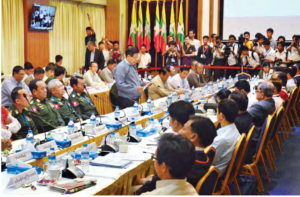
သမ္မတကြီး ဦးသိန်းစိန် ထားရှိသည့် ငြိမ်းချမ်းရေး ကတိကဝတ်များကို ကျေပွန်စွာအစဉ်ကြိုးပမ်းဆောင်ရွက်နေပါကြောင်းဖြင့် နှုတ်ခွန်းဆက် အမှာစကားပြောကြားခဲ့သည်။ ယင်းနောက် တစ်နိုင်ငံလုံးဆိုင်ရာ အပစ်အခတ်ရပ်စဲရေး ညှိနှိုင်းမှုကော်မတီ(NCCT) အဖွဲ့ခေါင်းဆောင်

ထို့နောက် ပြည်ထောင်စုငြိမ်းချမ်းရေးဖော်ဆောင်ရေးလုပ်ငန်းကော်မတီ ဒုတိယဥက္ကဋ္ဌ ပြည်ထောင်စုဝန်ကြီးဦးအောင်မင်းက ယနေ့ထုတ်ပြန်ကြေညာချက်မှာ ပါဝင်သည့်အတိုင်း မိမိတို့အနေဖြင့် (၇)ကြိမ်မြောက် တွေ့ဆုံဆွေးနွေးပွဲများကို ဆက်လက်ကျင်းပသွားရမှာဖြစ်ကြောင်း၊ ကြားကာလများတွင်လည်း အလုပ်အဖွဲ့အချင်းချင်း တွေ့ဆုံဆွေးနွေးမှုများ၊ အလွတ်သဘောတွေ့ဆုံဆွေးနွေးမှုများကိုလည်း ကြိုတင်ပြင်ဆင်မှုများအဖြစ် ဆောင်ရွက်သွားမည်ဖြစ်ပါကြောင်း၊ မိမိအနေဖြင့် (၇)ကြိမ်မြောက် ပြုလုပ်မည့် ဆွေးနွေးပွဲတွင် တစ်နိုင်ငံလုံးအတိုင်းအတာ ပစ်ခတ်တိုက်ခိုက်မှုရပ်စဲရေး သဘောတူညီချက်အတွက် အပြီးသတ်သဘောတူညီမှုများ ရရှိနိုင်လိမ့်မည်ဟု မျှော်လင့်ပါကြောင်း။ ယခုကဲ့သို့ တွေ့ဆုံဆွေးနွေးသည့် ယဉ်ကျေးမှုခိုင်မာလာခြင်းသည် လက်နက်ကိုင်အကြမ်းဖက်မှုများပပျောက်စေရန် အကောင်းဆုံးနည်းလမ်းဟု ခံယူပါကြောင်း၊ မိမိတို့အနေဖြင့် ပြည်သူ့လူထုအပေါ်တွင် နိုင်ငံတော်