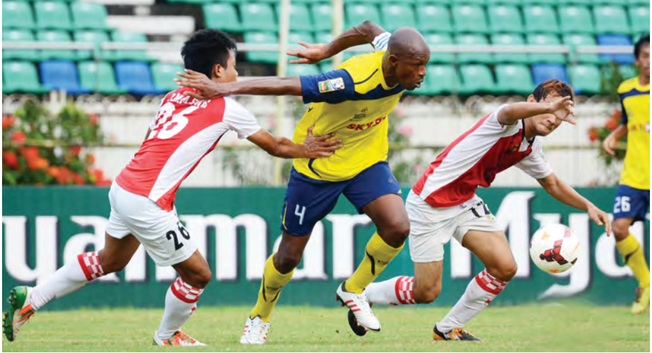
နေပြည်တော်နှင့် ဇေယျာရွှေမြေတို့ ယှဉ်ပြိုင်နေစဉ်။

ဘက္ကရီအီးဒ်နေ့ ရုံးပိတ်ရက် နေပြည်တော် စက်တင်ဘာ ၂၆ ၁၃၇၆ ခုနှစ် သီတင်းကျွတ်လ ဆန်း ၁၃ ရက် (၂၀၁၄ ခုနှစ်၊ အောက်တိုဘာလ ၆ ရက်) တနင်္လာ နေ့သည် အိန္ဒိယသွားဟာ (ဘက္ကရီအီးဒ်)နေ့ဖြစ်သည့်အတွက် ပြည်ထောင်စုသမ္မတ မြန်မာ နိုင်ငံတော်အတွင်းရှိ ရုံးများ၏ ပိတ်ရက်အဖြစ် လွှဲပြောင်းနိုင်သည့် စာချုပ်စာတမ်းများ အက်ဥပဒေ ပုဒ်မ ၂၅ အရ အများပြည်သူတို့ ၏ အလုပ်ပိတ်ရက်ဖြစ်ကြောင်း သိရသည်။ (ကြေးမုံ)