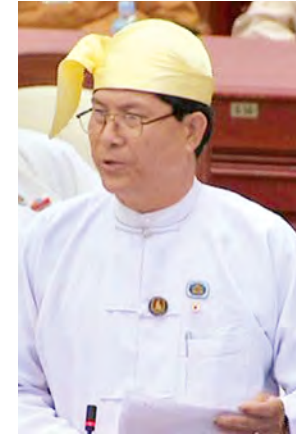
ဂန့်ဂေါ မဲဆန္ဒနယ်မှ ဦးအောင်မြင့်။

အစိုးရများအနေဖြင့် ရန်ပုံငွေရရှိ၍ လယ်ယာမဲ့ လက်လုပ်လက်စားများအတွက် လယ်ယာမြေဖော်ထုတ်ပေးရန် ဆောင်ရွက်သည့်အခါတွင် မိမိတို့ဝန်ကြီးဌာနအနေဖြင့် လိုအပ်သည့် စက်ယန္တရားနှင့် ကျွမ်းကျင်ဝန်ထမ်းများ ကူညီဆောင်ရွက်ပေးသွားမည်ဖြစ်ပါကြောင်းဖြင့် ဖြေကြားသည်။ ရေးမဲဆန္ဒနယ်မှ ဒေါ်မိမြင့်သန်း၏ “မြန်မာနိုင်ငံအတွင်း၌ နိုင်ငံခြားကုမ္ပဏီများမှ ဆက်သွယ်ရေးလုပ်ငန်းအတွက် လုပ်ကိုင်ဆောင်ရွက်ရာတွင် ပြဿနာများပေါ်လာပါက ဖြေရှင်းပေးရန်အတွက် ကော်မတီ/ကော်မရှင်များ ဖွဲ့စည်းထားရန် အစီအစဉ်ရှိ/မရှိ” မေးခွန်းနှင့် စပ်လျဉ်း၍ ဆက်သွယ်ရေးနှင့် သတင်းအချက်အလက် နည်းပညာဝန်ကြီးဌာန ဒုတိယဝန်ကြီး ဦးဝင်းသန်းက ဆက်သွယ်ရေးလုပ်ငန်းများကို လုပ်ကိုင်ဆောင်ရွက်သူအချင်းချင်း အငြင်းပွားမှုများ ပေါ်ပေါက်လာပါက ဆက်သွယ်ရေးဥပဒေ အခန်း (၁၄) ပုဒ်မ ၅၀၊ ၅၁ တို့အရ ဆက်သွယ်ရေးနှင့် သတင်းအချက်အလက်နည်းပညာ