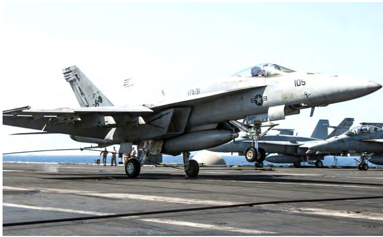
လေကြောင်းတိုက်ခိုက်မှု၌ ပါဝင်သော အမေရိကန်စစ်လေယာဉ်များကို တွေ့ရပုံ။

အီရတ်နှင့် ဆီးရီးယားနိုင်ငံတို့၌ အစ္စလာမစ်တိုက်ခိုက်ရေးသမားများနှင့်အတူ ပါဝင်တိုက်ခိုက်လျက်ရှိသည့် ဥရောပတိုက်သား အရေအတွက်မှာ ၃၀၀၀ ကျော်ရှိပြီဖြစ်ကြောင်း ဥရောပသမဂ္ဂ(အီးယူ) အကြမ်းဖက်မှုတိုက်ဖျက်ရေးအကြီးအကဲက ယနေ့ ဘီဘီစီသို့ ပြောသည်။