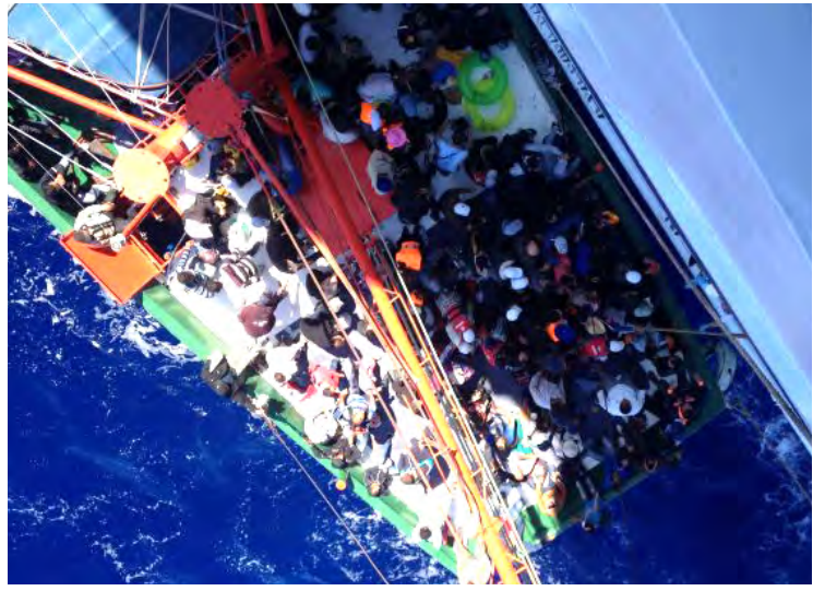
ဆိုက်ပရပ်ကမ်းလွန်၌ ဒုက္ခသည်များအား ကယ်တင်ပေးခဲ့သည့် မှတ်တမ်းပုံ။

၎င်းတို့၏ ဆန္ဒဖြင့်ပင် သင်္ဘောပေါ်မှ ဆင်းခဲ့ကြပြီး ၎င်းတို့ကို နီကိုရှားနှင့် အလွန်မဝေးလှသော ကိုက်နီထရီနီသီယာစခန်းသို့ ဘတ်စ်ကားဖြင့် ပို့ပေးခဲ့ရသည်။