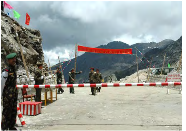
အိန္ဒိယနှင့်တရုတ် နယ်စပ်ဒေသရှိ စစ်ဆေးရေးစခန်း တစ်ခုခုပုံ။

အိန္ဒိယနှင့် တရုတ်တပ်ဖွဲ့များအကြား ရက်သတ္တနှစ်ပတ်ကြာမျှ နယ်စပ်ဒေသ၌ ထိပ်တိုက်တွေ့ဆုံခဲ့ကြပြီးနောက် ပြန်လည်ရုပ်သိမ်းရန် စက်တင်ဘာ ၂၆ရက်တွင် သဘောတူညီလိုက်ကြကြောင်း အိန္ဒိယနိုင်ငံခြားရေးဝန်ကြီးက ပြောကြားသည်။