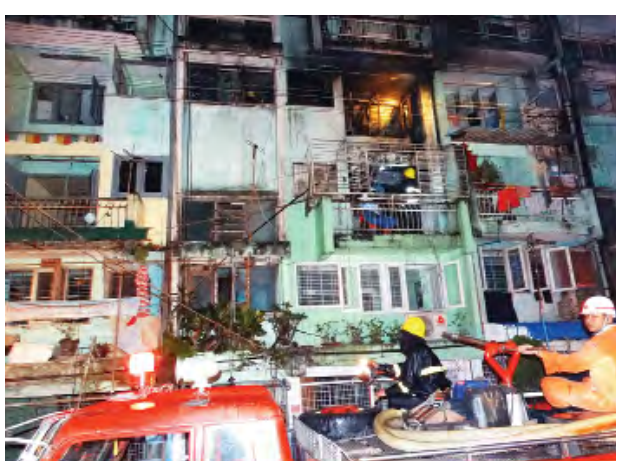
ပြတ်ကာ ထူးခြားသည့်အခြေအနေ သည့်အကြောင်းရင်းကို စစ်ဆေးမျိုး မြင်တွေ့ရမှာဖြစ်သည့်ဟု ရန်ကုန် လျက်ရှိကြောင်း ကနဦးသတင်း မြို့တော် လျှပ်စစ်ဓာတ်အားပေးရေး များအရ သိရသည်။ ထက်ခိုင်း(စမ်းချောင်း)

“မီးသတ်ယာဉ်စီးရေ ၂၀ လောက် တော့ရှိတယ်။ လောလောဆယ်တော့ စာရင်းကောက်နေကြတုန်းပဲ။ ဘာကြောင့် လောင်သလဲဆိုတာကိုလည်း သက်ဆိုင်ရာလူကြီးတွေက စစ်ဆေးနေတုန်းပါပဲ”ဟု အဆိုပါရပ်ကွက်အုပ်ချုပ်ရေးအဖွဲ့က ပြောကြားသည်။ မီးလောင်ကျွမ်းမှုသည် ဝါယာရော့ခံကြောင့် မဟုတ်ကြောင်း၊ ဝါယာရော့ခံကြောင့်ဖြစ်ပါက ဖျူး