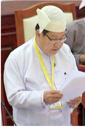
လယ်ယာစိုက်ပျိုးရေးနှင့် ဆည်မြောင်းဝန်ကြီးဌာန ဒုတိယဝန်ကြီး ဦးခင်ဇော်။

နေပြည်တော် စက်တင်ဘာ ၂၆ ပထမအကြိမ် ပြည်သူ့လွှတ်တော် (၁၁)ကြိမ်မြောက် ပုံမှန်အစည်းအဝေး ဒသမနေ့ကို ယနေ့နံနက် ၁၀ နာရီတွင် ပြည်သူ့လွှတ်တော် အစည်းအဝေးခန်းမ၌ ကျင်းပရာ ဂန့်ဂေါ မဲဆန္ဒနယ်မှ ဦးအောင်မြင့်၏ “လယ်ယာယာမဲ့လက်လုပ်လက်စားများအတွက် လယ်ယာမြေများ ဖော်ထုတ်ပေးရန် အစီအစဉ်ရှိ မရှိ” မေးခွန်းနှင့် စပ်လျဉ်း၍ လယ်ယာစိုက်ပျိုးရေးနှင့် ဆည်မြောင်းဝန်ကြီးဌာန ဒုတိယဝန်ကြီး ဦးခင်ဇော်က ကျေးလက်နေပြည်သူလူထု၏ ဆင်းရဲနွမ်းပါးမှု လျော့ချနိုင်ရေးအတွက် လယ်ယာယာမဲ့များကို မြေလွတ်မြေရိုင်းများ၊ ရေနက်ကွင်းများနှင့် မြေနုကျွန်းများတွင် လယ်ယာမြေများ ဖော်ထုတ်၍ လည်းကောင်း၊ တောင်တန်းဒေသပြည်နယ်များတွင် ရွှေ့ပြောင်းတောင်ယာများကို လေ့ကားထစ်လယ်ယာမြေအဖြစ် ဖော်ထုတ်၍ လည်းကောင်း၊ သက်ဆိုင်ရာ တိုင်းဒေသကြီး၊ ပြည်နယ် မြေယာစီမံခန့်ခွဲရေးအဖွဲ့များ၏ စီမံမှုဖြင့်