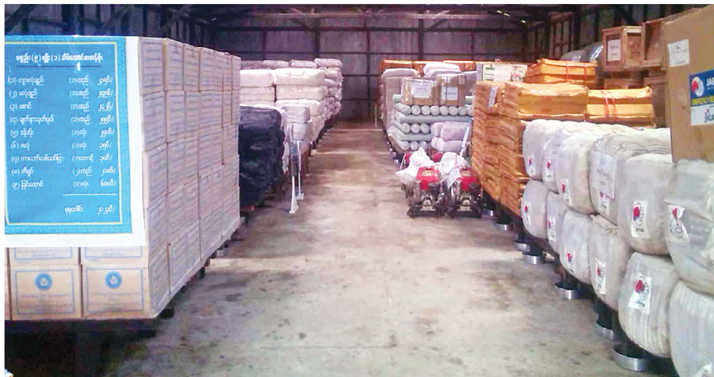
သိုလှောင်ရုံအတွင်း ပစ္စည်းသိုလှောင်ထားရှိမှုအခြေအနေကိုတွေ့ရစဉ်။