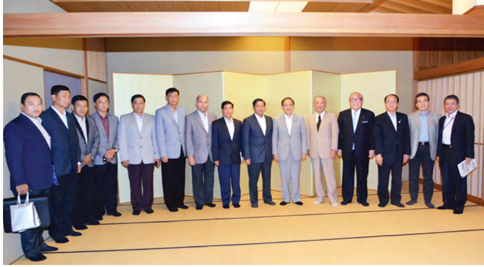
ဆွေးနွေးကြသည်။ ညစာသုံးဆောင်အပြီးတွင် တပ်မတော်ကာကွယ်ရေးဦးစီးချုပ်နှင့် ဂျပန်အစိုးရအဖွဲ့အတွင်းဝန်ချုပ်တို့သည် လက်ဆောင်ပစ္စည်းများ အပြန်အလှန်ပေးအပ်ကြပြီး အမှတ်တရ စုပေါင်းဓာတ်ပုံရိုက်ခဲ့ကြကြောင်း သတင်းရရှိသည်။ (အပေါ်ပုံ) (မြဝတီ)

တပ်မတော်ချစ်ကြည်ရေးကိုယ်စားလှယ်အဖွဲ့ဝင်များ တက်ရောက်ကြပြီး ဂျပန်ဘက်မှ အစိုးရအဖွဲ့အတွင်းဝန်ချုပ်နှင့် တာဝန်ရှိသူများ တက်ရောက်ကြသည်။ ထို့နောက် တပ်မတော်ကာကွယ်ရေးဦးစီးချုပ်နှင့် ဂျပန်အစိုးရအဖွဲ့ အတွင်းဝန်ချုပ်တို့သည် အဖွဲ့ဝင်များနှင့်အတူ ညစာကို အတူတကွသုံးဆောင်ကြသည်။ ညစာသုံးဆောင်စဉ် နှစ်နိုင်ငံချစ်ကြည်ရေးနှင့် ဆက်ဆံရေး တိုးမြှင့်လုပ်ဆောင်ရန် ကိစ္စရပ်များ၊ တပ်မတော်နှစ်ရပ်အကြား ပူးပေါင်းဆောင်ရွက်ရေးမြှင့်တင်ရန် ကိစ္စရပ်များကို