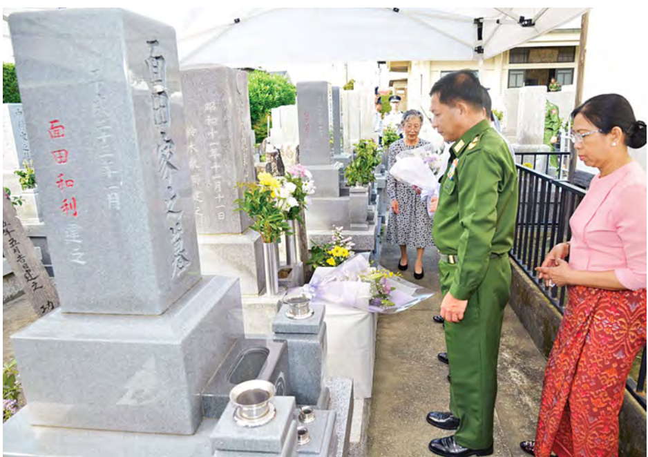
တပ်မတော်ကာကွယ်ရေးဦးစီးချုပ် ပိုလ်ချုပ်မှူးကြီးမင်းအောင်လှိုင် ပိုလ်မှူးကြီး ဆူလူး၏အုတ်ဂူအား ဂါရဝပြု ပန်းခွေချ အလေးပြုစဉ်။

တပ်မတော်ကာကွယ်ရေးဦးစီးချုပ် ပိုလ်ချုပ်မှူးကြီးမင်းအောင်လှိုင်နှင့်ဇနီး ဒေါ်ကြူကြူလှတို့ ဦးဆောင်သော မြန်မာ့တပ်မတော်ချစ်ကြည်ရေးကိုယ်စား လှယ်အဖွဲ့သည် စက်တင်ဘာ ၂၆ ရက် ဒေသစံတော်ချိန် နံနက် ၉ နာရီ ၄၅ မိနစ်တွင် ဂျပန်ကိုယ်ပိုင်ကာကွယ်ရေးတပ်ဖွဲ့ စစ်ဦးစီးချုပ် General Shigeru IWASAKI နှင့် ဇနီး လိုက်ပါလျက် ဂျပန်နိုင်ငံ Shizuoka ခရိုင် Hamamatsu မြို့ရှိ Hamamatsu လေကြောင်းကိုယ်ပိုင်ကာကွယ်ရေးတပ်ဖွဲ့သို့ သွားရောက် ကြည့်ရှုလေ့လာကြသည်။