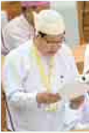
လယ်ယာစိုက်ပျိုးရေးနှင့် ဆည်မြောင်းဝန်ကြီးဌာန ဒုတိယဝန်ကြီး ဦးခင်ဇော်။

လယ်ယာစိုက်ပျိုးရေးနှင့် ဆည်မြောင်းဝန်ကြီးဌာန ဒုတိယဝန်ကြီး ဦးခင်ဇော်က အစီရင်ခံစာ အပိုင်း(၁)၊ (၂)၊ (၃)ပါ လယ်ယာစိုက်ပျိုးရေးနှင့် ဆည်မြောင်းဝန်ကြီးဌာနနှင့် သက်ဆိုင်သည့် ကိစ္စရပ် (၁၅)ခုရှိပါကြောင်း၊ ၎င်းတို့အား ဖြေရှင်းဆောင်ရွက်ရာတွင် သိမ်းဆည်းခြင်းများ အကြောင်း အရင်းခိုင်မာ၍ မစွန့်လွှတ်သည့်ကိစ္စရပ် (၉)ခု၊ သိမ်းဆည်းခြင်းများအနက် တစ်စိတ်တစ်ဒေသ စွန့်လွှတ်သည့်ကိစ္စရပ်(၄)ခု၊ သိမ်းဆည်းခြင်းများအားလုံးစွန့်လွှတ်သည့် ကိစ္စရပ်(၂)ခု ဖြစ်ပါကြောင်း၊ သိမ်းဆည်းခြင်းများ ပြန်လည်စွန့်လွှတ်သည့် ကိစ္စရပ် (၆)ခုအား သက်ဆိုင်သူများသို့ ပြန်လည်ပေးအပ်ပြီးဖြစ်ပါကြောင်း။