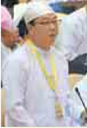
မွေးမြူရေး၊ ရေလုပ်ငန်းနှင့် ကျေးလက်ဒေသဖွံ့ဖြိုးရေးဝန်ကြီးဌာန ဒုတိယဝန်ကြီး ဒေါက်တာအောင်မြတ်ဦး။

နေပြည်တော် စက်တင်ဘာ ၂၄ - အမျိုးသားလွှတ်တော် (၁၁) ကြိမ်မြောက် ပုံမှန်အစည်းအဝေး အငြိမ်းစားနေ့ကို ယနေ့နံနက် ၁၀ နာရီတွင် ကျင်းပရာ မေးခွန်းလေးခု မေးမြန်းဖြေကြားခြင်း၊ ဥပဒေကြမ်းတစ်ခု အတည်ပြုခြင်းနှင့် အဆိုတစ်ခု တင်သွင်းခြင်းတို့ကို ဆောင်ရွက်ခဲ့ကြသည်။