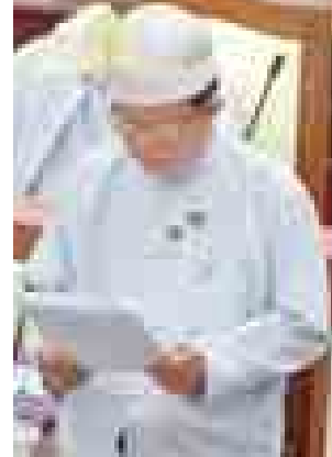
ဖာပွန်မဲဆန္ဒနယ်မှ ဦးစိုးသန်းနိုင်။

နှင့် လက်ရှိအလုပ်လက်မဲ့ ရာခိုင်နှုန်း မည်မျှရှိကြောင်း၊ ပြည်ပမှ ပြန်လည်ရောက်ရှိလာသော အလုပ်သမားများကို ပြည်တွင်းတွင် အလုပ်အကိုင် ပြန်လည်ခန့်ထားရေးအတွက် မည်သို့ စီမံလျက်ရှိသည်ကို သိရှိလိုခြင်း” မေးခွန်းနှင့်စပ်လျဉ်း၍ အမျိုးသားစီမံကိန်းနှင့် စီးပွားရေးဖွံ့ဖြိုးတိုးတက်မှု ဝန်ကြီးဌာန ဒုတိယဝန်ကြီး ဒေါ်လှလှသိန်းက ၂၀၁၄ ခုနှစ် ဇွန်လကုန်စာရင်းအရ အစိုးရဌာနအသီးသီးတွင် တာဝန်ထမ်းဆောင်နေသည့် အမြဲတမ်း ဝန်ထမ်းဦးရေ ၉၀၃၃၆၆ ဦး ဖြစ်ပါကြောင်း၊ အချိုးအစားအားဖြင့် ကျား ၄၅ ဒဿမ ၁ ရာခိုင်နှုန်းနှင့် မ ၅၄ ဒဿမ ၉ ရာခိုင်နှုန်းဖြစ်ပါကြောင်း၊ ၂၀၁၄-၂၀၁၅ ဘဏ္ဍာနှစ်တွင် တစ်နှစ်အတွက် လစာကျပ် ၁၆၀၀၉၅၄ သန်း၊ အပို့ထောက်ပံ့ကြေးနှင့် ဒေသစရိတ်အပါအဝင် စုစုပေါင်း လစာစရိတ်ကျပ် ၁၉၉၄၀၇၇ သန်း လျာထားပါ