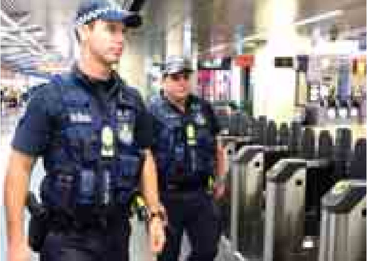
ဆစ်ဒနီ၌ ရဲတပ်ဖွဲ့ဝင်များ ကင်းလှည့်နေသည်ကို တွေ့ရစဉ်။