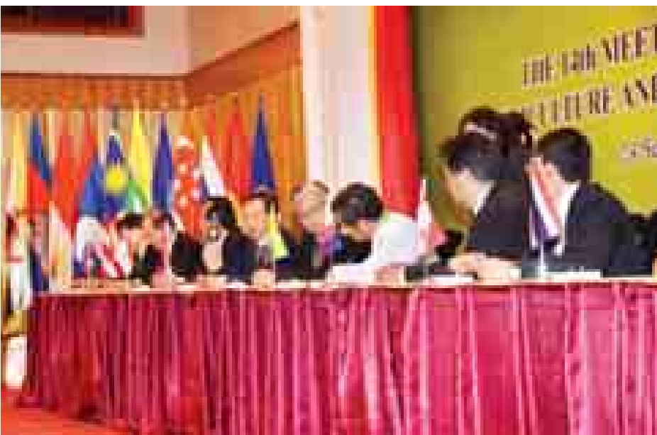
စိန်ခေါ်မှုပေါ် ဆွေးနွေးညှိနှိုင်း၍ လမ်းညွှန်မှုပြုခြင်း၊ တောင်သူလယ်သမားမိသားစုဆိုင်ရာ အပြည်ပြည်ဆိုင်ရာနှစ် (၂၀၁၄) ၏ ပိတ်ပွဲအခမ်းအနားနှင့်စပ်လျဉ်း၍ ဖိလစ်ပိုင် နိုင်ငံမှ ကြေညာခြင်းစသည်တို့အပေါ် ညှိနှိုင်းဆွေးနွေးကြသည်။

ထို့နောက် အစည်းအဝေးကို ဆက်လက်ကျင်းပရာ တက်ရောက်လာသော အာဆီယံအဖွဲ့ဝင် (၁၀)နိုင်ငံနှင့် +၃ နိုင်ငံများမှ စားနပ်ရိက္ခာ၊ စိုက်ပျိုးရေးနှင့် သစ်တောကဏ္ဍများ ပူးပေါင်းဆောင်ရွက်မှု လုပ်ငန်းများ၏ အကောင်အထည်ဖော် ဆောင်ရွက်မှုလုပ်ငန်းများ၏ လက်ရှိအခြေအနေကိုတင်ပြ၍ အတည်ပြုချက်ရယူခြင်း၊ ကမ္ဘာ့စားနပ်ရိက္ခာနှင့်စိုက်ပျိုးရေးအဖွဲ့မှ အဆိုပြုတင်သွင်းသည့် ငတ်မွတ်ခေါင်းပါးမှု ပပျောက်ရေး