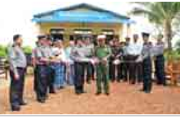
ပန်းမော်ခရိုင်တွင် သစ်ပင်စိုက်ပျိုးပွဲကျင်းပ ပန်းမော် စက်တင်ဘာ ၂၄

အချုပ်အားဖြင့် ၂၀၁၄ ခုနှစ် မြန်မာနိုင်ငံ အာဆီယံဥက္ကဋ္ဌတာဝန်ယူသည့်ကာလအတွင်း ကျင်းပခဲ့သည့် (၄၆)ကြိမ်မြောက် အာဆီယံစီးပွားရေးဝန်ကြီးများနှင့် ဆက်စပ်အစည်းအဝေးများ၌ ၂၀၁၅ ခုနှစ် အာဆီယံစီးပွားရေးအသိုက်အဝန်းပေါ်ပေါက်လာရေးအတွက် အဓိကကျသည့် ပုဂ္ဂလိကကဏ္ဍ၏ ပူးပေါင်းပါဝင်ဆောင်ရွက်မှုအရှိန်အဟုန်ဖြင့် တိုးတက်လာသည်ကို တွေ့မြင်ရပါကြောင်း တင်ပြအပ်ပါသည်။ ။