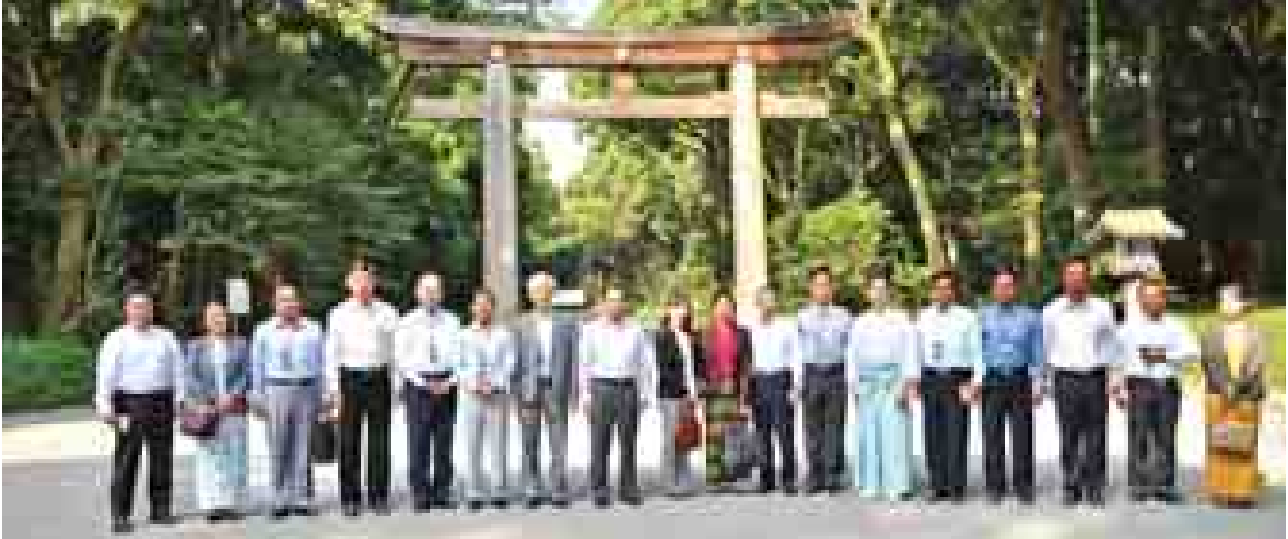
တပ်မတော်ကာကွယ်ရေးဦးစီးချုပ် ပိုလ်ချုပ်မှူးကြီးမင်းအောင်လှိုင်နှင့် ဇနီး ဒေါ်ကြူကြူလှ ဦးဆောင်သောမြန်မာ့တပ်မတော်ချစ်ကြည်ရေးကိုယ်စားလှယ် အဖွဲ့ Meiji Jingu ဝိမာန်တွင် စုပေါင်းမှတ်တမ်းတင်ဓာတ်ပုံရိုက်ကြစဉ်။