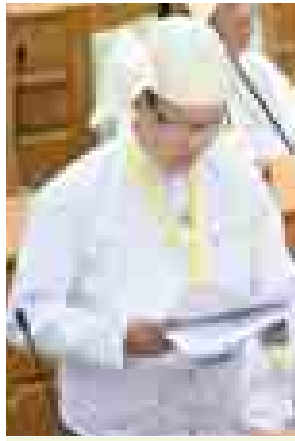
ပို့ဆောင်ရေးဝန်ကြီးဌာန ဒုတိယဝန်ကြီး ဦးခင်ဇော်။

ကော်မတီသို့ တင်ပြခဲ့ပြီးဖြစ်ပါကြောင်း။ အစီရင်ခံစာအပိုင်း(၅)ပါ လယ်ယာစိုက်ပျိုးရေးနှင့် ဆည်မြောင်းဝန်ကြီးဌာန သက်ဆိုင်သည့် ကိစ္စရပ်(၁၈၀)အနက် (၅၃)ခုသည် သက်ဆိုင်ခြင်းမရှိပါကြောင်း၊ အမှန်တကယ်ဖြစ်ရင်းရမည့်ကိစ္စရပ် (၁၂၇)ခုသာ ရှိပါကြောင်း၊ ယင်း (၁၂၇)ခုအနက် သိမ်းဆည်းခြင်းများ အကြောင်းအရင်းခိုင်မာ၍ မစွန့်လွှတ်သည့်ကိစ္စရပ် (၁၀၄)ခု၊ ညှိနှိုင်းပြေလည်၍ မစွန့်လွှတ်သည့်ကိစ္စရပ် (၉)ခု၊ သိမ်းဆည်းခြင်းများအနက် တစ်စိတ်တစ်ဒေသ စွန့်လွှတ်သည့်ကိစ္စရပ် (၂)ခု၊ သိမ်းဆည်းခြင်းများအားလုံး စွန့်လွှတ်သည့်ကိစ္စရပ် (၅)ခု တိုင်စာတူ၊ အကြောင်းအရာတူ ကိစ္စရပ် (၆)ခု၊ ဥပဒေကြောင်းအရ ဖြေရှင်းရမည့်ကိစ္စရပ် (၁)ခုရှိပါကြောင်းဖြင့် ရှင်းလင်းသည်။ ပို့ဆောင်ရေးဝန်ကြီးဌာန ဒုတိယ