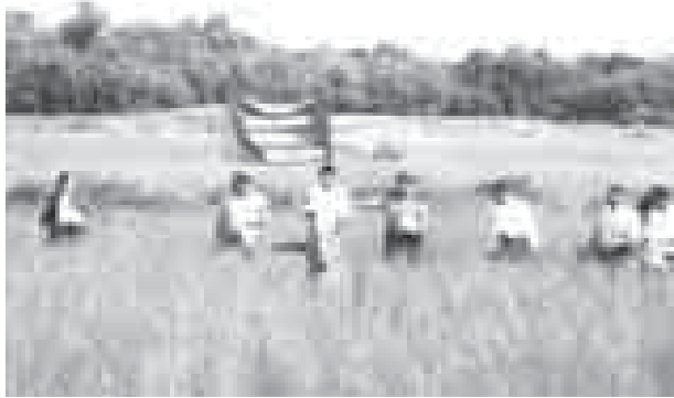
ကြာအင်းဆိပ်ကြီး၊ စက်တင်ဘာ ၂၄

ကရင်ပြည်နယ်၊ ကြာအင်းဆိပ်ကြီးမြို့နယ်၊ ကျိုက်ခုံမြို့တွင် စက်တင်ဘာ ၂၁ ရက် နံနက် ၉ နာရီက စုပေါင်းမြေဩဇာကြိုပတ်ပွဲအခမ်းအနားကို ကျိုက်ခုံမြို့နယ် အမှတ်(၄)ရပ်ကွက်ရှိ လယ်သမား ဦးသိန်းအောင်၏လယ်၌ ကျင်းပပြုလုပ်ခဲ့သည်။