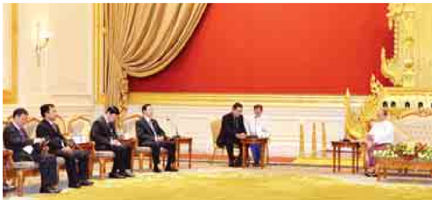
(သတင်းစဉ်)

နေပြည်တော် စက်တင်ဘာ ၂၄ ပြည်ထောင်စုသမ္မတမြန်မာနိုင်ငံတော် နိုင်ငံတော် သမ္မတ ဦးသိန်းစိန်သည် တရုတ်ပြည်သူ့သမ္မတနိုင်ငံ လယ်ယာစိုက်ပျိုးရေးဝန်ကြီး H.E.Mr.Han Changfu ဦးဆောင်သည့် ကိုယ်စားလှယ်အဖွဲ့အား ယနေ့မွန်းလွဲ ၂ နာရီခွဲတွင် နေပြည်တော်ရှိ နိုင်ငံတော်သမ္မတအိမ်တော် သံတမန်ဆောင်ရွက်ခန်းမ၌ လက်ခံတွေ့ဆုံသည်။ (ယာပုံ) အဆိုပါ တွေ့ဆုံပွဲသို့ ပြည်ထောင်စုဝန်ကြီး ဦးတင်နိုင်သိန်း၊ ဦးမြင့်လှိုင်၊ ဦးအုန်းမြင့်၊ ဦးဝင်းထွန်း၊ ဦးဝင်းမြင့်၊ ဦးရဲထွန်း၊ ဒုတိယဝန်ကြီး ဦးသန့်ကျော်နှင့် ဌာနဆိုင်ရာတာဝန်ရှိသူများ တက်ရောက်ကြသည်။ ထိုသို့ တွေ့ဆုံရာတွင် ဆန်အပါအဝင် မြန်မာ့လယ်ယာ ထွက်ကုန်ပစ္စည်းများ၊ မွေးမြူရေးနှင့် ရေထွက်ပစ္စည်း များအား တိုးချဲ့တင်ပို့နိုင်မည့် အလားအလာများ၊ မျိုးကောင်းမျိုးသန့်ထုတ်လုပ်နိုင်မည့် နည်းပညာများ ဖလှယ်ရေး၊ ကျွန်ုပ်တို့အတွင်း သစ်တောပြုန်းတီးမှုနှင့် ပတ်သက်၍ နှစ်နိုင်ငံပူးပေါင်းထိန်းသိမ်းဆောင်ရွက်ရေး တို့ကို ဆွေးနွေးခဲ့ကြသည်။