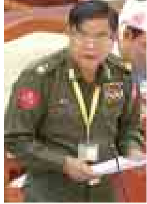
ကာကွယ်ရေးဝန်ကြီးဌာန ဒုတိယဝန်ကြီး ဦးလှိုင်ကျော်ညွန့်။

၂၅ ရာခိုင်နှုန်းကို အပို့ဆောင်ထောက်ပံ့ရန် သတ်မှတ်ပြဌာန်းခဲ့ပါကြောင်း။ အသက်ရှင်ပြီး ဒုက္ခိတဘဝရောက်နေသူများကို နိုင်ငံတော်က ပြန်လည်ကြည့်ရှုစောင့်ရှောက်သည့် အနေဖြင့် ၎င်းတို့၏ ဆန္ဒအရ လူမှုဝန်ထမ်းဦးစီးဌာနအောက်ရှိ သင့်လျော်သည့် လုပ်ငန်းပညာရပ်ဆိုင်ရာ သင်တန်းကျောင်းများတွင် အသက်မွေးဝမ်းကျောင်းပညာရပ်များကို အထူးကိစ္စတစ်ရပ်အနေဖြင့် သင်ကြားလေ့ကျင့်ပေးခြင်း၊ အလုပ်အကိုင်များ ဖန်တီးပေးခြင်းတို့ကို ဆောင်ရွက်ပေးလျက်ရှိပါကြောင်း၊ သေဆုံးစစ်ဆင်ရေးဝန်ထမ်းများ၏ ဗိုဗိုသူများ စားဝတ်နေရေးနှင့်သက်သာချောင်ချိရေးအတွက် ကာကွယ်ရေးဌာနကောင်စီ အထူးအမိန့်အမှတ်အရ ၄၅၀၀၀၀ ကျပ်နှုန်းကို ထောက်ပံ့ကြေးအဖြစ် ပေးခြင်းမှအပ ကျန်အကူအညီ အထောက်အပံ့များ ပေးခြင်းမရှိပါကြောင်းဖြင့် ဖြေကြားသည်။