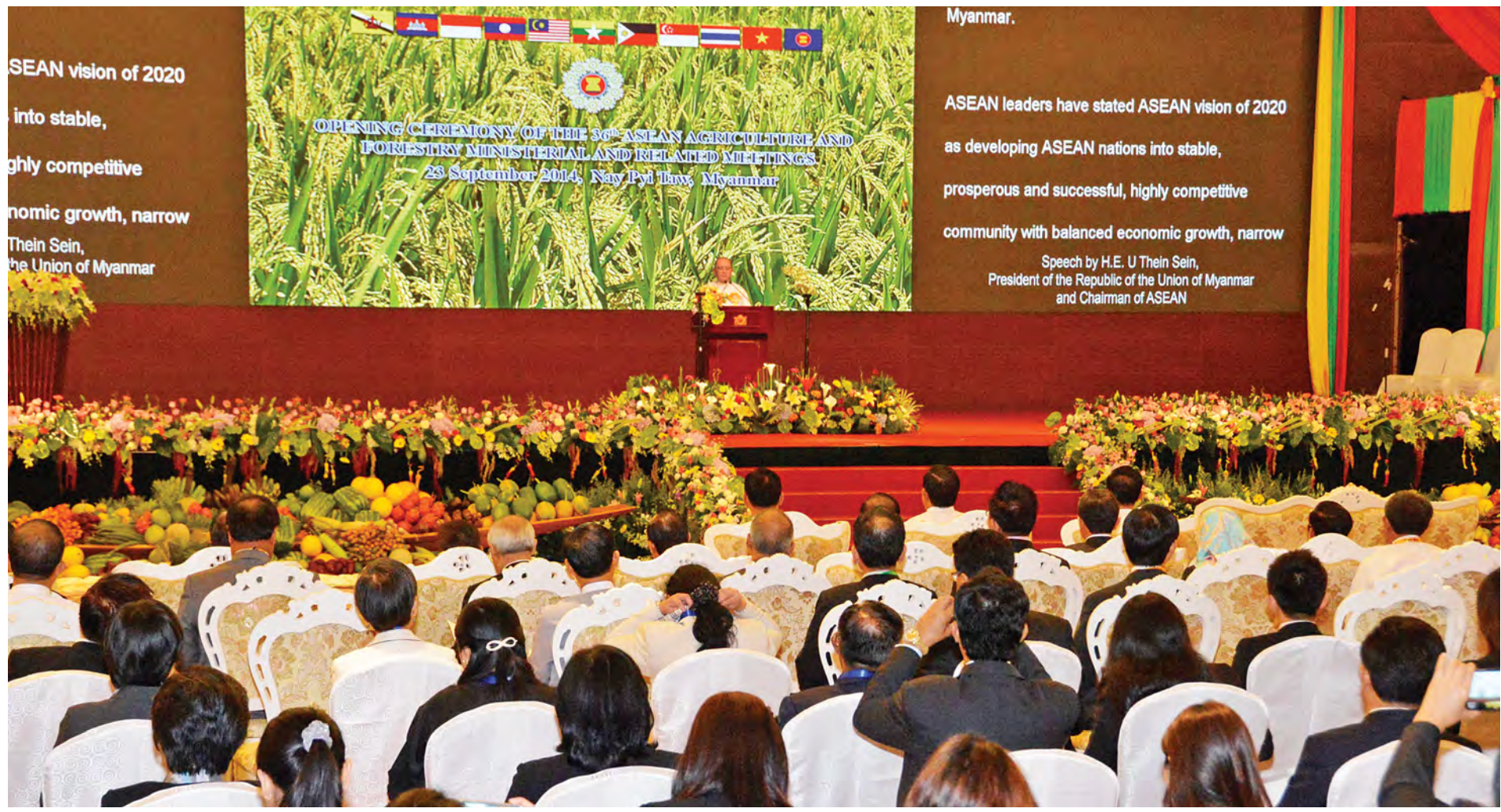
နိုင်ငံတော်သမ္မတ ဦးသိန်းစိန် (၃၆)ကြိမ်မြောက် အာဆီယံလယ်ယာစိုက်ပျိုးရေးနှင့် သစ်တောဆိုင်ရာဝန်ကြီးအဆင့် အစည်းအဝေးဖွင့်ပွဲအခမ်းအနားသို့ တက်ရောက်အမှာစကားပြောကြားစဉ်။ (သတင်းစဉ်)

၂၀၁၄-၂၀၁၅ ခုနှစ် ဧပြီလမှ ဩဂုတ်လအတွင်း မြန်မာနိုင်ငံ၏ ပို့ကုန်၊ သွင်းကုန်အခြေအနေ