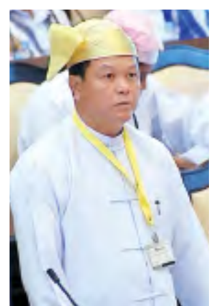
လျှပ်စစ်စွမ်းအား ဝန်ကြီးဌာန ဒုတိယဝန်ကြီး ဦးအောင်သန်းဦး။

လမ်း၊ မြို့မလမ်းများသို့ သွားလာခဲ့ကြ ပါကြောင်း။