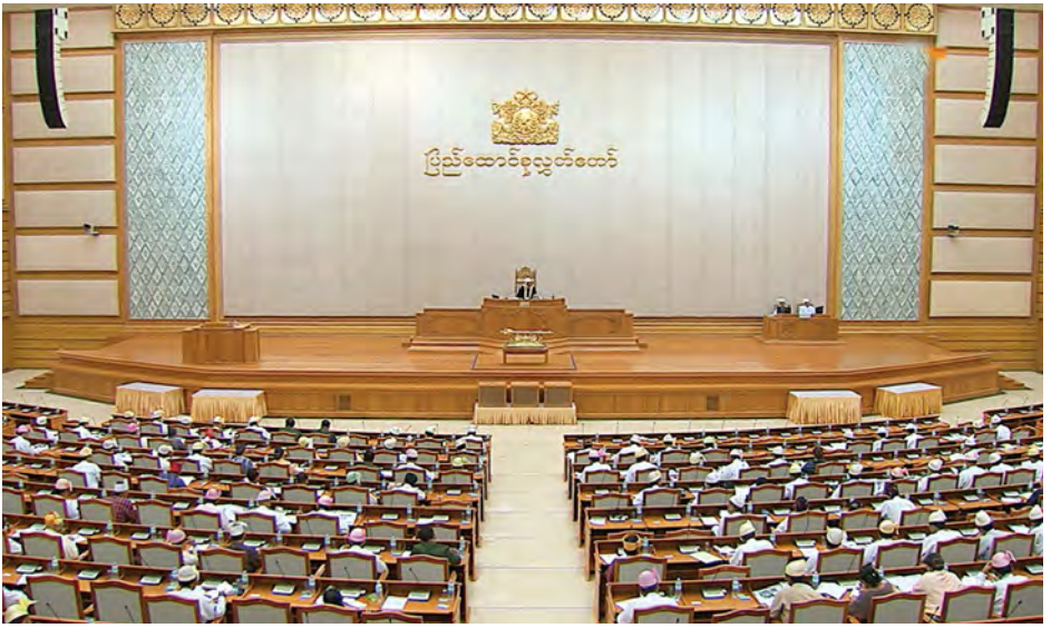
ပထမအကြိမ် ပြည်ထောင်စုလွှတ်တော် (၁၁) ကြိမ်မြောက်ပုံမှန်အစည်းအဝေး ဆဌမနေ့ကျင်းပစဉ်။