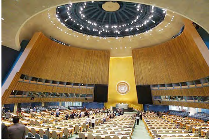
ရာသီဥတု ပြောင်းလဲခြင်းဆိုင်ရာ ကုလသမဂ္ဂ ထိပ်သီးညီလာခံ ကျင်းပသည့် အထွေထွေညီလာခံခန်းမဆောင်ကို တွေ့ရစဉ်။

ကမ္ဘာ့ရာသီဥတု ဖောက်ပြန်လာမှုပြဿနာကို ကမ္ဘာ့နိုင်ငံများက အရေးအကြီးဆုံး ကိစ္စရပ်အဖြစ် အရေးယူ ကိုင်တွယ်ဆောင်ရွက်ကြရန် အချိန်ကျရောက်နေပြီဖြစ်ကြောင်း ကုလသမဂ္ဂအတွင်းရေးမှူးချုပ် ဘန်ကီမွန်းက ပြောကြားသည်။ ပီတီအိုင်။