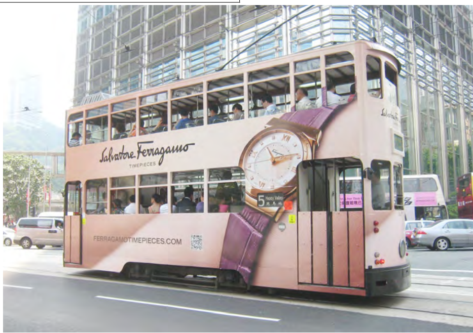
ဟောင်ကောင်မြို့လယ်ဒေသ၌ ဓာတ်ရထားတစ်စင်း ပြေးဆွဲနေသည်ကို တွေ့ရစဉ်။

ဟောင်ကောင်၌ ၂၀၁၇ ခုနှစ်တွင် ကျင်းပမည့် ရွေးကောက်ပွဲအတွက် အခြေခံမူဘောင်ကို တရုတ်ဥပဒေပြုလွှတ်တော်က အတည်ပြုပေးခဲ့ချိန်နောက်ပိုင်း တရုတ်သမ္မတက ဟောင်ကောင် ကိုယ်စားလှယ်အဖွဲ့တစ်ဖွဲ့ကို လက်ခံတွေ့ဆုံခြင်းမှာ ပထမဆုံးအကြိမ်ဖြစ်သည်။ ထိုစဉ်အတွင်း ဟောင်ကောင်၌ ရွေးကောက်ပွဲ ပြုပြင်ပြောင်းလဲမှုပြုလုပ်ရန် တောင်းဆိုသည့် ဆန္ဒပြပွဲများကို ပြုလုပ်ခဲ့ကြသည်။ ဆင်ယွ။