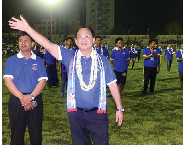
၂၀၁၄ MNL အမှတ်ပေးချန်ပီယံ ရတနာပုံအသင်း။

ရတနာပုံအသင်းသည် MNL အမှတ်ပေးချန်ပီယံဆုကို သုံးကြိမ်မြောက် ရရှိခြင်းဖြစ်ပြီး ၂၀၀၉ ရာသီ၊ ၂၀၁၀ ရာသီနှင့် ယခု ၂၀၁၄ ရာသီတို့တွင် ရရှိခဲ့ခြင်းဖြစ်သည်။ (စိုးညွန့်)