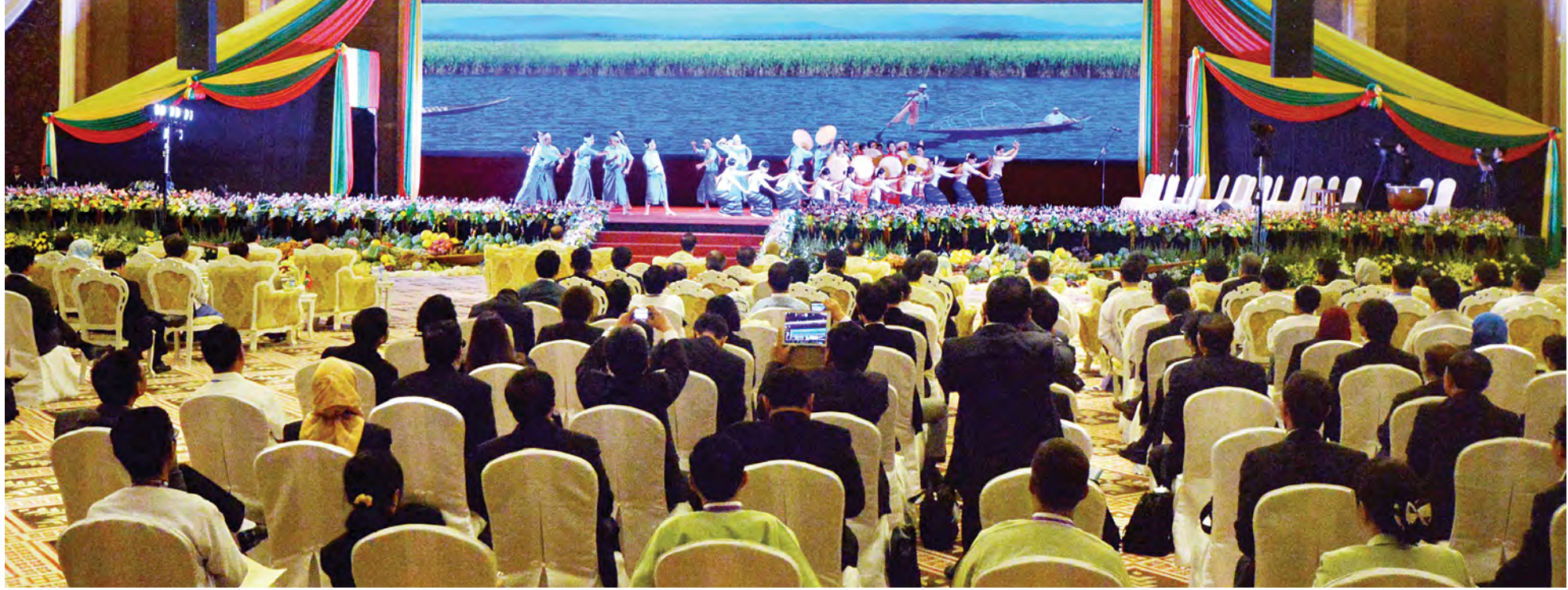
ပြည်မိရန်ရည်ရွယ်ပြီး ယခုနှစ် အာဆီယံအလှည့်ကျဥက္ကဋ္ဌဖြစ်သည့် ပြည်ထောင်စုသမ္မတမြန်မာနိုင်ငံသည် ယခုနှစ်ဆောင်ပုဒ်ကို “ရှေ့သို့တည် တက်လှမ်းချီ၊ ငြိမ်းချမ်းဝေစည် အသိုက်အဝန်းဆီ” ဟူ၍ သတ်မှတ်ခဲ့ပါကြောင်း။