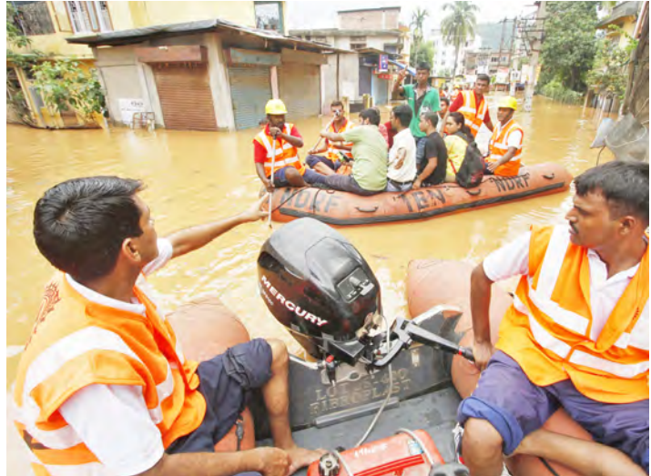
အာသံပြည်နယ် ဂိုလ်ပါလာဒေသ၏ ရေလွှမ်းမိုးရာ အရပ်ဒေသများ၌ ကယ်ဆယ်ရေးလုပ်ငန်းများ ဆောင်ရွက်လျက်ရှိစဉ်။

လုံခြုံရေးအစောင့်များ ရောက်ရှိလာချိန်မှာ နောက်ကျခဲ့ခြင်းကြောင့် အချိန်မီ ကယ်တင်ပေးနိုင်ခြင်းမရှိကြောင်း ဝေဖန်မှုများ ပေါ်ထွက်လာခဲ့သည်။ ပီတီအိုင်။