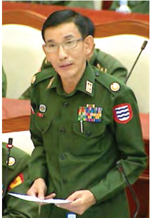
တပ်မတော်သားကိုယ်စားလှယ် ဗိုလ်မှူးချုပ်တင်စိုး။

အမှတ် ၂၃ ဖြင့် “အဂတိလိုက်စားမှု တိုက်ဖျက်ရေးဥပဒေ”ကို ပြဋ္ဌာန်းခဲ့ ပါကြောင်း၊ ပြဋ္ဌာန်းထားရှိသော အဂတိလိုက်စားမှုတိုက်ဖျက်ရေး ဥပဒေအရ နိုင်ငံတော်သမ္မတရုံး၏ ၂၀၁၄ ခုနှစ် ဖေဖော်ဝါရီ ၂၅ ရက်စွဲပါ အမိန့်အမှတ် (၆/၂၀၁၄)ဖြင့် “လွှတ်တော်လွှတ်ပေးမှု ပပျောက်ရေး ကော်မရှင်”ကို ဖွဲ့စည်းခဲ့ပါကြောင်း၊