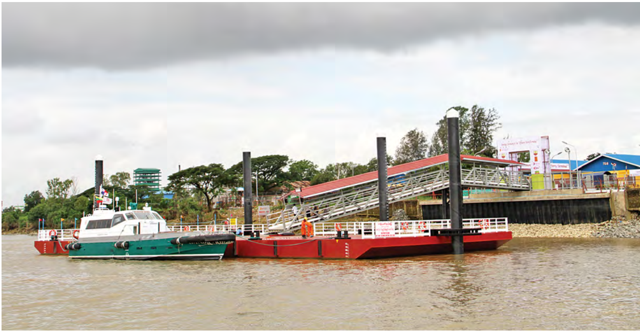
စွမ်းအင်ဝန်ကြီးဌာန မြန်မာ့ရေနံနှင့် သဘာဝဓာတ်ငွေ့လုပ်ငန်း သာကေတကမ်းလွန်အခြေစိုက်စခန်း၌ တည်ဆောက်ပြီးစီးသော Offshore Ferry terminal အား အဝေးမှတွေ့မြင်ရစဉ်။