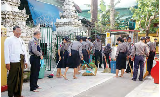
မြန်မာနိုင်ငံရဲတပ်ဖွဲ့နေ့ ရွှေရတနာအထိမ်းအမှတ်အား ကြိုဆိုဂုဏ်ပြုသော အားဖြင့် ရန်ကင်းအရှေ့ပိုင်းခရိုင် ရန်ကင်းမြို့နယ်ရဲတပ်ဖွဲ့ရှိ တပ်ဖွဲ့ဝင်များ စက်တင်ဘာ ၂၀ ရက် မွန်းလွဲပိုင်းတွင် ရန်ကင်းမြို့နယ် မိုးကောင်းဆူတောင်း ပြည့်စေတီတော် ပရိဝုဏ်အတွင်းရှိ ချွန်နယ်မြက်ပင်များ ခုတ်ထွင်ရှင်းလင်း ပေးခြင်းနှင့် ရင်ပြင်တော်သန့်ရှင်းရေးများကို စုပေါင်းဆောင်ရွက်ခဲ့ကြ သည်။ သန်းမောင်(ရန်ကင်း)

မြန်မာနိုင်ငံဟာလည်း ကမ္ဘာ့ဒီမိုကရေစီအဝန်းအဝိုင်းအတွင်း ဝင်ဆုံနိုင် ရေး၊ ဖွံ့ဖြိုးတိုးတက်တဲ့ ဒီမိုကရေစီနိုင်ငံတော်ဖြစ်ရေးအတွက် မြန်မာ့ဒီမိုကရေစီ ဖော်ဆောင်ရေးတွင် လူငယ်များ ပိုင်းဝန်းဆောင်ရွက်လာစေရန် နိုင်ငံသားတိုင်း၊ ပါတီတိုင်းမှ တက်ညီလက်ညီ ပြည်ထောင်စုစိတ်ဓာတ်အပြည့်ဖြင့် ပါဝင်ဆောင် ရွက်ရန် အချိန်ကျရောက်ပြီဖြစ်ကြောင်း တင်ပြရင်း နိဂုံးချုပ်အပ်ပါတယ်။