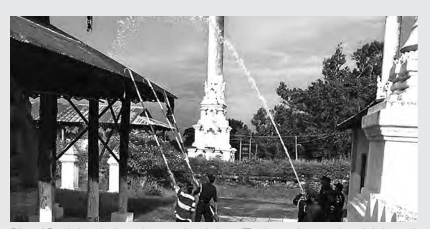
မြန်အောင်မြို့နယ် မီးသတ်တပ်ဖွဲ့သည် ဘုရားပုထိုးများ၌ မီးဘေးကြိုတင်ကာကွယ်ရေးအတွက် စက်တိုက်လှေကျင့်မှုများကို စက်တင်ဘာ ၁၉ ရက် နေ့လယ်ပိုင်းက မြန်အောင်မြို့ အမှတ် (၄) ရပ်ကွက်အတွင်းရှိ ဓဇယျသရီဘုရားကြီးအတွင်း လှေကျင့်မှုများ ပြုလုပ်ခဲ့ကြောင်းသိရသည်။