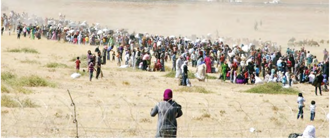
တူရကီနယ်စပ်ကို ဖြတ်သန်းဝင်ရောက်ရန် စောင့်ဆိုင်းနေသည့် ဆီးရီးယားစစ်ဘေးဒုက္ခသည်များအား တွေ့ရစဉ်။