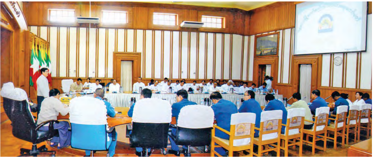
ဆက်သွယ်ရေးဝန်ကြီးဌာန ဝန်ကြီးက တိုင်းဒေသကြီးအတွင်း တိုးတက်လာမည့် လူဦးရေအရ မြို့ပြစီမံကိန်းများ

အကောင်အထည်ဖော်ရန် လျာထားမှုများနှင့် မြို့တော်စည်ပင်သာယာရေးအကြံပေးအဖွဲ့ဝင်များနှင့် တက်