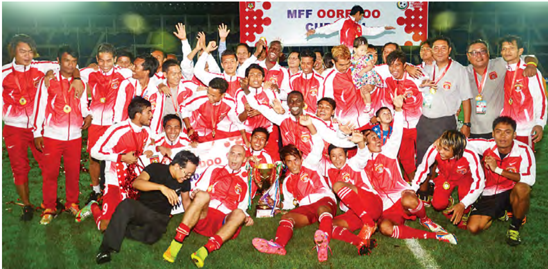
ချန်ပီယံ ရေဝတီအသင်း။