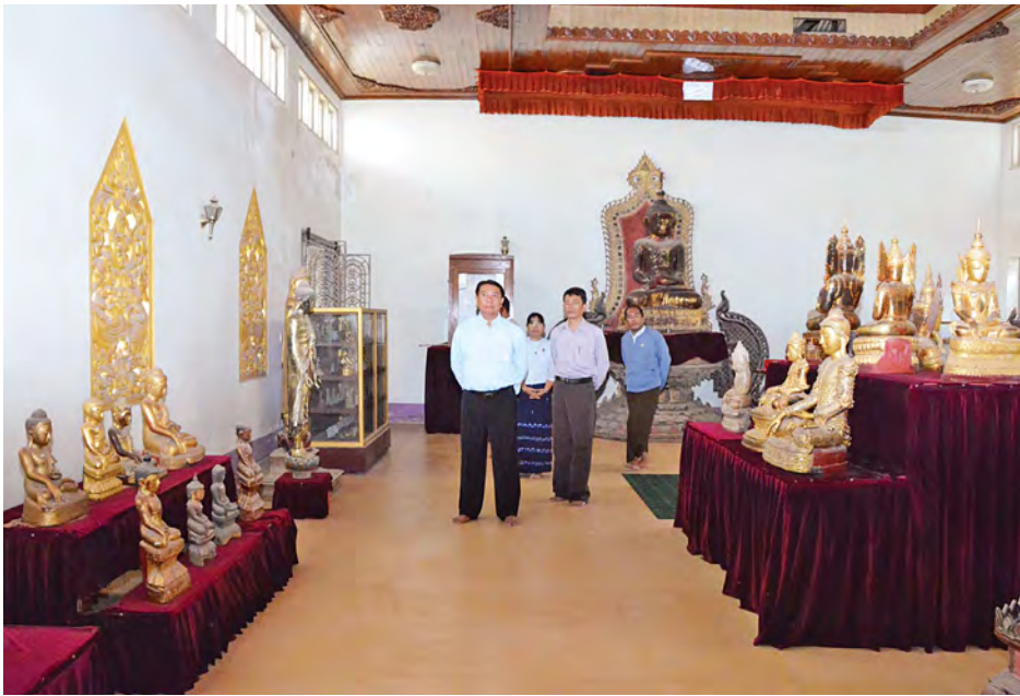
ယဉ်ကျေးမှုဝန်ကြီးဌာန ပြည်ထောင်စုဝန်ကြီး ဦးအေးမြင့်ကြူ စစ်ကိုင်းဗုဒ္ဓပြတိုက်နှင့် ယဉ်ကျေးမှုပြတိုက် ကို ကြည့်ရှုစစ်ဆေးစဉ်။

ယဉ်ကျေးမှု ဝန်ကြီးဌာန ပြည်ထောင်စုဝန်ကြီး ဦးအေးမြင့်ကြူ သည် စက်တင်ဘာ ၂၀ ရက် နံနက် ပိုင်းတွင် စစ်ကိုင်းမြို့၊ ထူပါရုံဘုရား ကျောက်စာရုံ၌ ထူပါရုံဘုရားသမိုင်း မှတ်တမ်းကျောက်စာ အပါအဝင် စစ်ကိုင်းတိုင်းဒေသကြီး၊ မန္တလေးတိုင်း ဒေသကြီး တစ်ဝိုက်ရှိ ဒေသအနှံ့ အပြားမှရရှိသော ပင်းယခေတ်မှ ကုန်းဘောင်ခေတ်ဦးပိုင်း အေဒီ (၁၄) ရာစုမှ (၁၈)ရာစုအထိ ရေးထိုးထား သော ကျောက်စာ ၂၄ ချပ်ကို ၁၉၀၅ ခုနှစ်ကတည်းက ကျောက်စာရုံတည် ဆောက်ထိန်းသိမ်းစောင့်ရှောက်ထား မှုကို ကြည့်ရှုစစ်ဆေးပြီး လေ့လာ သူများ၊ သုတေသီများ အလွယ်တကူ ဖတ် ရှုလေ့လာသိရှိနိုင်ရေးအတွက် ကျောက်စာချပ်များတွင် ရေးထိုးထား သည့် အကြောင်းအရာရှင်းလင်းချက် များ စနစ်တကျရေးသား ပြသထားရေး မှာကြားသည်။