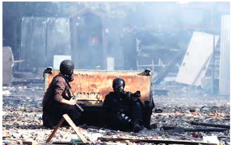
အီဂျစ်နိုင်ငံတွင်း၌ ဗုံးခွဲတိုက်ခိုက်မှုများ တိုးတက်ဖြစ်ပွားလျက်ရှိရာ မြို့တော်ကိုင်းရို အလယ်ပိုင်း၌ တိုက်ခိုက်မှုတစ်ရပ် ဖြစ်ပွားအပြီး တွေ့ရစဉ်။