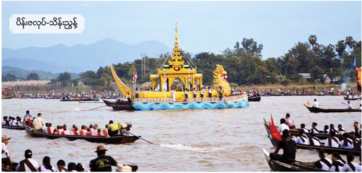
ရင်ဥပုတ္တ ရဟန္တာမထေရ်မြတ် ကိန်းဝပ်စပယ်ရာ ကရဝိတ်ဖောင်တော် လှည့်လည်အပူဇော်ခံနေစဉ်။

မြန်မာနိုင်ငံတစ်ဝန်း၌ ဒေသ အလိုက် ကျင်းပဆင်နွှဲသည့်ပွဲတော် များအနက် ပဲခူးတိုင်းဒေသကြီး ရွှေကျင်မြို့နယ်အတွင်းရှိ ရွှေကျင် သီတင်းကျွတ် မီးပျော့ပွဲသည် နာမည်ကျော်ကြားလှပြီး ကာလ ရှည်ကြာစွာ ကျင်းပသည့်ပွဲတော်ကြီး လည်းဖြစ်သည်။ ၁၂ ရာသီ ပွဲတော်များအနက် ရွှေကျင်သီတင်းကျွတ်မီးပျော့ပွဲ ဖြစ်သည့် ဒေသတွင်း၌သာမက မြန်မာ နိုင်ငံအရပ်ရပ်သို့ပင် ပျံ့နှံ့ကျော်ကြား သည်။ ကုန်းဘောင်ခေတ် နှောင်းပိုင်းမှ စ၍ ကျင်းပလာခဲ့သော ရွှေကျင် မီးပျော့ပွဲသည် မြတ်စွာဘုရား အားအမျိုးထား၍ တောင်သမုဒ္ဒရာ၌ ကြေးပြာသားဖြင့် စံမြန်းနေသည့် စာမျက်နှာ ၃ ကော်လံ ၅ သို့