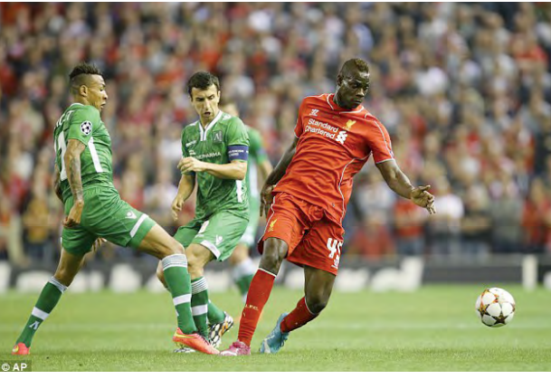
(နိုင်လင်းကြည်)

ထို့ကြောင့် တိုက်စစ်မှူး ဘာလော့ တယ်လီအနေဖြင့် လီဟာပူး၌ အောင် မြင်မှုရလိုပါက ဘာစီလိုနာအသင်း သို့ ပြောင်းရွှေ့သွားခဲ့သည့် ဥရုဠေး တိုက်စစ်မှူး လူးဝစ်ဆွာရက်ဒ်၏ စွမ်းဆောင်ရည်ကိုမိအောင် ကြိုးစား ရဦးမည်ဖြစ်ကြောင်း လီဟာပူးအသင်း နည်းပြ ဘရန်ဒန် ရော့ဂျာက ပြော