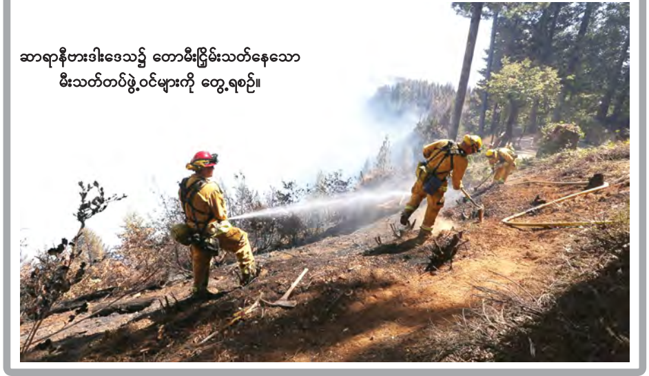
ဆာရာနီဗားဒါဒေသ၌ တောမီးငြိမ်းသတ်နေသော မီးသတ်တပ်ဖွဲ့ဝင်များကို တွေ့ရစဉ်။

လော့စ်အိန်ဂျလစ် စက်တင်ဘာ ၁၈ အမေရိကန်ပြည်ထောင်စု ကာလီဖိုးနီးယားပြည်နယ် ဆာရာနီဗားဒါဒေသ၌ တောမီးလောင်လျက်ရှိရာ မီးသတ်တပ်ဖွဲ့ဝင်များက ကြိုးစားပန်းစား မီးငြိမ်းသတ်ပေးလျက်ရှိကြောင်း ဒေသ ဆိုင်ရာသတင်းဌာနများက သတင်းထုတ်ပြန်သည်။