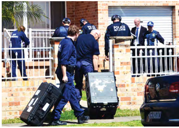
အကြမ်းဖက်မှုတိုက်ဖျက်ရေး စစ်ဆင်ရေးလုပ်ငန်းကို ဩစတြေးလျရဲတပ်ဖွဲ့ဝင်များ ပြုလုပ်ကြစဉ်။

အိဒင်ဘရာ စက်တင်ဘာ ၁၈ ဩစတြေးလျနိုင်ငံအတွင်း၌ နမူနာပြသတ်ဖြတ်မှုများပြုလုပ်ရန် အစွလာမစ်နိုင်ငံ ထိပ်တန်းစစ်သွေးကြွ တစ်ဦးက တိုက်တွန်းပြောကြားလိုက်သည့်အတွက် ရဲတပ်ဖွဲ့က အကြမ်းဖက်မှုတိုက်ဖျက်ရေး အကြီးစားစစ်ဆင်ရေးများကို ပြုလုပ် ခဲ့ကြောင်း ဝန်ကြီးချုပ် တိုနီအက်ဘော့က ယနေ့ပြောကြားလိုက်သည်။