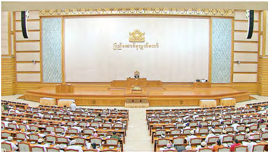
ပထမအကြိမ် ပြည်ထောင်စုလွှတ်တော် (၁၁)ကြိမ်မြောက် ပုံမှန်အစည်းအဝေးတတိယနေ့ ကျင်းပစဉ်။ (သတင်းစဉ်)