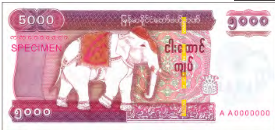
မျက်နှာဘက်