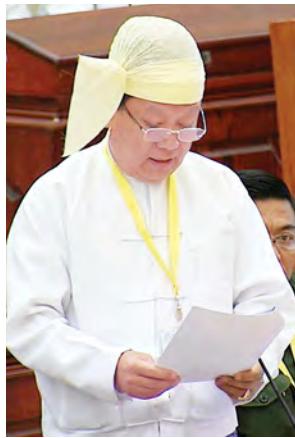
သမ္မတရုံးဝန်ကြီးဌာန ဒုတိယဝန်ကြီး ဦးအောင်သိန်း။

မြောက်ဦးခရိုင်တွင် ဝန်ထမ်းအိမ်ရာများကို ၂၀၁၅-၂၀၁၆ ဘဏ္ဍာနှစ်တွင် ဆောက်လုပ် ပေးရန် အစီအစဉ်ရှိ/မရှိ မေးခွန်းနှင့်စပ်လျဉ်း၍ မြောက်ဦးခရိုင်တွင် ဝန်ထမ်း များအတွက် ဝန်ထမ်းအိမ်ရာများဆောက်လုပ်ပေးရန်မှာ အိမ်ရာများအတွက် လိုအပ်သည့်မြေရရှိရန် ဆောင်ရွက်ရမည်ဖြစ်ပါကြောင်း၊ မြေရရှိပြီးဖြစ်ပါက ၂၀၁၄-၂၀၁၅ ဘဏ္ဍာရေးနှစ် ဖြည့်စွက်ရန်ပုံငွေတွင် ထည့်သွင်းတောင်းခံနိုင်သော် လည်း ဖြည့်စွက်ရန်ပုံငွေမှာ မူလခန့်မှန်းခြေတန်ဖိုး၏ ၁၀ ရာခိုင်နှုန်းထက် ကျော်လွန်တောင်းခံခြင်းအား ခွင့်ပြုမထားပါသောကြောင့် ၁၀ ရာခိုင်နှုန်းထက် မကျော်လွန်ပါကလည်း ဖြည့်စွက်ရန်ပုံငွေခွင့်ပြုရရှိသည့်အချိန်သည် သာမန် အားဖြင့် ဒီဇင်ဘာလအတွင်းသာ ခွင့်ပြုပေးလေ့ရှိသဖြင့် ဝန်ထမ်းအိမ်ရာများ ဆောက်လုပ်ရန် အချိန်မီပြီးစီးနိုင်မည်မဟုတ်ပါကြောင်း၊ မြောက်ဦးခရိုင်တွင် တာဝန်ထမ်းဆောင်နေသော ဝန်ထမ်းများသည် ဝန်ကြီးဌာနအသီးသီးမှ ဝန်ထမ်းများဖြစ်သည့်အတွက် ပြည်ထောင်စုဘဏ္ဍာရန်ပုံငွေဖြင့် ဆောင်ရွက်နေ သော ဌာနများသည် ပြည်ထောင်စုမှလည်းကောင်း၊ ပြည်နယ်ဘဏ္ဍာရန်ပုံငွေ တွင် ပါဝင်သောဌာနများသည် ပြည်နယ်မှလည်းကောင်း ဒေသလိုအပ်ချက်အပေါ် မူတည်၍ ၂၀၁၅-၂၀၁၆ ခုနှစ် ဘဏ္ဍာရေးနှစ်တွင် ဝန်ထမ်းအိမ်ရာများအား ထည့်သွင်းလျာထားတင်ပြဆောင်ရွက်သွားနိုင်မည်ဖြစ်ပါကြောင်းဖြင့် ဖြေကြားခဲ့ သည်။