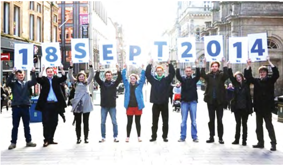
ဂလပ်စတီမြို့၌ ပြည်သူ့ဆန္ဒခံယူပွဲအကြို မဲဆွယ်စည်းရုံးမှု ပြုလုပ်သည့် မှတ်တမ်းပုံ။