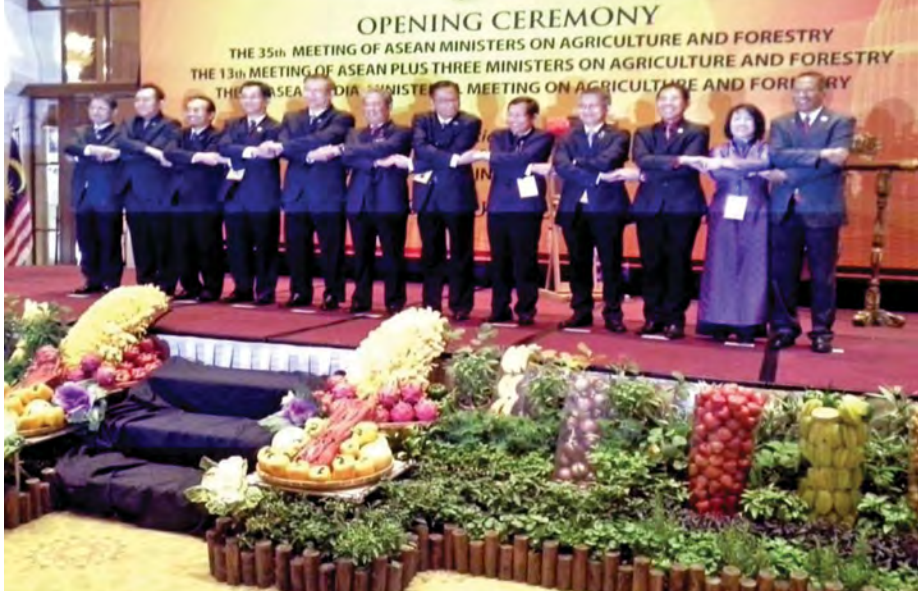
၂၀၁၄ ခုနှစ် (၃၅) ကြိမ်မြောက် လယ်ယာစိုက်ပျိုးရေးနှင့် သစ်တောဆိုင်ရာ အာဆီယံဝန်ကြီးများအစည်းအဝေးဖွင့်ပွဲအခမ်းအနား။

အစည်းအဝေး ကျင်းပစဉ်ကာလတွင် လယ်ယာ၊ သားငါး၊ သစ်တောထွက်ကုန်ပစ္စည်း ပြခန်းများကို သက်ဆိုင်ရာ ဝန်ကြီးဌာနများနှင့် ပုဂ္ဂလိကကဏ္ဍများမှ အဆင့်အတန်းရှိရှိ ပြသဆောင်ရွက်သွားနိုင်ခြင်းဖြင့်