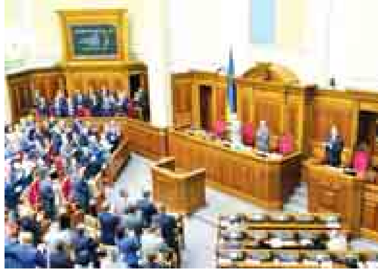
ဥရောပသမဂ္ဂနှင့် လွတ်လပ်စွာကုန်သွယ်မှု ပြုလုပ်ရန် ဖော်ပြသည့် သဘောတူညီချက်ကို ယူကရိန်းပါလီမန်က အတည်ပြုစဉ်။

ဆိုးလ် စက်တင်ဘာ ၁၇ တောင်ကိုရီးယား အာဏာပိုင်များက ၎င်းတို့သည် မြောက်ကိုရီးယားနိုင်ငံသို့ ရေကူးသွားရန် ကြိုးစားလျက်ရှိသည်ဟု ယုံကြည်ရသော အမေရိကန်အမျိုးသား တစ်ဦးကို ထိန်းသိမ်းထားကြောင်း ယနေ့ပြောကြားသည်။ စစ်မဲ့ဇုန်အနီး နယ်ခြားမြစ်တစ်စင်း၌ အသက် ၂၀ ကျော် ၃၀ အရွယ်အမျိုးသား တစ်ဦးကို အစောင့်တပ်ဖွဲ့က အင်္ဂါနေ့တွင် ဖမ်းဆီးခဲ့သည်။ ဟန်မြစ်၏တောင်ဘက်ပိုင်းကမ်းစပ်တွင် အမေရိကန်အမျိုးသားတစ်ဦး လဲလျောင်းနေသည်ကို နယ်ခြားစောင့်ကင်းလှည့်တပ်ဖွဲ့က တွေ့ရှိခဲ့ခြင်းဖြစ်ကြောင်း အစိုးရအဖွဲ့ သတင်းအရင်းအမြစ်က တောင်ကိုရီးယား ယွန်ဟပ် သတင်းဌာနသို့ ပြောကြားခဲ့သည်။ အဆိုပါ အမေရိကန်က ၎င်းသည် မြောက်ကိုရီးယား ခေါင်းဆောင် ကင်ဂျီအန်ကို တွေ့လိုကြောင်း စုံစမ်းစစ်ဆေးသူများအား ပြောခဲ့သည်ဟု ယွန်ဟပ်က ဖော်ပြသည်။ မြောက်ကိုရီးယားနိုင်ငံက အမေရိကန်နိုင်ငံသားတစ်ဦးကို ရန်လိုသော အပြုအမူအတွက် အလုပ်ကြမ်းနှင့် ထောင်ဒဏ်ခြောက်နှစ် အပြစ်ပေးပြီး နောက် ရက်ပိုင်းအတွင်း ယင်းဖြစ်ရပ် ပေါ်ပေါက်လာခြင်းဖြစ်သည်။ မက်သရူးမီလာနှင့် အခြားအမေရိကန် နိုင်ငံသားနှစ်ဦးကို မြောက်ကိုရီးယားက ထိန်းသိမ်းထားသည်။ ဘီဘီစီ