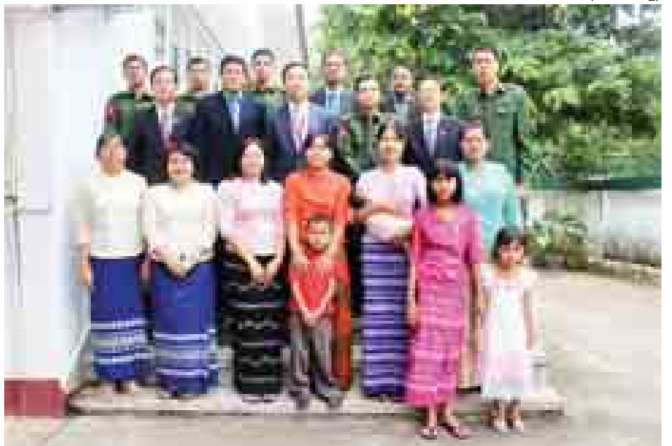
ပြည်ထောင်စုလွှတ်တော်နာယက ပြည်သူ့လွှတ်တော်ဥက္ကဋ္ဌ သူရဦးရွှေမန်း လာအိုပြည်သူ့ဒီမိုကရက်တစ်သမ္မတနိုင်ငံရှိ မြန်မာသံရုံးနှင့် စစ်သံရုံးတို့မှ မိသားစုများနှင့် ရင်းရင်းနှီးနှီးတွေ့ဆုံပြီး အမှတ်တရဓာတ်ပုံရိုက်စဉ်။ (သတင်းစဉ်)