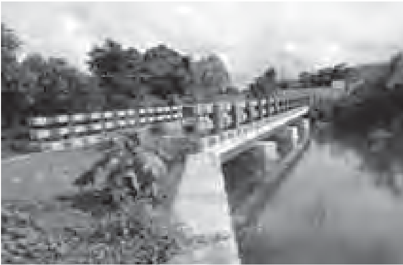
အဆိုပါကျေးရွာချင်းဆက်လမ်း ဖောက်လုပ်ပြီးစီး လူဦးရေ ၈၄၀ အတွက် အကျိုးပြုမည်ဖြစ်ကြောင်း ပါက ၎င်းကျေးရွာများရှိ အိမ်ခြေ ၁၀၈ အိမ်၊ သိရသည်။ မြို့နယ်ပြန်/ဆက်

ထို့ပြင် လင်ဖုံကြီး-ဝမ်ပန် ကျေးရွာချင်းဆက်လမ်း အရှည် ၀/၃ ဒသမ ၇၈၈ မိုင်ကို ကုန်ကျငွေကျပ် သန်း ၂၃ ဒသမ ၅၁၄ ဖြင့် ၂၀၁၄ - ၂၀၁၅ ဘဏ္ဍာနှစ်အတွင်း ဖောက်လုပ်သွားမည်ဖြစ်ကြောင်း၊