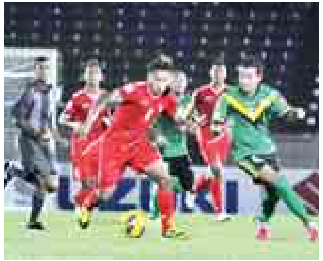
၂၀၁၂ ဆူဇက်ဖလားခြေစစ်ပွဲတွင် မြန်မာအသင်းယှဉ်ပြိုင်နေစဉ်။