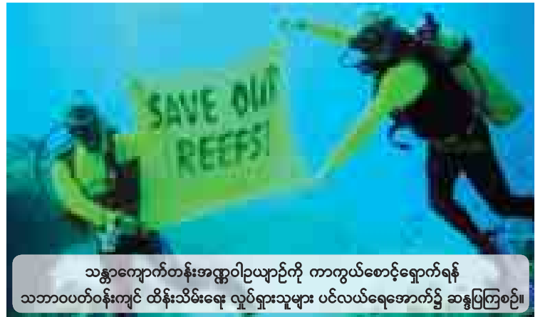
သန္တာကျောက်တန်းအန္တရာတိဥယျာဉ်ကို ကာကွယ်စောင့်ရှောက်ရန် သဘာဝပတ်ဝန်းကျင် ထိန်းသိမ်းရေး လှုပ်ရှားသူများ ပင်လယ်ရေအောက်၌ ဆန္ဒပြကြစဉ်။

မန်လာ စက်တင်ဘာ ၁၇ အမေရိကန်ရေတပ် စစ်သင်္ဘောတစ်စင်း ကြောင့် သန္တာကျောက်တန်းများ ပျက်စီးခဲ့ရမှုအတွက် ဖိလစ်ပိုင်နိုင်ငံက အမေရိကန် ထံမှ လျော်ကြေးတောင်းခံမှု ဆက်လက်ပြုလုပ် သွားမည်ဖြစ်ကြောင်း ဖိလစ်ပိုင်နိုင်ငံခြားရေး ဝန်ကြီးဌာနက ထုတ်ပြန်ကြေညာချက်တစ်ရပ် တွင် ဖော်ပြသည်။ ၂၀၁၃ ခုနှစ် ဇန်နဝါရီလက တပ်ဘာတာ ဟာ သန္တာကျောက်တန်းဒေသ၌ အမေရိကန် ရေတပ်မှ ယူအက်စ်အက်စ် ဂါဒီယန်အမည်ရှိ မိုင်းငုံရှင်းလင်းရေး သင်္ဘောသောင်တင်ခဲ့ရာမှ သန္တာကျောက်တန်းများ ပျက်စီးခဲ့ရမှုအတွက်