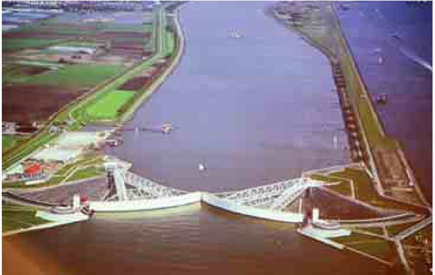
နယ်သာလန်နိုင်ငံရှိ Maeslandtkering ရေထိန်းတံခါးပုံစံငယ်ကို တွေ့ရစဉ်။