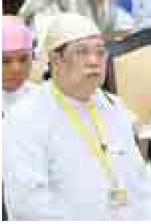
ဆောက်လုပ်ရေးဝန်ကြီးဌာန ဒုတိယဝန်ကြီး ဦးစိုးတင့်။

လမ်းကွန်ရက် အမှတ်(၄)ဖြစ်သည့် လပွတ္တာ(ကျောက်ဖျာလေး)-သုံးခွ-အုတ်တွင်း-ထိပ်စွန်းလမ်းသည် (၆၂) မိုင်(၃)ဖာလုံရှည်လျားပြီး အမာခံလမ်းခင်းခြင်း (၂)မိုင် (၂)ဖာလုံဆောင်ရွက်လျက်ရှိပါကြောင်း၊ တံတား(၁၃)စင်း တည်ဆောက်ရန်ရှိသည့်အနက် (၁၁) စင်း တည်ဆောက်ပြီးဖြစ်ပါကြောင်း၊ ပြန်ဝချောင်းတံတားကို ၂၀၁၄-၂၀၁၅ ဘဏ္ဍာနှစ်တွင် အပြီးတည်ဆောက်သွားမည်ဖြစ်ပါကြောင်း၊ တည်ဆောက်ရန်ကျန်ရှိသည့် သတ္တဝယ်သောင်မြစ်ကူးတံတားသည် မြစ်ကျယ်ကြီးပေါ်တွင် ဆောင်ရွက်ရမည့် တံတားကြီးဖြစ်သောကြောင့် မြစ်ကျယ်ကြီးပေါ်တွင်နေရာရွေးချယ်၍ တည်ဆောက်သွားမည်ဖြစ်ပါကြောင်း။ လမ်းကွန်ရက် အမှတ်(၅)ဖြစ်သည့် ဘိုကလေး-ကြိမ်ချောင်း-ကဒုံကန်လမ်း