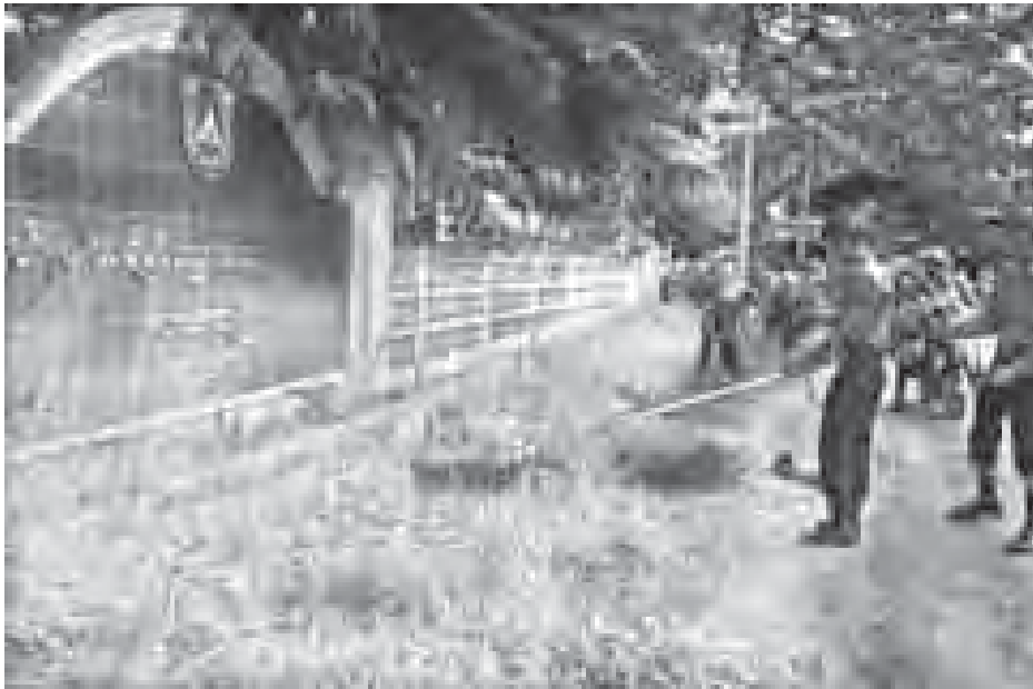
ဟင်္သာတမြို့နယ်ရှိ မီးရထားရဲတပ်ဖွဲ့မှ ပြည်သူ့အကျိုးပြုလုပ်ငန်းများ ဆောင်ရွက်

ဝေါဟာရများ၊ ဘေးအန္တရာယ်ကျ ရောက်လွယ်မှုနှင့် စွမ်းဆောင်ရည် ဆန်းစစ်မှုသိအိရီ၊ ဆုံးရှုံးပျက်စီးမှု နှင့် လိုအပ်ချက်များသုံးသပ်ခြင်း၊ လူထုအခြေပြု ဘေးအန္တရာယ်လျော့ ပါးရေးဆိုင်ရာ စီမံချက်ရေးဆွဲခြင်း၊ သတင်းအချက်အလက်ပေးခြင်း၊ စည်းရုံးလှုံ့ဆော် အကောင်အထည် ဖော်ခြင်းနှင့် စောင့်ကြည့်လေ့လာ အကဲဖြတ်ခြင်း စသည့်သင်ခန်းစာ များကို သင်တန်းဆရာ၊ ဆရာမငါးဦး တို့က စာတွေ့လက်တွေ့ သင်ကြားပို့ချ သွားမည်ဖြစ်သည်။ အဆိုပါသင်တန်းသို့ မွန်ပြည်နယ်၊ ချောင်းဆုံမြို့နယ်ရှိ ဆယ်ပလာကျေး ရွာ၊ ခရိုင်နီးဟုကျေးရွာ၊ ဇီကုန်းကျေး ရွာ၊ တော်ပွန်ရွာ နှင့် ဟင်္သာကျွန်းရွာ များမှ သင်တန်းသား၊ သင်တန်းသူ စုစုပေါင်း ၃၀ ဦး တက်ရောက်ခဲ့ကြပြီး၊ သင်တန်းကာလကို စက်တင်ဘာ ၁၅ ရက်မှ ၁၇ ရက်အထိ သုံးရက်ကြာ သင်ကြားခဲ့ကြောင်း သိရသည်။ ဆက်မေဇင်းအောင်