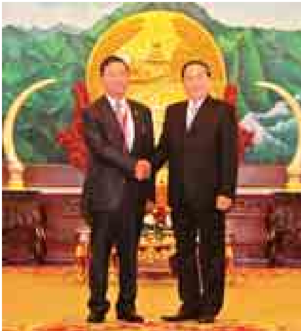
ပြည်ထောင်စုလွှတ်တော်နာယက ပြည်သူ့လွှတ်တော်ဥက္ကဋ္ဌ သူရဦးရွှေမန်း လာအိုပြည်သူ့ဒီမိုကရက်တစ်သမ္မတနိုင်ငံ သမ္မတနှင့် ရင်းရင်းနှီးနှီးတွေ့ဆုံနှုတ်ဆက်စဉ်။ (သတင်းစဉ်)

ယင်းနောက် ပြည်ထောင်စုလွှတ်တော်နာယက ပြည်သူ့လွှတ်တော်ဥက္ကဋ္ဌ သူရဦးရွှေမန်းသည် ဒေသစံတော်ချိန် နံနက် ၁၁ နာရီတွင် သမ္မတနန်းတော်၌ လာအိုပြည်သူ့ဒီမိုကရက်တစ်သမ္မတနိုင်ငံ သမ္မတ H.E. Mr. Choummaly SAYASONE ၏ အာဆီယံလွှတ်တော်ဥက္ကဋ္ဌများ၊ လွှတ်တော်ကိုယ်စားလှယ်အဖွဲ့ခေါင်းဆောင်များနှင့်လေ့လာသူ နိုင်ငံများမှ ကိုယ်စားလှယ်များအားတွေ့ဆုံသည့် အခမ်းအနားသို့ တက်ရောက်ခဲ့ကြောင်း သတင်းရရှိသည်။ (သတင်းစဉ်)