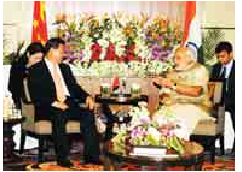
အိန္ဒိယနိုင်ငံ ဂူဂျာရတ်ပြည်နယ် အာမက်ဒါဘတ်မြို့၌ တရုတ်သမ္မတနှင့် အိန္ဒိယဝန်ကြီးချုပ်တို့ တွေ့ဆုံဆွေးနွေးကြစဉ်။

ခဲ့ကြသော်လည်းယခုအချိန်အထိ ဖြေရှင်းချက်မရရှိခဲ့ကြပေ။ အိန္ဒိယနိုင်ငံတွင် ဝန်ကြီးချုပ်သစ် နရိန္ဒြာ မိုဒီ ဦးဆောင်သော အစိုးရအဖွဲ့သစ် တက်လာခဲ့ပြီးနောက် တရုတ်နိုင်ငံနှင့် ဆက်ဆံရေးမြှင့်တင်ရန် ဦးတည်လာသည်။ သုံးရက်ကြာခရီးစဉ်၏ အစပျိုးမှုအဖြစ် တရုတ်သမ္မတသည် ဂူဂျာရတ်ပြည်နယ် အာမက်ဒါဘတ်မြို့သို့ ရောက်ရှိလာခဲ့သည်။ ဂူဂျာရတ်ပြည်နယ်သည် ပြည်နယ်ဝန်ကြီးချုပ်အဖြစ် မိုဒီတာဝန်ယူခဲ့သော ဒေသဖြစ်သည်။ ဝီတီအိုင်း