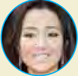
တရုတ်မင်းသမီး ဂေါင်းလီ