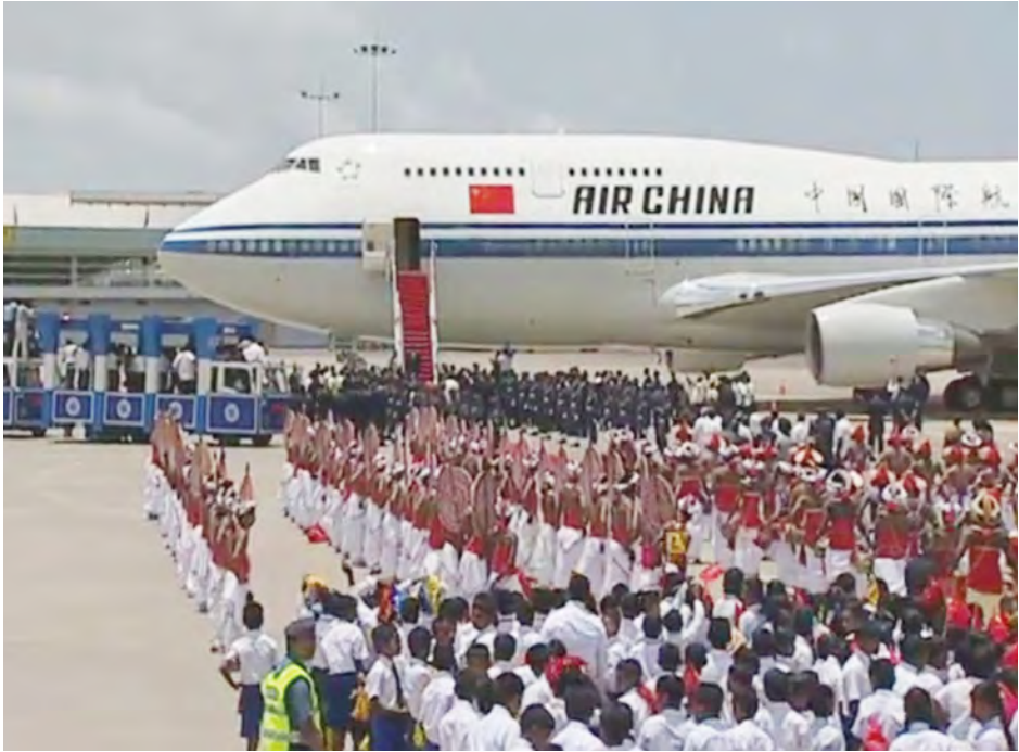
စက်တင်ဘာ ၁၆ ရက်က သီရိလင်္ကာနိုင်ငံ ကိုလံဘိုလေဆိပ်သို့ တရုတ်သမ္မတ ရီကျင့်ဖျင် လိုက်ပါလာသောလေယာဉ် ဆိုက်ရောက်လာစဉ်။

ဆယ်စုနှစ်အတန်ကြာကာလအတွင်း သီရိလင်္ကာ နိုင်ငံသို့ လာရောက်သည့် တရုတ်နိုင်ငံ အကြီးအကဲ တစ်ဦး၏ ပထမဆုံးခရီးစဉ်အဖြစ် စက်တင်ဘာ ၁၆ ရက် တွင် တရုတ်သမ္မတရီကျင့်ဖျင်သည် ယင်းနိုင်ငံသို့ ဆိုက် ရောက်လာသည်။ အာရှတိုက်ရှိ နိုင်ငံလေးနိုင်ငံသို့ ခရီးလှည့်လည်နေ သော တရုတ်သမ္မတ၏ တတိယခရီးစဉ်အဖြစ် နိုင်ငံ အဖြစ် သီရိလင်္ကာနိုင်ငံသို့ ရောက်ရှိလာခြင်းဖြစ်သည်။ တရုတ်သမ္မတသည် တာရှီကစ္စတန်နှင့် မော်လဒိုက် နိုင်ငံတို့သို့ရောက်ရှိခဲ့ပြီး စက်တင်ဘာ ၁၇ ရက်တွင် အိန္ဒိယ နိုင်ငံသို့ ရောက်ရှိမည်ဖြစ်သည်။ သီရိလင်္ကာနိုင်ငံတွင်ရှိနေစဉ် သမ္မတရီကျင့်ဖျင် သမ္မတ မဟိန္ဒရာဂျာပတ်ဆေးနှင့် တွေ့ဆုံဆွေးနွေးမည်ဖြစ်ပြီး ဝန်ကြီးချုပ် ဒီအမ်ဂျာယာရတ်နီနှင့် လွှတ်တော်ဥက္ကဋ္ဌ ချာမယ်လ်ရာဂျာပတ်ဆေးတို့နှင့်လည်း တွေ့ဆုံကာ နှစ်နိုင်ငံဆက်ဆံရေး မြှင့်တင်နိုင်မည့် နည်းလမ်းများကို ဆွေးနွေးမည်ဖြစ်သည်။ တရုတ်နိုင်ငံက အဆိုပြုထားသော ပိုးလမ်းမ ကုန်သွယ်ရေးဇုန်နှင့် ၂၁ ရာစု ပင်လယ်ရေကြောင်း ပိုးလမ်းမကုန်သွယ်ရေးဇုန်အစီစဉ်တို့ကို သီရိလင်္ကာနိုင်ငံက အင်တိုက်အားတိုက် ထောက်ခံနေချိန်တွင် တရုတ်သမ္မတ၏ သမိုင်းဝင်ခရီးစဉ်ဖြစ်ပေါ် လာခဲ့သည်။ တရုတ်နှင့်သီရိလင်္ကာတို့၏ လွတ်လပ်သောကုန်သွယ် ရေး သဘောတူညီချက်ရရှိရေး ဆွေးနွေးပွဲအတွက် ရီကျင့် ဖျင်၏ ခရီးစဉ်က အားသစ်လောင်းပေးလိမ့်မည်ဟု မျှော်လင့်ရကြောင်း သတင်းတွင်ဖော်ပြသည်။