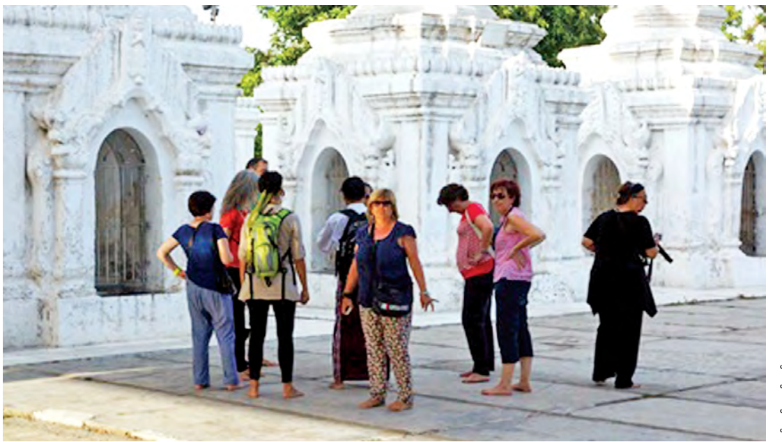
မန္တလေးမြို့ ကုသိုလ်တော်ဘုရားတွင် လေ့လာဖူးမြော်နေကြသော ကမ္ဘာလှည့်ခရီးသွားများကို တွေ့ရစဉ်။

မန္တလေး စက်တင်ဘာ ၁၆ မြန်မာနိုင်ငံအတွင်းရှိ သဘာဝအလှတရားများနှင့် ရှေးဟောင်းယဉ်ကျေးမှုအမွေအနှစ်လက်ရာများကို တစ်နေ့ထက်တစ်နေ့ ကမ္ဘာကသိရှိလာသည်နှင့်အမျှ ၎င်းအလှတရားများနှင့် လက်ရာမွန်များကိုလေ့လာရန် နိုင်ငံခြားသားခရီးသွားဧည့်သည်များ နေ့စဉ်ဝင်ရောက်လျက်ရှိရာ မန္တလေးမြို့သည် ရှေးဟောင်းယဉ်ကျေးမှုအမွေအနှစ်လက်ရာအများဆုံးတည်ရှိသောမြို့တော်ဖြစ်သည်။ “နိုင်ငံခြားသားခရီးသွားတွေက မန္တလေးမြို့ကို တော်တော်စိတ်ဝင်စား လာရောက်လည်ပတ်ကြတယ်။ ကျွန်တော်တို့က သူတို့ကို မန္တလေးမြို့ကို လိုက်လံပြသရာ မြောက်ဘက်ခြမ်းတစ်ရက်၊ တောင်ဘက်ခြမ်း တစ်ရက် နှစ်ရက်လောက် လိုက်လံပို့ဆောင်ပေးရကြောင်း၊ မြောက်ဘက်ခြမ်းဆိုရင် ကုသိုလ်တော်ဘုရား၊ ကျောက်တော်ကြီးဘုရား၊ မန္တလေးတောင်၊ မန္တလေးကျိုးမြို့ရိုး၊ နန်းမြို့တွင်းရှိ ရွှေကျောင်းကြီး၊ မင်းကွန်းဒေသရှိ ပုထိုးတော်ကြီးနှင့် ခေါင်းလောင်းကြီး စသည်ဖြင့်ပေါ့။ တောင်ဘက်ခြမ်းဆိုရင်လည်း မဟာမြတ်မုနိဘုရားကြီး၊ ဦးပိန်တံတား၊ ဗားကရာကျောင်းတော်ကြီး၊ အင်းဝမြို့ရှိ ရှေးဟောင်းစေတီပုထိုးများသို့ စာမျက်နှာ ၉ ကော်လံ ၁ သို့ *