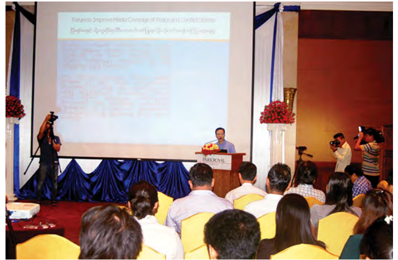
ငြိမ်းချမ်းရေးနှင့် ပဋိပက္ခဆိုင်ရာ မီဒီယာသတင်းဖော်ပြမှုများ ပိုမိုတိုးတက်စေရန် အကြံပြု ဆွေးနွေးပွဲ ကျင်းပစဉ်။ (သတင်းစဉ်)

ဆောက်ရန် အစရှိသည့်ကိစ္စရပ်များကို အပြန်အလှန် ဆွေးနွေးခဲ့ကြသည်။ Internews သည် နိုင်ငံတကာမီဒီယာ အဖွဲ့အစည်းတစ်ခုဖြစ်ပြီး အမေရိကန် အခြေစိုက် Internews Network နှင့် ဥရောပရှိ ဗြိတိန်အခြေစိုက် Internews Europe အဖွဲ့အစည်းနှစ်ဖွဲ့ဖြင့် ဆောင်ရွက် လျက်ရှိသည်။ မြန်မာနိုင်ငံတွင် Internews Myanmar ရုံးခွဲ ဖွင့်လှစ်ထားရှိပြီး မြန်မာ နိုင်ငံ၏ ငြိမ်းချမ်းရေးဖော်ဆောင်မှုနှင့် ပဋိပက္ခလျော့ပါးရေးအတွက် ယခုကဲ့သို့ ဆွေးနွေးပွဲများ၊ လုပ်ငန်းခွင် သတင်းခန်းနှင့် သင်တန်းများကို ပို့ချလျက်ရှိသည်။ (သတင်းစဉ်)