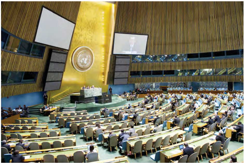
ကုလသမဂ္ဂ အထွေထွေညီလာခံ အစည်းအဝေး ကျင်းပသည့် မှတ်တမ်းပုံ။

(၆၉)ကြိမ်မြောက် အထွေထွေညီလာခံ အစည်းအဝေး ကာလအတွင်း ထုတ်ပြန်ကြေညာချက်ပေါင်း ၃၀၀၀ ကျော် နှင့် ဆုံးဖြတ်ချက်ပေါင်း ၈၀ ချမှတ်ခဲ့ကြောင်း အထွေထွေ ညီလာခံဥက္ကဋ္ဌဂျွန်အက်ရှ်က ပြောကြားသည်။ ရုရှားလက်ထောက်အဖွဲ့အစည်းများ ဖြစ်ပေါ်လာခြင်းနှင့် အလိက်နှင့် နိုင်ငံတကာအလိက် တရားဥပဒေစိုးမိုးရေး၊ ဖွံ့ဖြိုးရေးဆိုင်ရာ ရန်ပုံငွေများ ထောက်ပံ့ပေးရေး၊ အာကာသဆိုင်ရာ နည်းပညာကို ငြိမ်းချမ်းသော ရည်ရွယ်ချက်ဖြင့် အသုံးပြုရေး၊ လူ့အခွင့်အရေး စံနှုန်းများ မြှင့်တင်ရေး၊ သတင်းသမားများ ဘေးကင်းလုံခြုံစွာ သတင်းရယူနိုင်ရေးနှင့် ငြိမ်းချမ်းရေးထိန်းသိမ်းမှုတပ်ဖွဲ့ အတွက် အသုံးစရိတ်များရရှိရေး စသည့်အကြောင်းရပ် အမျိုးမျိုးကို ပြီးခဲ့သည့် အထွေထွေညီလာခံတွင် ဆွေးနွေးခဲ့ ကြသည်။