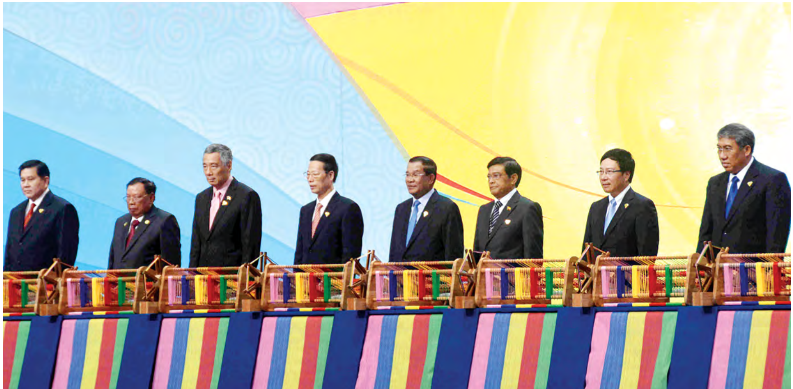
ဒုတိယသမ္မတ ဦးညွှန်ထွန်း၊ အာဆီယံအဖွဲ့ဝင်နိုင်ငံများမှ အကြီးအကဲများနှင့် တရုတ်ပြည်သူ့သမ္မတနိုင်ငံ ဒုတိယဝန်ကြီးချုပ်တို့ ၂၀ ရာစု ပင်လယ်ရေကြောင်း ပူးလမ်းမကြီးတည်ထောင်ရေး အထိမ်းအမှတ်အဖြစ် ပိုးလွန်းအိမ်များကို စက်ခလုတ်နှိပ်၍ ဖွင့်လှစ်ပေးကြစဉ်။

အဆိုပါ ဖွင့်ပွဲအခမ်းအနားသို့ ပြည်ထောင်စုသမ္မတမြန်မာနိုင်ငံတော် ဒုတိယသမ္မတ ဦးညွှန်ထွန်း၊ တရုတ်ပြည်သူ့သမ္မတနိုင်ငံ ဒုတိယဝန်ကြီးချုပ် မစ္စတာကျောင်းကောင်းလီ၊ စင်ကာပူသမ္မတနိုင်ငံ ဝန်ကြီးချုပ် မစ္စတာလီရှန်လွန်း၊ ကမ္ဘောဒီးယားနိုင်ငံဝန်ကြီးချုပ် ဆမ်ဒက်မ်ဟွန်ဆန်၊ လာအိုပြည်သူ့ဒီမိုကရက်တစ်သမ္မတနိုင်ငံ ဒုတိယသမ္မတ ဘွန်နန်ဗိုရာချစ်၊ ဗီယက်နမ် ဆိုရှယ်လစ်သမ္မတနိုင်ငံ ဒုတိယဝန်ကြီးချုပ် မစ္စတာဖန်တင်မင်း၊ ထိုင်းနိုင်ငံ ဒုတိယဝန်ကြီးချုပ် မစ္စတာဖောင်တက်မ်သပ်ခန်ဂျာန၊ အာဆီယံ ဒုတိယအတွင်းရေးမှူးချုပ် ဦးညွှန်လင်း၊ အာဆီယံနိုင်ငံများမှ ကိုယ်စားလှယ်များ၊ တရုတ်ပြည်သူ့သမ္မတနိုင်ငံနှင့် အာဆီယံနိုင်ငံများမှ စီးပွားရေးလုပ်ငန်းရှင်များ တက်ရောက်သည်။ ဖွင့်ပွဲအခမ်းအနားတွင် အာဆီယံနိုင်ငံများကိုယ်စား ဂုဏ်ထူးဆောင် ဦးဆောင်နိုင်ငံအဖြစ် ဆောင်ရွက်သည့် စင်ကာပူသမ္မတနိုင်ငံဝန်ကြီးချုပ် မစ္စတာ လီရှန်လွန်းနှင့်အတူ စာမျက်နှာ ၃ ကော်လံ ၁ သို့ ၂