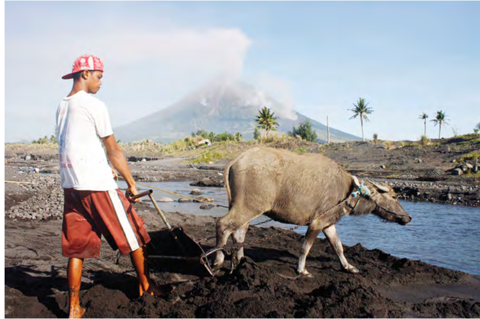
စက်တင်ဘာ ၁၆ ရက်က မေယွန်မီးတောင် ပေါက်ကွဲရန် လှုပ်ရှားနေသည်ကို တွေ့ရစဉ်။