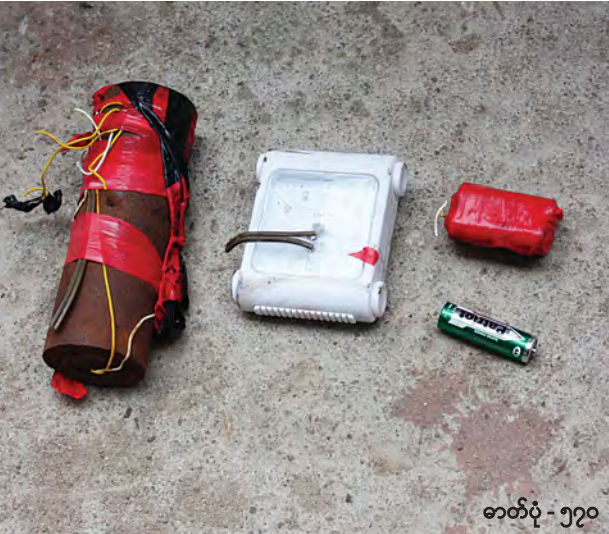
ဓာတ်ပုံ - ၅၇၀

မြဝတီ စက်တင်ဘာ ၁၆ မြဝတီမြို့ အမှတ်(၄)ရပ်ကွက် ဦးအောင်ဇေယျလမ်းဘေးတွင် ယနေ့ နံနက်ပိုင်းက ချိန်ကိုက်မိုင်း တစ်လုံး တွေ့ရှိရသဖြင့် အသက်မဲ့ ပြုလုပ်ခဲ့ကြောင်း သိရသည်။ (ယာပုံ) မြဝတီမြို့ မြန်မာ့စီးပွားရေးဘဏ် နှင့် မြို့နယ်တရားရုံးရှေ့ ခြံစည်းရိုး ဘေး လမ်းထောင့်၌ နံနက် ၈ နာရီ ၄၅ မိနစ်ခန့်တွင် ဈေးသည်တစ်ဦး က အဆိုပါပိုင်းကို တွေ့ရှိပြီး သက်ဆိုင်ရာသို့ ဆက်လက်သတင်း ပို့ခဲ့သဖြင့် တာဝန်ရှိသူများက နံနက် ၉ နာရီခန့်တွင် အသက်မဲ့ပြုလုပ်ခဲ့ ခြင်းဖြစ်ကြောင်း၊ ယနေ့ အသက်မဲ့ ပြုလုပ်ခဲ့သော ချိန်ကိုက်မိုင်းကို မွန်းတည့် ၁၂ နာရီတိတိတွင် ပေါက်ကွဲစေရန် ပြုလုပ်ထားခဲ့ ကြောင်း သိရသည်။ ယမန်နေ့ နံနက်ပိုင်းက မြန်မာ- ထိုင်းချစ်ကြည်ရေးတံတား ယာဘက်