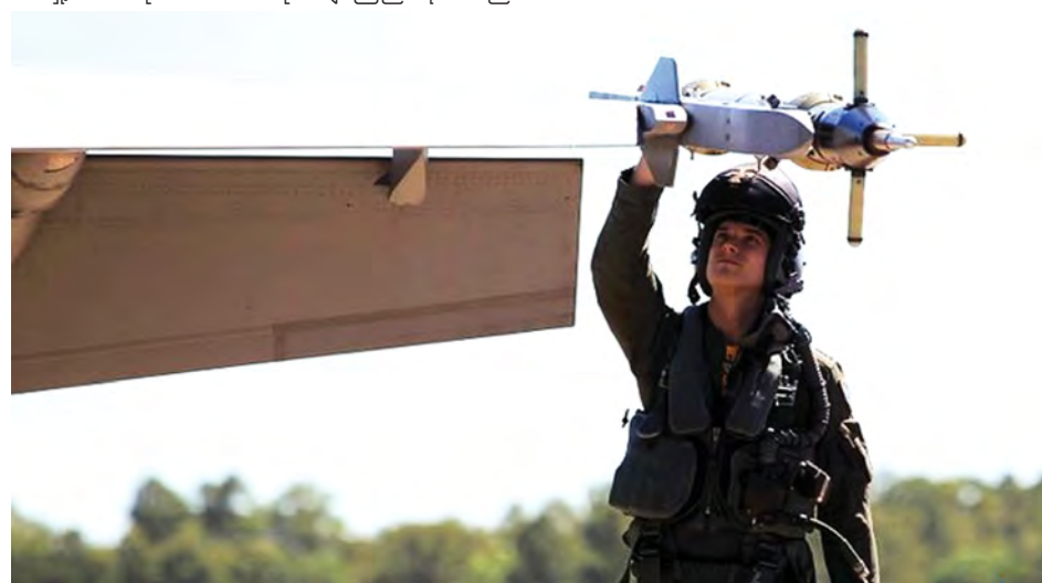
အိုင်အက်စ်အကြမ်းဖက်သမားများအား တိုက်ခိုက်ရန် သြစတြေးလျနိုင်ငံမှ တပ်ဖွဲ့ဝင် ၆၀၀နှင့်အတူ ဆူပါဟော့နက် ဂျက်တိုက်လေယာဉ်ရှစ်စင်းလည်း ပါဝင်ကြမည်ဖြစ်သည်။

သည် စက်တင်ဘာ ၁၃ရက် နှောင်းပိုင်းတွင် ပြင်သစ်နိုင်ငံ ပါရီမြို့သို့ ဆိုက်ရောက်လာမည်ဖြစ်ပြီး ယင်းမှာ ၎င်း၏ အရှေ့အလယ်ပိုင်းဒေသ လေးနိုင်ငံချစ်ကြည်ရေးအလည်