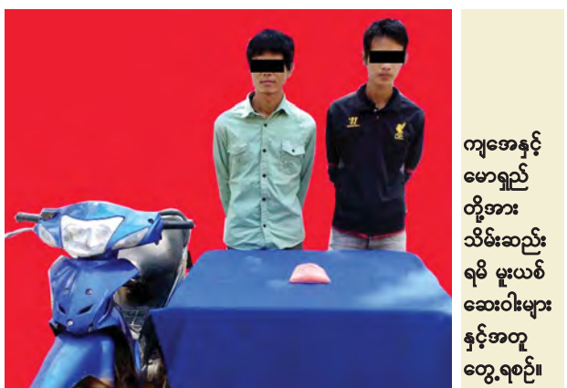
ကျအေနှင့် မောရှည် တို့အား သိမ်းဆည်း ရမိ မူးယစ် ဆေးဝါးများ နှင့်အတူ တွေ့ရစဉ်။

နိုင်ငံတော်ဝန်ထမ်းနည်းဥပဒေများအနက် အခြားသိရှိသင့်သည့် အချက်များကို ဆက်လက်ဖော်ပြသွားပါမည်။