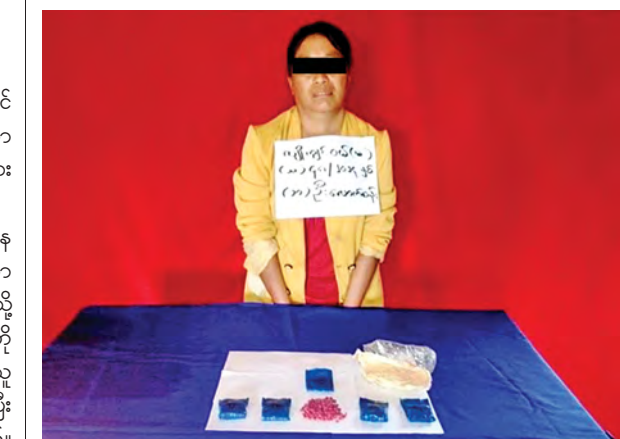
လျှို့ကျင်ဝမ်အား သိမ်းဆည်းရမိ မူးယစ်ဆေးဝါးများနှင့်အတူ တွေ့ရစဉ်။