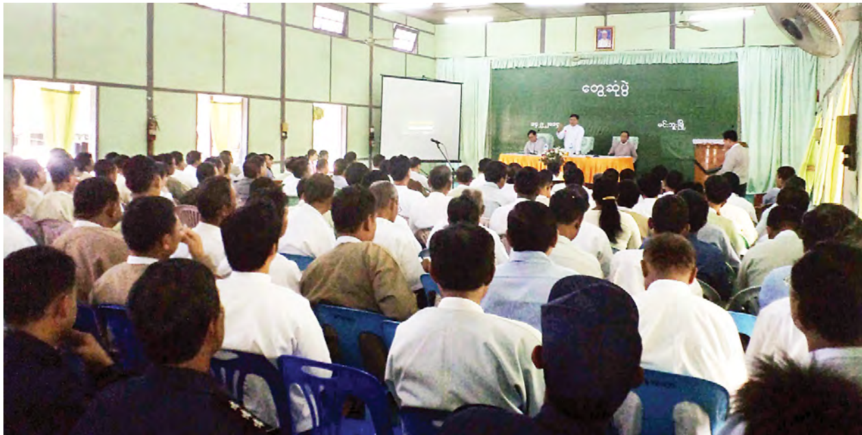
ပြည်ထောင်စုဝန်ကြီး ဦးစိုးသိန်း မင်းဘူးခရိုင် အထွေထွေအုပ်ချုပ်ရေးဦးစီးဌာနခန်းမ၌ ကျင်းပသည့် တွေ့ဆုံပွဲတွင် အမှာစကားပြောကြားစဉ်။ (သတင်းစဉ်)

ပြည်သူက ရွေးချယ်ထားသည့် အစိုးရသည် ပြည်သူနှင့် နီးကပ်စွာ တွေ့ဆုံပြီး ပြည်သူတို့၏ အခက်အခဲများကို ဖြေရှင်းပေးရန်လိုအပ်ပါကြောင်း၊ တိုင်းပြည်တည်ငြိမ်အေးချမ်းပြီး ဒီမိုကရေစီနိုင်ငံတော်ဖြစ်လာရန် အနာဂတ် မျိုးဆက်သစ်များအတွက် အခြေခံအုတ်မြစ်ကောင်းများ ချမှတ်ပေးရမည် ဖြစ်ကြောင်း၊ ပြည်သူဗဟိုပြုအုပ်ချုပ်ရေးစနစ်ပြုပြင်ပြောင်းလဲရာတွင်