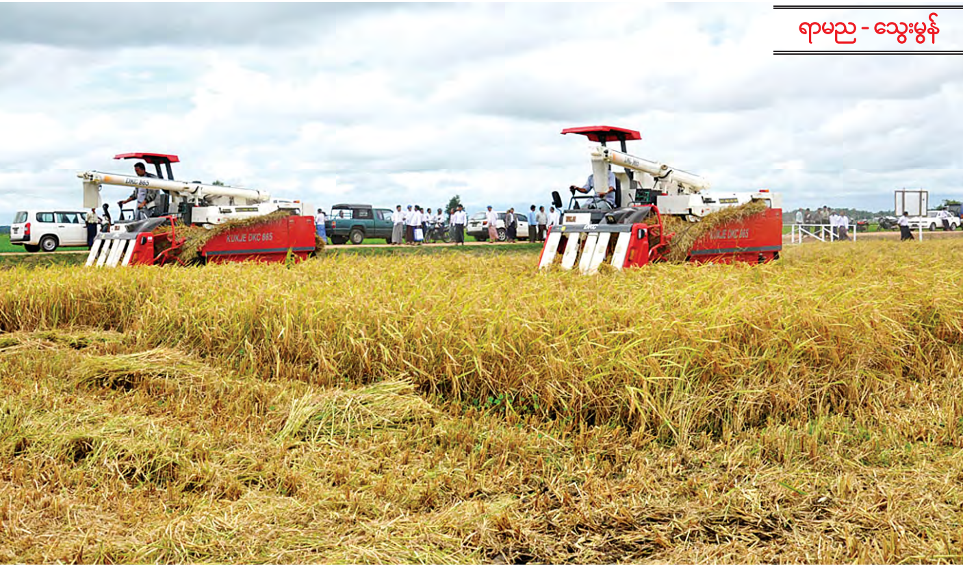
ရာမည - သွေးမွန်

နိုင်ငံတော်အစိုးရသည် ကျေးလက်ဒေသ စီးပွားရေး ဖွံ့ဖြိုးတိုးတက်မှုကို ဦးစားပေးလုပ်ငန်းအဖြစ် ကိုင်တွယ် လုပ်ဆောင်ခဲ့သည်ကို အများပြည်သူအသိပင် ဖြစ်သည်။ ကျေးလက်နေလူဦးရေ၏ ၂၉ ဒသမ ၂ ရာခိုင်နှုန်း ဆင်းရဲ နွမ်းပါးလျက်ရှိရာ ၂၀၁၅ ခုနှစ်တွင် ၁၆ ရာခိုင်နှုန်းအထိ လျော့ချနိုင်ရန် အမျိုးသားဖွံ့ဖြိုးမှုမိမိမိကိုး ချမှတ်ဆောင်ရွက် ခဲ့သည်။ မိမိတို့ ကျေးလက်နေ တောင်သူလယ်သမားများ နိုင်ငံနှင့်အဝန်း အဓိက စိုက်ပျိုးထုတ်လုပ်သော မိုးစပါး စိုက်ဧကပေါင်း ၁၇ သန်းနှင့် နွေစပါးစိုက်ဧကပေါင်း သုံးသန်း စုစုပေါင်းသန်း ၂၀ စိုက်ပျိုးလျက်ရှိသည်။ ဆန်ကိုသာ အဓိကထား၍ စားသုံးကြသော မိမိတို့ နိုင်ငံ အဖို့ ပြည်တွင်းစားနပ်ရိက္ခာဖူလုံရေးနှင့် အာဟာရဓာတ် ပြည့်ဝစေသော စပါးသီးနှံသည် မြန်မာနိုင်ငံ၏ အသက် သွေးကြောပမာဖြစ်သည်။ မိမိတို့နိုင်ငံ၏ လူမှုစီးပွားရေး နှင့် နိုင်ငံရေးတည်ငြိမ်မှုအတွက် ပဓာနကျသော စီးပွားရေး လုပ်ငန်းလည်းဖြစ်သည်။ မိမိတို့တောင်သူများသည် ကာလ ဒေသ ပယောဂတွင် နစ်မြေနေရာက နိုးထရန် လိုအပ်လာသော ၁၉၆၀ ဝန်း ကျင်က အခြေအနေကို သတိပြုကြရမည်ဖြစ်သည်။ ဒေသမျိုးများ၏ ကောင်းခြင်းများ၊ ဒေသခံတို့ ခံတွင်း ကြိုက်နှစ်သက်၍ စားကောင်းခြင်း စိုက်စရိတ်သက်သာခြင်း တို့က ယနေ့ကာလတွင် စိန်ခေါ်မှုတစ်ရပ်အဖြစ် ရင်ဆိုင် ရလျက်ရှိသည်။ တစ်နေ့က သတင်းစာပါ သတင်းတစ်ပုဒ် တွင် “အထွက်ကောင်းသော်လည်း ရောင်းချမှုခက်ခဲ၍ ပုလဲသွယ်စိုက်သူမရှိ” ဟူသော ခေါင်းစီးဖြင့် ဖတ်လိုက် ရသည်။ အကြောင်းပြချက်များမှာလည်း အာပူလာလျှာလွှဲ သော စကားမျှသာဟု မိမိတွေးမိပါသည်။ စပါးသက်တမ်း တိုသည်ကိုပင် စာမျက်နှာ ၇ ကော်လံ ၁ သို့ ၁၂