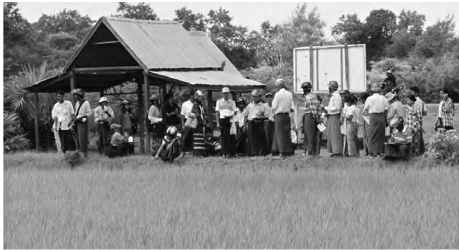
မှ တာဝန်ရှိသူများ တက်ရောက်ခဲ့ကြ စိုက်ပျိုးရေးဦးစီးဌာန၊ ဗဟိုမျိုးသန့် ပူးပေါင်း ကျင်းပခဲ့ခြင်းဖြစ်ကြောင်း သည်။ ယင်းဆွေးနွေးပွဲကို မြို့နယ် စိုက်ခြံနှင့် REVEAL စီမံကိန်းတို့ ဆောင်ရွက်(မလှိုင်)

အဆိုပါ တောင်သူပညာပေး ဆွေး နွေးပွဲသို့ မလှိုင်မြို့နယ်အတွင်းရှိ ရေနီ၊ ရေထွက်၊ သဲကန်၊ အိုင်မာရီ၊ ကြာအိုင်၊ ကူကြီးကုန်း၊ အေးသာယာ၊ လေးတိုင်စင် စသည့်ကျေးရွာ ၁၅ ရွာ မှ တောင်သူများ၊ မြို့နယ်ရုံး စိုက်ပျိုး ရေး ဝန်ထမ်းများ၊ REVEAL စီမံကိန်း