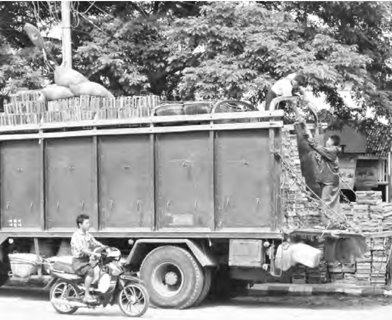
ရောက်သည့် အပင်များမှ ခူးဆွတ်ရောင်းချကြ များ ရာသီစာ ဩဇာသီးမှ အပိုဝင်ငွေရရှိလျက် ဖြစ်ဖြစ်သဖြင့် ပုပ္ဖားမြောက်စောင်းမှ တောင်သူ ရှိကြောင်း သိရသည်။ ကိုနေ(ကျောက်ပန်းတောင်း)

သည့် ထင်းရှူးသေတ္တာဖြင့် ပို့ဆောင်ပေးရသော်လည်း ယခုအခါ ကုန်ကားဖြင့် သယ်ယူပို့ဆောင်ခြင်းမရှိတော့သဖြင့် Express ကားကြီးများ၏ ဝမ်းဗိုက်တွင် ထည့်သွင်းသယ်ယူရ၍ သယ်ယူမှု လွယ်ကူစေသည့် တာသေးခေါ် သေတ္တာအသေးဖြင့် တင်ပို့ကြောင်း သိရသည်။ ဈေးနှုန်းအနေဖြင့် ပုံမှန်အသီးပါသည့် တာသေးတစ်လုံးလျှင် ငွေကျပ် ၂၅၀၀၊ ၃၀၀၀ ရောင်းချရပြီး ထူးရှယ်တာသေးတစ်လုံးလျှင် ငွေကျပ် ၄၀၀၀ မှ ၅၀၀၀ အထိရရှိကြောင်း သိရသည်။ အဆိုပါဩဇာသီးများကို ကျေးရွာများမှ ကျောက်ပန်းတောင်းမြို့ပေါ်ရှိ အဝေးပြေး ကားဂိတ်များသို့ နံနက်ပိုင်းတွင် လာရောက်ပို့ဆောင်ကြပြီး ကျောက်ပန်းတောင်းမှ ရန်ကုန်သို့ ညနေပိုင်းတွင် ထွက်ခွာသည့် မှန်လုံယာဉ်များဖြင့် တင်ပို့ကြောင်း သိရသည်။ ပုပ္ဖားဒေသတွင် နတ်ကန်လည် ကျေးရွာမှ ဩဇာသီး အများဆုံးထွက် ရှိကြောင်း သိရပြီး တစ်ရွာလုံး ဩဇာသီးရောင်းရငွေမှာ တစ်ရာသီလျှင် ဝင်ငွေ ကျပ်သိန်း ၁၀၀ ခန့်ရရှိကာ အဆိုပါ ဩဇာသီးများကို စီးပွားဖြစ်အနေဖြင့် သီးခြား စိုက်ပျိုးကြခြင်းမဟုတ်ဘဲ အိမ်ပိုင်းခြံစည်းရုံးနှင့် ယာစည်းရုံးများတွင် ပေါက်