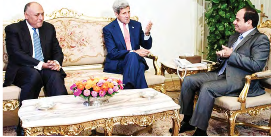
အမေရိကန်နိုင်ငံခြားရေးဝန်ကြီး(အလယ်)နှင့် အီဂျစ်သမ္မတ (ယာအစွန်)တို့ တွေ့ဆုံဆွေးနွေးနေကြစဉ်။

နိုင်ငံခြားရေးဝန်ကြီး ဂျွန်ကယ်ရီက စနေနေ့တွင် ပြောကြား လိုက်သည်။ အိုင်အက်စ်စစ်သွေးကြွများကို နှိမ်နင်းရေးအတွက် ညွှန်ပေါင်းအဖွဲ့တစ်ရပ်ကို ကျယ်ပြန့်စွာ စည်းရုံး စည်းရုံး လှုံ့ဆော်မှု တစ်စိတ်တစ်ပိုင်းအဖြစ် အာရပ်အဖွဲ့ချုပ်