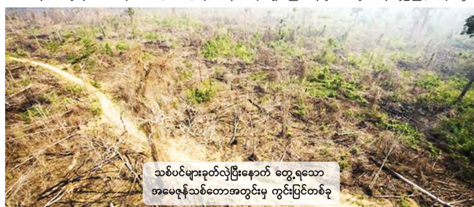
သစ်ပင်များခုတ်လှဲပြီးနောက် တွေ့ရသော အမေဇုန်သစ်တောအတွင်းမှ ကွင်းပြင်တစ်ခု

ဆွာပေါ်လို စက်တင်ဘာ ၁၄ ဘရာဇီးနိုင်ငံ အမေဇုန်ပတ်သက်သောတောများ ပြုန်းတီး မှုနှုန်းသည် ဒုတိယနှစ်အဖြစ် မြင့်တက်လာလျက်ရှိကြောင်း မကြာသေးမီက ဘီဘီစီသတင်းတွင် ဖော်ပြသည်။ ဘရာဇီးအစိုးရ၏ တရားဝင်ကိန်းဂဏန်းများအရ