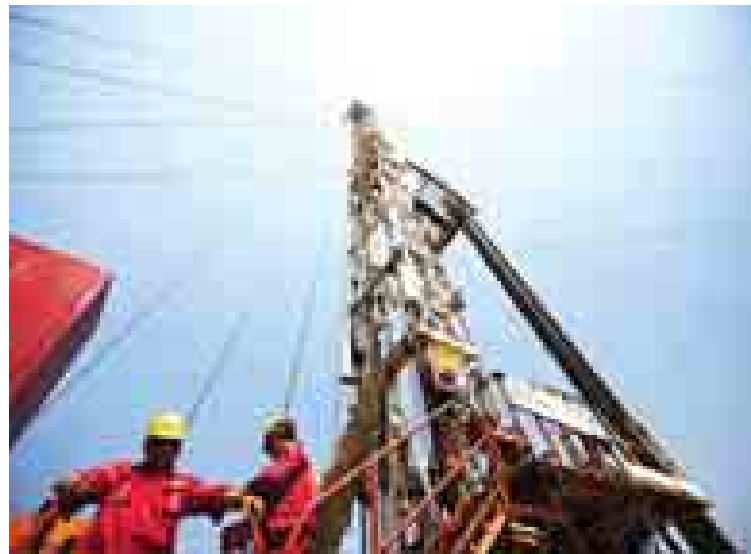
တောင်ဆူဒန်နိုင်ငံရှိ ရေနံမြေတစ်နေရာကို တွေ့ရစဉ်။