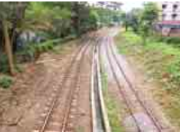
ရန်ကုန်မြို့ပတ်လမ်းပိုင်း၌ ရထားလမ်းတွေများ Alignment ပြုပြင်ဆောင်ရွက်ပြီးစီးနေသည်ကို တွေ့ရစဉ်။