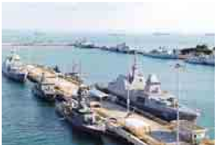
စင်ကာပူ ချန်ဂီရေတပ်စခန်းတစ်နေရာကို တွေ့ရစဉ်။

စစ်ရေယာဉ်များမှာ လွန်ခဲ့သည့် နှစ် ၂၀ ခန့်က တည်ဆောက်ခဲ့သည့် ရေယာဉ်များဖြစ်ကြသည်။ ကမ်းရိုးတန်း လုံခြုံရေး စစ်ရေယာဉ်များ၌ ခေတ်မီတိုက်ခိုက်ရေးစနစ်များကို တပ်ဆင်ထားနိုင်ပြီး ရဟတ်ယာဉ် ဆင်းသက်နိုင်သော ကွင်းလည်း ပါရှိသည်။ ယင်းစစ်ရေယာဉ်ကို ရေမြုပ်ခိုင်းပုံးရှင်းလင်းရေးလုပ်ငန်းတွင်လည်း အသုံးပြုနိုင်မည်ဖြစ်သည်။ စီအင်န်အေ။