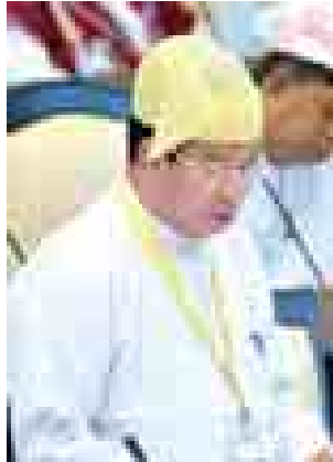
ပညာရေးဝန်ကြီးဌာန ဒုတိယဝန်ကြီး ဦးသန့်ရှင်း။

နေပြည်တော် စက်တင်ဘာ ၁၁ အမျိုးသားလွှတ်တော်(၁၁)ကြိမ်မြောက် ပုံမှန်အစည်းအဝေးပထမနေ့ကို ယနေ့နံနက် (၁၀) နာရီတွင် နေပြည်တော်ရှိ လွှတ်တော်အဆောက်အအုံ အမျိုးသားလွှတ်တော်အစည်းအဝေးခန်းမ၌ ကျင်းပရာ အမျိုးသားလွှတ်တော်ဥက္ကဋ္ဌ ဦးခင်အောင်မြင့်က မိမိတို့ကို ကိုယ်စားပြုသည့် ပြည်သူများ၏အသံကို လွှတ်တော်အတွင်းသို့ သယ်ဆောင်ပြီး ဆောင်ရွက်နိုင်ကြရန် တိုက်တွန်း အပ်ပါကြောင်းဖြင့် လွှတ်တော်သို့ ပြောကြားသည်။