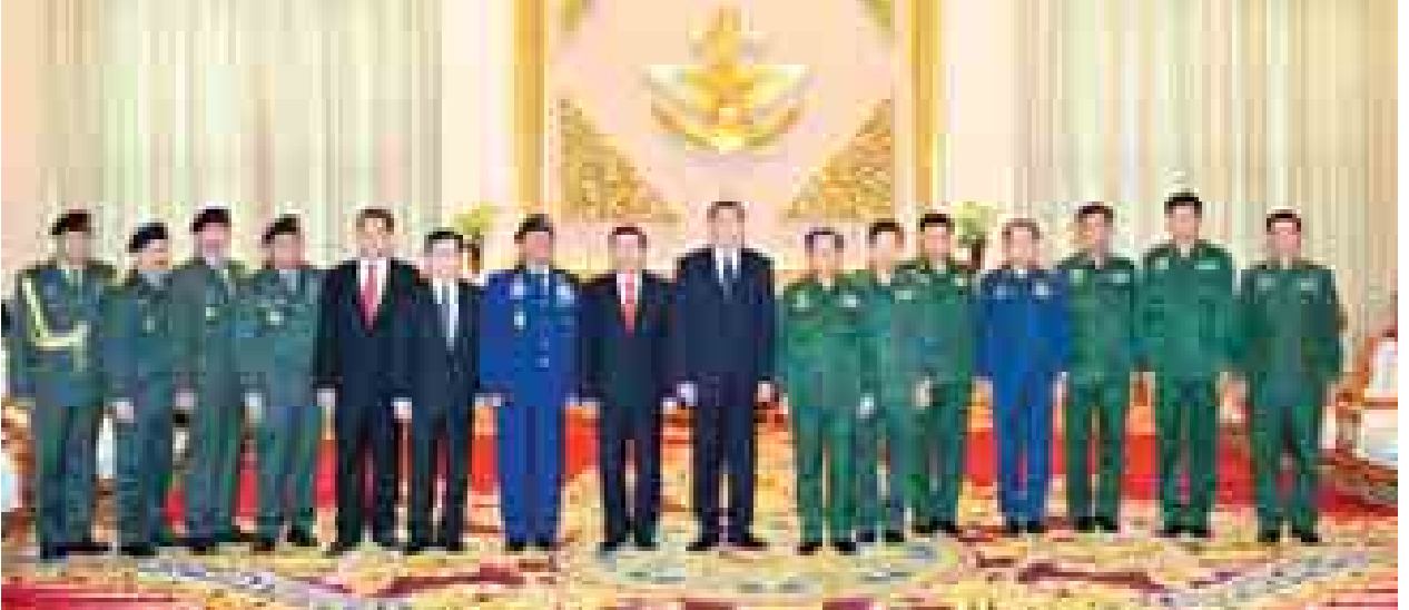
တပ်မတော်ကာကွယ်ရေးဦးစီးချုပ် ဗိုလ်ချုပ်မှူးကြီးမင်းအောင်လှိုင်နှင့် အင်ဒိုနီးရှားကာကွယ်ရေးဝန်ကြီးဌာန ဒုတိယဝန်ကြီးနှင့် အဖွဲ့ဝင်များ အမှတ်တရ စုပေါင်းဓာတ်ပုံရိုက်ကြစဉ်။