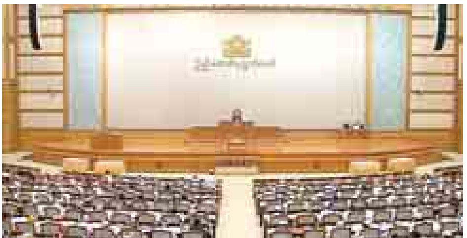
ပထမအကြိမ် ပြည်ထောင်စုလွှတ်တော် (၁၁)ကြိမ်မြောက် ပုံမှန်အစည်းအဝေး ပထမနေ့ ကျင်းပစဉ်။ (သတင်းစဉ်)

ယင်းအစီရင်ခံစာတွင် ပြည်ထောင်စုရွေးကောက်ပွဲ ကော်မရှင်အနေဖြင့် လွှတ်တော်တွင် မြေကြားခွဲသည့် ကတိကဝတ်များအတိုင်း ကြားဖြတ်ရွေးကောက်ပွဲကို ၂၀၁၄ ခုနှစ်အတွင်း ကျင်းပပေးရန်ပြင်ဆင်ထားခဲ့ပါကြောင်း၊ သို့ရာတွင် ယခုအခါ လွှတ်တော်အသီးသီးတွင် ရွေးကောက်