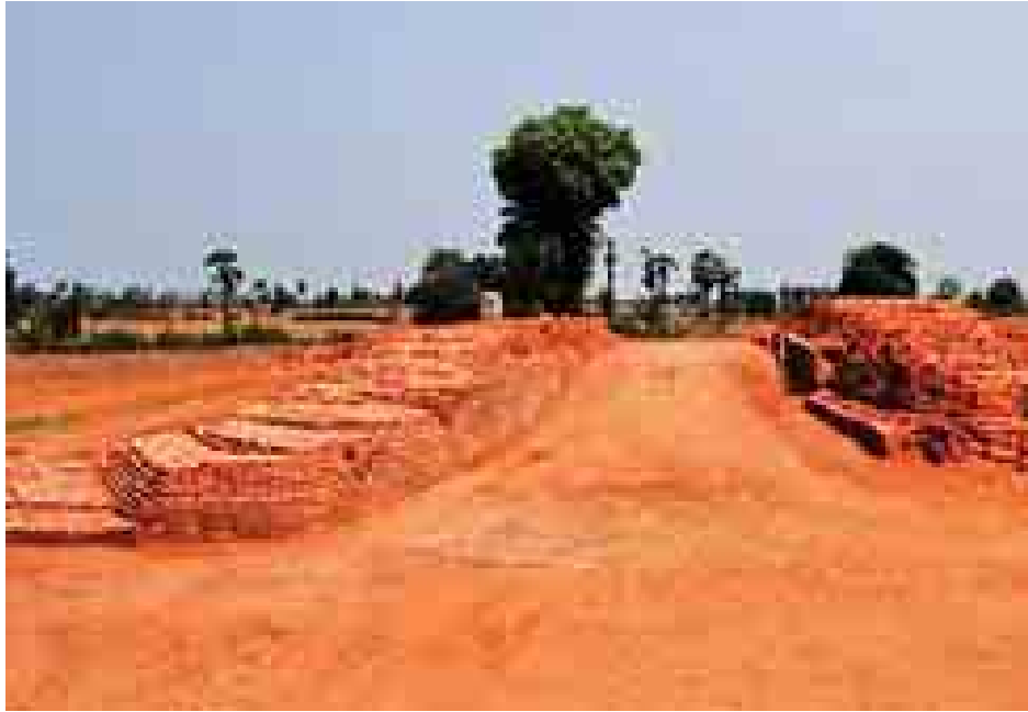
ဟန်လင်းမြို့ဟောင်း မြို့ဝင်ပေါက် နယူးဇီလန်နိုင်ငံသို့ ပေးပို့၍ သိပ္ပံနည်းကျ ဓာတ်ခွဲစမ်းသပ်ချက်အရ အေဒီ (၁)ရာစုမှ အေဒီ(၄)ရာစုအတွင်း သက်တမ်းခန့်မှန်းထားပါသည်။

ခွင့်ရသော်လည်း မိမိတို့အမွေအနှစ်တွင်သတ်မှတ်ထား သည့် စံတန်ဖိုးနှင့် လုံလောက်သည့် စီမံခန့်ခွဲရေး အစီ အစဉ်များရှိမှသာ ၎င်းတို့က ထောက်ခံပေးနိုင်မည်ဖြစ်သည်။ ထို့ကြောင့်လည်း မိမိတို့အဖွဲ့ဝင်တွေ တစ်ချက်မှ အလစ် မပေး၊ အခြေအနေပေးလျှင် ပေးသလို ကော်မတီဝင်နိုင်ငံ အသီးသီးနှင့်တွေ့ဆုံရှင်းပြကြသည်။ သူများနားချိန်လည်း အလွတ်မပေး၊ ကော်မီတီဝင်ချိန်လည်း အလွတ်မပေး၊ အဖွဲ့ခေါင်းဆောင်အချင်းချင်း ဆွေးနွေးကြ၊ ပညာရှင် အချင်းချင်း ရှင်းပြကြနှင့် ကြာတော့ မြန်မာကိုမြင်လျှင် ရှောင်ပြေးကြတော့မလားတောင် တွေးမိသည်။ ယခုတော့ ပြန်တွေ့၊ ပြန်ပြောလျှင် ပြီးစရာ၊ ရယ်စရာ၊ ထိုစဉ်ကတော့ အတော်ပင် စိတ်မောခဲ့ကြသည်။ ပါလာသော ဒေသခံအဖွဲ့ တွေကလည်း စိတ်ပူကြသည်။ ဘာသာရေးလုပ်သူကလည်း မေတ္တာပို့ဆုတောင်း၊ မှတ်တမ်းတင်သူကတင်၊ စာအုပ် စာတမ်း ဝေငှသူက ဝေငှနှင့် တက်ညီလက်ညီရှိကြသည်။ ဤအချက်ကို နိုင်ငံတော်တော်များများက သတိထားမိ ဟန်တူသည်။ တက်ရောက်လာသော အဖွဲ့ဝင်နိုင်ငံများက လည်း မိမိတို့အပေါ် စာနာနေကြသည်။ အားပေးကြသည်။