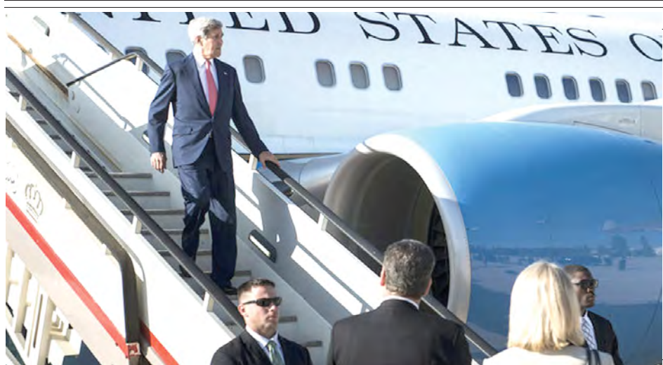
အိုင်အက်စ်စစ်သွေးကြွအဖွဲ့ကို နိမိတ်ခံ နိုင်ငံရေး ဆွေးနွေးရန် စက်တင်ဘာ ၁၀ရက် က အီရတ်နိုင်ငံသို့ ရောက်ရှိလာမီ ဂျော်ဒန်၌ ခရီး တစ်ထောက် ရပ်နား သူ အမေရိကန် နိုင်ငံခြားရေးဝန်ကြီး ဝွန်ကယ်ရီကို တွေ့ရစဉ်။