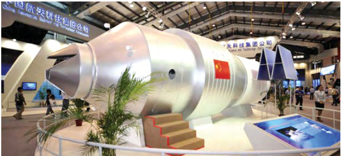
တရုတ်အာကာသနည်းပညာတက္ကသိုလ်ပြင်ပ၌ တီယန်ကောင်-၁ အာကာသ ဗိုဂျူးယာဉ်တစ်ခုကို ပြသထားသည့် မှတ်တမ်းပုံ။

စမ်းသပ်ဆဲအဆင့်ရှိ ယင်းစခန်းယာဉ်ကို တီယန်ကောင်ဟု အမည်ပေးထားသည်။ တီယန်ကောင်-၂ အာကာသစခန်းယာဉ်ကို ၂၀၁၆ခုနှစ် ဝန်းကျင်တွင် လွှတ်တင်နိုင်ဖွယ်ရှိကြောင်း တရုတ်အာကာသအေဂျင်စီ ဒုတိယအကြီးအကဲ ယန်လီဝေက ပြောကြားသည်။ ဆင်ဟွာ။