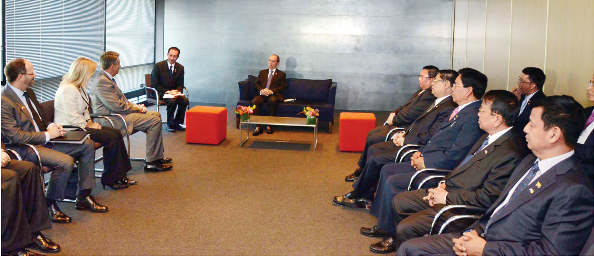
နိုင်ငံတော်သမ္မတ ဦးသိန်းစိန်အား Shell ကုမ္ပဏီအမှုဆောင်အရာရှိချုပ် Mr. Ben van Beurden နှင့်အဖွဲ့က ဓေတ္တတည်းခိုသည့် Bel Air Hotel ၌ လာရောက်တွေ့ဆုံစဉ်။ (သတင်းစဉ်)

အနေ၊ နည်းပညာဆိုင်ရာ အကျိုးအမြတ်ရရှိမှု၊ ကမ္ဘာ့စွမ်းအင်အနေအထားနှင့် မြန်မာနိုင်ငံအတွက် အလားအလာများကို ရှင်းလင်းတင်ပြခဲ့သည်။ ညပိုင်းတွင် နိုင်ငံတော်သမ္မတနှင့်အဖွဲ့အား နယ်သာလန်နိုင်ငံဆိုင်ရာ မြန်မာသံအမတ်ကြီး ဦးပေါ်လွင်စိန်က Bel Air Hotel ၌ ညစာစားပွဲဖြင့် တည်ခင်းဧည့်ခံခဲ့သည်။ (သတင်းစဉ်)