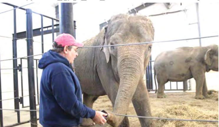
ဆင်ဘေးမဲ့ဥယျာဉ်ထူထောင်သူ ဒေါက်တာလော်ရီတာအား တွေ့ရစဉ်။

စက်တင်ဘာ ၉ ရက် နံနက်က ယင်းဖြစ်ရပ်ဖြစ်ပွားခဲ့ကြောင်း၊ ဒေါက်တာ လော်ရီတာ၏ ရင်ဘတ်တွင် ဒဏ်ရာရရှိခဲ့ပြီး အသက်ရှူ မွမ်းကျပ်ကာ သေဆုံးခဲ့ကြောင်း ဆေးဘက်ဆိုင်ရာ စစ်ဆေးရေးရုံးက အတည်ပြုပြောကြားသည်။ ရိုက်တာ။