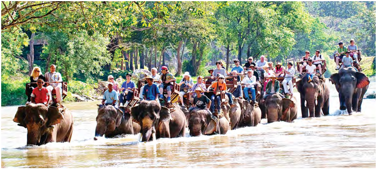
တွင် ယခုထက်တိုင် ခေတ်စားလျက်ရှိသည်။ ကြေးဖြင့် ပြုလုပ်သော ဟင်္သာရုပ်၊ ခြင်္သေ့ရုပ်၊ ဆင်ရုပ်စသည့် အလေးတို့ကိုလည်း ပြုလုပ်ရောင်းချကြလေသည်။

ဇင်းမယ်ရှိ ဘုရားစေတီတို့၏ ပုံသဏ္ဍာန်မှာ မြန်မာဘုရားစေတီတို့၏ ပုံသဏ္ဍာန်နှင့်တူကြသည်။ ယွန်းထည်လုပ်ငန်းသည် အထူးကြီးကျယ်သော လုပ်ငန်းတစ်ခုဖြစ်၏။ မြန်မာတို့ကဲ့သို့ပင် ကွမ်းအစ်၊ သပိတ်၊ သေတ္တာ၊ ဗြဲက စသည်တို့ကို ပြုလုပ်သည်။ ထိုလုပ်ငန်းများအပြင် ပိုးထည်အများအပြားကိုလည်း ဇင်းမယ်တွင် ရက်လုပ်ကြသည်။ ဇင်းမယ်လုံချည်မှာ မြန်မာအမျိုးသမီးလောက