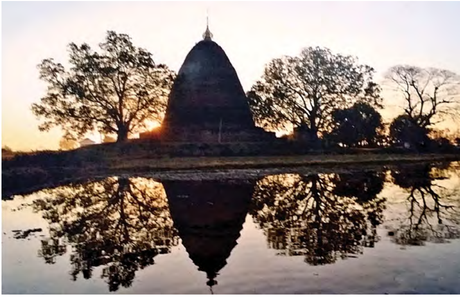
သရေခေတ္တရာမြို့ဟောင်းတွင် ထုထည်ကြီးမားစွာ တည်ထားခဲ့သော ဘုရားမာဘုရား။

အဆိုပြုစာတွဲရေးသားပြုစုရာတွင် ပျူမြို့ဟောင်းသုံးခုလုံးရှိ အမွေအနှစ်ပစ္စည်းများ၊ အဆောက်အအုံတစ်ခုချင်း အသေးစိတ် ဓာတ်ပုံ၊ ပုံဆွဲ၊ မြေပုံမှတ်တမ်းမှတ်ရာ