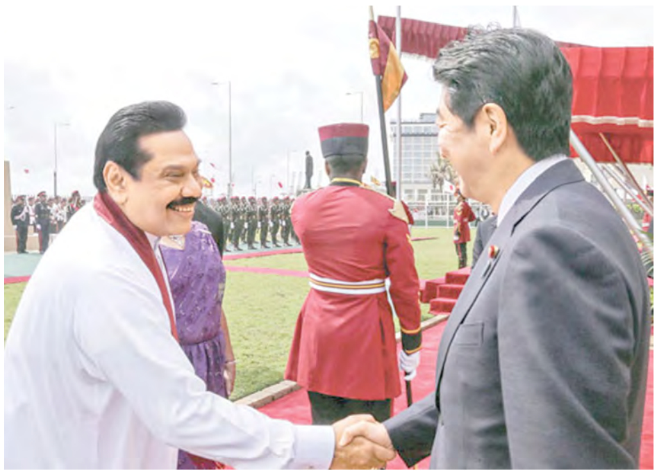
ကြိုဆိုပွဲအခမ်းအနားတွင် ဂျပန်ဝန်ကြီးချုပ်အာဘေးအား သီရိလင်္ကာသမ္မတ ရာဂျာပတ်ဆေးနှင့်အတူ တွေ့မြင်ရစဉ်။