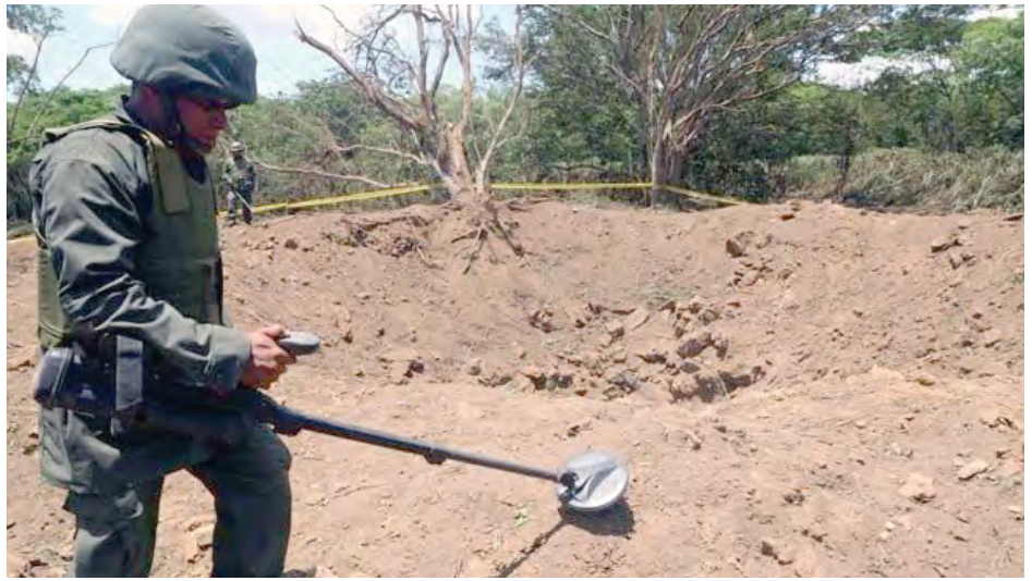
ဥက္ကာပျံကြွေကျခြင်းခံခဲ့ရသည့်နေရာကို နီကာရာဂွာစစ်သည်တစ်ဦးက စစ်ဆေးနေစဉ်။