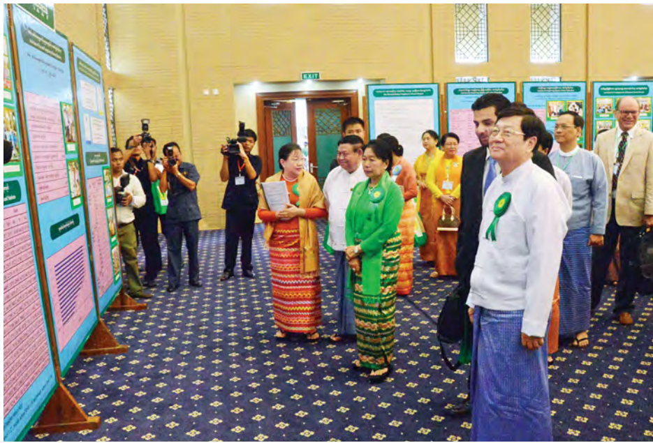
ပညာရေးလုပ်ငန်းစဉ်တွင် အခြေခံစာတတ်မြောက်ရေးနှင့် စဉ်ဆက်မပြတ်ပညာရေးတို့ကို ကဏ္ဍအလိုက်စီမံချက်ချမှတ်ဆောင်ရွက်ခဲ့ပါကြောင်း။

မြန်မာနိုင်ငံစာတတ်မြောက်ရေးကြိုးပမ်းမှုကို ၁၉၄၈ ခုနှစ်မှစ၍ ယနေ့အထိ လှုပ်ရှားဆောင်ရွက်ခဲ့ပါကြောင်း၊ စာတတ်မြောက်ရေးကို တစ်နိုင်ငံလုံး အမျိုးသားရေး လှုပ်ရှားမှုအသွင်ဖြင့် ကြိုးပမ်းဆောင်ရွက်ခဲ့သည့်အတွက် ယူနက်စကိုအဖွဲ့ချုပ်က ချီးမြှင့်သော မိုဟာမက် ရီဇာပါလာ ဗီဆုနှင့် နိုမာဆုကို ရရှိခဲ့ပါကြောင်း၊ ကျောင်းပြင်ပ