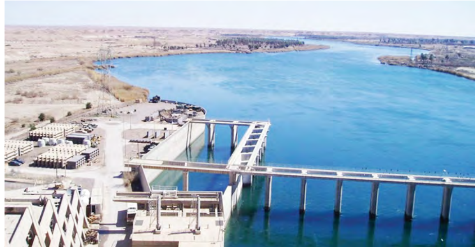
စစ်သွေးကြွတို့လက်အောက် မကျရောက် ရေးအတွက် အီရတ်တပ်ဖွဲ့များက ကာကွယ် စောင့်ရှောက်ထားသော ဟာဒီသာဆည်ကို တွေ့ရစဉ်။