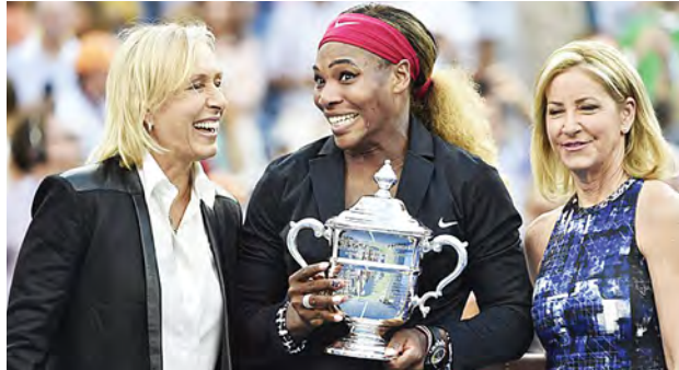
အမေရိကန်အိုးပင်းတင်းနစ်မယ် ဆရိုနာဝီလျံသည် ယခုဆွတ်ခူးရရှိခဲ့သည့် အမေရိကန်အိုးပင်းတင်းနစ်ချန်ပီယံဆုအပါအဝင် အမေရိကန်အိုးပင်းတင်းနစ်ဖလား အမျိုးသမီးတစ်ဦးချင်း ချန်ပီယံ

တင်းနစ် ဖလားငါးကြိမ်၊ ပြင်သစ်အိုးပင်းတင်းနစ်ပြိုင်ပွဲတွင် ၂၀၀၂၊ ၂၀၁၃ စသည်ဖြင့် ပြင်သစ်အိုးပင်းတင်းနစ်ဖလားနှစ်ကြိမ်၊ ဝင်ဘယ်ဒန်တင်းနစ်ပြိုင်ပွဲတွင် ၂၀၀၂၊ ၂၀၀၃၊ ၂၀၀၉၊ ၂၀၁၀၊ ၂၀၁၂ စသည်ဖြင့် ဝင်ဘယ်ဒန်တင်းနစ်ဖလားငါးကြိမ်၊ အမေရိကန်အိုးပင်းတင်းနစ်ပြိုင်ပွဲတွင် ၁၉၉၉၊ ၂၀၀၂၊ ၂၀၀၈၊ ၂၀၁၂၊ ၂၀၁၃၊ ၂၀၁၄ စသည်ဖြင့် ခြောက်ကြိမ်စုစုပေါင်း၁၈ကြိမ်အထိ ဆွတ်ခူးထားနိုင်ခဲ့ခြင်းဖြစ်သည်။