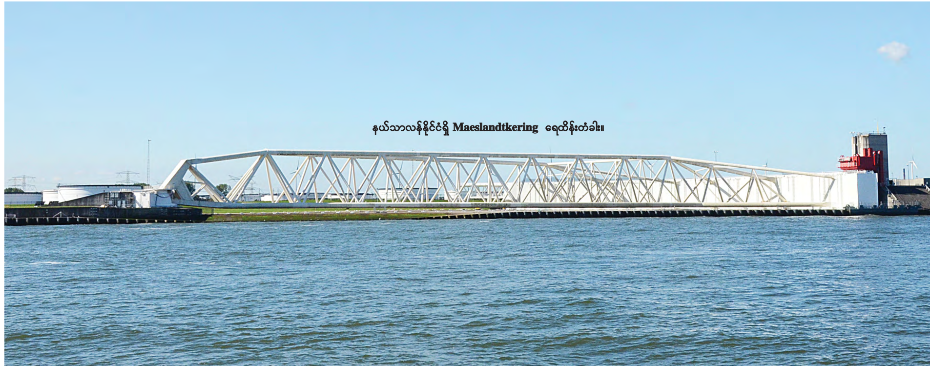
နယ်သာလန်နိုင်ငံရှိ Maeslandtkering ရေထိန်းတံခါး။