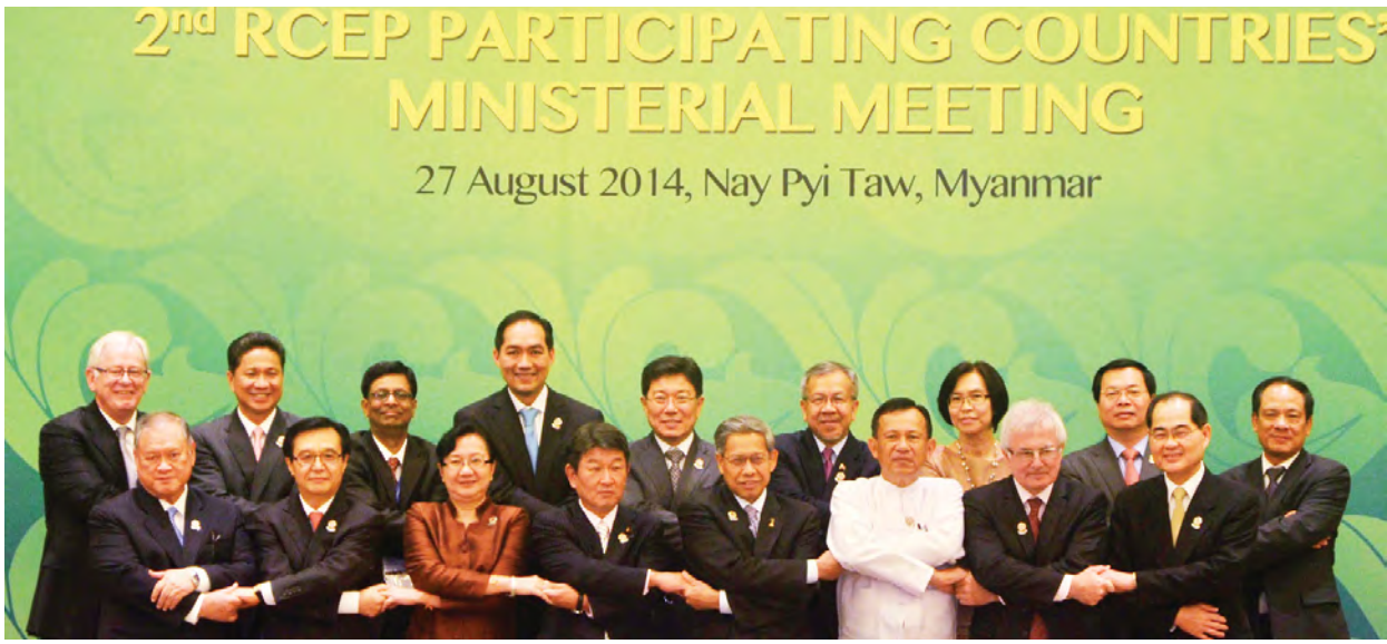
စီးပွားရေးဝန်ကြီးဖြစ်သူ အမျိုးသားစီမံကိန်းနှင့် စီးပွားရေးဖွံ့ဖြိုးတိုးတက်မှုဝန်ကြီး ဌာန ပြည်ထောင်စုဝန်ကြီး ဒေါက်တာကဇော်က အစည်းအဝေးဥက္ကဋ္ဌအဖြစ် ဆောင်ရွက်ခဲ့ပါသည်။

အစည်းအဝေးပထမနေ့တွင် အာဆီယံနိုင်ငံများ၏ မူဝါဒအရ ဦးစွာ အာဆီယံနိုင်ငံများ၏ ရပ်တည်ချက်အတွက် အာဆီယံဗဟိုပြုမှု (ASEAN Centrality)၊ အာဆီယံ၏ ခိုင်မာသည့် စည်းလုံးညီညွတ်မှု (ASEAN Solidarity) ရရှိရေးအဖွဲ့ဝင်နိုင်ငံများအချင်းချင်း ဆွေးနွေးပါသည်။ အစည်း အဝေးဒုတိယနေ့တွင် အရှေ့အာရှနိုင်ငံများဖြစ်သည့် တရုတ်၊ ဂျပန်၊ ကိုရီးယား၊ အိန္ဒိယ၊ ဩစတြေးလျ၊ နယူးဇီလန်စသည့် ဆွေးနွေးဖက်နိုင်ငံများနှင့် ဆက်လက် ဆွေးနွေးပါသည်။ ထို့နောက်မှ အစည်းအဝေးတတိယနေ့တွင် ဥရောပ၊ အမေရိကန်နှင့် ကနေဒါနိုင်ငံများပါဝင်သည့် ဆွေးနွေးဖက်နိုင်ငံများ၊ ဒေသခွဲပူးပေါင်းဆောင်ရွက်မှု အဖွဲ့များနှင့် ဆွေးနွေးပါသည်။ အစည်းအဝေးစတုတ္ထနေ့တွင် စီးပွားရေးအကြံပေး ကောင်စီများ၊ ကုန်သွယ်ရေးအဖွဲ့များနှင့် ပုဂ္ဂလိကကဏ္ဍကိုယ်စားလှယ်များနှင့် ဆွေးနွေးရန် စီစဉ်ခဲ့ပါသည်။ ၂၅-၉-၂၀၁၄ ရက်နေ့မှ ၂၈-၉-၂၀၁၄ ရက်နေ့အတွင်း (၄၆)ကြိမ်မြောက် အာဆီယံစီးပွားရေးဝန်ကြီးများ အစည်းအဝေးနှင့် ဆက်စပ်အစည်းအဝေးများ အဖြစ် အောက်ဖော်ပြပါအစည်းအဝေးပေါင်း(၂၀)ကို မြန်မာနိုင်ငံ၏ အာဆီယံ