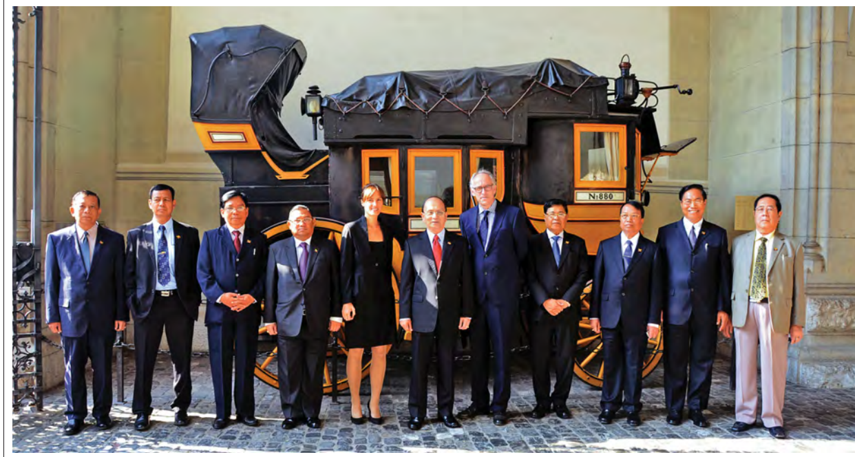
နိုင်ငံတော်သမ္မတ ဦးသိန်းစိန်နှင့်အဖွဲ့၊ ဇူရစ်မြို့ရှိ ယဉ်ကျေးမှုသမိုင်းပြတိုက်တွင် အမှတ်တရဓာတ်ပုံရိုက်ကြစဉ်။