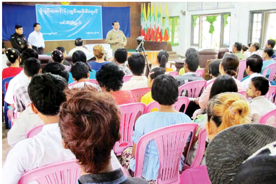
ကြောင်း ပြောကြားကြသည်။ ထို့နောက် ဆောင်ရွက်ပြီးဖြစ်သော နိုင်ငံသားစိစစ်ရေးကတ်ပြားများကို ရန်ကုန်တိုင်းဒေသကြီးလွှတ်တော်