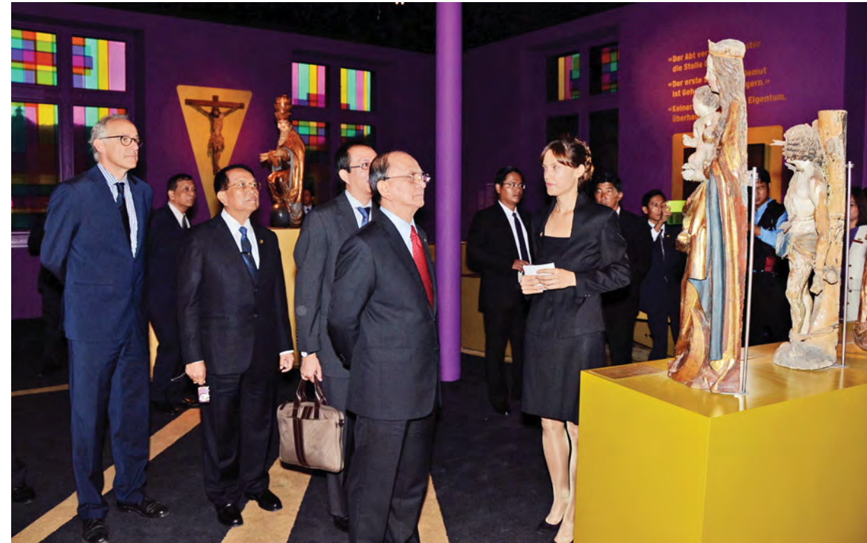
နိုင်ငံတော်သမ္မတ ဦးသိန်းစိန်နှင့်အဖွဲ့၊ ဇူရစ်မြို့ရှိ ယဉ်ကျေးမှုသမိုင်းပြတိုက်အတွင်း ကြည့်ရှုလေ့လာကြစဉ်။

ပေးအပ်သည်။ ယင်းနောက် နိုင်ငံတော်သမ္မတနှင့် အဖွဲ့အား ဆွစ်ဇာလန်နိုင်ငံဆိုင်ရာ မြန်မာသံအမတ်ကြီး ဦးမောင်ဝေက ညာစားဖွဲ့ဖြင့် တည်ခင်းစဉ်ခံသည်။ နိုင်ငံတော်သမ္မတနှင့်အဖွဲ့သည် ဒေသစံတော်ချိန် နံနက် ၉ နာရီခွဲက ဘန်းမြို့ရှိ Payerre Air Base ပိုင်ဆိုင်မှုလေတပ်စခန်း၌ နေရောင် ခြည်စွမ်းအင်သုံး လေယာဉ်အား ကြည့်ရှုလေ့လာရာတွင် နေရောင် ခြည်စွမ်းအင်သုံး လေယာဉ် Solar Impulse ကို ၂၀၁၁ ခုနှစ် ဇူလိုင်လတွင် စတင်ပျံသန်းခဲ့ပြီး ပထမဆုံးအကြိမ် လောင်စာဆီမသုံးဘဲ ၂၆ နာရီ ဆက်တိုက်ပျံသန်းနိုင်သည့် လေယာဉ် အဖြစ် မှတ်တမ်းတင်ခဲ့ကြောင်း၊ ၂၀၁၃ ခုနှစ်တွင် အမေရိကန် ပြည်ထောင်စုကို ဖြတ်ကျော်ပျံသန်း ခဲ့ပြီး ယခု လေယာဉ်သည် ဒုတိယ မျိုးဆက်လေယာဉ် ဖြစ်ကြောင်း၊ ၂၀၁၅ ခုနှစ် မတ်လတွင် ကမ္ဘာ တစ်ပတ်ပျံသန်းမှုပြုလုပ်ရန် စီစဉ် ထားကြောင်း သိရှိရသည်။