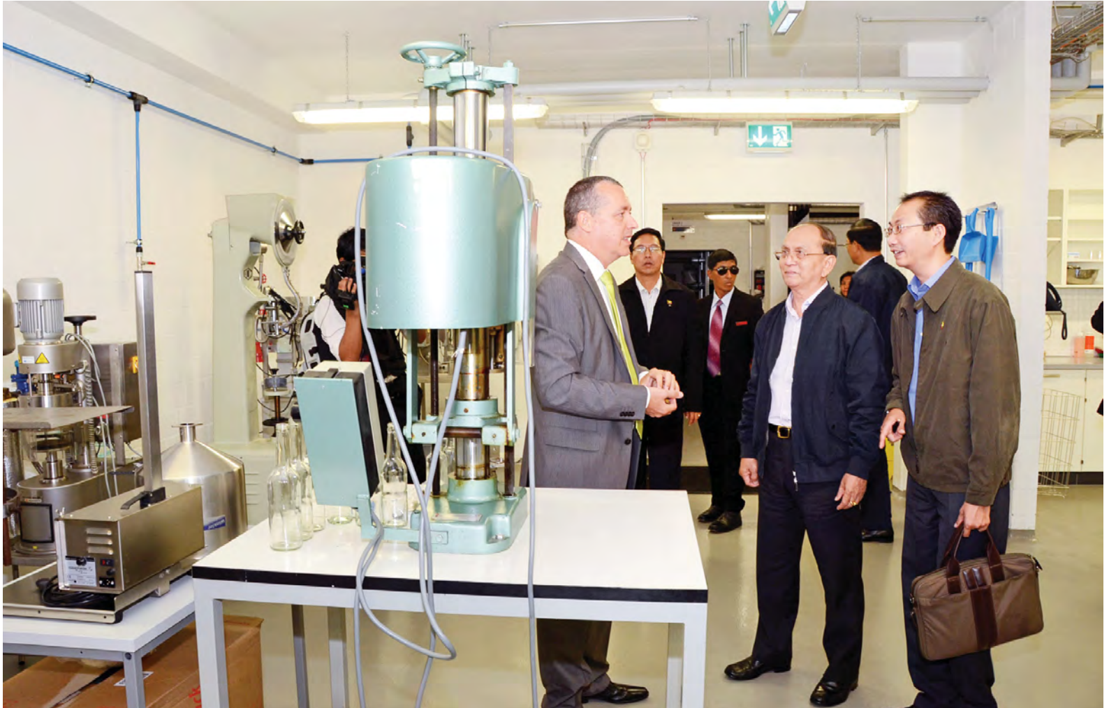
နိုင်ငံတော်သမ္မတ ဦးသိန်းစိန် ဘန်းမြို့နယ်အတွင်းရှိ အသုံးချသိပ္ပံပညာတက္ကသိုလ်သို့ သွားရောက်ကြည့်ရှုလေ့လာစဉ်။