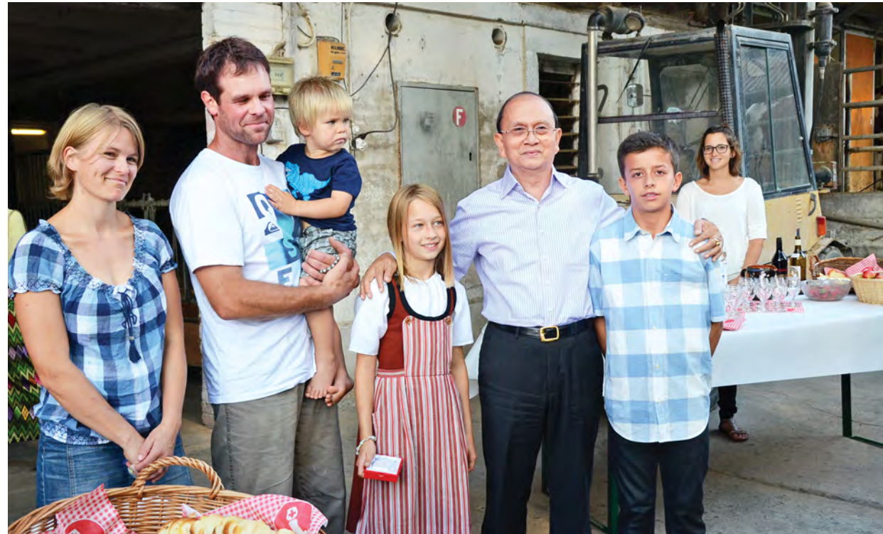
နိုင်ငံတော်သမ္မတ ဦးသိန်းစိန် စိုက်ပျိုးမွေးမြူရေးခြံ မိသားစုဝင်များနှင့် စုပေါင်း၍ မှတ်တမ်းတင်ဓာတ်ပုံရိုက်ကြစဉ်။