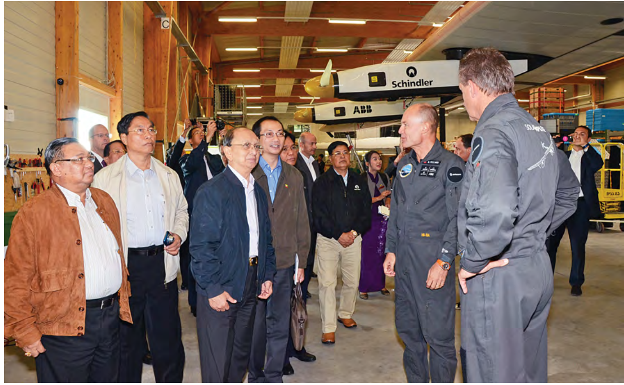
နိုင်ငံတော်သမ္မတ ဦးသိန်းစိန်နှင့်အဖွဲ့၊ စက်တင်ဘာ ၆ ရက် ဒေသစံတော်ချိန် နံနက် ၉ နာရီခွဲက ဘန်းမြို့ရှိ Payerre Air Base ပိုင်ဆိုင်မှု လေတပ်စခန်း၌ နေရောင်ခြည်စွမ်းအင်သုံးလေယာဉ်အား ကြည့်ရှုလေ့လာရာ တာဝန်ရှိသူများက ရှင်းလင်းတင်ပြစဉ်။

ထို့နောက် နိုင်ငံတော်သမ္မတနှင့် အဖွဲ့အား ဒေသထွက်ကုန်အစား