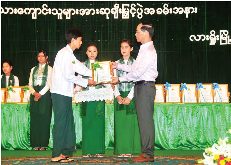
ဒုတိယသမ္မတ ဒေါက်တာစိုင်းမောက်ခမ်း ၂၀၁၃-၂၀၁၄ ခုနှစ် တက္ကသိုလ်ဝင်စာမေးပွဲတွင် ငါးဘာသာ ဂုဏ်ထူးဖြင့် အောင်မြင်ခဲ့သည့် ကျောင်းသားတစ်ဦးအား ဂုဏ်ပြုချီးမြှင့်ပေးအပ်ခြင်း

မိုးရာသီတွင် မိုးများသည့်အခါ ရေကြီးရေလျှံမှုဖြစ်နေသကဲ့သို့ နေရာသီတွင်လည်း ရေရှားနေသည့် ကျေးရွာ