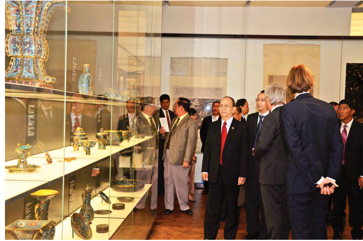
နိုင်ငံတော်သမ္မတ ဦးသိန်းစိန်နှင့်အဖွဲ့၊ ပုဂံနှင့် ယူယဉ်ကျေးမှုပြတိုက်တွင်ပမည် Rietberg Museum အတွင်း ခင်းကျင်းပြသထားမှုများကို ကြည့်ရှုလေ့လာကြစဉ်။