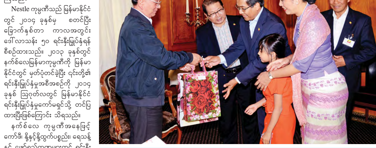
နိုင်ငံတော်သမ္မတ ဦးသိန်းစိန် ဂျီနီဇာမြို့ရှိ မြန်မာသံရုံးမိသားစုဝင်များအား လက်ဆောင်ပစ္စည်းများ ပေးအပ်စဉ်။

ရပ်နားမည်ဟု သိရှိရသည်။ ထို့နောက် နိုင်ငံတော်သမ္မတနှင့် အဖွဲ့သည် Konolfingen ရှိ Nestle စက်ရုံကို သွားရောက်ကြည့်ရှုလေ့လာ ကြသည်။ Nestle ကုမ္ပဏီသည် မြန်မာနိုင်ငံ တွင် ၂၀၁၄ ခုနှစ်မှ စတင်ပြီး ခြောက်နှစ်တာ ကာလအတွင်း ဒေါ်လာသန်း ၅၀ ရင်းနှီးမြှုပ်နှံရန် စီစဉ်ထားသည်။ ၂၀၁၃ ခုနှစ်တွင် နက်စ်လေမြန်မာကုမ္ပဏီကို မြန်မာ နိုင်ငံတွင် မှတ်ပုံတင်ခဲ့ပြီး ၎င်းတို့၏ ရင်းနှီးမြှုပ်နှံမှုအစီအစဉ်ကို ၂၀၁၄ ခုနှစ် ဩဂုတ်လတွင် မြန်မာနိုင်ငံ ရင်းနှီးမြှုပ်နှံမှုဧကရောင်းသို့ တင်ပြ ထားပြီးဖြစ်ကြောင်း သိရသည်။