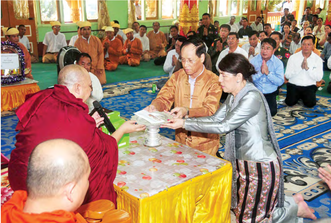
ဒုတိယသမ္မတ ဒေါက်တာစိုင်းမောင်ခမ်းနှင့် ဇနီး ဒေါ်နန်းရွှေမုန် သီရိမင်္ဂလာမင်္ဂလာအခမ်းအနားတွင် မြို့နယ်သံဃာနာယက ဥက္ကဋ္ဌ အဂ္ဂမဟာ သဒ္ဓမ္မဇောတိကဓဇ ဘဒ္ဒန္တပုညနန္ဒအား အလှူငွေ ပေးအပ်လှူဒါန်းစဉ်။