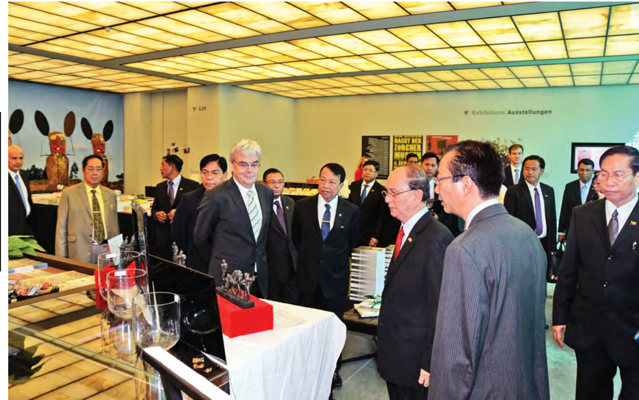
နိုင်ငံတော်သမ္မတ ဦးသိန်းစိန်နှင့်အဖွဲ့၊ ပုဂံနှင့် ယူယဉ်ကျေးမှုပြတိုက်တွင်ပမည် Rietberg Museum အတွင်း ခင်းကျင်းပြသထားမှုများကို ကြည့်ရှုလေ့လာကြစဉ်။