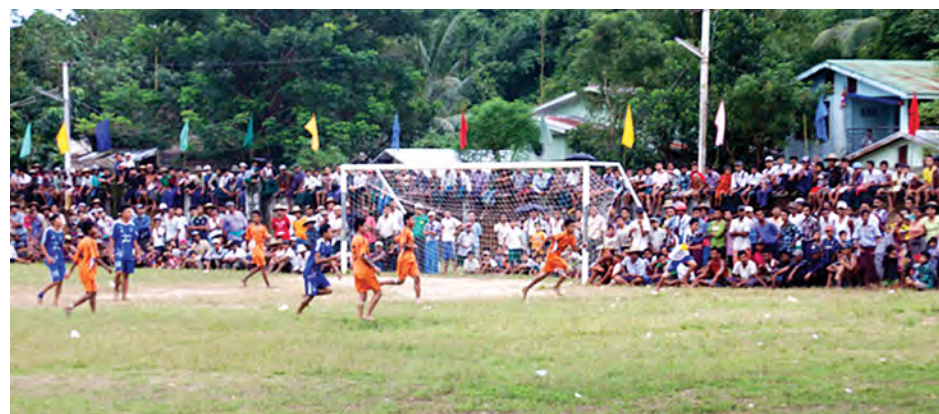
ရှေ့ကြယ်

ဂျပန်တင်းနစ်ကစားသမား နီရှိကိုရိုသည် ဂျိုကိုပစ်အား ၆-၄၊ ၁-၆၊ ၇-၆(၆-၃)ဖြင့် အနိုင်ရရှိခဲ့ခြင်းဖြစ်ပြီး အမေရိကန်တင်းနစ်ပိုလ်လွဲအိုးပင်း သားတစ်ဦးချင်းနောက်ဆုံးပိုလ်လွဲပွဲအဖြစ် စက်တင်ဘာ ၈ ရက်တွင် တင်းနစ်အကျော်အမော်တစ်ဦးဖြစ်သည့် မာရင်စီလစ်နှင့် ယှဉ်ပြိုင်ကစားရမည်ဖြစ်ကြောင်း သိရသည်။ မာရင်စီလစ်သည် တင်းနစ်အကျော်အမော်ရော်ဂျာဖက်ဒရားအား အနိုင်ရရှိကာ အမေရိကန်အိုးပင်းနောက်ဆုံးပိုလ်လွဲပွဲသို့ တက်လှမ်းလာခဲ့ခြင်းဖြစ်သည်။