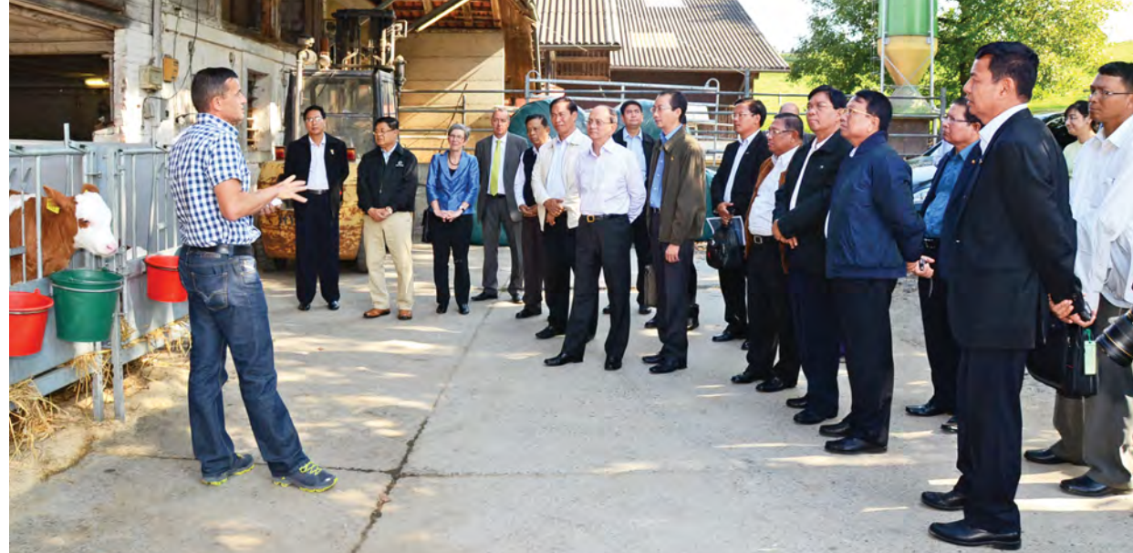
နိုင်ငံတော်သမ္မတ ဦးသိန်းစိန်နှင့်အဖွဲ့၊ ဘန်းမြို့နယ်အတွင်းရှိ အသုံးချသိပ္ပံပညာတက္ကသိုလ် စိုက်ပျိုးမွေးမြူရေးခြံအတွင်း နို့စားနွားများ မွေးမြူထား ရှိမှုကို ကြည့်ရှုလေ့လာရာ တာဝန်ရှိသူတစ်ဦးက ရှင်းလင်းတင်ပြစဉ်။

အစာများဖြင့် တည်ခင်းစဉ်ခံ သည် ခေတ္တတည်းခိုသည့် ဘန်းမြို့ရှိ မိသားစုဝင်များ၊ ပညာတော်သင်များ သည်။ Hotel Bellevue Palace ၌ ဂျီနီဇာ အား တွေ့ဆုံ၍ ဩဝါဒစကားပြော ညိုင်းတွင် နိုင်ငံတော်သမ္မတ မြို့ရှိ မြန်မာသံအမတ်ကြီးနှင့် သုံးနား ကြားပြီး လက်ဆောင်ပစ္စည်းများ