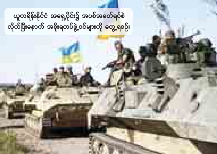
ယူကရိန်းနိုင်ငံ အရှေ့ပိုင်း၌ အပစ်အခတ်ရပ်စဲ လိုက်ပြီးနောက် အစိုးရတပ်ဖွဲ့ဝင်များကို တွေ့ရစဉ်။

အပစ်အခတ်ရပ်စဲရေး သဘောတူညီချက် သည် ငြိမ်းချမ်းရေးဆွေးနွေးပွဲ ကျင်းပရေး အတွက် ပဏာမခြေလှမ်းတစ်ခု ဖြစ်ကြောင်း၊ အပစ်အခတ် ရပ်စဲရေး သဘောတူညီချက်ကို ကမ္ဘာ့နိုင်ငံများက သတိရှိရှိဖြင့် ကြိုဆိုကြ ကြောင်း ယူကရိန်းအရေး ခွဲခြမ်းစိတ်ဖြာ လေ့လာသူများက ပြောကြားကြသည်။ ယူကရိန်းအရှေ့ပိုင်း၌ အပစ်အခတ်ရပ်စဲ ရန် သဘောတူညီချက်ပေါ်လာခြင်းသည် စက်တင်ဘာ ၄ ရက်က ဘယ်လာရစ်နိုင်ငံ မြို့တော် မင့်စီမြို့၌ ကျင်းပခဲ့သော ယူကရိန်း သံတမန်များ၊ ခွဲထွက်ရေးလှုပ်ရှားမှု ခေါင်း ဆောင်များ၊ ရုရှားကိုယ်စားလှယ်များ၊ ဥရောပ