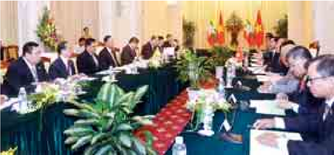
ပြည်ထောင်စုလွှတ်တော်နာယက ပြည်သူ့လွှတ်တော်ဥက္ကဋ္ဌ သူရဦးရွှေမန်းနှင့် ဗီယက်နမ်ဆိုရှယ်လစ်သမ္မတနိုင်ငံ အမျိုးသားလွှတ်တော်ဥက္ကဋ္ဌ H.E.Mr. Nguyen Sinh Hung တို့ တွေ့ဆုံဆွေးနွေးစဉ်။ (သတင်းစဉ်)