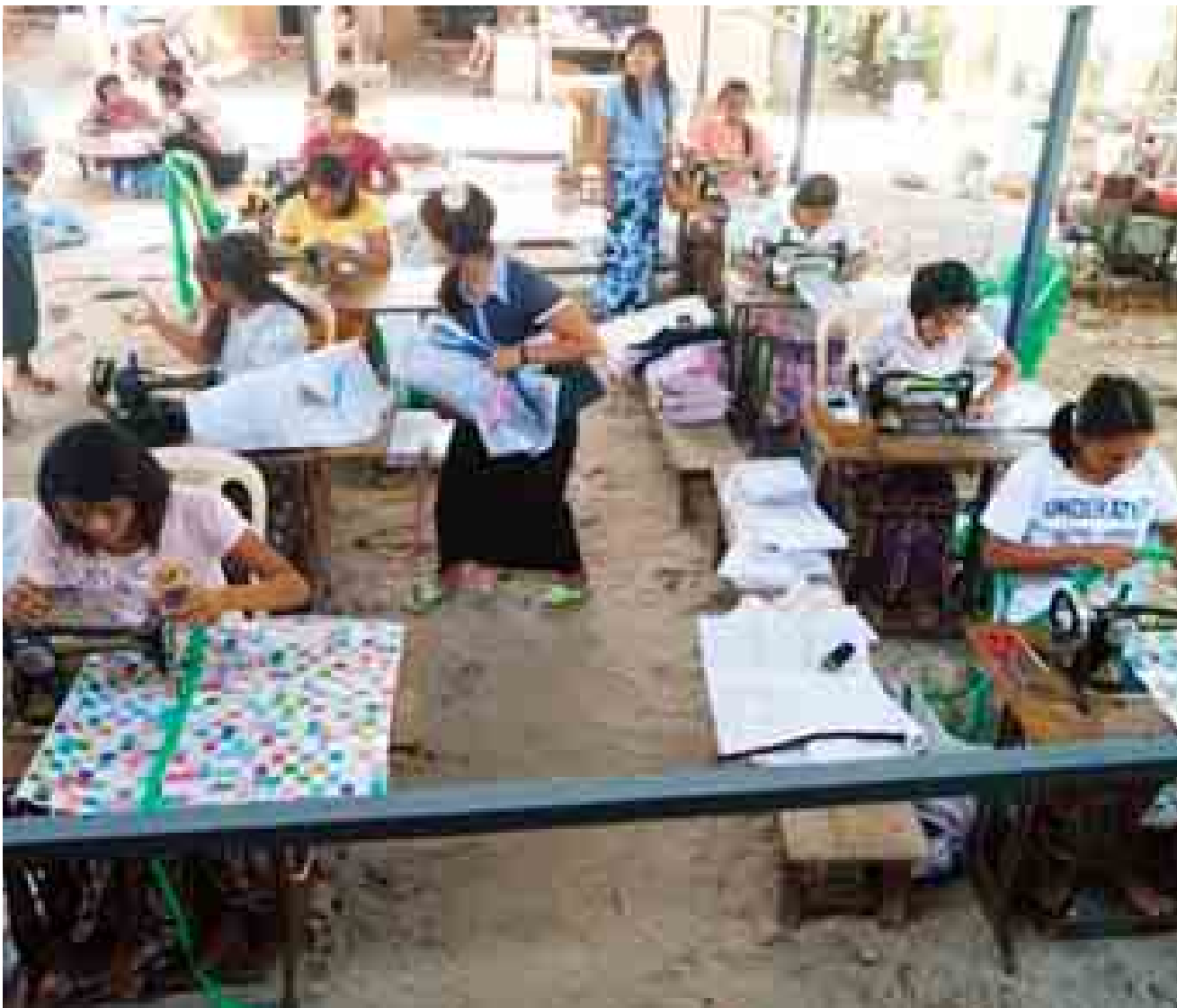
မိသားစုဝင်ငွေကို တစ်ဖက်တစ်လမ်းမှ အားဖြည့်ပေးနေပုံမှာ။