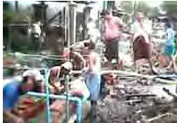
လွတ်ကင်းတော့မည်ဖြစ်သလို လမ်းသူလမ်းသားများ၏ စေတနာအကျိုးကို မြင်တွေ့ရတော့မည်ဖြစ်ကြောင်း ရပ်မိလမ်းသားများ၏ စေတနာအကျိုးကို ရပ်ဖတစ်ဦးက ပြောသည်။ (ထွန်းဝင်း)

လမ်းမနှင့် ခေမာ(၁) လမ်းထိပ်တွင် အရှည် ၂၄ ပေ၊ အကျယ် ငါးပေနှင့် အနက် ငါးပေရှိ ရေထုတ်မြောင်းဖောက်လုပ်ခြင်းလုပ်ငန်း ဆောင်ရွက်နေသည်ကို စက်တင်ဘာ ၄ ရက်က တွေ့ရသည်။ (ယာဉ်) ထိုရေထုတ်မြောင်းအား ပွင့်လင်းရာသီတွင် အမြန်ပြီးစီးအောင် ဆောင်ရွက်နေကြောင်း၊ ကလေး၊ လူကြီးများ ရေထဲမှသွားလာခြင်းမှ