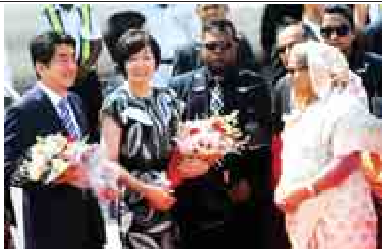
စက်တင်ဘာ ၆ ရက်က ဒါကာရှိ နိုင်ငံတကာလေဆိပ်၌ ဝန်ကြီးချုပ် အာဘေးအား ဝန်ကြီးချုပ် ရိုတ်ဟာဆီနာ ကြိုဆိုနှုတ်ဆက်စဉ်။