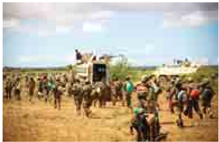
ဆိုမာလီနိုင်ငံ၌ လုံခြုံရေးဆောင်ရွက်နေသော အာဖရိကသမဂ္ဂ ငြိမ်းချမ်းရေးထိန်းသိမ်းမှု တပ်ဖွဲ့ဝင်များကို တွေ့ရစဉ်။