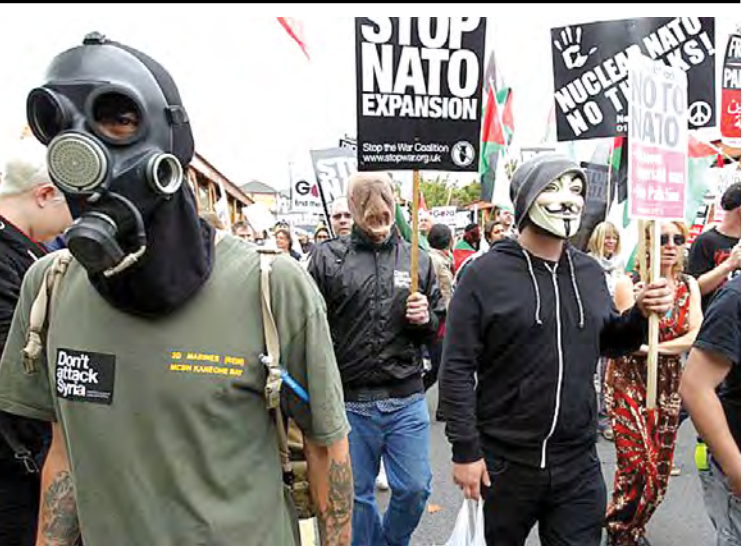
နေတိုး ထိပ်သီးအစည်းအဝေး ကျင်းပချိန်အတွင်း ဝေလနယ်တောင်ပိုင်း နယူးပိုက်မြို့၌ စစ်ဆန့်ကျင်ရေး ဆန္ဒပြကြစဉ်။