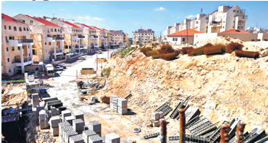
အနောက်ဘက်ကမ်း ဒေသရှိ ရဟူဒီအခြေစိုက်နေထိုင်ရာရပ်ကွက် တစ်ခုကို တွေ့ရစဉ်။