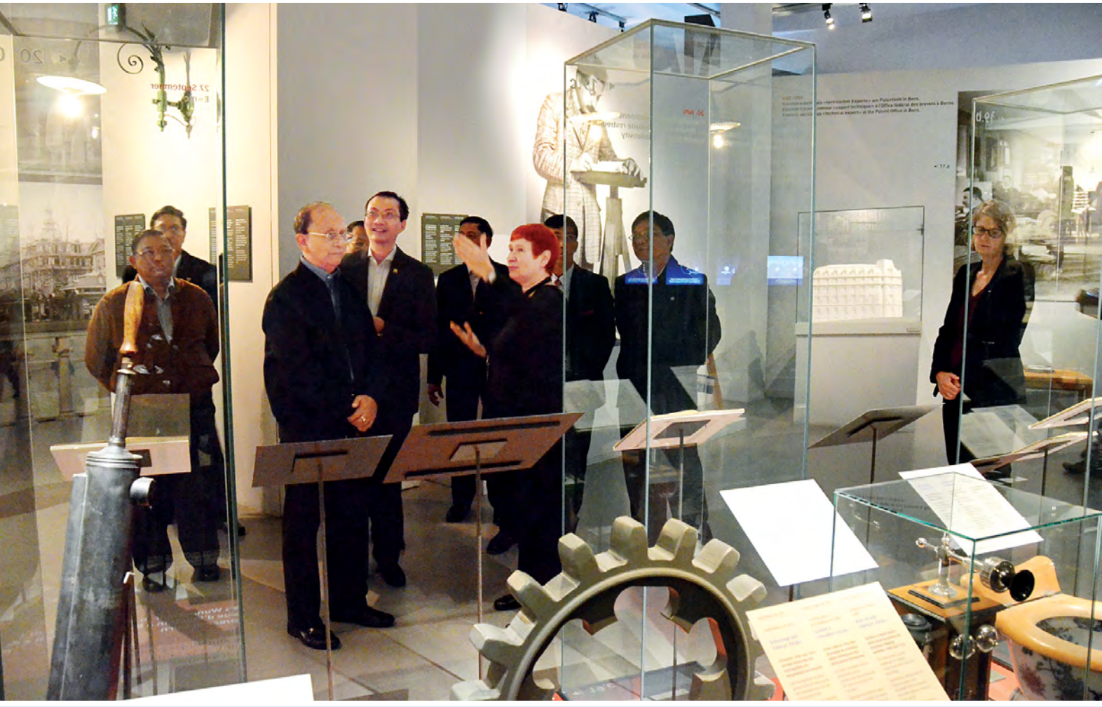
နိုင်ငံတော်သမ္မတ ဦးသိန်းစိန် ဆွစ်ဇာလန်နိုင်ငံ Bern Historical Museum အတွင်းရှိ Albert Einstein ပြတိုက်သို့ သွားရောက်ကြည့်ရှုလေ့လာစဉ်။ (သတင်းစဉ်)

ဘန်းမြို့ စက်တင်ဘာ ၅ ဆွစ်ဇာလန်နိုင်ငံတွင် ချစ်ကြည်ရေး ခရီးရောက်ရှိနေသော ပြည်ထောင်စု သမ္မတမြန်မာနိုင်ငံတော် နိုင်ငံတော် သမ္မတ ဦးသိန်းစိန်သည် စက်တင်ဘာ ၅ ရက် ဒေသစံတော်ချိန် နံနက် ၈ နာရီခွဲတွင် ဆွစ်ဇာလန်နိုင်ငံရှိ ခေတ္တ တည်းခိုသည့် ဘန်းမြို့ Hotel Bellevue Palace ၌ ဆွစ်ဇာလန်နိုင်ငံ NZZ သတင်းဌာနမှ တာဝန်ရှိသူ အား လက်ခံတွေ့ဆုံပြီး မေးမြန်းချက် များကို ဖြေကြားခဲ့သည်။ ထို့နောက် နိုင်ငံတော်သမ္မတ ဦးသိန်းစိန်သည် အဖွဲ့ဝင်များနှင့်အတူ ဆွစ်ဇာလန်နိုင်ငံ Bern Historical Museum အတွင်းရှိ Albert Einstein ပြတိုက်ကို သွားရောက် ကြည့်ရှုလေ့လာသည်။ ရှေးဦးစွာ နိုင်ငံတော်သမ္မတနှင့် အဖွဲ့ဝင်များအား ပြတိုက်ရှိ ရှင်းလင်း ဆောင်၌ ဆွစ်ဇာလန် ဖက်ဒရယ်နိုင်ငံ ခြားရေးဝန်ကြီးဌာန နိုင်ငံရေးရာဇဝင်ဦးစီး ဌာန အာရှ-ပစိဖိတ်ဌာနအကြီးအကဲ သံအမတ်ကြီး H.E.Mr.Johannes MATYASSY က ကြိုဆိုနှုတ်ခွန်း ဆက်စကားပြောကြားသည်။ ထို့နောက် HOUSE of Cantons ၏ ပြည်တွင်းရေးရာဌာန အကြီး အကဲ Mr. Thomas MINGER၊ ဘန်းပြည်နယ် ဆက်သွယ်ရေးဌာန စာမျက်နှာ ၃ ကော်လံ ၅ သို့ ❖