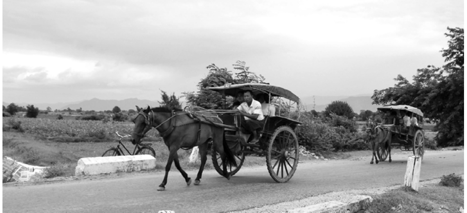
ရာသီများတွင် အလှူပွဲများ ပေါများသောကြောင့် အလှူဝတ်ဆံလှည့်ရာတွင် မောင်ရှင်လောင်းစီးရန် အတွက် မြင်းအငှားလိုက်ရသောကြောင့် ဝင်ငွေရကာ ခရီးစဉ်အကွာအဝေးပေါ်မူတည်၍ ငွေကျပ် ၈၀၀၀ မှ ငွေကျပ် ၁၅၀၀၀ ဝန်းကျင် ရရှိကြောင်း မြင်းလှည်းမောင်းသူတစ်ဦးက ပြောသည်။ (လှိုင်သန်းတင့်)

တင်နိုင်ပြီး ရမည်းသင်းမြို့မှ ရွှေမြင်တင်တောင်တော်အထိ လူတစ်ဦးလျှင် ငွေကျပ် ၇၀၀၊ ရမည်းသင်းမြို့မှ စံပြသိမ်ကုန်းရွာအထိ လူတစ်ဦးလျှင် ငွေကျပ် ၃၀၀ မြင်းလှည်းခပေးရပြီး ဆန်တစ်အိတ်၊ ဆီတစ်ပုံး၊ ဈေးတောင်းတစ်တောင်း အစရှိသော ကုန်ပစ္စည်းများကိုလည်း လူတစ်ယောက်ခအတိုင်း ပေးရသည်။ စင်းလုံးပြတ်ငှားပါက ခရီးစဉ်အကွာအဝေး၊ အသွားအပြန်၊ စောင့်ရမည့် အချိန်ကို တွက်၍ ငွေကျပ် ၆၀၀၀ မှ ငွေကျပ် ၁၀၀၀၀ ဝန်းကျင် ပေးရသည်။ ပုံမှန်ပြေးဆွဲပါက တစ်ခေါက် (အသွားသို့မဟုတ် အပြန် ခရီးစဉ်တစ်ကြောင်း)လျှင် လူနှင့် ကုန်