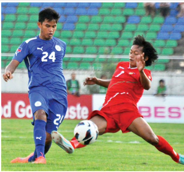
မြန်မာအသင်းနှင့်ဖိလစ်ပိုင်အသင်းတို့ ၂၀၁၂ ခုနှစ်က သုဝဏ္ဏကွင်း တွင် ခြေစွမ်းကစားနေစဉ်။

မြန်မာအသင်းနှင့်ဝိုင်းလှပွဲတွင် တွေ့ဆုံနေသည့် ဖိလစ်ပိုင်အသင်းမှာ