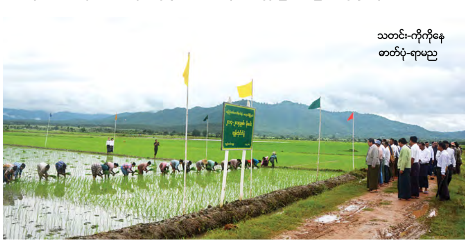
သတင်း-ကိုကိုနု ဓာတ်ပုံ-ရာမည

တောင်သူများ ဝင်ငွေနှစ်ဆပိုရအောင် အထွက်နှုန်းကောင်းစပါးမျိုးကောင်းမျိုးသန့် ရွေးချယ်စိုက်ပျိုးရန်၊ သိပ္ပံနည်းကျ စိုက်ပျိုးစနစ်များအား လိုက်နာ၍ နှစ်သီးစား၊ သုံးသီးစား စိုက်ပျိုးနိုင်ရေး မှာကြားပြီး မြို့နယ်စိုက်ပျိုးရေးဦးစီးမှူးက တောင်သူများအား သိပ္ပံနည်းကျ စိုက်ပျိုးနည်း၊ ချက်ချင်းနုတ် ချက်ချင်း သယ်ချက်ချင်းစိုက်စနစ်အား ဆွေးနွေး