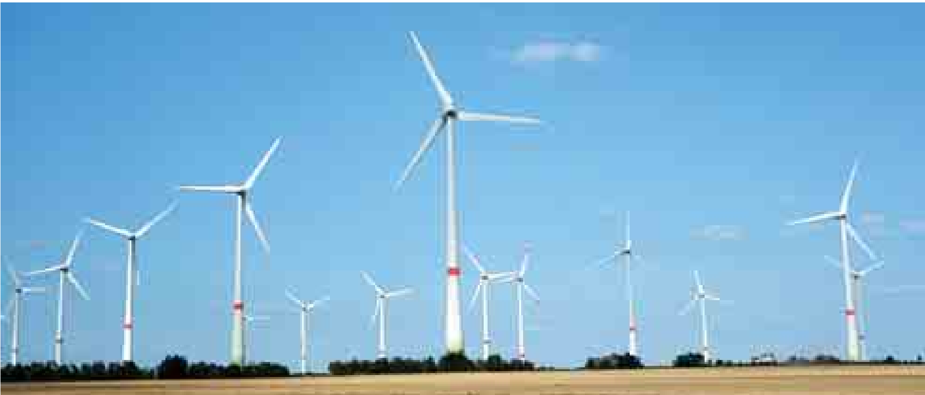
နိုင်ငံတော်သမ္မတ ဦးသိန်းစိန်နှင့်အဖွဲ့အား Wind Park ရှိ Energy Sufficient Feldheim Village မှ တာဝန်ရှိသူများက လေရဟတ်များမှ လေအားလျှပ်စစ်ထုတ်လုပ်နိုင်မှု အခြေအနေများနှင့် စပ်လျဉ်း၍ ရှင်းလင်းတင်ပြကြစဉ်(အပေါ်ပုံ)နှင့် လေအားလျှပ်စစ်ထုတ်လုပ်နေသောလေရဟတ်များကို တွေ့ရစဉ်(အောက်ပုံ) (သတင်းစဉ်)

ယင်းသို့တွေ့ဆုံစဉ် မြန်မာနိုင်ငံ၏ နိုင်ငံရေး၊ စီးပွားရေး၊ အုပ်ချုပ်ရေး ပြုပြင်ပြောင်းလဲမှုလုပ်ငန်းစဉ်များ၊ မြန်မာနိုင်ငံတွင် မကြိုင်ကြီးသုံးရပ်ဖြစ်သည့် ဥပဒေပြုရေး၊ အုပ်ချုပ်ရေးနှင့် တရားရေးမဏ္ဍိုင်တို့ ဖွဲ့စည်းပုံအခြေခံဥပဒေပါ ပြဋ္ဌာန်းချက်များနှင့်အညီ အချင်းချင်းအပြန်အလှန်ထိန်းကျောင်း ဆောင်ရွက်နေမှုအခြေအနေ၊ ပြည်ထောင်စုအဆင့်၊ တိုင်းဒေသကြီး/ပြည်နယ်အဆင့်နှင့် ကိုယ်ပိုင်အုပ်ချုပ်ခွင့်ရတိုင်း၊ ဒေသအဆင့်များတွင် အုပ်ချုပ်ရေးနှင့် ဥပဒေပြုရေးအာဏာများ ခွဲဝေကျင့်သုံးနေမှု၊