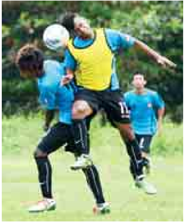
JFL ညွှန်ပေါင်းအသင်းနှင့် ခြေစမ်းမည့် မြန်မာယူ-၂၃ အသင်း လေ့ကျင့်နေစဉ်။

မြန်မာနိုင်ငံဘောလုံးအဖွဲ့ချုပ်နှင့် ဂျပန်ဘောလုံးအဖွဲ့ချုပ်တို့၏ ပူးပေါင်းစဉ်မှုအရ မြန်မာယူ-၂၃ အသင်းနှင့် JFL ညွှန်ပေါင်းအသင်းတို့သည် စက်တင်ဘာ ၁၀ ရက်တွင် ရန်ကုန်မြို့ရှိ သုဝဏ္ဏတွင်း၌ ခြေစမ်းကစားသွားမည် ဖြစ်သည်။