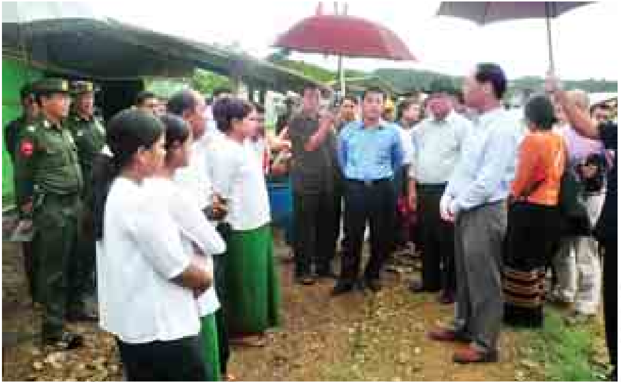
ဒုတိယသမ္မတ ဒေါက်တာစိုင်းမောက်ခမ်း မြေပုံမြို့နယ် တောင်ပေါ်ကယ်ဆယ်ရေးစခန်းတွင် စခန်းယာယီစာသင်ကျောင်းရှိ ဆရာ ဆရာမများနှင့် ကျောင်းသား ကျောင်းသူများအား တွေ့ဆုံအားပေးစဉ်။ (သတင်းစဉ်)

ရခိုင်ပြည်နယ် ပဋိပက္ခဖြစ်ပွားခဲ့သည်မှာ နှစ်နှစ်ကျော်ကြာခဲ့ပြီဖြစ်ကြောင်း၊ ကနဦးက သာမန်ပြစ်မှုတစ်ခုသာဖြစ်ခဲ့ပြီး နောက်ပိုင်းတွင် လူ့အသိုက်အဝန်းနှစ်ခုအကြားဖြစ်ပွားသည့် ပဋိပက္ခအသွင်သို့ရောက်ရှိခဲ့ပါကြောင်း၊ ပဋိပက္ခဖြစ်ပွားစဉ်ကတည်းက