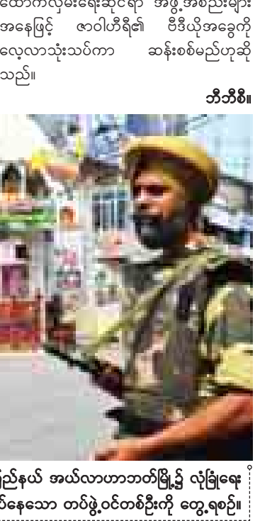
အိန္ဒိယနိုင်ငံ ဥတ္တာပရာဒေရှ်ပြည်နယ် အယ်လာဟာဘတ်မြို့၌ လုံခြုံရေး စောင့်ကြပ်နေသော တပ်ဖွဲ့ဝင်တစ်ဦးကို တွေ့ရစဉ်။

အရာရှိများနှင့် ပြည်ထဲရေးဝန်ကြီးတို့ တွေ့ဆုံ ဆွေးနွေးမှုအပြီး လုံခြုံရေးဆိုင်ရာ အစီအစဉ် သစ်များနှင့် ပတ်သက်၍ အိန္ဒိယဝန်ကြီးချုပ် ထံ တင်ပြအစီရင်ခံမည်ဟု ဆိုသည်။ အိန္ဒိယနိုင်ငံအတွင်းမှ လုံခြုံရေးနှင့် ထောက်လှမ်းရေးဆိုင်ရာ အဖွဲ့အစည်းများ အနေဖြင့် ဇာဝါဟီရီ၏ ဗီဒီယိုအခွေကို လေ့လာသုံးသပ်ကာ ဆန်းစစ်မည်ဟု ဆို သည်။ ဘီဘီစီ။