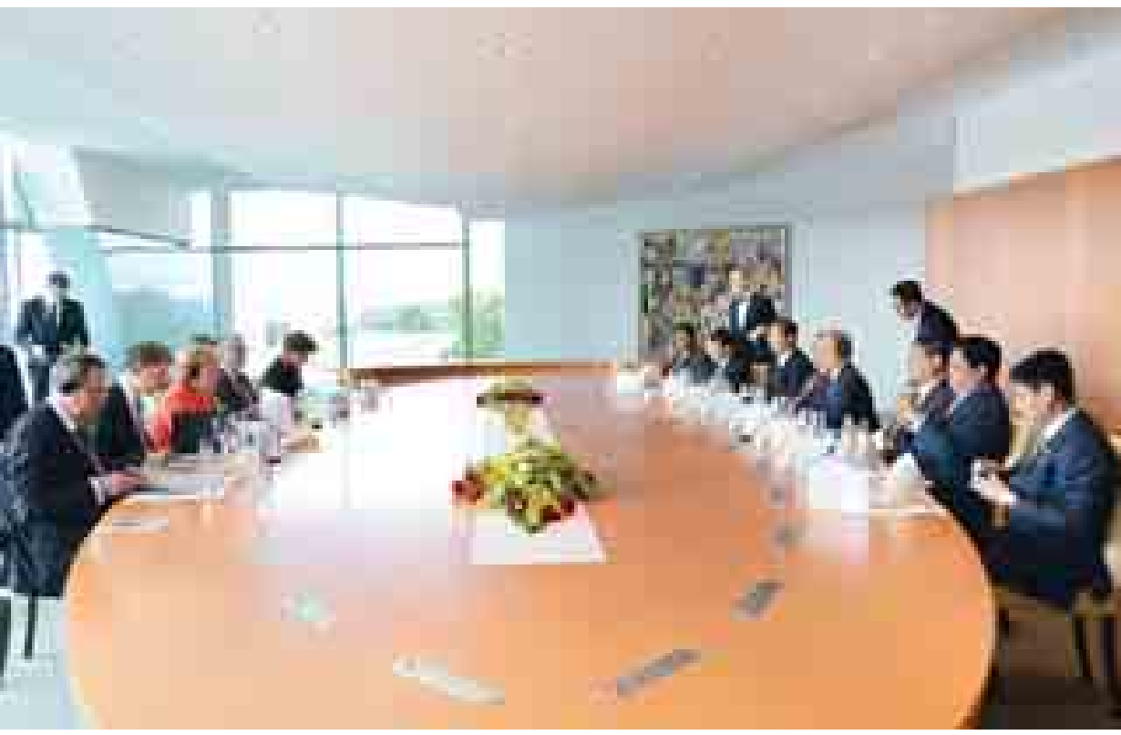
အုပ်ချုပ်ရေးယန္တရား တိုးတက်ကောင်းမွန်အောင် ကောင်းမွန်သော အုပ်ချုပ်မှုစနစ်ရှိသည့် သန့်ရှင်းသောအစိုးရဖြစ်အောင် ဆောင်ရွက်