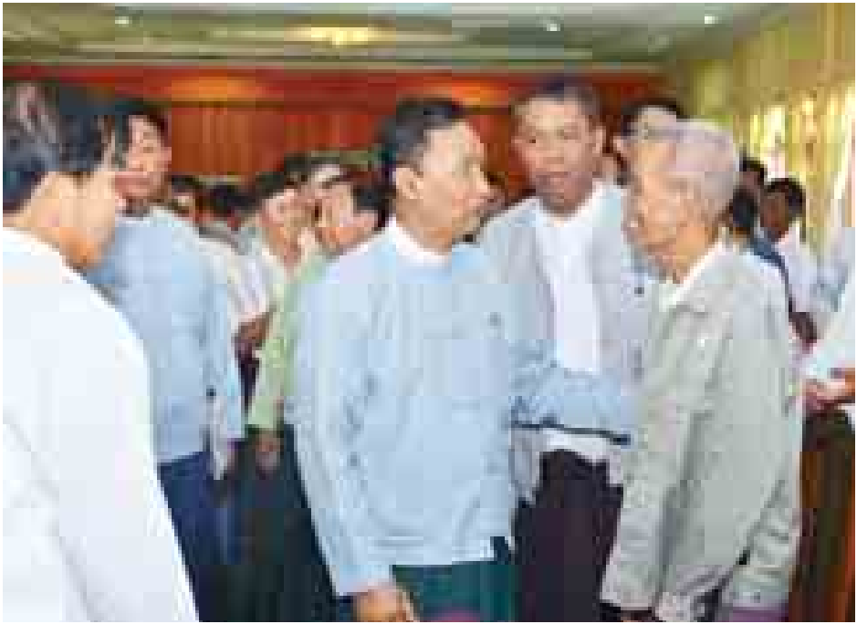
ပြည်သူ့လွှတ်တော်ဥက္ကဋ္ဌ သူရဦးရွှေမန်း တွေ့ဆုံအပြီးတွင် တက်ရောက်လာကြသူများအား ရင်းရင်းနှီးနှီး နှုတ်ဆက်စဉ်။

အခမ်းအနားတွင် ပြည်သူ့လွှတ်တော်ဥက္ကဋ္ဌ သူရဦးရွှေမန်းက ရပ်ကွက်၊ ကျေးရွာ၊ မြို့နယ်ဖွံ့ဖြိုးတိုးတက်ရေးအတွက် ဖွဲ့စည်းထားသောကော်မတီများသည် သက်ဆိုင်ရာပြည်သူများ၊ ပြည်သူ့ကိုယ်စားလှယ်များနှင့် ညှိနှိုင်းတိုင်ပင်ပြီး လုပ်ငန်းစီမံကိန်းများဆောင်ရွက်နိုင်ရန်အတွက် ဘဏ္ဍာငွေရရှိရေးနှင့် ရရှိဘဏ္ဍာငွေများကို ခွင့်ပြုထားသောလုပ်ငန်းများအလိုက် စနစ်တကျနှင့်ထိထိရောက်ရောက် သုံးစွဲနိုင်ကြရန် ဆောင်ရွက်ရန် လိုအပ်ပါကြောင်း။