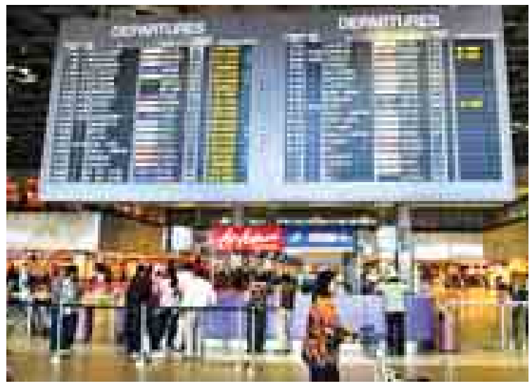
စင်ကာပူချန်ဂီလေဆိပ်ရှိ လေကြောင်းကောင်တာများကို တွေ့ရစဉ်။

စင်ကာပူ စက်တင်ဘာ ၄ စင်ကာပူချန်ဂီလေဆိပ်၌ လုပ်ငန်းဆောင် ရွက်နေသော လေကြောင်းဌာနများသည် တာဝေးပျံလေကြောင်း ခရီးစဉ်များအတွက် လေယာဉ်ဆင်းသက်ခ ငွေကြေးသက်သာခွင့် ရရှိမည်ဖြစ်ကြောင်း ချန်ဂီလေဆိပ်အုပ်စုက ထုတ်ပြန်သော သတင်းကြေညာချက်တစ်ရပ် တွင် ဖော်ပြသည်။ လာမည့် ၁၉လတာ ကာလတွင် တာဝေး ပျံလေယာဉ်များအတွက် မက်လုံးပေးသော အစီအစဉ်တစ်ရပ်ကို အကောင်အထည် ဖော်မည်ဖြစ်ကြောင်း ချန်ဂီလေဆိပ်အုပ်စုက ပြောကြားသည်။ စင်ကာပူနိုင်ငံကို နိုင်ငံတကာလေကြောင်း သွားလာရေးလုပ်ငန်း၌ အချက်အချာကျသည့် နိုင်ငံအဖြစ် ရပ်တည်လာနိုင်စေရန် ရည်ရွယ် လျက်လာမည့် ၁၉လတာကာလတွင် စင်ကာပူ ဒေါ်လာသန်း ၅၀ (အမေရိကန်ဒေါ်လာသန်း