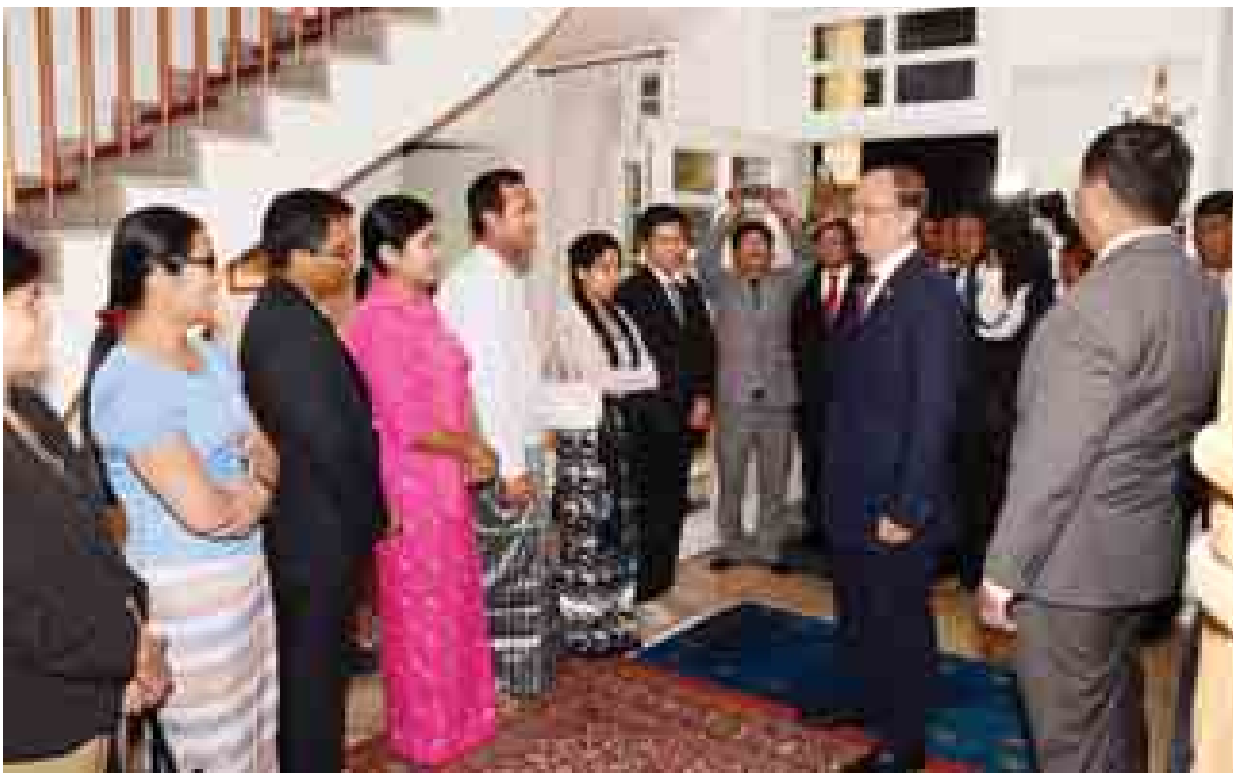
နိုင်ငံတော်သမ္မတ ဦးသိန်းစိန် သံရုံးမိသားစုများ၊ မြန်မာပညာတော်သင်များအား တွေ့ဆုံအားပေးစကားပြောကြားစဉ်၊ (သတင်းစဉ်)