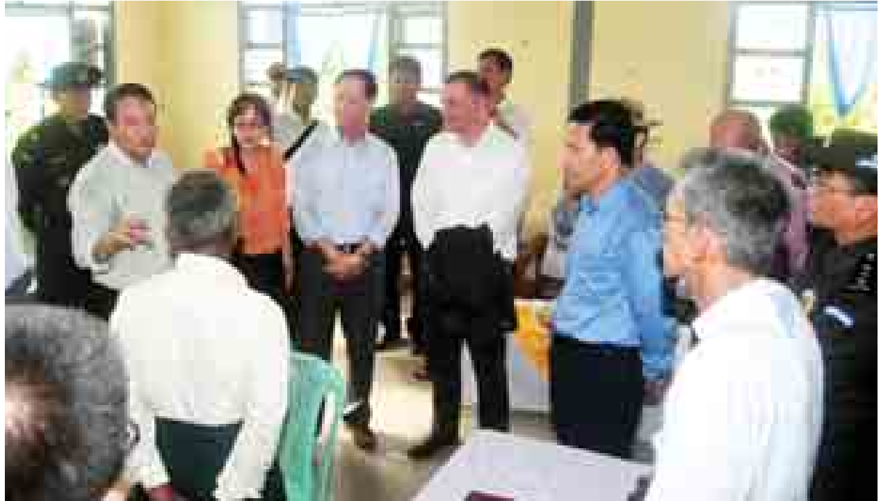
ဒုတိယသမ္မတ ဒေါက်တာ စိုင်းမောက်ခမ်း မြေပုံမြို့နယ် တောင်ပေါ်ကယ်ဆယ်ရေးစခန်းတွင် နိုင်ငံသားပြုနိုင်ခွင့်ရရှိရေးဆိုင်ရာ လုပ်ငန်းဆောင်ရွက် ပေးနေမှုအခြေအနေကို ကြည့်ရှုစစ်ဆေးစဉ်။

ဒုတိယသမ္မတနှင့်လိုက်ပါလာသည့် သံတမန်များကလည်း စုံစမ်း စစ်ဆေးရေးအဖွဲ့၏ လုပ်ငန်းဆောင်ရွက်ပေးနေမှုအခြေအနေများကို မျက်မြင် လေ့လာကြည့်ရှုပြီး သိရှိလိုသည်များကို မေးမြန်းကြရာ တာဝန်ရှိသူများက ပြန်လည်ရှင်းလင်းခဲ့ကြသည်။ (သတင်းစဉ်)