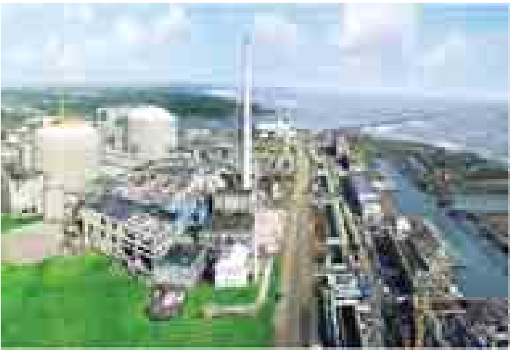
အိန္ဒိယနိုင်ငံ မဟာရာဇတြာပြည်နယ် တာရာပူရမြို့ရှိ အာဏုမြူဓာတ်အားပေးစက်ရုံကို တွေ့ရစဉ်။

ယခင်လောဘအစိုးရက ကာလရှည်ကြာ စွာ ပိတ်ပင်ထားမှုကို ရုပ်သိမ်းပြီးနောက် ၂၀၁၂ခုနှစ်တွင်၎င်းနှစ်နိုင်ငံတို့သည် ယူရေနီယံရောင်းချရေးကို စတင်ဆွေးနွေးခဲ့ကြ သည်။ အိန္ဒိယနိုင်ငံသည်ယူရေနီယံများကို အရပ် ဘက် အကျိုးအတွက်သာ အသုံးပြုရေးအတွက် ပြည့်စုံသော ထိန်းသိမ်းစောင့်ရှောက်ရေးအစီ အစဉ်များ ချမှတ်ပြီးဖြစ်မည်ဟု ဩစတြေးလျ က ယုံကြည်ကြောင်း ကုန်သွယ်ရေးဝန်ကြီး ဒန်ဒရူးဂျော့က ယခုသီတင်းပတ်အတွင်းတွင် ပြောကြားခဲ့သည်။ အိန္ဒိယနိုင်ငံသည်လက်ရှိအနေအထား တွင် ကျောက်မီးသွေးစွမ်းအင်အပေါ် မှီခို အားထားနေရသည်။ သို့သော်အနာဂတ်ကာလ တွင် နျူကလီးယားစွမ်းအင် အစီအစဉ်ကို တိုးချဲ့အကောင်အထည်ဖော်မည်ဖြစ်သည်။ ဘီဘီစီ။