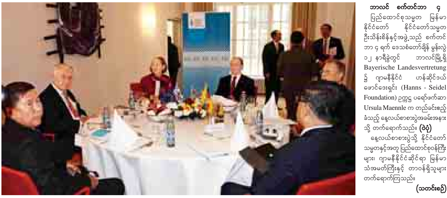
နိုင်ငံတော်သမ္မတ ဦးသိန်းစိန်နှင့် အဖွဲ့ အား ဟန်ဆိုင်ဒယ်ဟောင်ဒေးရှင်းဥက္ကဋ္ဌက နေ့လယ်စာစားပွဲဖြင့် တည်ခင်းစဉ်ခံ