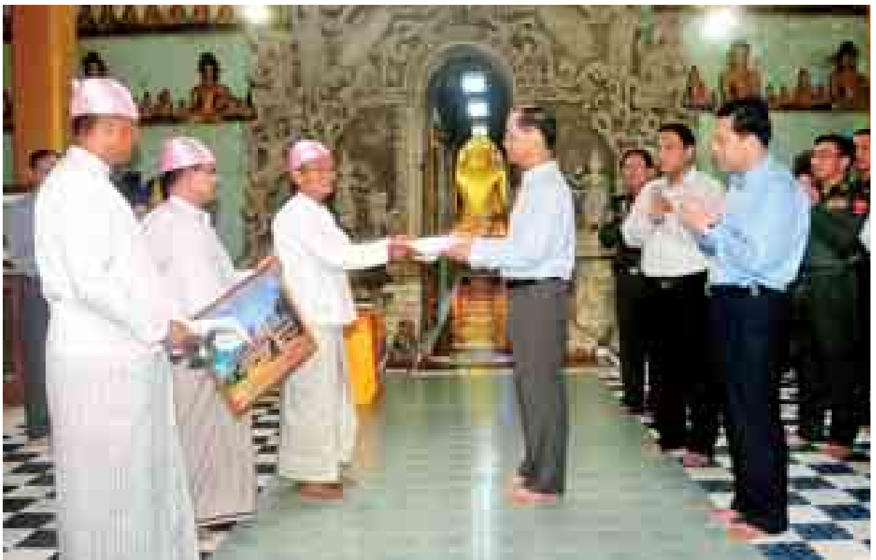
ဒုတိယသမ္မတ ဒေါက်တာ စိုင်းမောက်ခမ်း မြောက်ဦးမြို့ သျှစ်သောင်းပုထိုးတော်၌ အလှူငွေပေးအပ်လှူဒါန်းစဉ်။

ရခိုင်ပြည်နယ်အတွင်း နေအိမ်၊ ကျောင်း၊ ဆေးရုံ၊ စေ့၊ ငါးဖမ်းလုပ်ငန်း၊ လယ်ယာစိုက်ပျိုးရေးလုပ်ငန်း စသည်တို့အပါအဝင် အခြေခံအဆောက်အအုံ များကို တည်ဆောက်သွားရန် လိုအပ်ပါကြောင်း၊ ထို့ကြောင့် ကုလသမဂ္ဂအဖွဲ့၏ အကူအညီများ၊ နိုင်ငံတကာအသိုက်အဝန်းများ၊ ဖွံ့ဖြိုးတိုးတက်မှု မိတ်ဖက်များအနေဖြင့် လာမည့်လများ၌ ဖွံ့ဖြိုးတိုးတက်မှုအကူအညီများ ပံ့ပိုးသွားရန် စီမံချက်များကို ဆောင်ရွက်သွားရန် အထူးတိုက်တွန်းလိုပါကြောင်း၊ အမျိုးသား ပြန်လည်သင့်မြတ် စေရေး လိုက်လျောညီထွေရေးနှင့် ငြိမ်းချမ်းကြွယ်ဝစည်ပင်သည့် ရခိုင်ပြည်နယ်