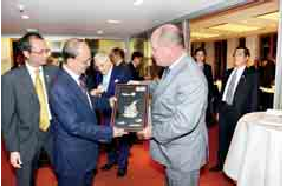
နိုင်ငံတော်သမ္မတ ဦးသိန်းစိန် ဂျာမနီနိုင်ငံ Korber Foundation ဥက္ကဋ္ဌ တည်ခင်းစဉ်ခံသည့် ညစာစားပွဲသို့ တက်ရောက်ပြီး အမှတ်တရလက်ဆောင်ပေးစဉ်၊ (သတင်းစဉ်)

● ဓမ္မပုံပေး ဖွဲ့စည်းပုံအခြေခံဥပဒေပြင်ဆင်ရေး ဆိုင်ရာ ပြဋ္ဌာန်းချက်များနှင့် လွတ်လပ်ပြီး တရားမျှတသည့် နွှော့ကောက်ပွဲဆိုင်ရာ ကိစ္စများကို ဆွေးနွေးခဲ့ကြသည်။ ဥပဒေပြင်ဆင်ရေးအဖွဲ့သည် Korber Foundation ရုံးချုပ်သို့ရောက်ရှိပြီး ဂျာမနီနိုင်ငံ Non-Political Think Tank အဖွဲ့၊ မြစ်သော Korber Foundation ဥက္ကဋ္ဌ Mr. Christian Wriedt က တည်ခင်းစဉ်ခံသည့် ညစာစားပွဲသို့ တက်ရောက်ခဲ့ကြသည်။ ယင်းနောက် နိုင်ငံတော်သမ္မတ ဦးသိန်းစိန်သည် ဂျာမနီနိုင်ငံဆိုင်ရာ မြန်မာသံအမတ်ကြီး ဦးစိုးနွယ်နှင့် သံရုံးမိသားစုများ၊ မြန်မာပညာတော် သင်များအား စက်တင်ဘာ ၃ ရက် ညပိုင်းတွင် ဘာလင်မြို့ရှိ မြန်မာနိုင်ငံ သံအမတ်ကြီးနေအိမ်၌ တွေ့ဆုံ သည်။ ထိုသို့ တွေ့ဆုံစဉ် နိုင်ငံတော် သမ္မတက မြန်မာနိုင်ငံ၏လက်ရှိ