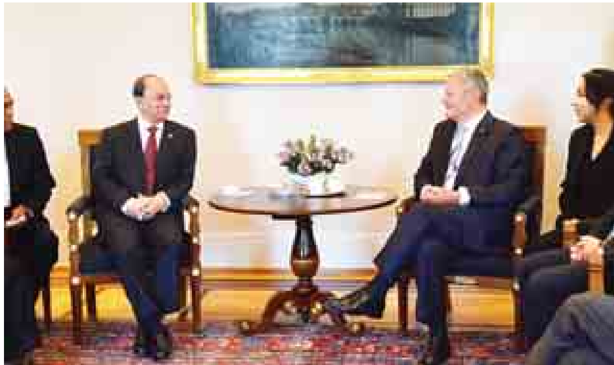
နိုင်ငံတော်သမ္မတ ဦးသိန်းစိန်နှင့် ဂျာမနီနိုင်ငံသမ္မတ မစ္စတာ ဂျိုဝါချင်ဂေါက်ခ်တို့ တွေ့ဆုံစဉ်၊ (သတင်းစဉ်)

ဘာလင် စက်တင်ဘာ ၄ ပြည်ထောင်စုသမ္မတမြန်မာနိုင်ငံတော် နိုင်ငံတော် သမ္မတ ဦးသိန်းစိန်နှင့် ဂျာမနီနိုင်ငံသမ္မတ မစ္စတာ ဂျိုဝါချင်ဂေါက်ခ် တို့သည် စက်တင်ဘာ ၄ ရက် ဒေသစံတော်ချိန် နံနက် ၁၁ နာရီတွင် ဂျာမနီနိုင်ငံ ဘာလင်မြို့ရှိ ဂျာမနီ သမ္မတအိမ်တော်၌ တွေ့ဆုံသည်။ ခရီးစဉ်ကြိုဆို ရှေးဦးစွာ နိုင်ငံတော်သမ္မတ ဦးသိန်းစိန်သည် ဂျာမနီ နိုင်ငံ သမ္မတအိမ်တော်သို့ အထူးထူးတန်းဖြင့် ရောက်ရှိ လာရာ ဂျာမနီနိုင်ငံသမ္မတက ရင်းနှီးခင်မင်စွာ ခရီးစဉ် ကြိုဆိုနှုတ်ဆက်သည်။ ရုတ်ယုတ်ကြိုဆို ထို့နောက် နှစ်နိုင်ငံသမ္မတတို့သည် သမ္မတအိမ်တော် ရှေ့တွင် မှတ်တမ်းတင်ဓာတ်ပုံရိုက်ကြသည်။ ယင်းနောက် နိုင်ငံတော်သမ္မတ ဦးသိန်းစိန်သည် ဂျာမနီနိုင်ငံသမ္မတအိမ်တော်ရှိ ညှိနှိုင်းဆွေးနွေးစဉ်၊ (သတင်းစဉ်)