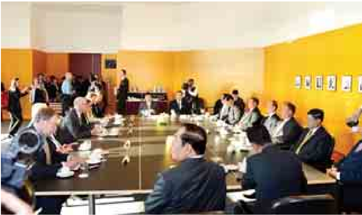
နိုင်ငံတော်သမ္မတ ဦးသိန်းစိန်နှင့် ဂျာမနီနိုင်ငံ အောက်လွှတ်တော်ဥက္ကဋ္ဌ H.E. Mr. Norbert Lammert တို့ တွေ့ဆုံဆွေးနွေးစဉ်၊ (သတင်းစဉ်)