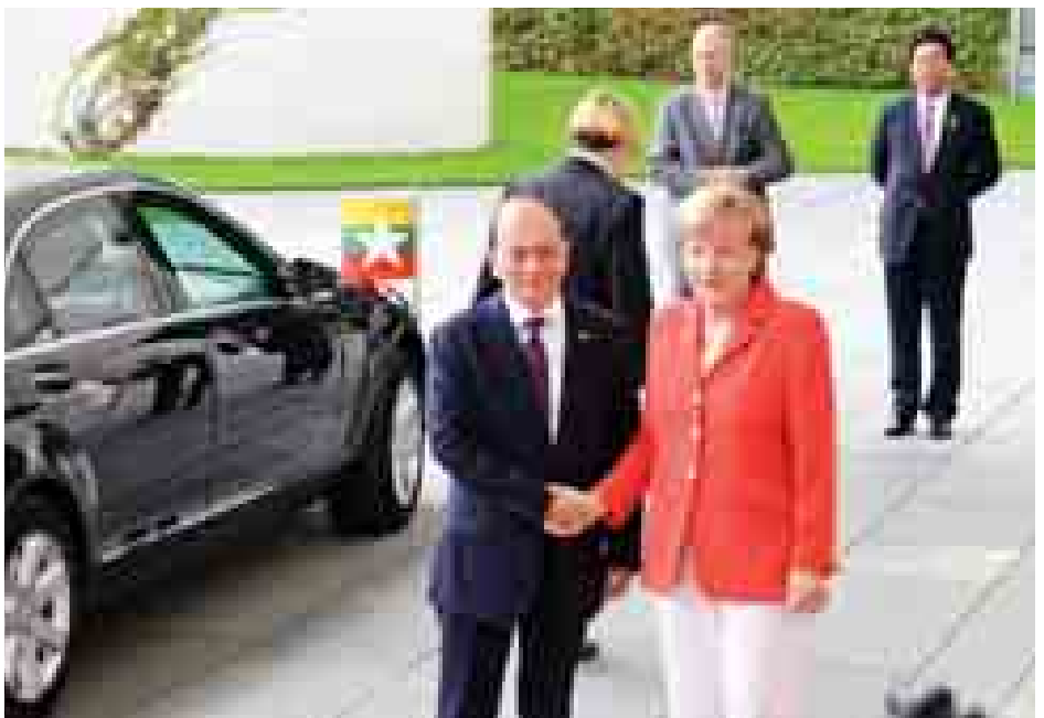
နိုင်ငံတော်သမ္မတ ဦးသိန်းစိန်အား ဂျာမနီနိုင်ငံဝန်ကြီးချုပ် မစ္စင် အိန်ဂျယ်လာမာကယ်က ရင်းနှီးခင်မင်စွာ ကြိုဆိုနှုတ်ဆက်စဉ်။

ကြောင်း၊ မိမိတို့ နှစ်နိုင်ငံ၏ ဆက်ဆံရေးကို အသစ်တစ်ခု ပြန်လည်တည်ဆောက်ရန်မဟုတ်ဘဲ ယခင်ရှိပြီးသား ဆက်ဆံရေးကို အသစ်တစ်ဖန် ပြန်လည်အားကောင်း ရှင်သန်လာအောင် ပြုလုပ်ပေးရန်သာ လိုအပ်ပါကြောင်း၊ ထို့ကြောင့် မိမိ၏ ခရီးစဉ်သည် နှစ်နိုင်ငံရှိပြီးဖြစ်သော ချစ်ကြည်ရင်းနှီးမှုကို တိုးမြှင့်ရန် လာရောက်ခြင်း ဖြစ်ပါကြောင်း၊ မိမိတို့ အနေဖြင့် ဂျာမနီကို မိတ်ကောင်း ဆွေကောင်းအဖြစ်သာမက စီးပွား မိတ်ဖက်အဖြစ် လည်းကောင်း၊ နိုင်ငံတွင်း အဓိကရင်းနှီးမြှုပ်နှံသူ အဖြစ်လည်းကောင်း ကမ်းလှမ်းလိုပါ ကြောင်း။ မိမိတို့အနေဖြင့် ဂျာမနီနိုင်ငံထံမှ ဖက်ဒရယ်ပြည်ထောင်စုအစိုးရစနစ်၊ မြို့ပြဖွံ့ဖြိုးတိုးတက်မှုပုံစံ၊ စီးပွားရေး လုပ်ငန်းများ၊ သုတေသနလုပ်ငန်းများ အပေါ် အားထုတ်မှုများ၊ အဆင့်မြင့် လူသုံးကုန်ပစ္စည်း ထုတ်လုပ်မှုများ အစဉ်အလာကောင်းသော ပညာရေး စနစ်၊ စည်းကမ်းရှိမှုနှင့် အလုပ် ကြိုးစားမှုပေါ်တွင် နမူနာယူရမှာ ဖြစ်ပါကြောင်း၊ ယခုအခါ မိမိတို့ နိုင်ငံတွင် စက်မှုလုပ်ငန်းများအတွက် ပြည်ပရင်းနှီးမှုများ ဝင်ရောက်ရန် ပြင်ဆင်နေချိန်ဖြစ်ပြီး ခရီးသွား