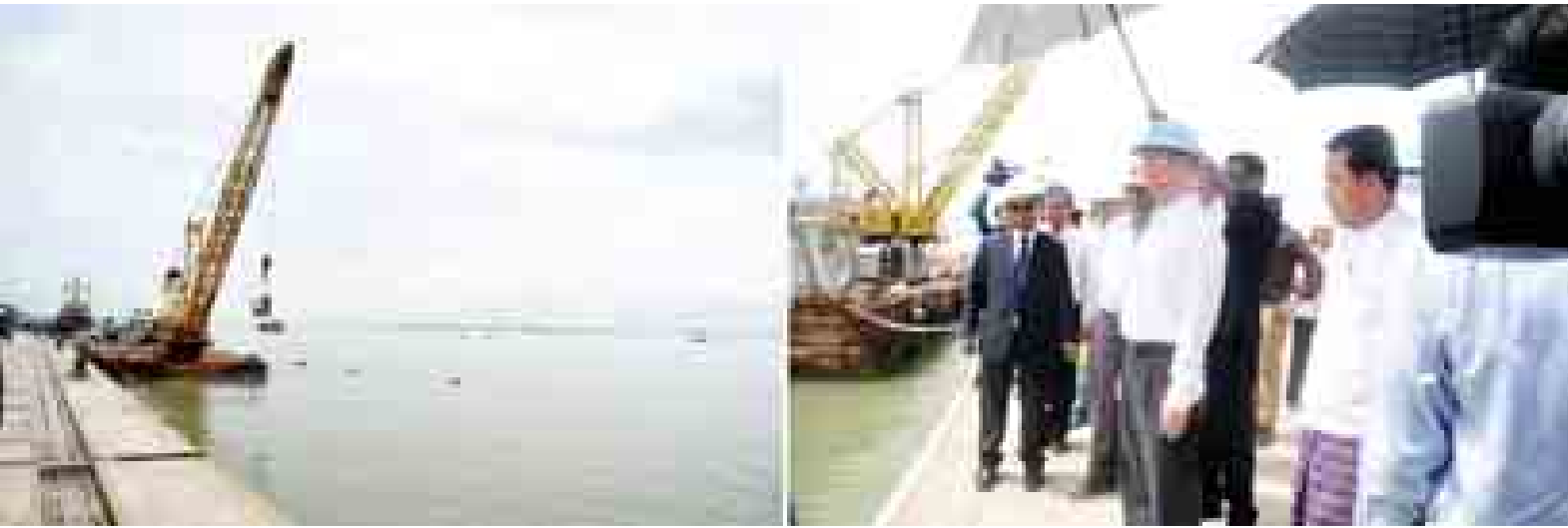
ဒုတိယသမ္မတ ဒေါက်တာစိုင်းမောက်ခမ်း ကုလားတန်မြစ်ကြောင်း ဘက်စုံသုံးဆောက်လုပ်ရေးလုပ်ငန်းခွင်အား ကြည့်ရှုစစ်ဆေးစဉ်။ (သတင်းစဉ်)