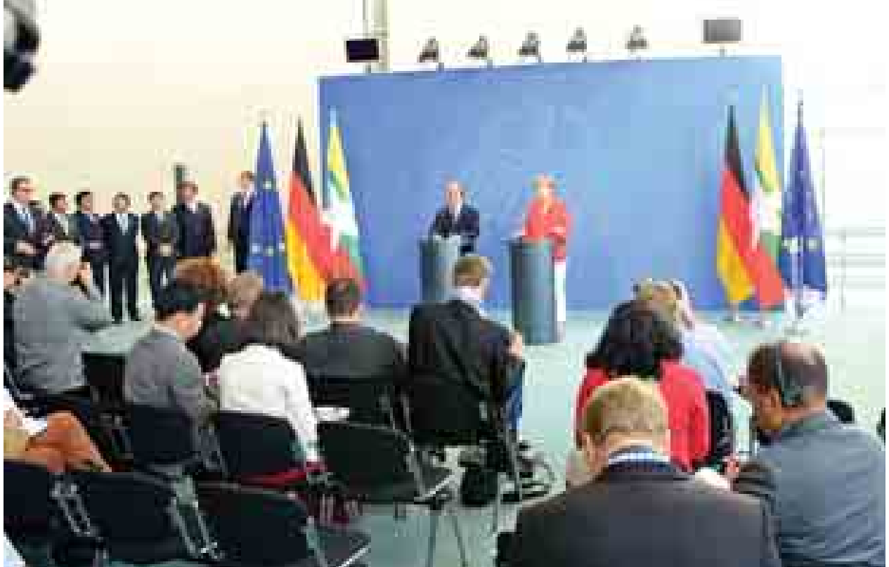
နိုင်ငံတော်သမ္မတ ဦးသိန်းစိန်နှင့် ဂျာမနီနိုင်ငံဝန်ကြီးချုပ် မစ္စင် အိန်ဂျယ်လာမာကယ်တို့ နှစ်နိုင်ငံပူးတွဲသတင်းစာရှင်းလင်းပွဲ ကျင်းပစဉ်။ (သတင်းစဉ်)

သည် ဂျာမနီကုမ္ပဏီကြီးများဆီက လေ့လာရန် လိုအပ်ပါကြောင်း၊ မိမိတို့အနေဖြင့် နိုင်ငံ၏ ပညာရေး စနစ်တစ်ခုလုံးကို ပြန်လည်ပြုပြင်ရန် ကြိုးစားလျက်ရှိပါကြောင်း၊ သို့သော် ယခုလောလောဆယ် အရေးတကြီး အနေဖြင့် လိုအပ်သည်မှာ ပညာရှင် များနှင့် ကျွမ်းကျင်လုပ်သားများ အတွက် လုပ်ငန်းခွင်ဝင်ရောက်နိုင် ရန် အရည်အချင်း ပြည့်မီစေမည့် ကာလတို မှမ်းမသံတန်းများနှင့် ကာလရှည်သင်တန်းများ ဖြစ်ပါ ကြောင်း၊ ဂျာမနီနိုင်ငံအနေဖြင့် ပံ့ပိုးကူညီဆောင်ရွက်ပေးနိုင်မည်ဟု မျှော်လင့်ပါကြောင်း၊ ဒီမိုကရေစီ ပြုပြင်ပြောင်းလဲစေ နိုင်ငံတစ်နိုင်ငံ အနေဖြင့် သုံးနှစ်တာကာလအတွင်း အောင်မြင်မှုများရှိသလို အခက်အခဲ၊ စိန်ခေါ်မှုများလည်း ကြုံတွေ့ရပါ ကြောင်း၊ သို့သော်လည်း မိမိတို့ ဖြေရှင်းဆောင်ရွက်နိုင်ပါကြောင်း။ မိမိတို့၏ ပြုပြင်ပြောင်းလဲမှုသည် အာရပ်ဇွေဦးနှင့် တစ်ချိန်တည်း စတင် ခဲ့သော်လည်း သွေးထွက်သံလိုက်များ၊ နိုင်ငံပြိုကွဲပျက်စီးမှုများ မရှိခဲ့သည် ကို အားလုံးသိရှိကြပါကြောင်း၊ မြန်မာနိုင်ငံ၏ ဒီမိုကရေစီပြုပြင် ပြောင်းလဲမှုအပေါ် အားပေးထောက် ခံမှုများနှင့်အတူ မြန်မာနိုင်ငံဖွံ့ဖြိုး တိုးတက်ရေးအတွက် အဘက်ဘက်မှ ကူညီအားပေးနေကြသော ဂျာမန်အစိုးရ နှင့် ပုဂ္ဂလိကအဖွဲ့အစည်းများအား အထူးပင်ကျေးဇူးတင်ရှိပါကြောင်းဖြင့် ပြောကြားခဲ့သည်။ (သတင်းစဉ်)