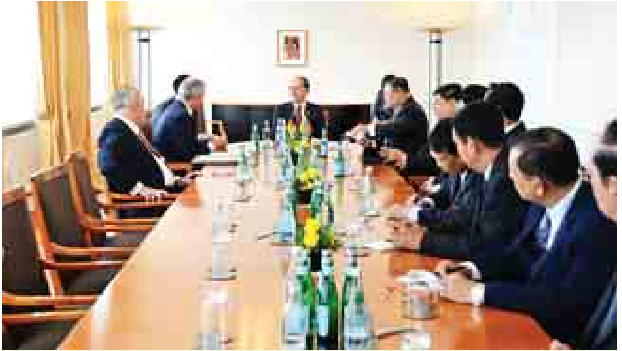
ပြည်ထောင်စုသမ္မတမြန်မာနိုင်ငံတော် နိုင်ငံတော်သမ္မတ ဦးသိန်းစိန် Deutsche Bank နှင့် German Asia Pacific Business Organization (OAV) ဥက္ကဋ္ဌနှင့်အဖွဲ့တို့ တွေ့ဆုံဆွေးနွေးကြစဉ်။ (သတင်းစဉ်)

ပြည်ထောင်စုသမ္မတမြန်မာနိုင်ငံတော် နိုင်ငံတော်သမ္မတ ဦးသိန်းစိန်နှင့် Deutsche Bank နှင့် German Asia Pacific Business Organization (OAV) ဥက္ကဋ္ဌနှင့်အဖွဲ့သည် စက်တင်ဘာ ၂ ရက် ဒေသစံတော်ချိန် မွန်းတည့် ၁၂ နာရီတွင် ဂျာမနီနိုင်ငံ ဖရန်ဖတ်မြို့ရှိ Deutsche Bank ရုံး၌ တွေ့ဆုံသည်။ ထိုသို့တွေ့ဆုံစဉ် နိုင်ငံတော်သမ္မတက မြန်မာနိုင်ငံတွင် တည်ငြိမ်အေးချမ်းရေးနှင့် လူမှုစီးပွားဘဝ ဖွံ့ဖြိုးတိုးတက်ရေးဆိုသည့် ပြည်သူ့ဆန္ဒနှစ်ရပ်ကို ဖြည့်ဆည်းနိုင်ရန်အတွက် နိုင်ငံရေး၊ စီးပွားရေးပြုပြင်ပြောင်းလဲမှုများ ပြုလုပ်နေမှုအခြေအနေနှင့် မြန်မာနိုင်ငံ စီးပွားရေးဖွံ့ဖြိုးတိုးတက်မှုအတွက် ဂျာမနီလုပ်ငန်းရှင်များက ပါဝင်ဆောင်ရွက်နိုင်မည့် အခွင့်အလမ်းများ၊ စားသောက်ကုန်ထုတ်လုပ်ရေး၊ မွေးမြူရေးနှင့် သားငါးကဏ္ဍ၊ ခရီးသွားလုပ်ငန်း၊ ပြန်လည်ပြည်ထောင်စုဖွဲ့စည်းအင်ကဏ္ဍ၊ သစ်တောထိန်းသိမ်းရေး၊ အသေးစားနှင့် အလတ်စား စက်မှုလက်မှုလုပ်ငန်းများ၊ ဆေးဝါးထုတ်လုပ်ရေးနှင့် အသက်မွေးပညာ လေ့ကျင့်ရေးသင်တန်းကျောင်းများနှင့် ပတ်သက်၍ ပူးပေါင်းဆောင်ရွက်နိုင်မည့် အလားအလာများကို ဆွေးနွေးခဲ့သည်။