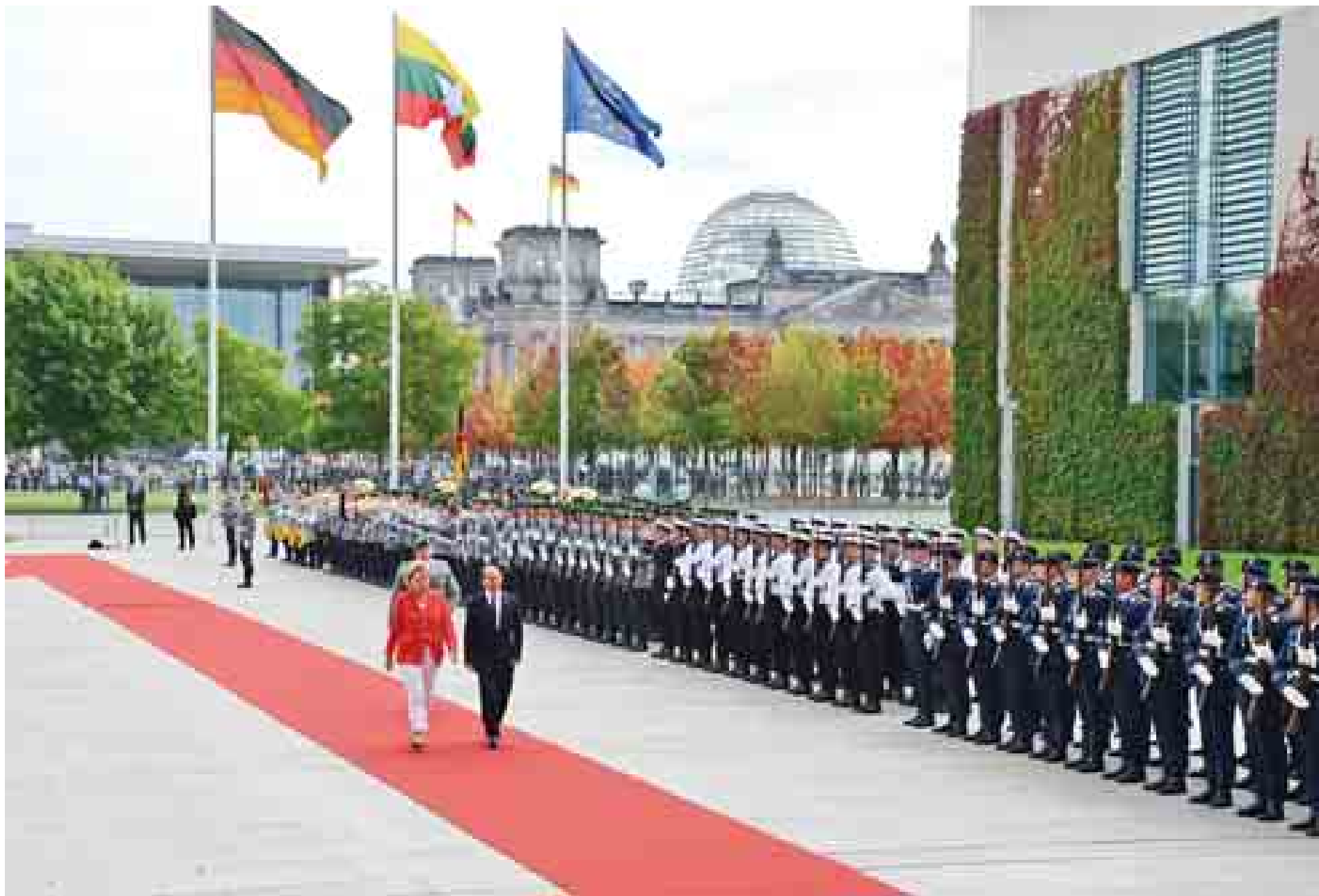
နိုင်ငံတော်သမ္မတ ဦးသိန်းစိန်နှင့် ဂျာမနီနိုင်ငံဝန်ကြီးချုပ်တို့ ဂုဏ်ပြုတပ်ဖွဲ့ကို စစ်ဆေးစဉ်။

သတင်းစာရှင်းလင်းပွဲ၌ ဂျာမနီနိုင်ငံဝန်ကြီးချုပ်ကပြောကြားရာတွင် နိုင်ငံတော်သမ္မတကြီး၏ ခရီးစဉ်ကို ကြိုဆို ပါကြောင်း၊ မြန်မာနိုင်ငံ ပြည်တွင်းဖြစ်ပေါ်တိုးတက်မှုများကို ဆွေးနွေးခဲ့ကြပါကြောင်း၊ စာမျက်နှာ ၄ ကော်လံ ၁ သို့ □