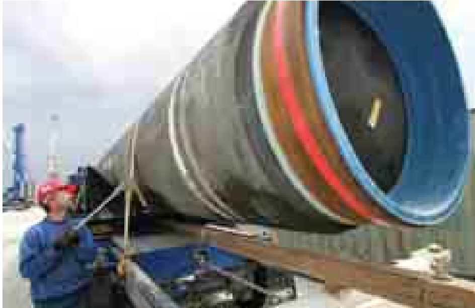
ရုရှားနိုင်ငံအရှေ့ပိုင်း ဆိုက်ဘေးရီးယား၌ ဓာတ်ငွေ့ပိုက်လိုင်း တည်ဆောက်ရေးလုပ်ငန်း စတင်စဉ်။