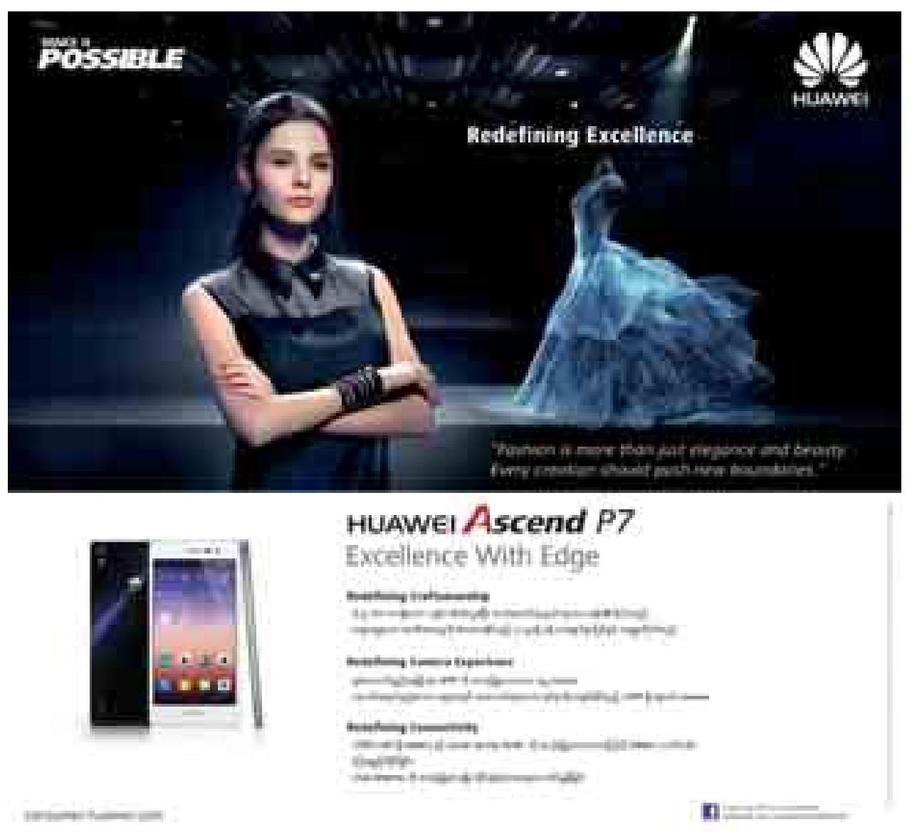
၂ - ၉ - ၁၄ ဆက်သွယ်မှု မဟာရန်ကုန်မြို့နယ်