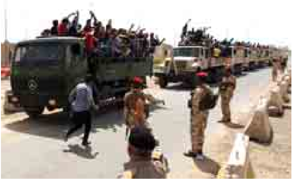
အီရတ်တပ်ဖွဲ့များ အမ်မာလီမြို့သို့ ရောက်ရှိလာစဉ်။