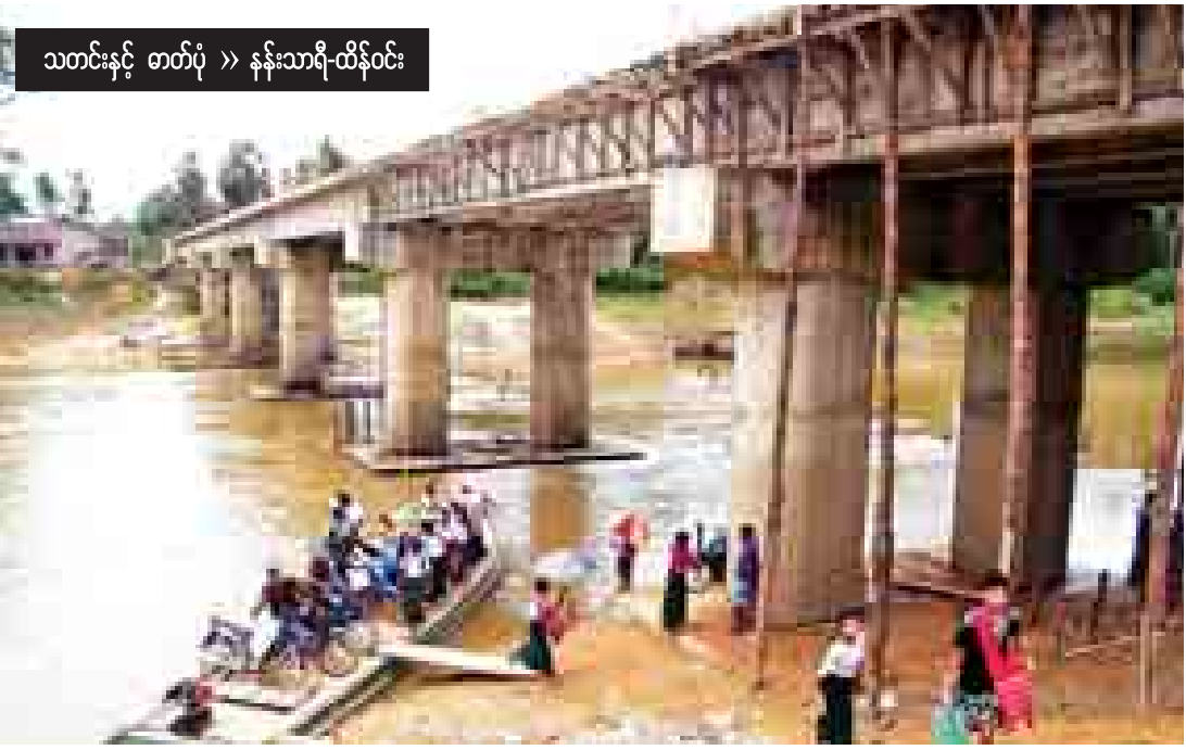
သတင်းနှင့် ဓာတ်ပုံ >> နန်းသာရီ-ထိန်ဝင်း