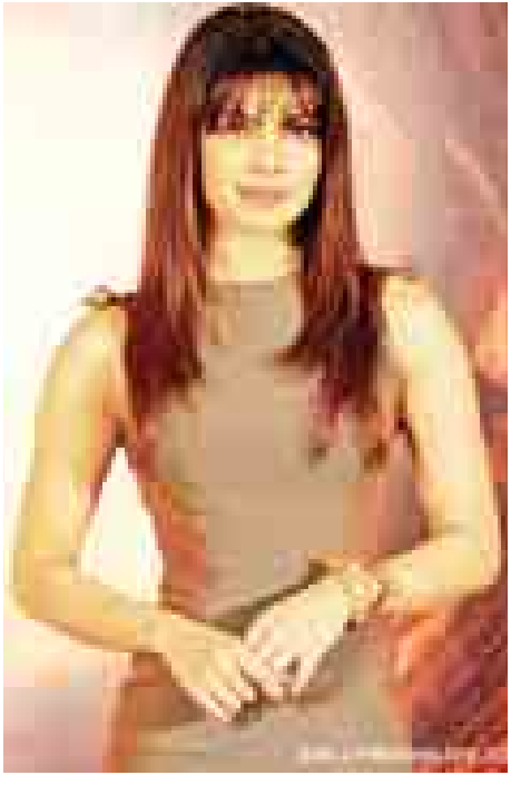
သော အမျိုးသမီးလက်ဝှေ့ချန်ပီယံတစ်ဦးဖြစ်သည့် Mary Kom နှင့် လေးလတိုင်တိုင် လက်ဝှေ့လေ့ကျင့်ခန်းများ ပြုလုပ်ခဲ့ရကြောင်း သိရသည်။

ဘောလိဝုဒ်ဌေးကြယ်ပွင့် ပရီရန်ကာချိုပရာက အိုလံပစ်ကြေးတံဆိပ်ဆုရှင်အားကစားသမားတစ်ဦး၏ အတ္ထုပ္ပတ္တိကို ပုံဖော်ရိုက်ကူးထားသည့် Mary Kom အမည်ရှိ အားကစားဒရာမာဇာတ်ကားတွင် ပါဝင်သရုပ်ဆောင်ထားပြီး ယင်းဇာတ်ကားဖြင့် Central Board of Film Certification (CBFC) မှ အသိအမှတ်ပြုလက်မှတ်ပေးအပ်ခြင်းခံခဲ့ရကြောင်း သိရသည်။ “အားကစားသမားတစ်ဦးအနေနဲ့ ပါဝင်သရုပ်ဆောင်ဖို့ ဘယ်တုန်းကမှစိတ်ကူးမရှိခဲ့ပါဘူး။ ဒါပေမယ့် ဒီဇာတ်ကားနဲ့ ‘U’ certificate ရရှိခဲ့ပါတယ်” ဟု ၎င်း၏ တွစ်တာစာမျက်နှာတွင် ရေးသားဖော်ပြခဲ့သည်။ ထို့ပြင် ငါးကြိမ်တိုင်တိုင် ကမ္ဘာ့အပျော်တမ်းလက်ဝှေ့ချန်ပီယံ အမျိုးသမီးလက်ဝှေ့အားကစားသမား Mary Kom အကြောင်းပုံဖော်ထားသည့် အဆိုပါ Mary Kom အားကစားဒရာမာဇာတ်ကားကို စက်တင်ဘာ ၅ ရက်တွင် ဖြန့်ချိပြသသွားရန်စီစဉ်ထားကြောင်း၊ မင်းသမီး ပရီရန်ကာအနေဖြင့် အဆိုပါဇာတ်ကားအတွက် ကြိုတင်ပြင်ဆင်မှုများပြုလုပ်ရာတွင် အိန္ဒိယနိုင်ငံ၏ တစ်ဦးတည်း