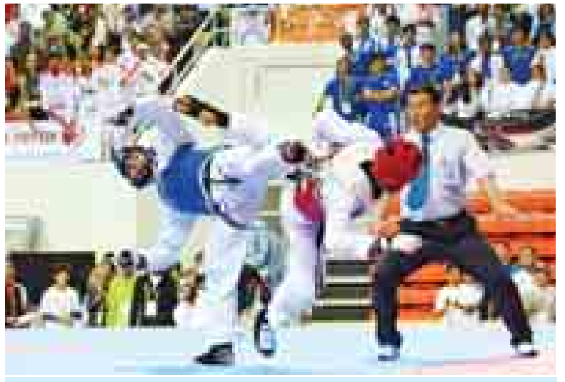
အာရှအားကစားပြိုင်ပွဲဝင်မည့် မြန်မာတိုက်တွမ်ခိုကစားသမားများ ဆီးရီးယားပြိုင်ပွဲ၌ ယှဉ်ပြိုင်နေစဉ်။