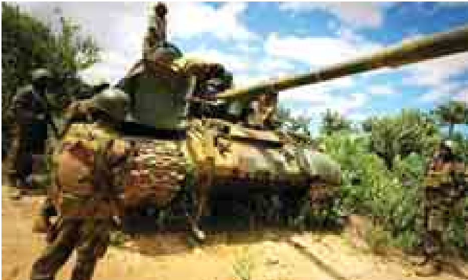
အေယူတပ်ဖွဲ့များ တောတွင်းလမ်းမှ ချီတက်နေကြစဉ်။