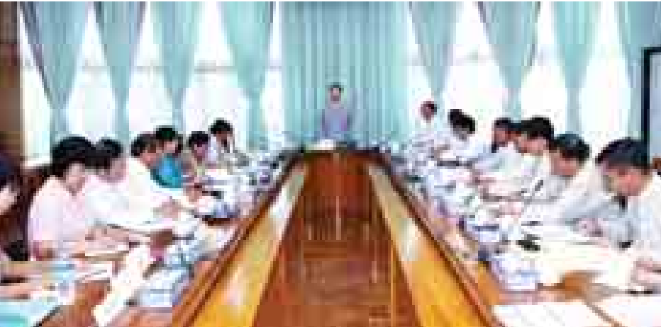
ထို့နောက် ငွေချေးသက်သေခံလက်မှတ်လုပ်ငန်း ကြီးကြပ်ရေးကော်မရှင်၏ (၁/၂၀၁၄)ကြိမ်မြောက် အစည်းအဝေးကို ဆက်လက်ကျင်းပရာ ကော်မရှင်ဥက္ကဋ္ဌ ဘဏ္ဍာရေးဝန်ကြီးဌာန ဒုတိယဝန်ကြီး ဒေါက်တာ

တို့မှ တာဝန်ရှိသူများနှင့် ပူးပေါင်းဆောင်ရွက်လျက်ရှိကြောင်း။ မြန်မာနိုင်ငံ၏ စီးပွားရေးဖွံ့ဖြိုးတိုးတက်မှုအတွက် အရင်းအနှီးဈေးကွက် ဖြစ်ထွန်းပေါ်ပေါက်လာရေးသည် အလွန်အရေးပါသည့်လုပ်ငန်းဖြစ်သဖြင့် လုပ်ငန်းအောင်မြင်ရေးကို ဦးတည်၍ ကော်မရှင်အနေဖြင့် သမာသမတ်ကျသော၊ ဘက်မလိုက်သော အများပြည်သူလေးစားယုံကြည်သော ကော်မရှင်အဖြစ် ဂုဏ်ယူစွာ ရပ်တည်နိုင်ရေးအတွက် မိမိတို့၏ အသိအမြင်၊ အတွေ့အကြုံများနှင့် ပေါင်းစပ်၍ ရဲရဲဝံ့ဝံ့ဆောင်ရွက်ကြစေလိုပါကြောင်း၊ မြန်မာနိုင်ငံတွင် စတော့အိတ်ချိန်းမရှိခဲ့သဖြင့် ယခုကဲ့သို့ စတော့အိတ်ချိန်းထူထောင်နိုင်မှုသည် နိုင်ငံအတွက် သမိုင်းမှတ်တိုင်တစ်ခုဖြစ်လာမည် ဖြစ်ပါကြောင်း၊ အခက်အခဲများနှင့် စိန်ခေါ်မှုများလည်း ရှိလာနိုင်မည်ဖြစ်၍ ကော်မရှင်အနေဖြင့် ဆက်စပ်ဌာနအဖွဲ့အစည်းများနှင့် ညှိနှိုင်းပေါင်းစပ်ဆောင်ရွက်သွားရန် လိုအပ်ပါကြောင်း၊ ဘဏ္ဍာရေးဝန်ကြီးဌာန အနေဖြင့်လည်း လိုအပ်သည်များကို ပေါင်းစပ်ညှိနှိုင်းပေးသွားမည်ဖြစ်ကြောင်း ပြောကြားသည်။