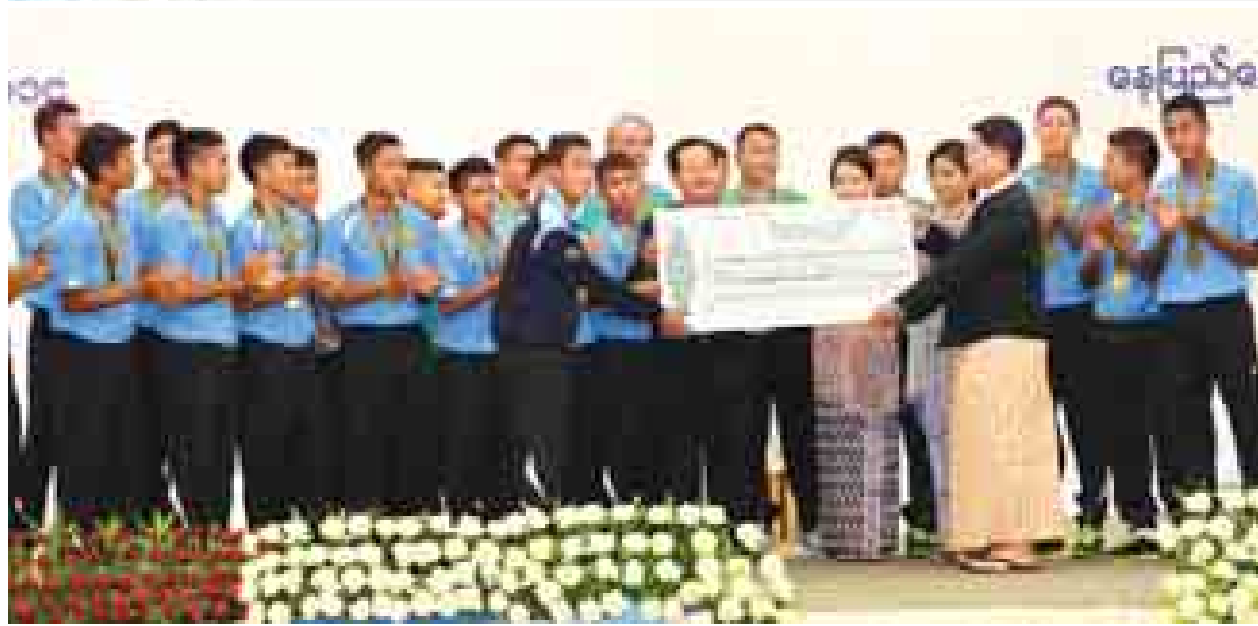
ပြည်ထောင်စုဝန်ကြီး ဦးတင့်ဆန်း အောင်ပွဲရမြန်မာ့လက်ရွေးစင် အသက်(၁၉)နှစ်အောက် ဘောလုံးအသင်းမှ အားကစားသမားများအတွက် ဂုဏ်ပြုဆုငွေ ပေးအပ်စဉ်။ (သတင်းစဉ်)

နိုင်ငံတော်သမ္မတ အနုပညာရှင်များ၊ ဖိတ်ကြားထားသည့် ညွှန်ကြားရေးမှူးချုပ်နှင့် တာဝန်ရှိသူများ တက်ရောက်ကြသည်။