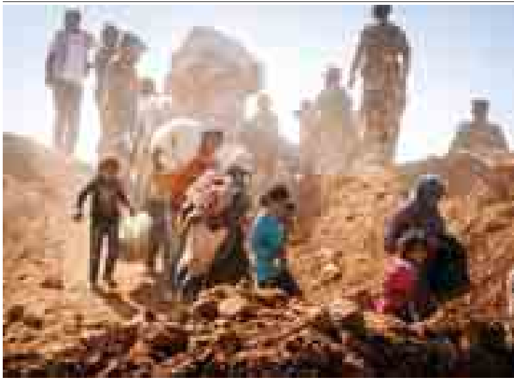
ဆီးရီးယားပြည်တွင်းစစ်ဘေးရှောင် ပြည်သူများ အိမ်နီးချင်းနိုင်ငံများသို့ တိမ်းရှောင်နေမှုအား တွေ့ရစဉ်။