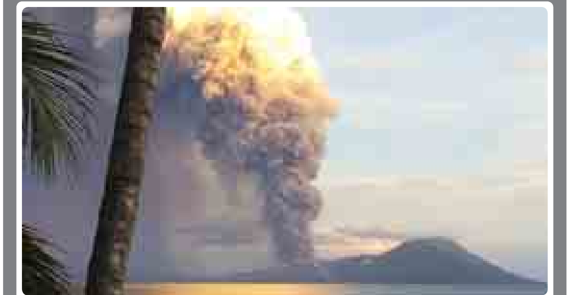
ပါပူဝါနယူးဂီနီနိုင်ငံမှ တာဘူရာဘူရာမီးတောင် ပေါက်ကွဲမှုအား တွေ့ရစဉ်။

ဆစ်ဒနီ ဩဂုတ် ၂၉ ပါပူဝါနယူးဂီနီနိုင်ငံ အရှေ့ဗြိတိန်ကျွန်းရှိ တာဘူရာဘူရာမီးတောင်၌ ဩဂုတ် ၂၉ရက်က မီးတောင်ပေါက်ကွဲကြောင်း မီးတောင် ပေါက်ကွဲပြီးနောက် ဒေသခံများအား မိမိတို့၏ နေအိမ်အမိုးအကာများအတွင်း၌သာ နေထိုင်ကြရန် ရဲတပ်ဖွဲ့က သတိပေးလိုက်ကြောင်း သတင်းတွင် ဖော်ပြသည်။ အဆိုပါ တာဘူရာဘူရာတောင်၌ ဒေသခံတော်ချိန် နံနက် ၃နာရီခန့်က မီးတောင်ပေါက်ကွဲခြင်းဖြစ်ကြောင်း မီးတောင်ပေါက်ကွဲ ရာမှ ကျယ်လောင်သော အသံကို ဒေသခံများကြားကြရကြောင်း မီးခိုးပြာများက ကောင်းကင်ယံ အမြင့်သို့ ထိုးတက်ရောက်ရှိသွားကြောင်း သတင်းတွင်ဖော်ပြသည်။ ယင်းပြာမှုန်များ ထူထပ်များပြားမှုကြောင့် ဩစတြေးလျမှ ပျံသန်းလာသည့် လေယာဉ်များအတွက် အနှောင့်အယှက်ဖြစ်စေ နိုင်ကြောင်း ဩစတြေးလျနိုင်ငံ ဒါဝင်မြို့တော်မှ အကြံပေးဌာနက ပြောကြားသည်။ လေယာဉ်များ ပျံသန်းမှုလမ်းကြောင်းအထိ ပြာများက ကမ္ဘာ့လေထုအတွင်း အမြင့်ပေ ၅၀၀၀၀ ထိ ရောက်ရှိလာနိုင်ကြောင်း မိုးလေဝသပညာရှင်က ပြောကြားသည်။ တာဘူရာဘူရာမီးတောင်သည် နိုင်ငံအရှေ့ပိုင်းရှိ နယူးဗြိတိန်ကျွန်းထိပ်ပိုင်းတွင် ရှိနေပြီး ၁၉၃၇၊ ၁၉၉၄၊ ၂၀၀၆ ခုနှစ်တို့က မီးတောင်ပေါက်ကွဲခဲ့ပြီး လွန်ခဲ့သည့်နှစ်ကလည်း ထပ်မံပေါက်ကွဲခဲ့သည်။ ဆင်ယွာ။