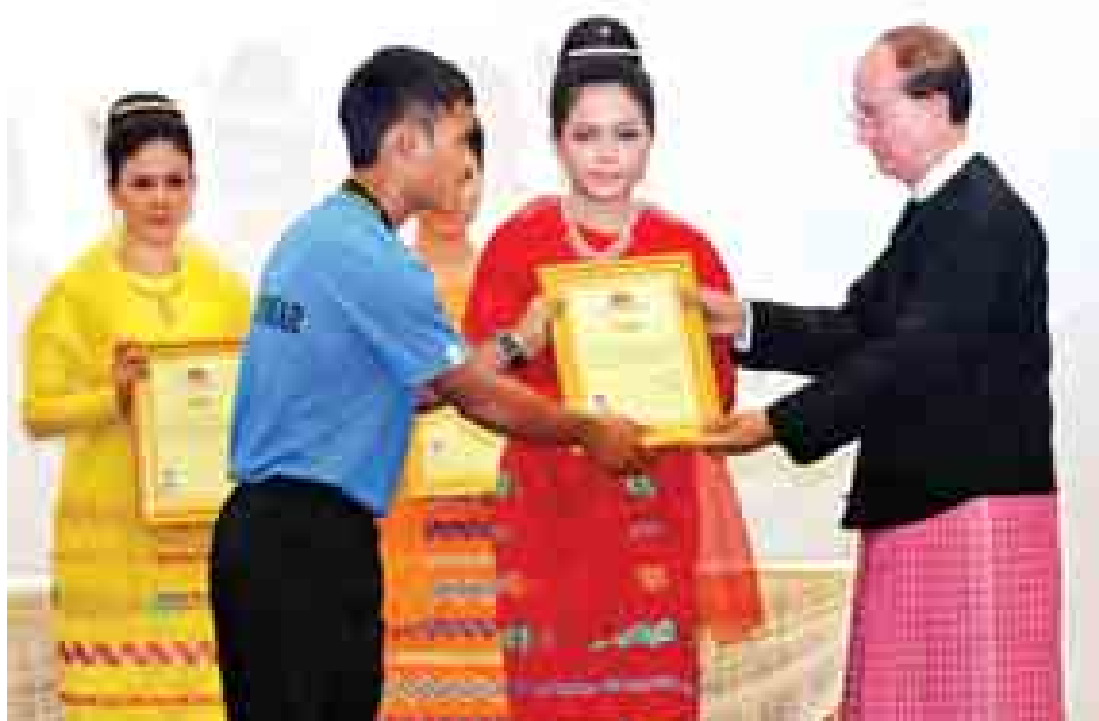
နိုင်ငံတော်သမ္မတ ဦးသိန်းစိန် အောင်ပွဲရမြန်မာ့လက်ရွေးစင် အသက်(၁၉)နှစ်အောက် ဘောလုံးအသင်းမှ အားကစားသမားများ အား ဂုဏ်ပြုပွဲတစ်ဖက်လွှာများ ပေးအပ်ချီးမြှင့်စဉ်။ (သတင်းစဉ်)

ပြသနိုင်ခဲ့သည်။ ဘရူနိုင်းဘုရင့်ဖလား ဘောလုံး ပြိုင်ပွဲသမိုင်းတွင် မြန်မာနိုင်ငံက ဒုတိယဆုကို နှစ်ကြိမ်ရရှိခဲ့ပြီး ယခုအကြိမ်တွင် အမြင့်ဆုံး ဆုဖလားအပြင် အသန်ရှင်းဆုံးဆုကိုပါ ပူးတွဲရရှိ ခဲ့သည်။ ဂုဏ်ပြုပွဲအခမ်းအနားသို့ ဒုတိယသမ္မတ ဦးညွှန်ထွန်း၊ ပြည်ထောင်စုလွှတ်တော်နာယက ပြည်သူ့လွှတ်တော်ဥက္ကဋ္ဌ သူရဦးရွှေမန်း၊ ဒုတိယ တပ်မတော်ကာကွယ်ရေးဦးစီးချုပ် ကာကွယ်ရေး ဦးစီးချုပ်(ကြည်း)ဒုတိယဗိုလ်ချုပ်မှူးကြီးစိုးဝင်း၊ ပြည်ထောင်စုဝန်ကြီးများ၊ ဒုတိယဝန်ကြီးများ၊ မြန်မာနိုင်ငံဘောလုံးအဖွဲ့ချုပ်ဥက္ကဋ္ဌ ဦးဇော် ဇော်နှင့် အဖွဲ့ဝင်များ၊ နည်းပြနှင့် အသင်းအုပ်ချုပ် သူများ၊ အောင်ပွဲရ မြန်မာ့လက်ရွေးစင် အသက် (၁၉)နှစ်အောက် ဘောလုံးအသင်းမှ အားကစား သမားများ၊ စာမျက်နှာ ၃ ကော်လံ ၁ သို့