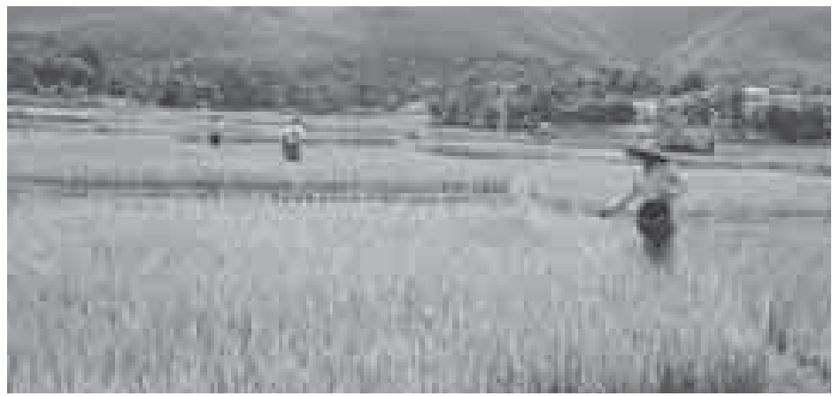
ရောစပ်၍ ကြိုပက်ခဲ့ကြောင်း၊ ပုလဲဓာတ်မြေဩဇာကို မြေဆွေးမြေဩဇာနှင့်အတူ ရောစပ်၍ ကြိုပက်မှသာ အပင်အတွက် အကျိုးများကြောင်း မြို့

စိုက်ပျိုးပြီး ၁၄ ရက်သားရှိ ပုလဲသွယ်စပါးပင်များ အပင်အာဟာရ အပြည့်အဝရရှိစေရန်နှင့် မြေဩဇာကို အကျိုးရှိရှိ အသုံးပြုနိုင်ရန်အတွက် ယခုလို ဆောင်ရွက်ခြင်းဖြစ်ကြောင်း၊ တစ်ဧကလျှင် မြေဆွေး သုံးဆ၊ ပုလဲဓာတ်မြေဩဇာတစ်ဆကို အချိုးကျ