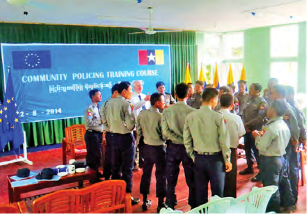
ရန်ကုန်မြောက်ပိုင်းခရိုင် အင်းစိန်မြို့နယ် မြို့နယ်ရဲတပ်ဖွဲ့မှူးမှူး အစည်း အဝေးခန်းမတွင် ဩဂုတ် ၂၂ ရက် နံနက်ပိုင်းက ပြည်သူ့ပုဂ္ဂိုလ်ရေးအဖွဲ့ဝင်များနှင့် ဆင့်ပွားသင်တန်းပြုလုပ်ခဲ့သည်။ ယင်းပြည်သူ့ပုဂ္ဂိုလ်ရေးအဖွဲ့ဝင်များနှင့် ဆင့်ပွား သင်တန်းဆင်းပွဲတွင် မြောက်ပိုင်းခရိုင်ရဲတပ်ဖွဲ့မှူး ဒုတိယရဲမှူးကြီးမြင့်လွင်နှင့် EU ကိုယ်စားလှယ် Mr.David Hamilton တို့က သင်တန်းဆင်းအမှာစကား ပြောကြားပြီး သင်တန်းသားများအား သင်တန်းဆင်းလက်မှတ်နှင့် အမှတ်တရ လက်ဆောင်ပစ္စည်းများ ပေးအပ်ခဲ့ကြကြောင်း သိရသည်။ (ဇော်)