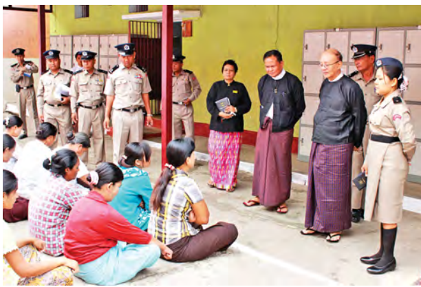
မတရားပြုမှု ရှိ၊ မရှိ၊ ဥပဒေပါ လိုအပ်သည်တို့ကို မှာကြားခဲ့ကြောင်း အခွင့်အရေးများရရှိခြင်း ရှိ၊ မရှိတို့နှင့် စစ်လျဉ်း၍ ကြည့်ရှုစစ်ဆေးကာ (ကြေးမုံ)

ချောင်ချိမှု ရှိ၊ မရှိ၊ သန့်ရှင်းမှု ရှိ၊ မရှိ၊ စားသောက်ရာတွင် အာဟာရသင့်တင့် မျှတမှု ရှိ၊ မရှိ၊ ကျန်းမာရေးပြည့်စုံမှု ရှိ၊ မရှိ၊ မကျန်းမာပါက ဆေးကုသရန် အခွင့်အရေး ရှိ၊ မရှိ၊ အမျိုးသမီး အကျဉ်းသားများအား အကာအရံ လုံခြုံစွာထားရှိခြင်း၊ အမျိုးသမီးအဖော် အစောင့်အရှောက်ဖြင့် ထားရှိခြင်းများ ရှိ၊ မရှိ၊ အကျဉ်းသားများနှင့် အချုပ် တရားခံများအပေါ် နှိပ်စက်ညှဉ်းပန်းမှု