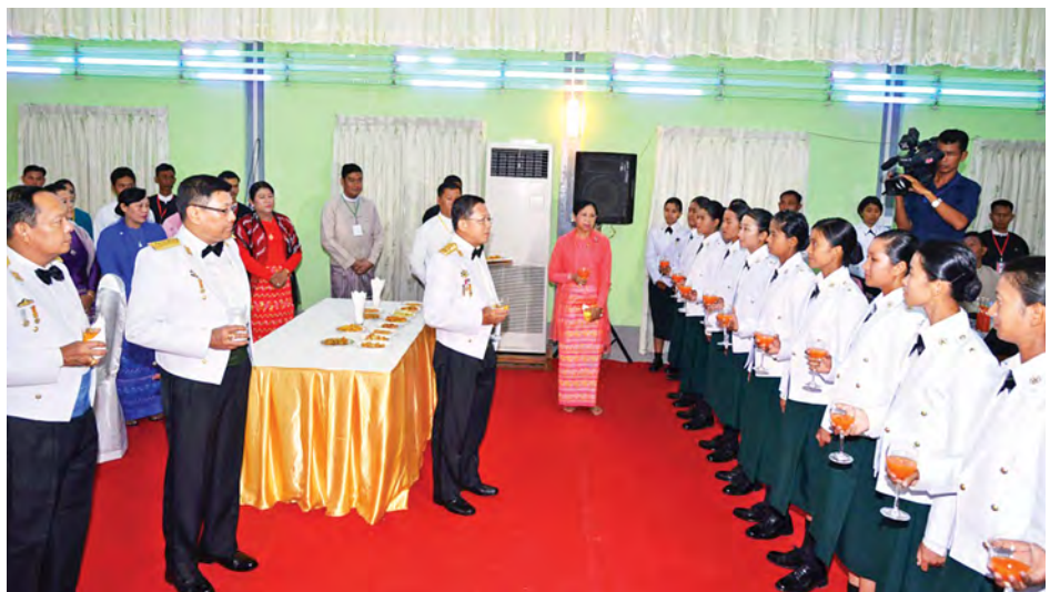
တပ်မတော်ကာကွယ်ရေးဦးစီးချုပ် ဗိုလ်ချုပ်မှူးကြီး သရေစည်သူ မင်းအောင်လှိုင်နှင့်ဇနီးတို့ ကျောင်းဆင်းအရာရှိ များအား တစ်ဦးချင်း ရင်းရင်းနီးနီးလိုက်လံနှုတ်ဆက်ပြီး အားပေးစကားပြောကြားစဉ်။ (မြဝတီ)

နေပြည်တော် ဩဂုတ် ၂၈ တပ်မတော်(ကြည်း) ဗိုလ်သင်တန်း ကျောင်း ဘွဲ့ရအမျိုးသမီးဗိုလ်လောင်း သင်တန်း အမှတ်စဉ် (၁)သင်တန်း ဆင်း ဂုဏ်ပြုညစာစားပွဲအခမ်းအနား ကို ယနေ့ညနေ ၆ နာရီတွင် မှော်ဘီမြို့ တပ်မတော်(ကြည်း) ဗိုလ်သင်တန်း ကျောင်း၌ ကျင်းပရာ တပ်မတော် ကာကွယ်ရေးဦးစီးချုပ် ဗိုလ်ချုပ် မှူးကြီး သရေစည်သူမင်းအောင်လှိုင် တက်ရောက်ချီးမြှင့်သည်။ အဆိုပါသင်တန်းဆင်း ဂုဏ်ပြု ညစာစားပွဲအခမ်းအနားသို့တပ်မတော် ကာကွယ်ရေးဦးစီးချုပ်၏ ဇနီး ဒေါ်ကြူကြူလှ၊ တပ်မတော်အရာရှိ ကြီးများနှင့် ဇနီးများ၊ ဖိတ်ကြားထား သည့် ဧည့်သည်တော်များ၊ ကျောင်း ဆင်းအရာရှိများ၏ မိဘဆွေမျိုးများ တက်ရောက်ကြသည်။ ရှေးဦးစွာ တပ်မတော်ကာကွယ်ရေး ဦးစီးချုပ်နှင့်ဇနီးတို့က ကျောင်းဆင်း အရာရှိများအား တစ်ဦးချင်း ရင်းရင်း နီးနီး လိုက်လံနှုတ်ဆက်ပြီး အားပေး