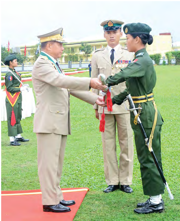
တပ်မတော်ကာကွယ်ရေးဦးစီးချုပ် ဗိုလ်ချုပ်မှူးကြီး သရေစည်သူ မင်းအောင်လှိုင် အကောင်းဆုံးဗိုလ်လောင်းဆုရရှိသူ ဗိုလ်လောင်းအမှတ် (၈၂) ဗိုလ်လောင်း လေးနွယ်ထွန်းအား ဆုပေးအပ်ချီးမြှင့်စဉ်။

တပ်မတော်၏ နောက်ထပ်အဓိကလုပ်ငန်းတာဝန်ကြီးတစ်ခုမှာ ပြည်သူ့အကျိုးပြုလုပ်ငန်းတာဝန်ပင်ဖြစ်ကြောင်း၊ တပ်မတော်သည် နိုင်ငံတော် တွင်အရေးကြီးလာသည့်အခါတိုင်း ရှေ့တန်းက အမြဲတမ်းမားမားမတ်မတ်ရပ် တည်ခဲ့ကြောင်း၊ သဘာဝဘေးအန္တရာယ်များ ကျရောက်ခဲ့သည့်အချိန်တွင်လည်း တပ်မတော်သားတွေကသာ အရင်ဆုံးရောက်ရှိကူညီခဲ့ကြခြင်းဖြစ်ကြောင်း၊ ယင်းသည် တပ်မတော်၏ အလွန်မြန်မြန်ပြည်သူ့အကျိုးပြုလုပ်ငန်းတာဝန် ကို ထမ်းဆောင်နေခြင်းပင်ဖြစ်ကြောင်း၊ ယနေ့အချိန်တွင်လည်း တပ်မတော် သည် နိုင်ငံတစ်ဝန်းသွားလာမှု ခက်ခဲသည့်နေရာများအထိ ရောက်ရှိပြီး ဆေးကုသပေးမှုများအပါအဝင် ဒေသဖွံ့ဖြိုးတိုးတက်ရေးအတွက် ပြည်သူ့ အကျိုးပြုလုပ်ငန်းတာဝန်များကို ထမ်းဆောင်ပေးလျက်ရှိကြောင်း၊ ထို့ကြောင့်