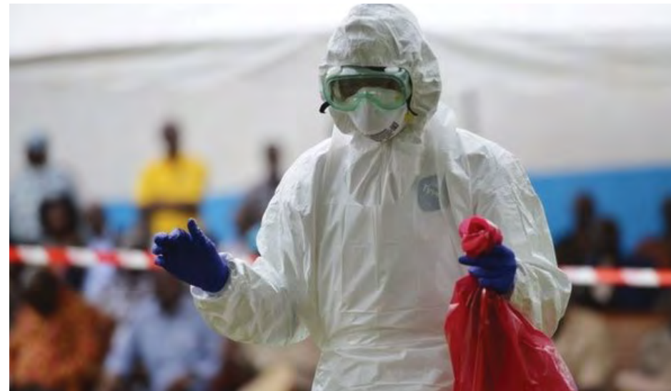
နိုင်ဂျီးရီးယားနိုင်ငံမှ အီဘိုလာရောဂါကူးစက်မှု ကာကွယ်ရေးမြင်ကွင်း။

ကမ္ဘာ့ကျန်းမာရေးအဖွဲ့ ဒဗလျူအိတ်ချ်အိုက် ခန့်မှန်းသတ်မှတ်ရာတွင် ရောဂါလက္ခဏာပြ လူနာဦးရေသည် ၂၀၀၀၀ကျော်ထက် ပိုလွန်ဖွယ်ရှိမည်ဟု ဆိုသည်။ ဘီဘီစီ။