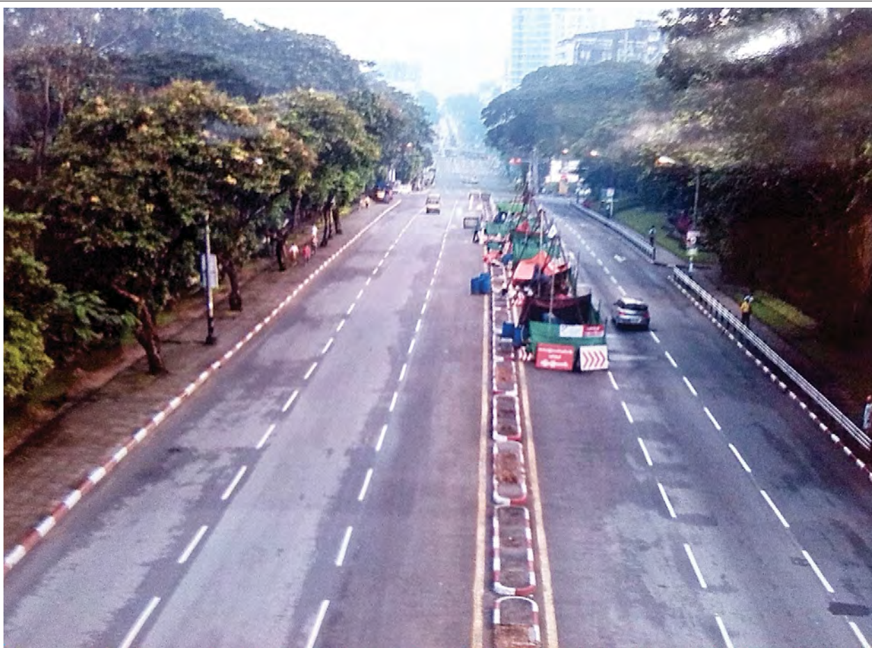
ရန်ကုန်အနောက်ပိုင်းခရိုင် စမ်းချောင်းမြို့နယ် ပြည်လမ်းနှင့်ဟားကရာလမ်းဆုံ၊ ပြည်လမ်းနှင့်ရှင်စောပုလမ်းဆုံရာတို့ကို ကျော်ဖြတ်၍ မိုးပျံခုံးကျော် တံတားတည်ဆောက်မည့်လုပ်ငန်းစတင်နေသည်ကို တွေ့ရစဉ်။