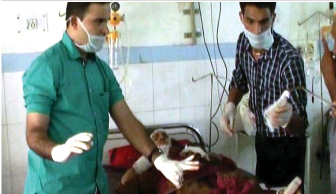
ကာမာလာ ဆေးကုသမှု ခံယူနေစဉ်